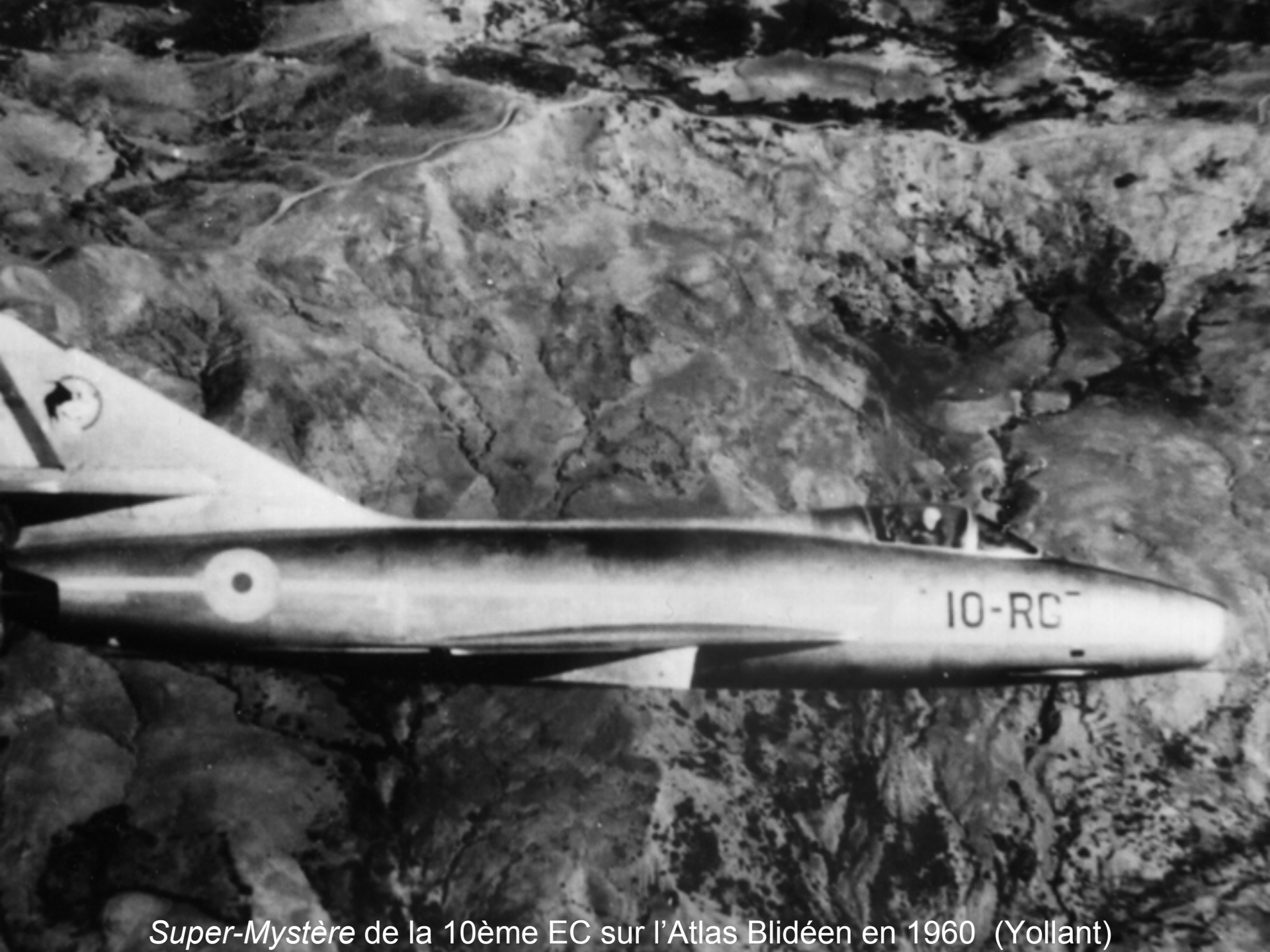
Super-Mystère de la 10ème EC sur l'Atlas Blidéen en 1960 (Yollant)