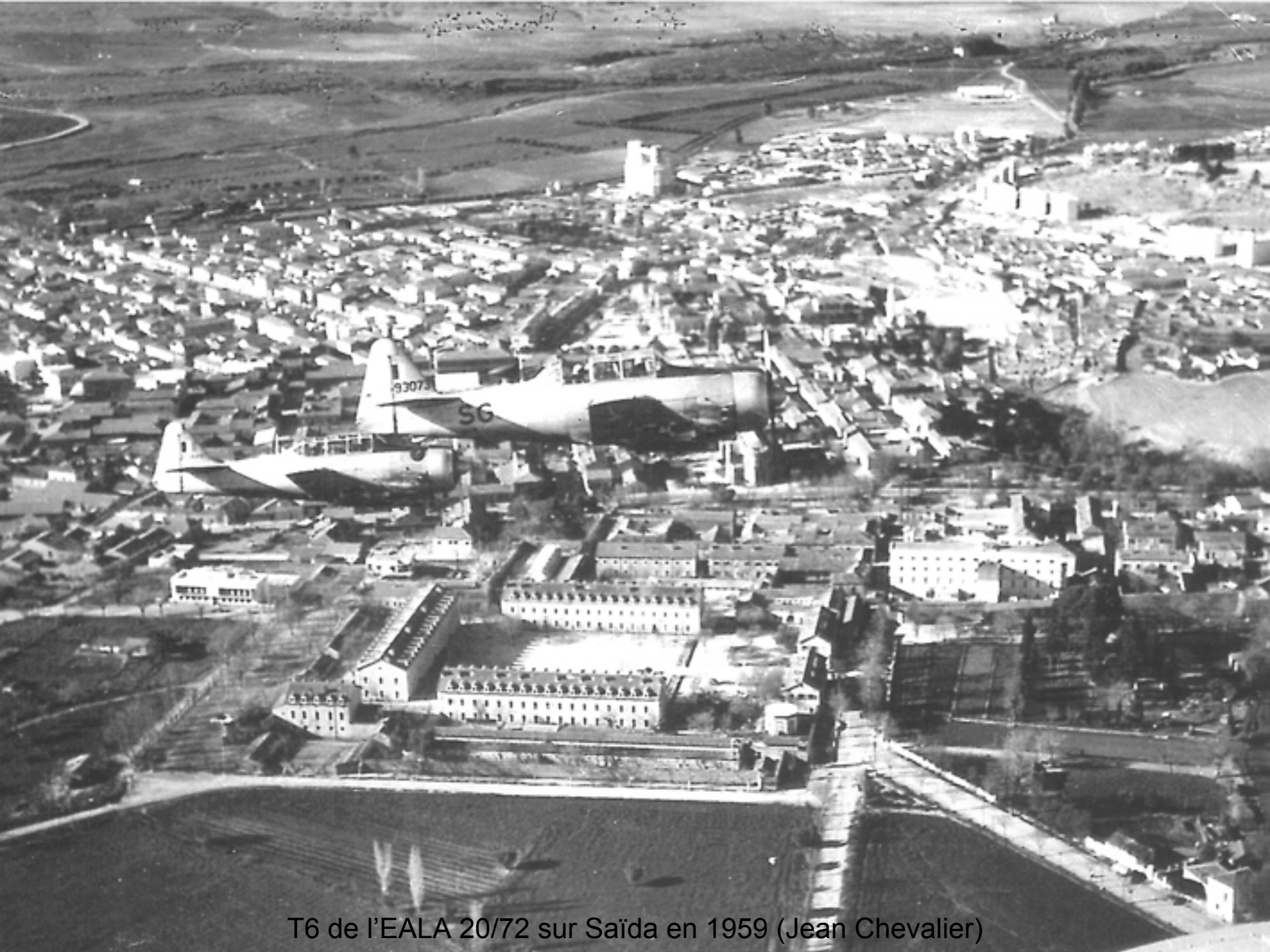
T6 de l'EALA 20/72 sur Saïda en 1959 (Jean Chevalier)