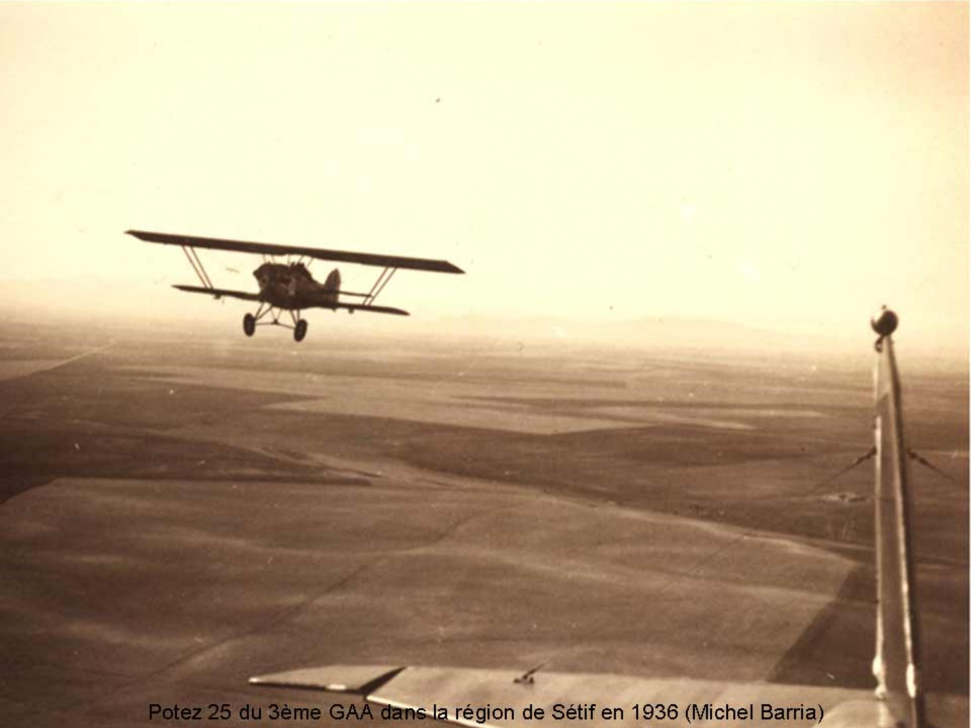
Potez 25 du 3ème GAA dans la région de Sétif en 1936 (Michel Barria)