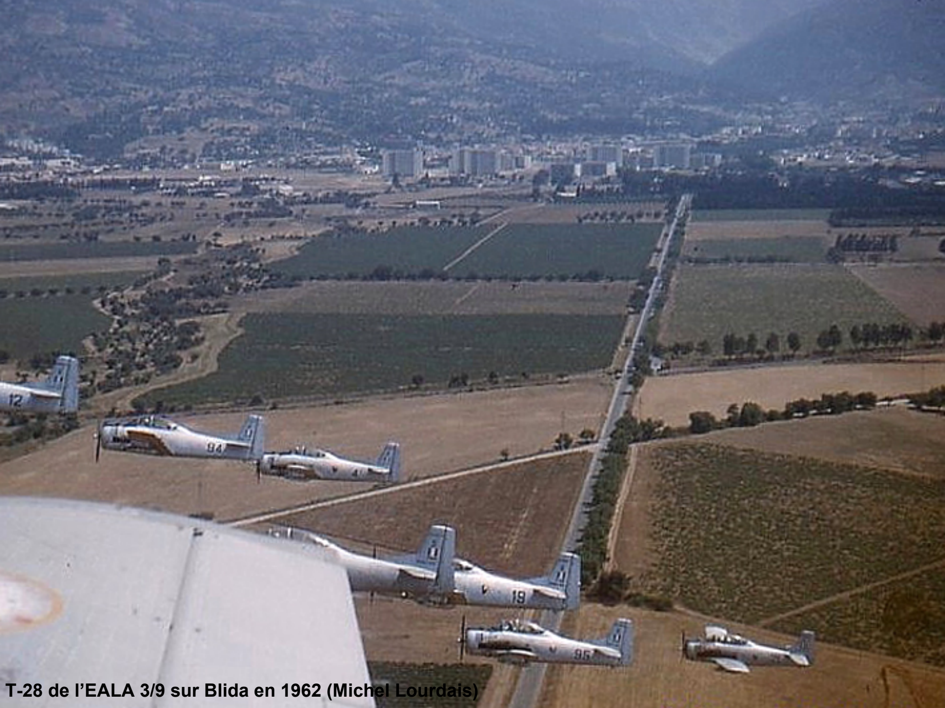
T-28 de l'EALA 3/9 sur Blida en 1962 (Michel Lourdais)