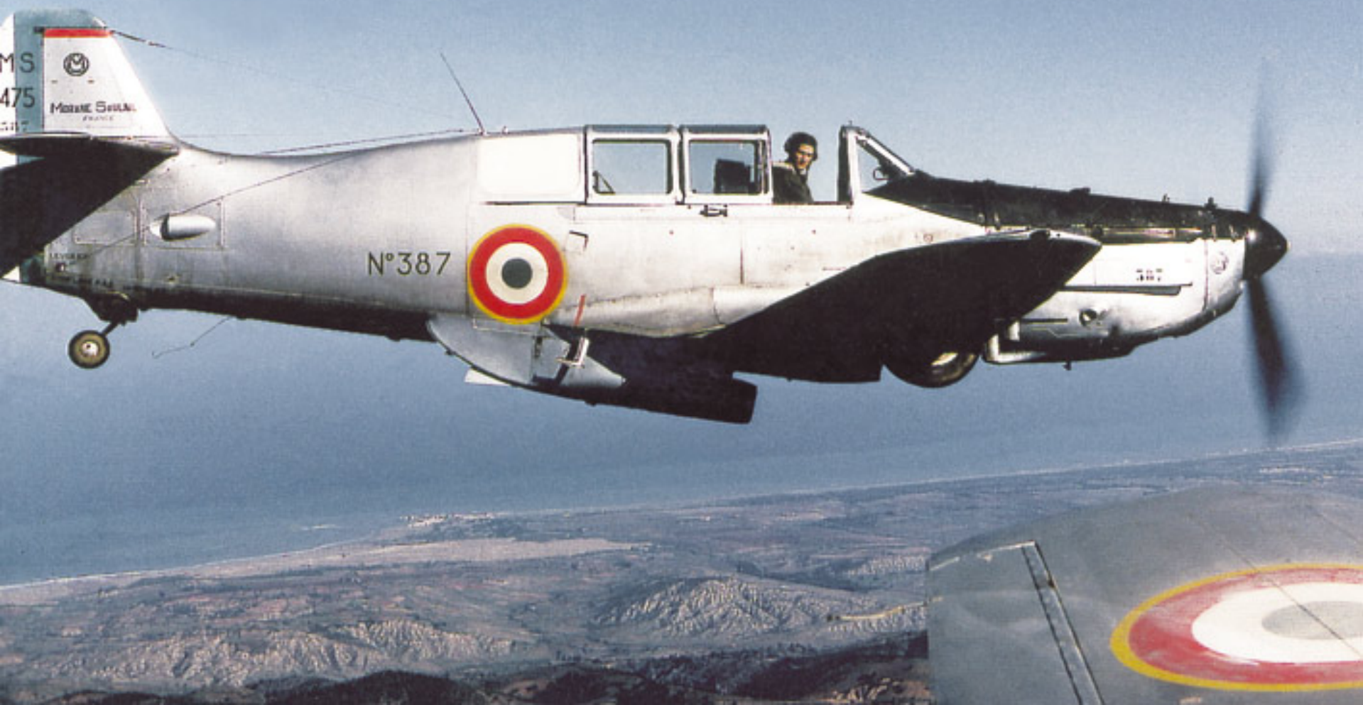
Vanneau du CER 305 sur la côte algéroise en 1954 (Henri Torres)