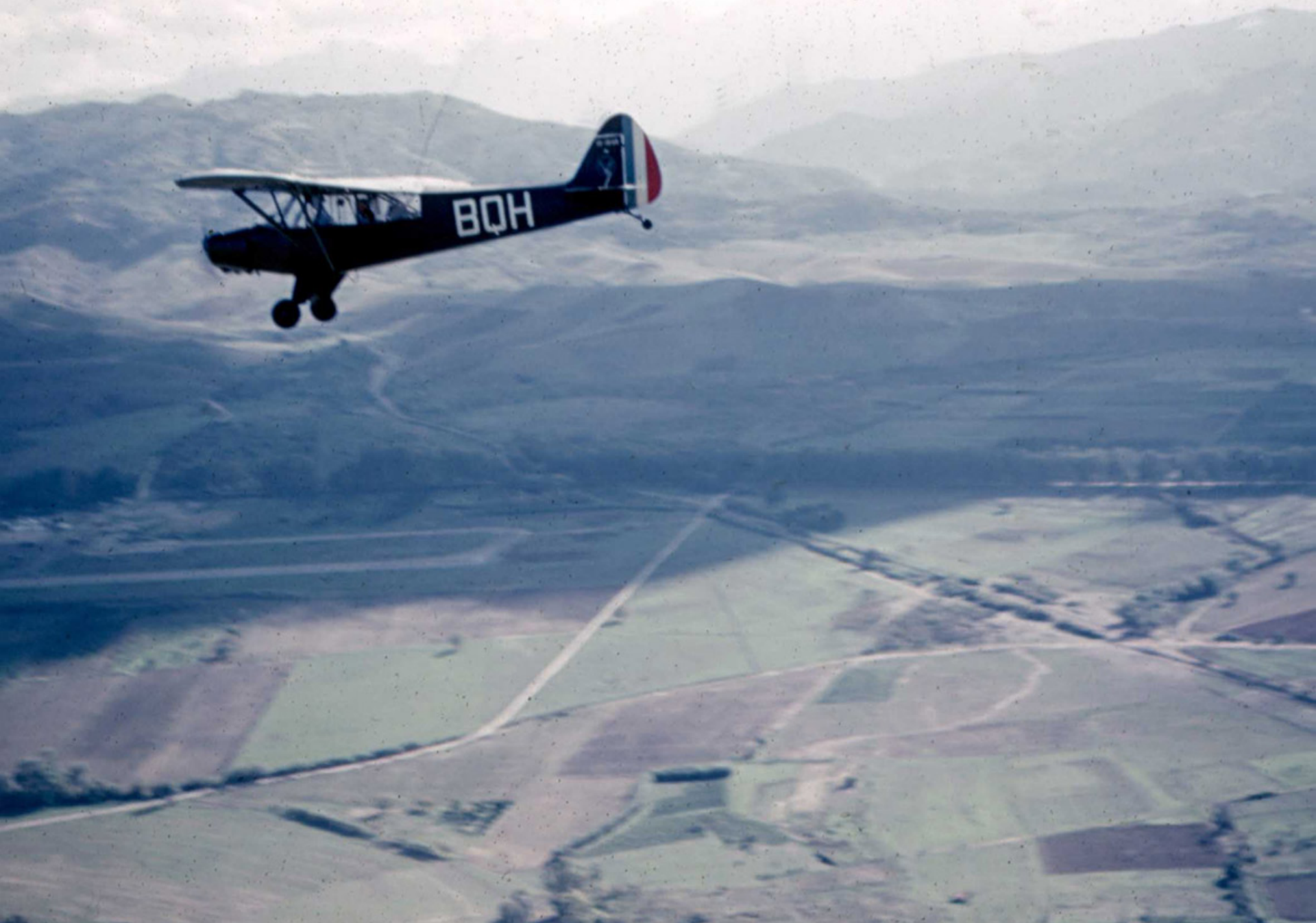
L-18 du PMAH 27ème DIA sur l'aérodrome de Tizi-Ouzou en 1961 (Jean-Yves Grillon)