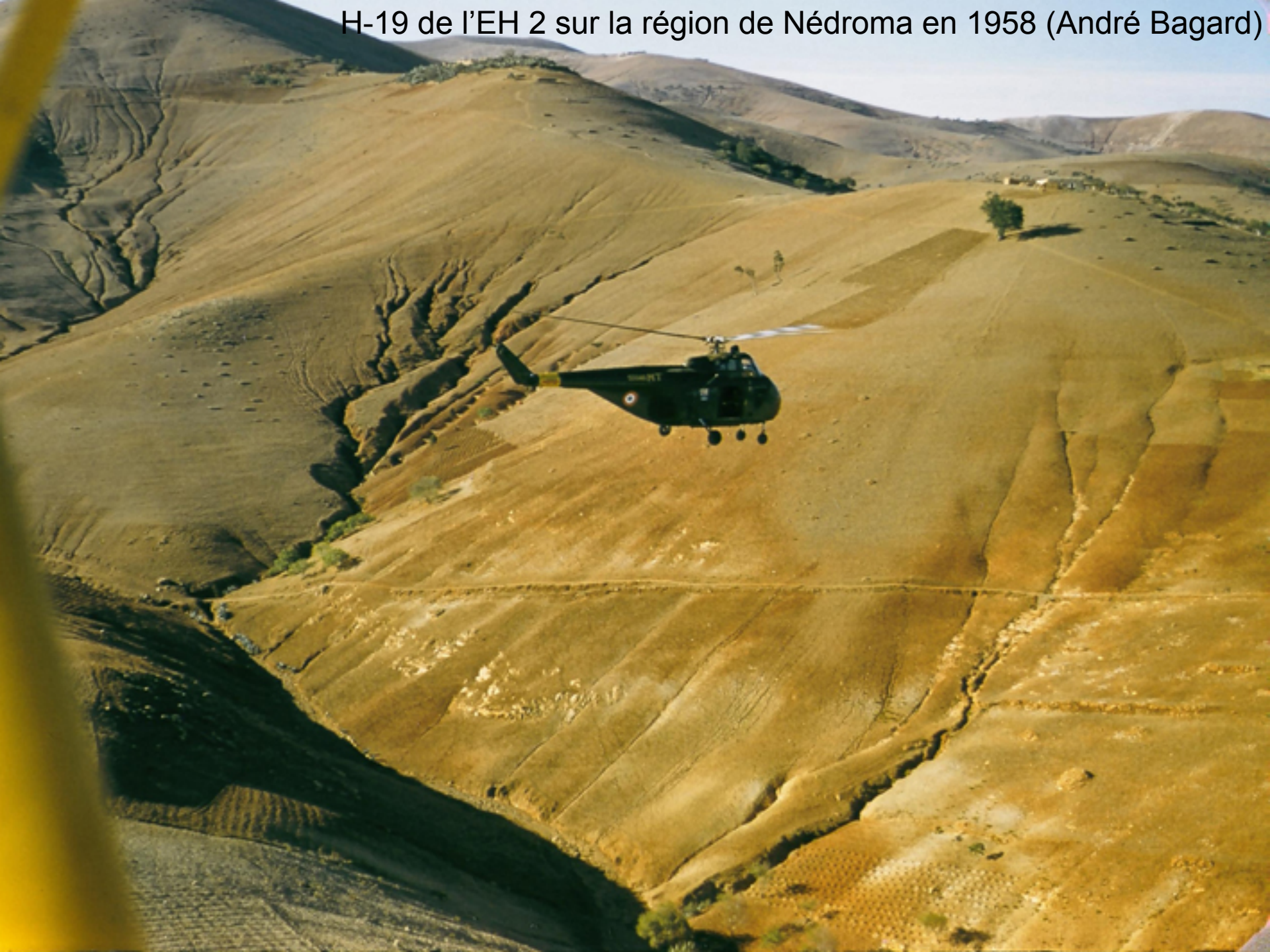
H-19 de l'EH 2 sur la région de Nédroma en 1958 (André Bagard)