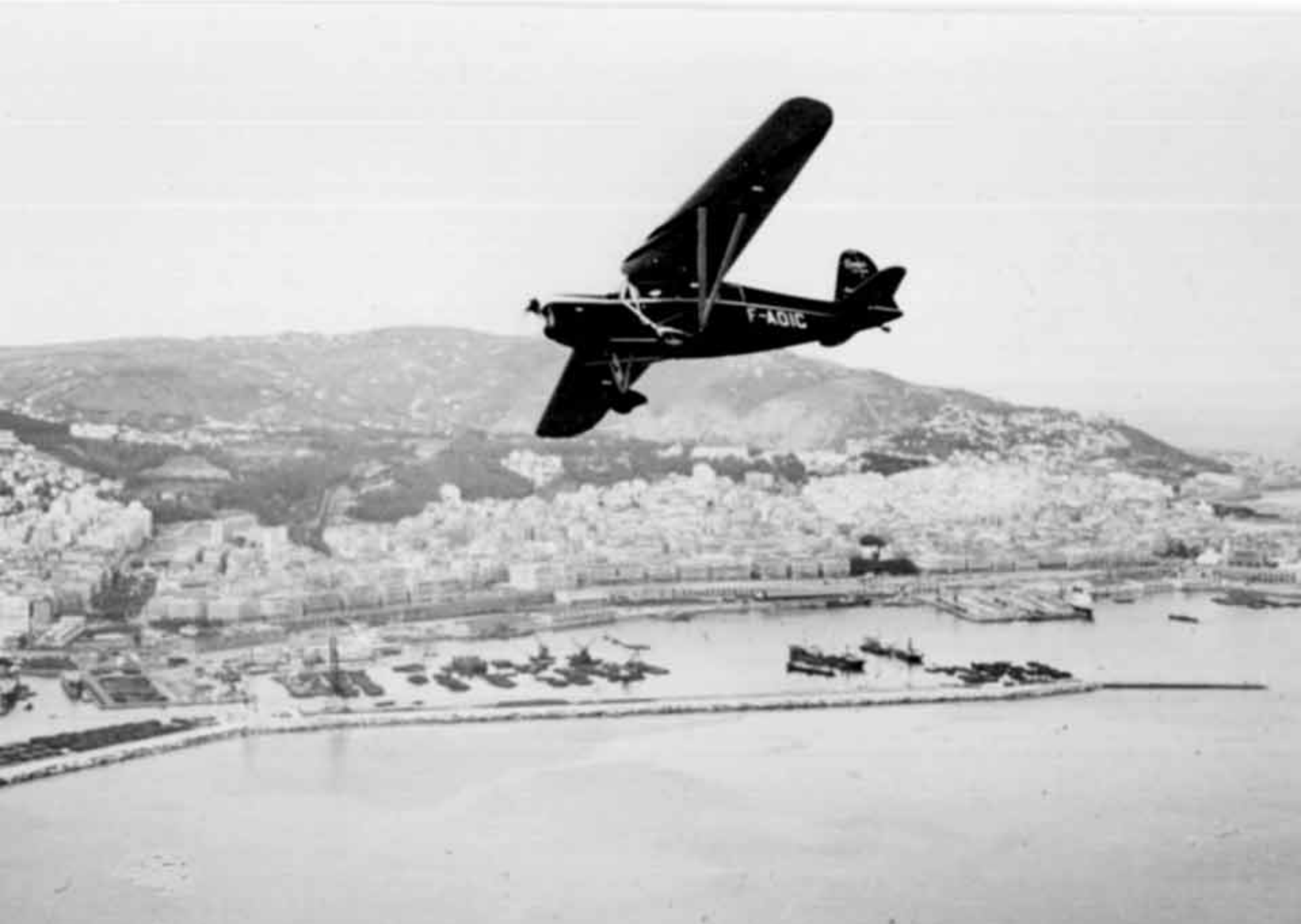
Caudron Phalène de l'Aéro-club d'Algérie sur la baie d'Alger en 1936 (Pierre Durafour)