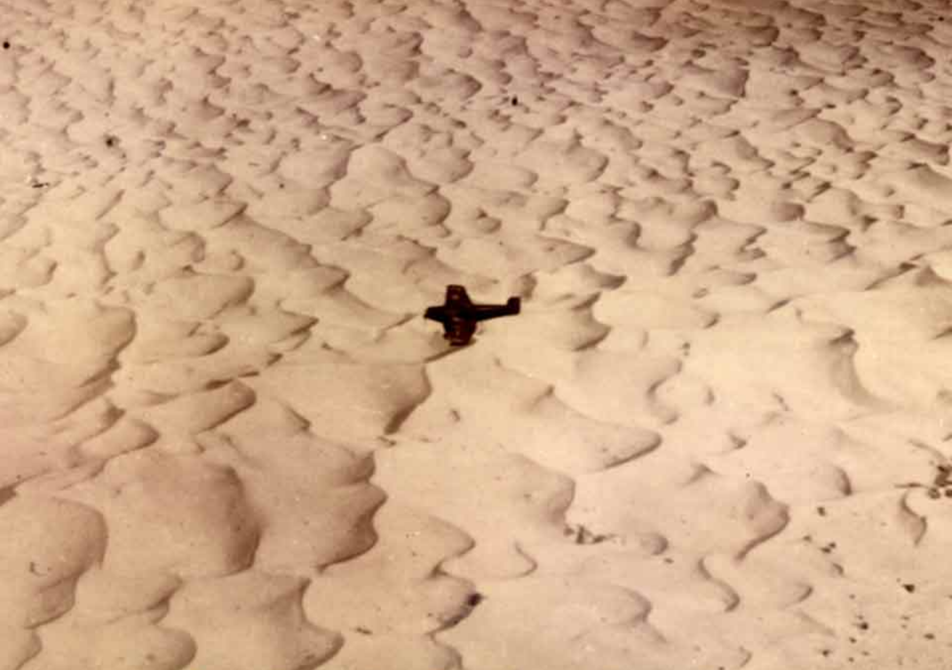
Farman 231 sur le Grand Erg Oriental en 1936 (Michel Barria)