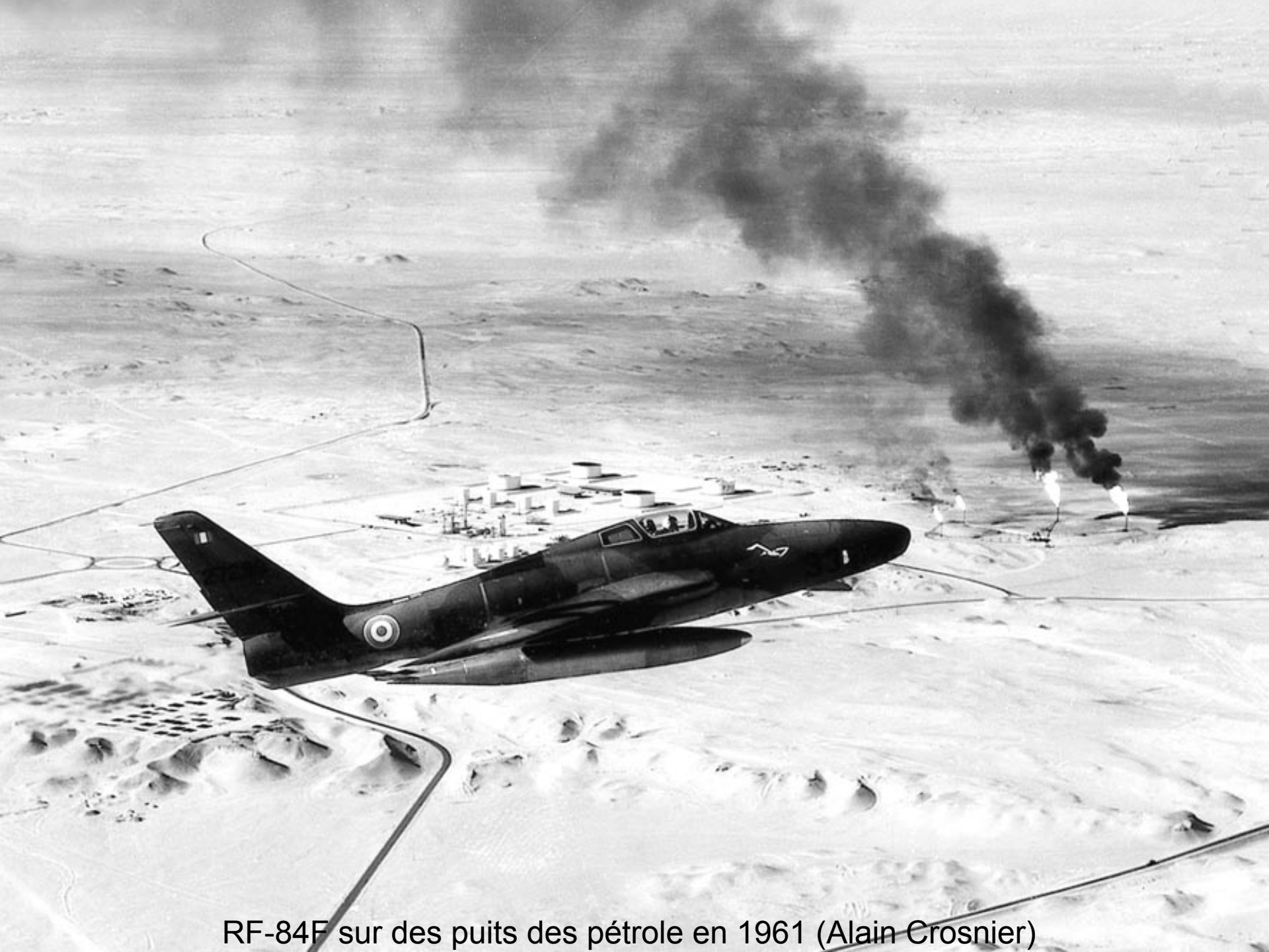
RF-84F sur des puits des pétrole en 1961 (Alain Crosnier)