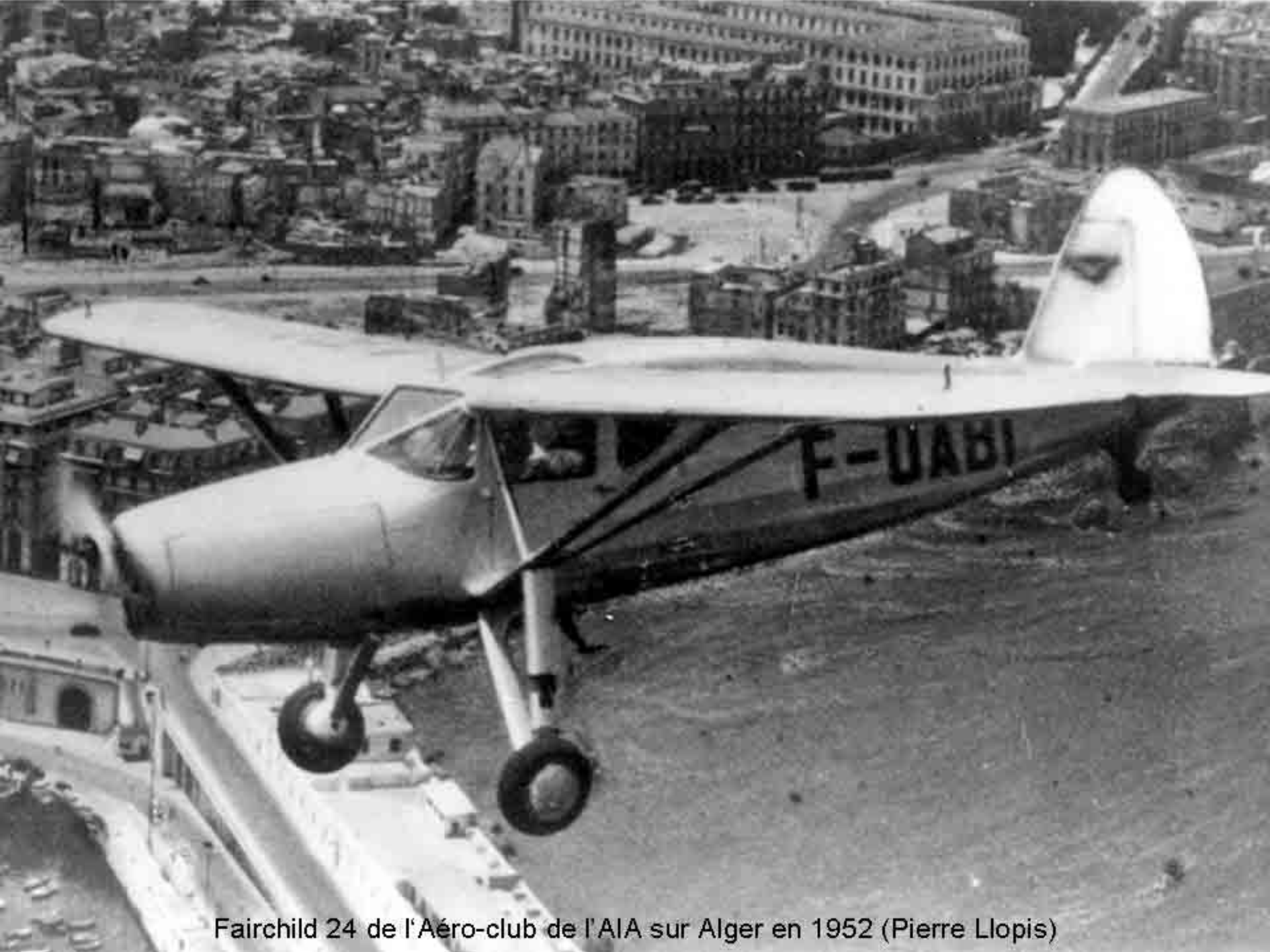
Fairchild 24 de l'Aéro-club de l'AIA sur Alger en 1952