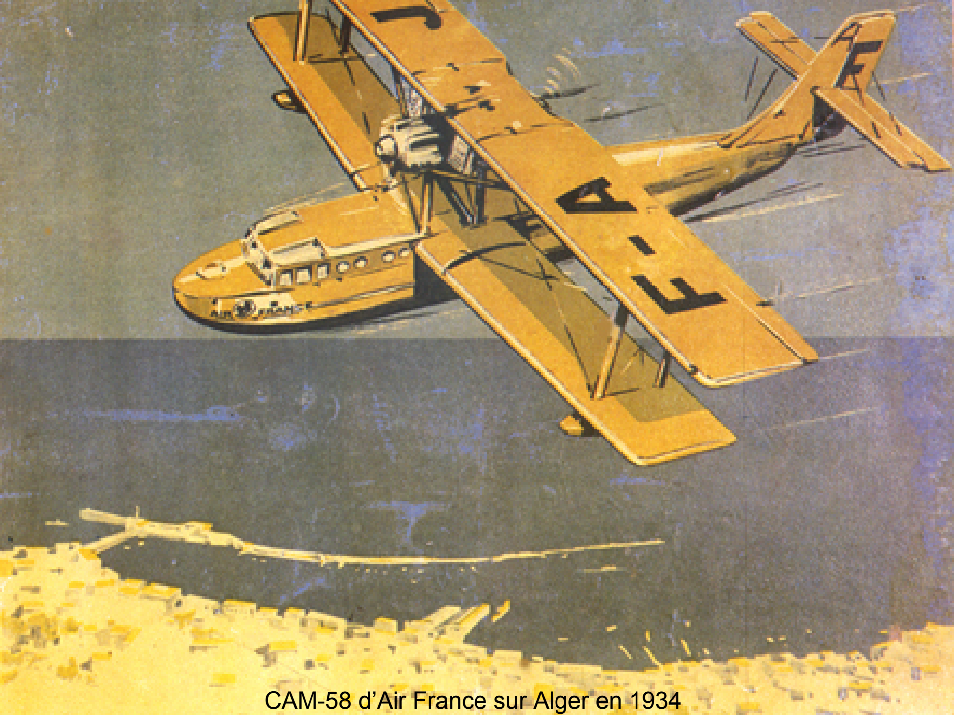
CAM-58 d'Air France sur Alger en 1934