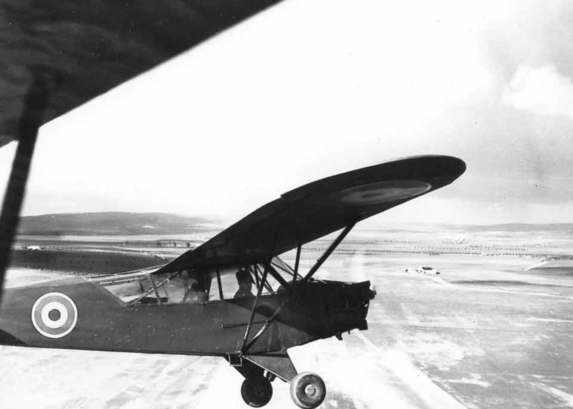
Piper L4 du CFSOA à Lourmel en 1943 (Alain Crosnier)