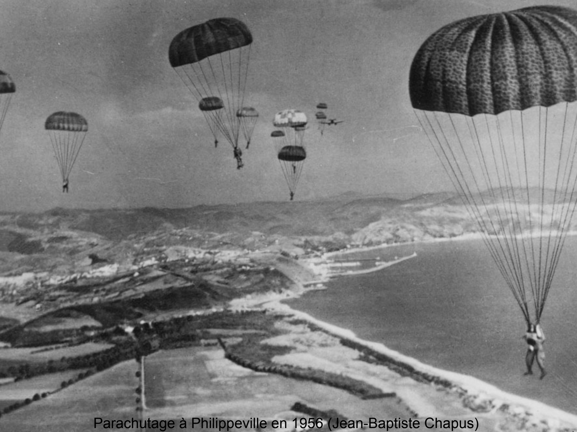
Parachutage à Philippeville en 1956 (Jean-Baptiste Chapus)