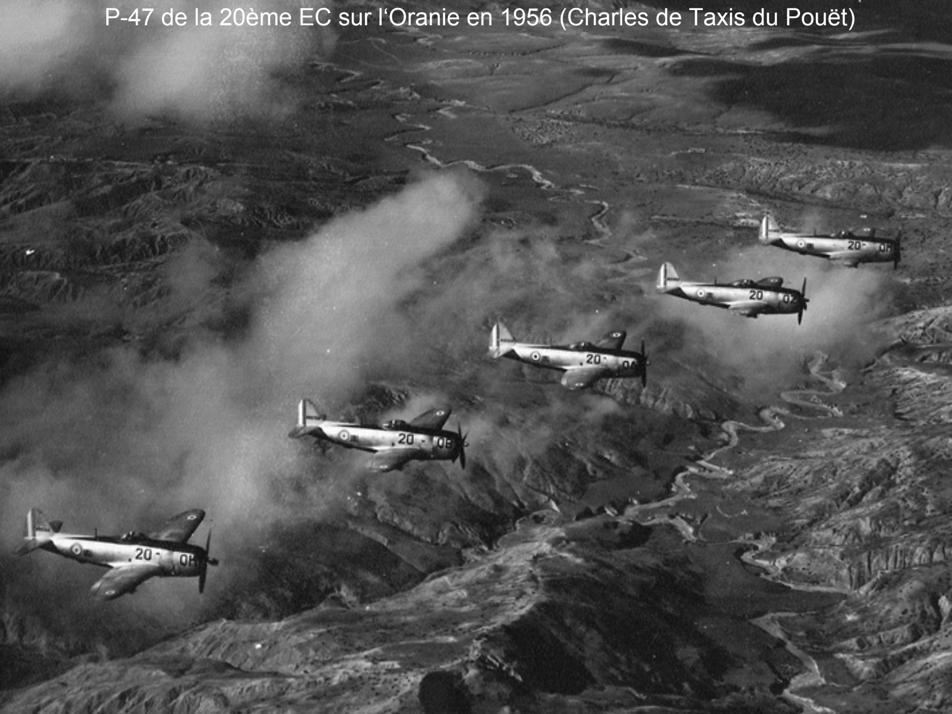
P-47 de la 20ème EC sur l'Oranie en 1956 (Charles de Taxis du Pouët)