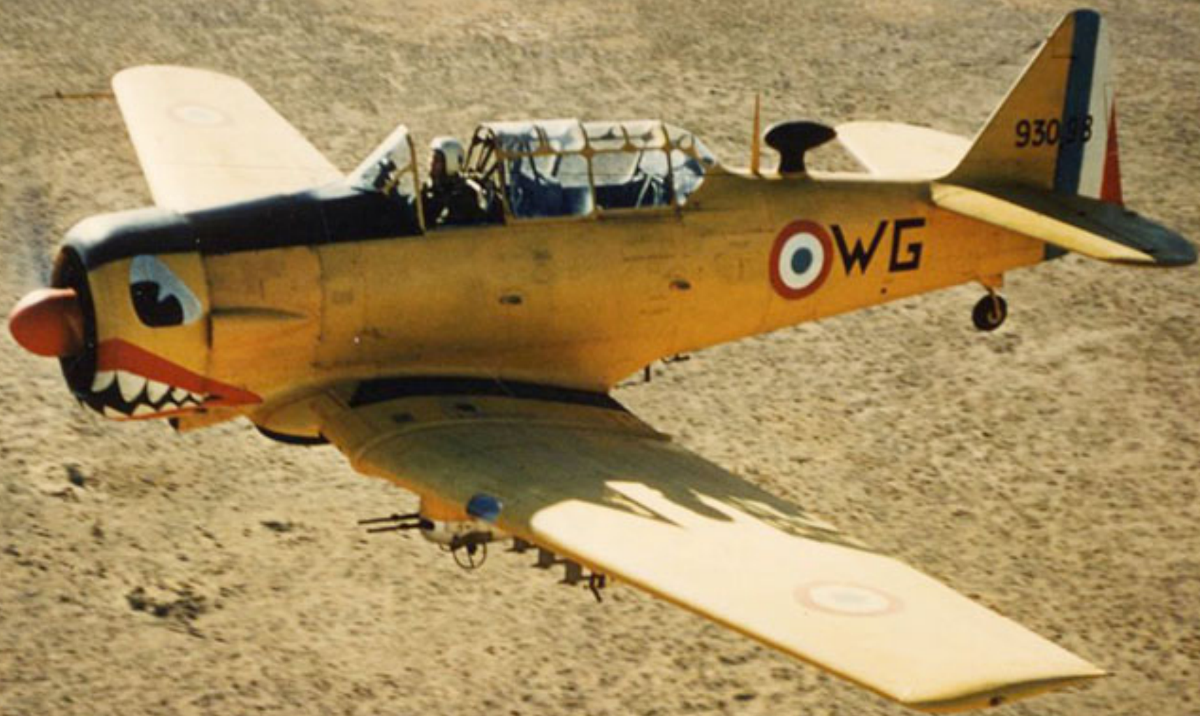
T-6 de l'EALA 13/72 sur la région de Paul-Cazelles en 1957 (Vincent Lassus)