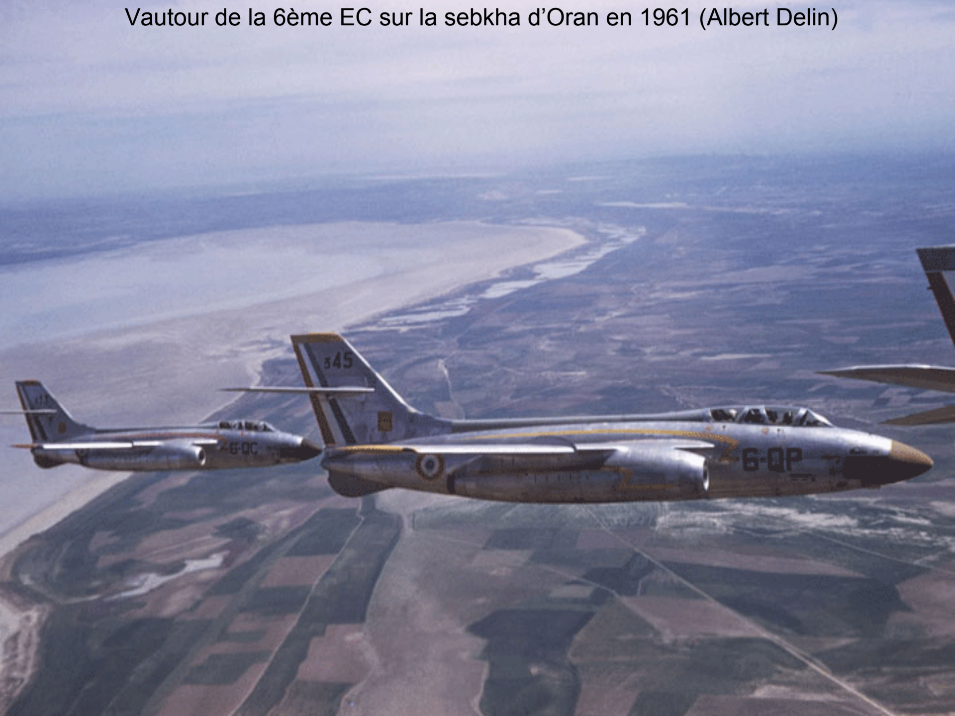
Vautour de la 6ème EC sur la sebkha d'Oran en 1961 (Albert Delin)