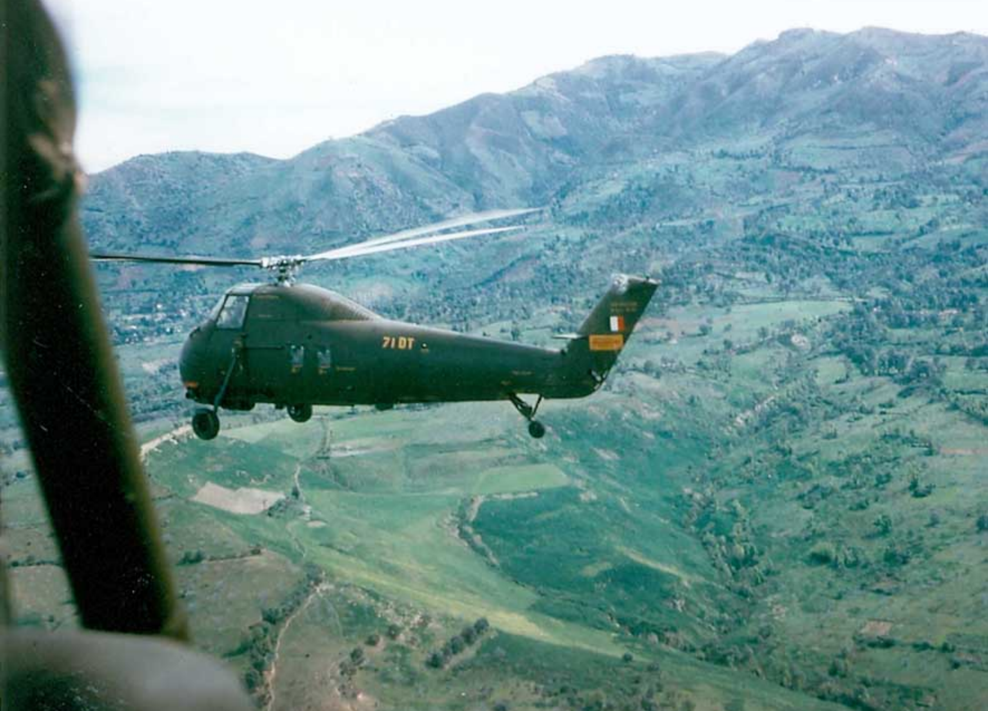
H-34 de l'EH3 sur la région de Tizi-Ouzou en 1961 (Gérard Wittemer)