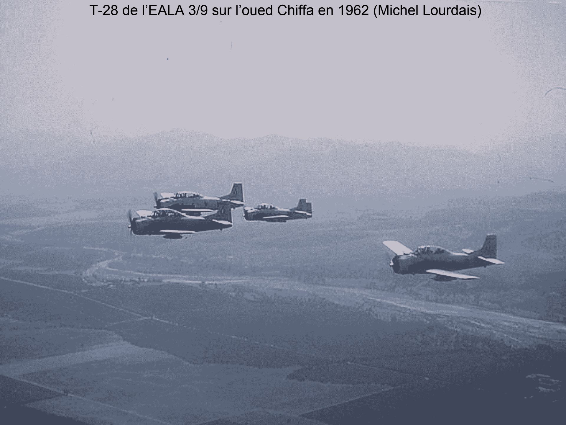
T-28 de l'EALA 3/9 sur l'oued Chiffa en 1962 (Michel Lourdais)