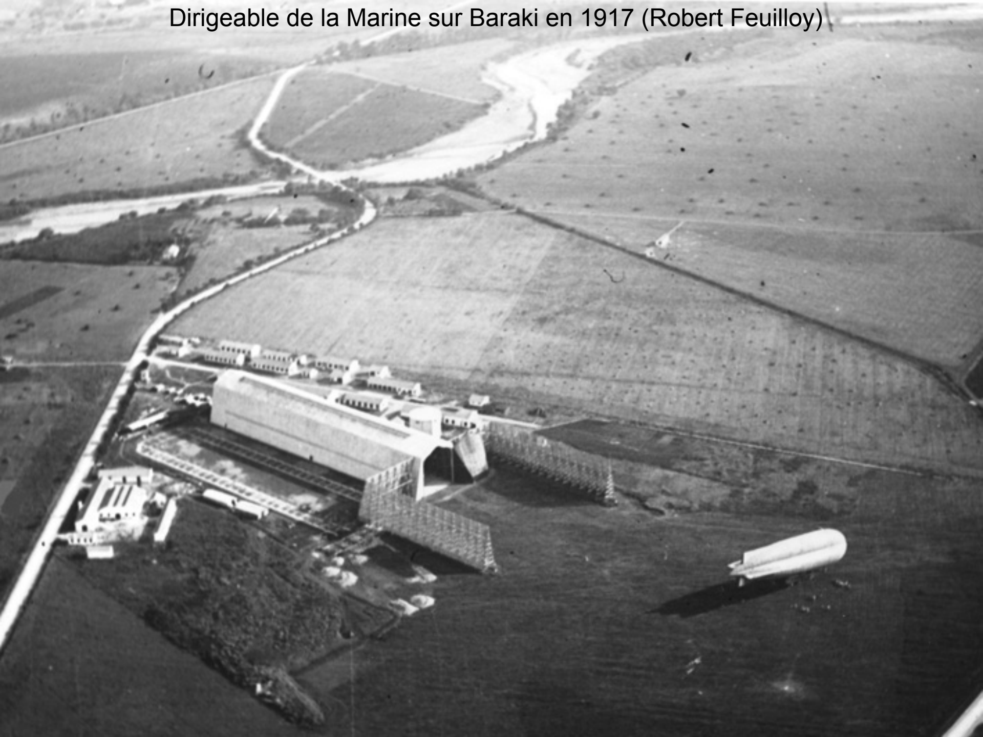
Dirigeable de la Marine sur Baraki en 1917 (Robert Feuillo)