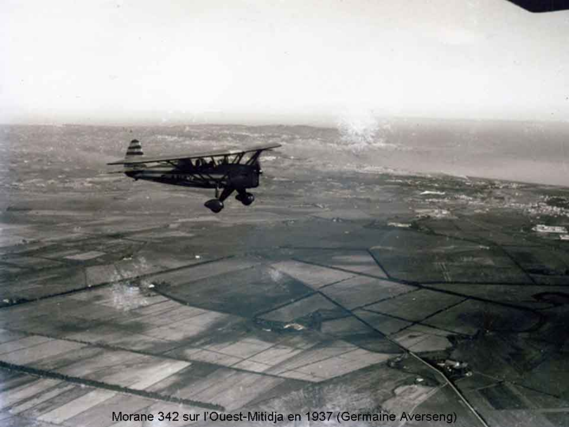
Morane 342 sur l'Ouest-Mitidja en 1937 (Germaine Averseng)