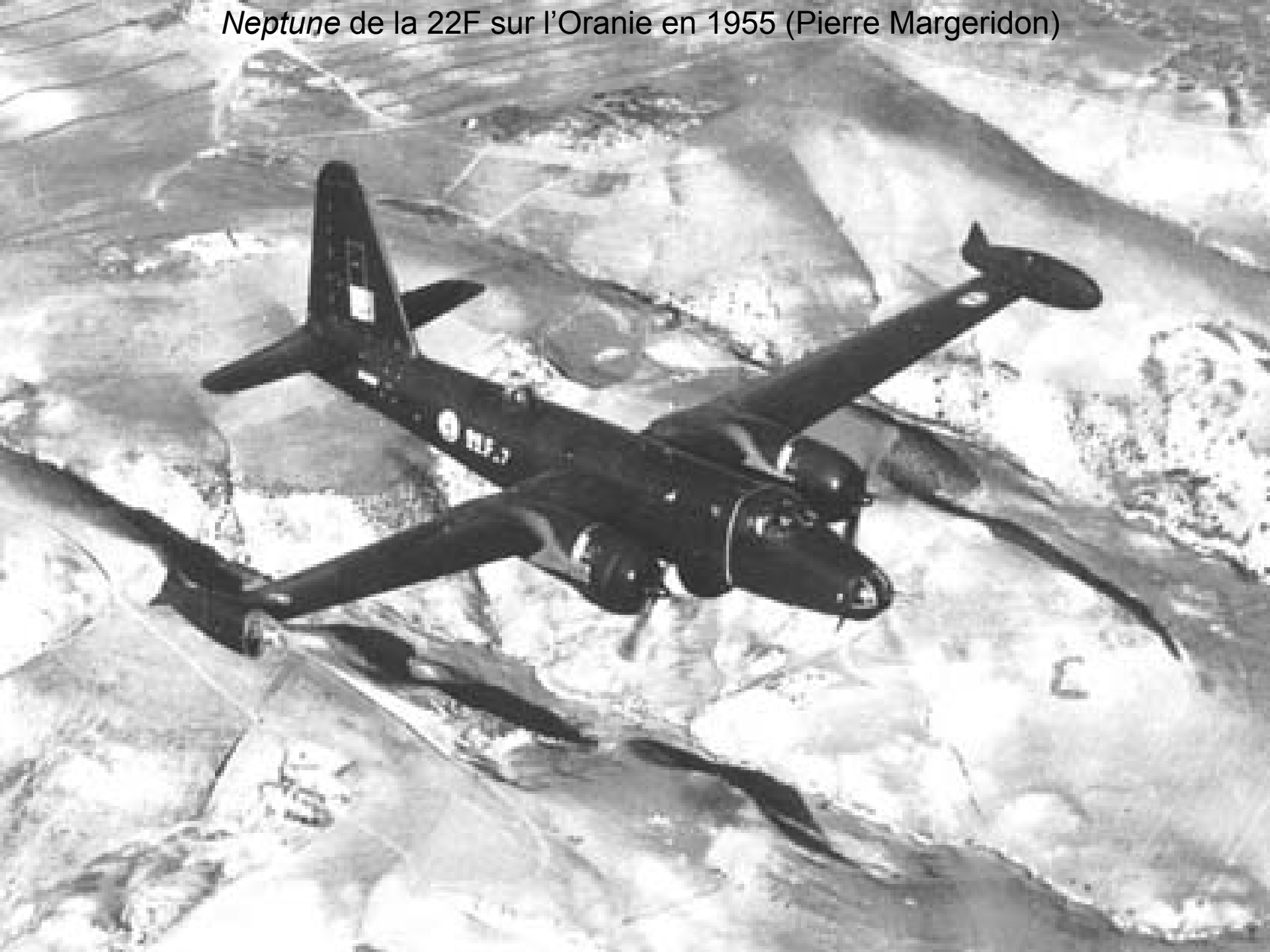
Neptune de la 22F sur l'Oranie en 1955 (Pierre Margeridon)