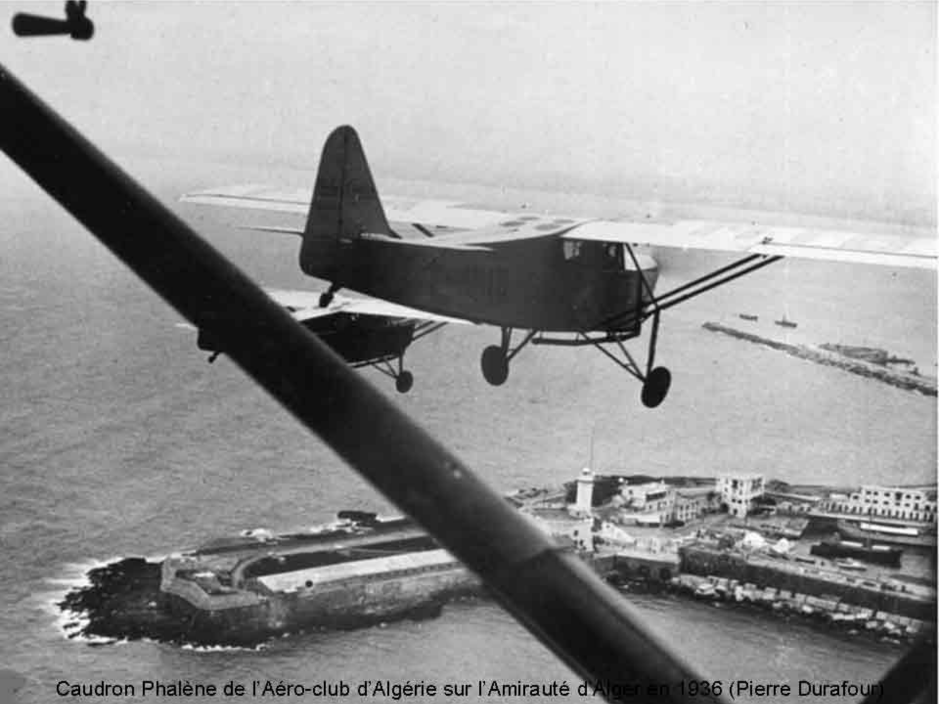
Caudron Phalène de l'Aéro-club d'Algérie sur l'Amirauté d'Alger en 1936 (Pierre Durafour)