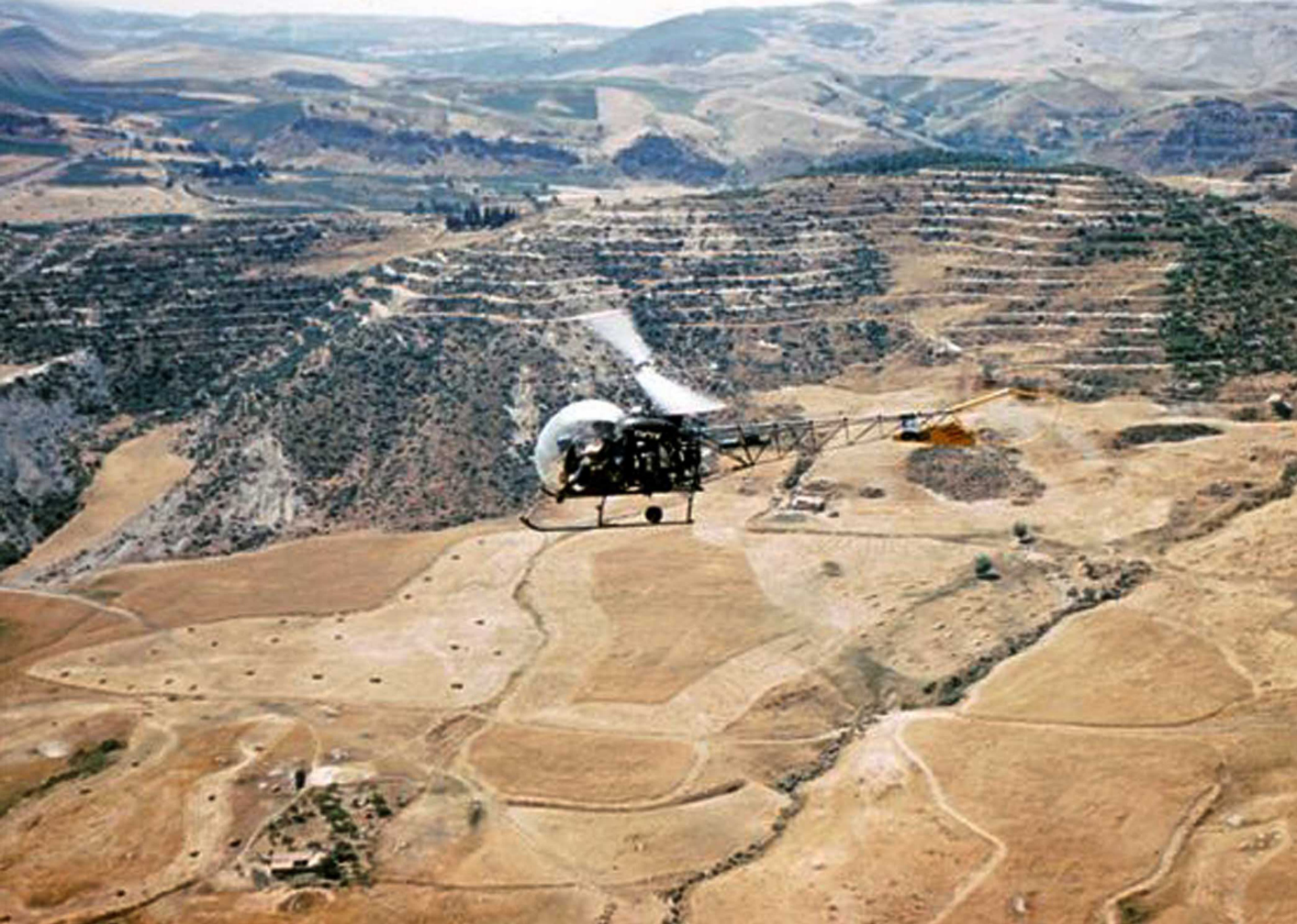
Bell G2 du 1er PMAH 20ème DI sur la région de Berrouaghia en 1961 (Yves Breteau)