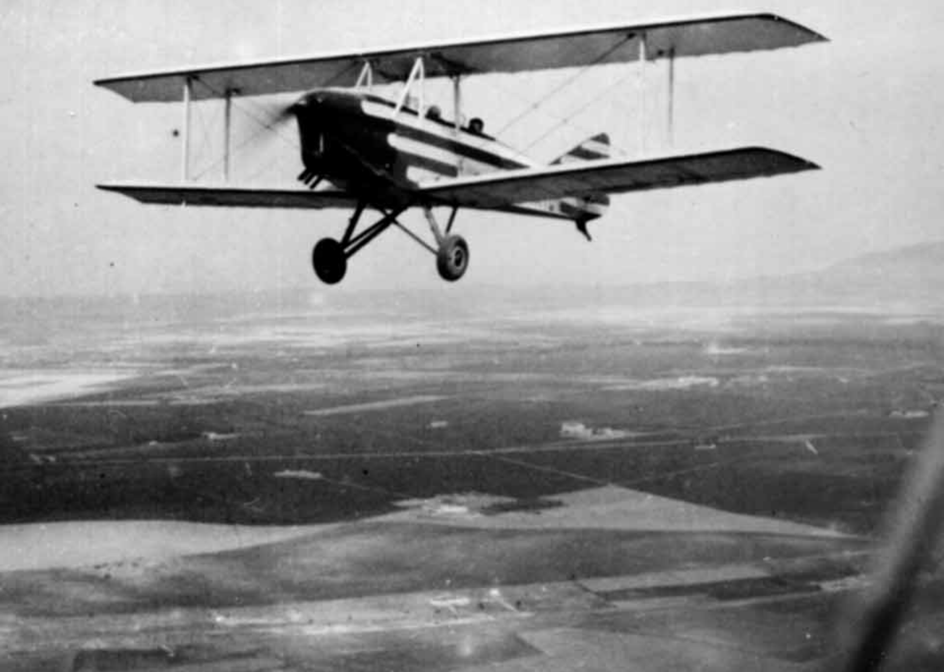
Caudron Luciole sur l'aérodrome de Sidi-Bel-Abbès en 1934 (Cécile Alberge)