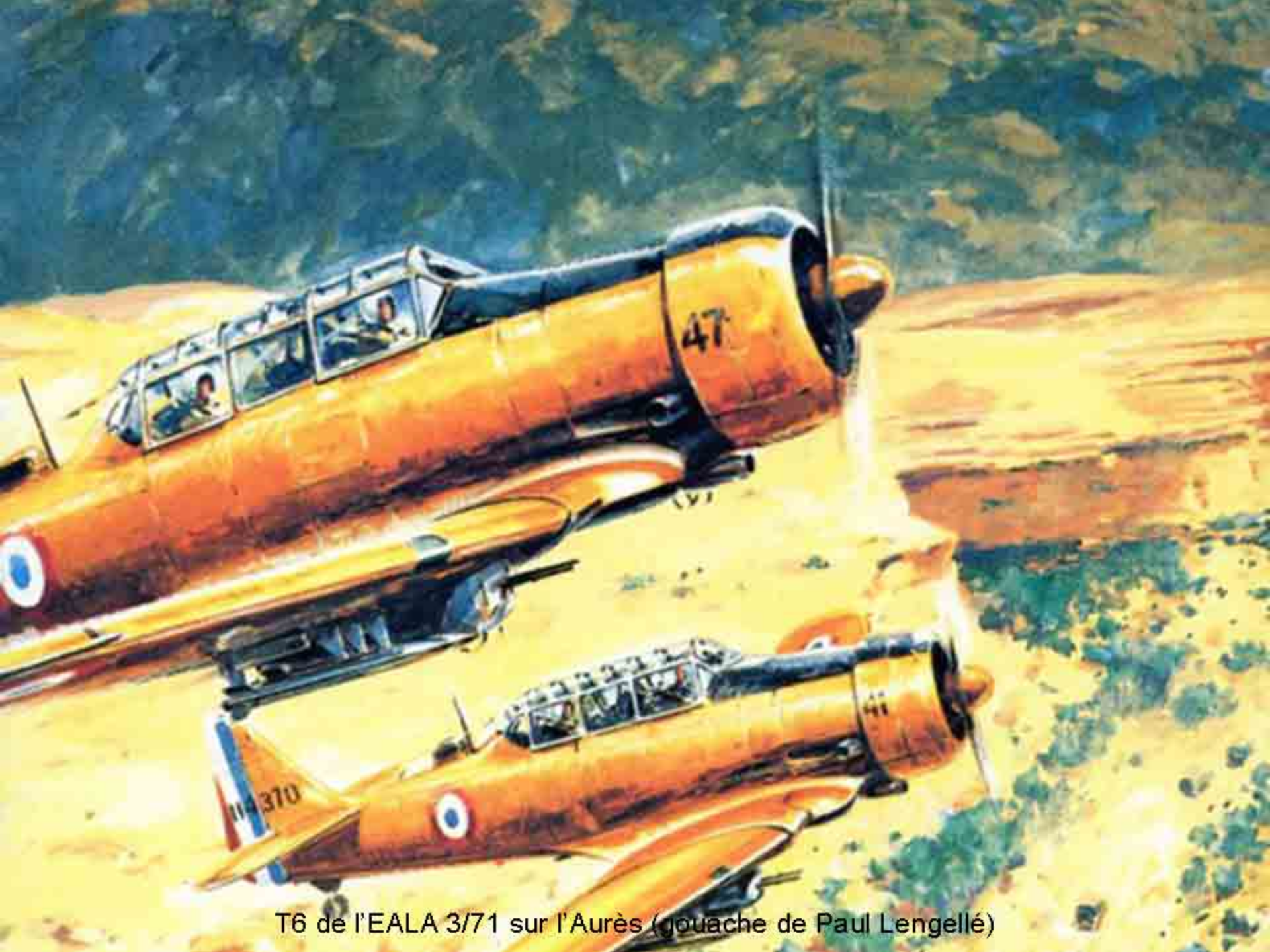
T6 de l'EALA 3/71 sur l'Aurès (gouache de Paul Lengellé)