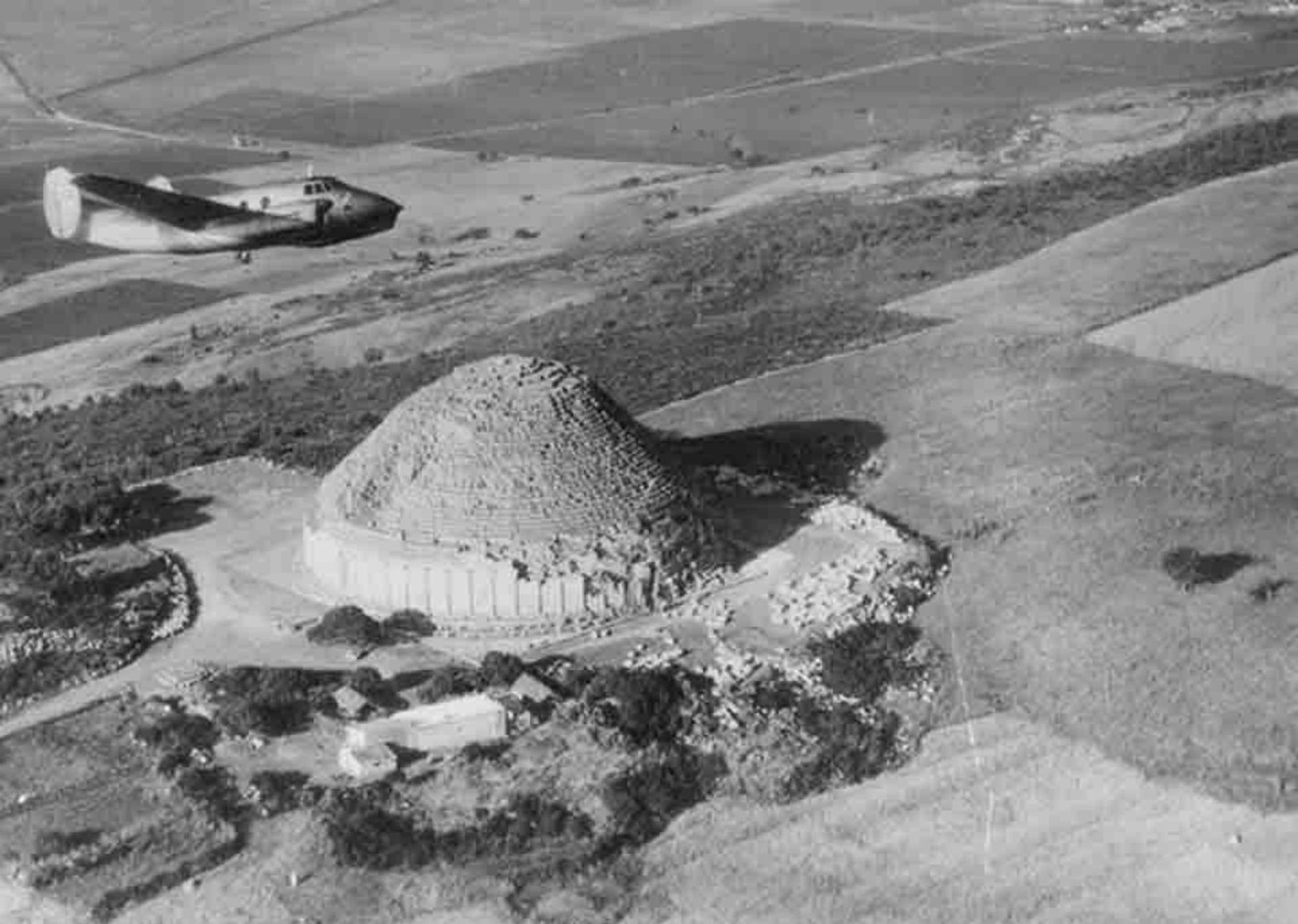
MD 315 Flamant du GOM 86 sur le Tombeau de la Chrétienne en 1953 (GOM 86)