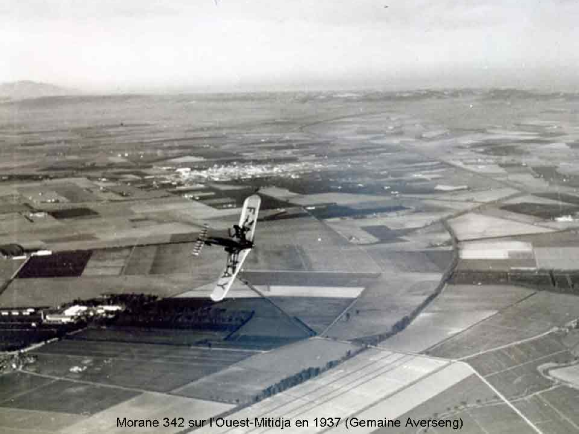
Morane 342 sur l'Ouest-Mitidja en 1937 (Gemaine Averseng)