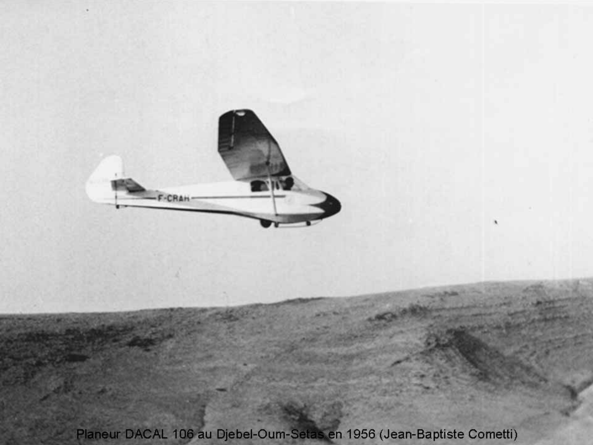
Planeur DACAL 106 au Djebel-Oum-Setas en 1956 (Jean-Baptiste Cometti)