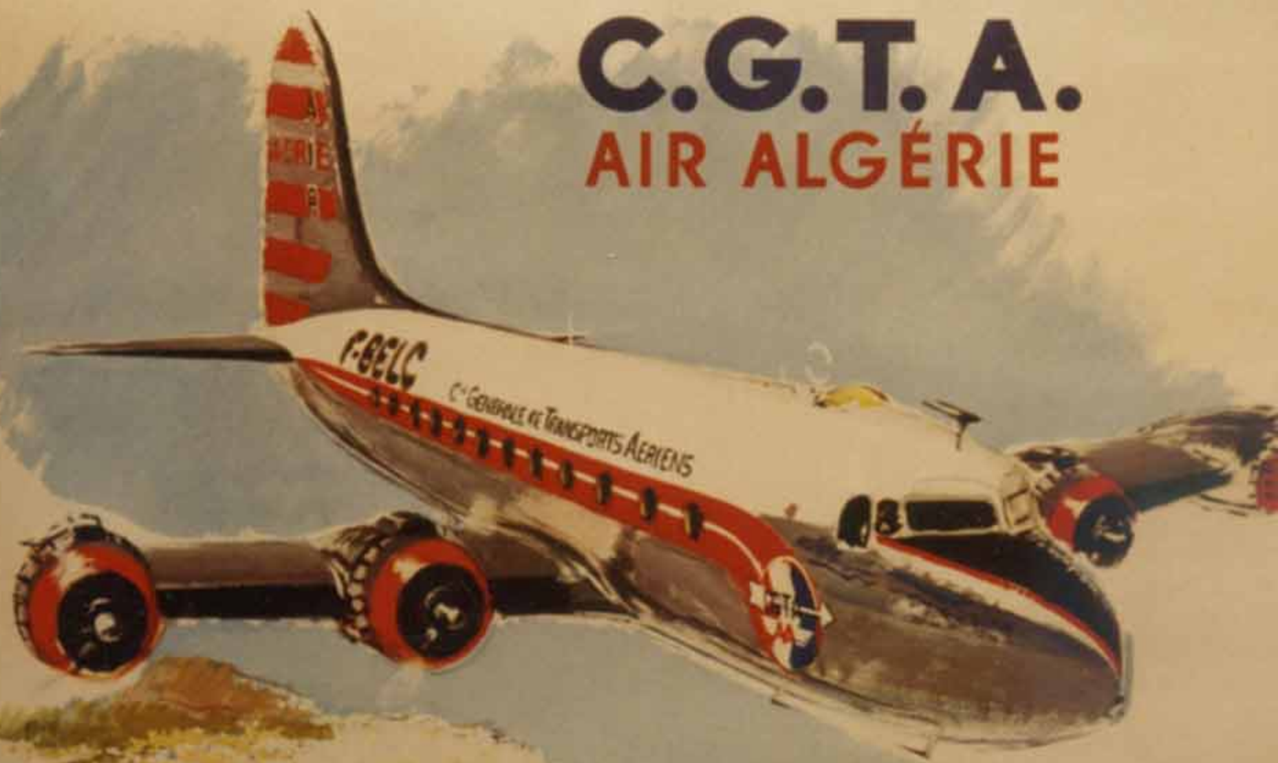
DC-4 d'Air Algérie sur Alger en 1953