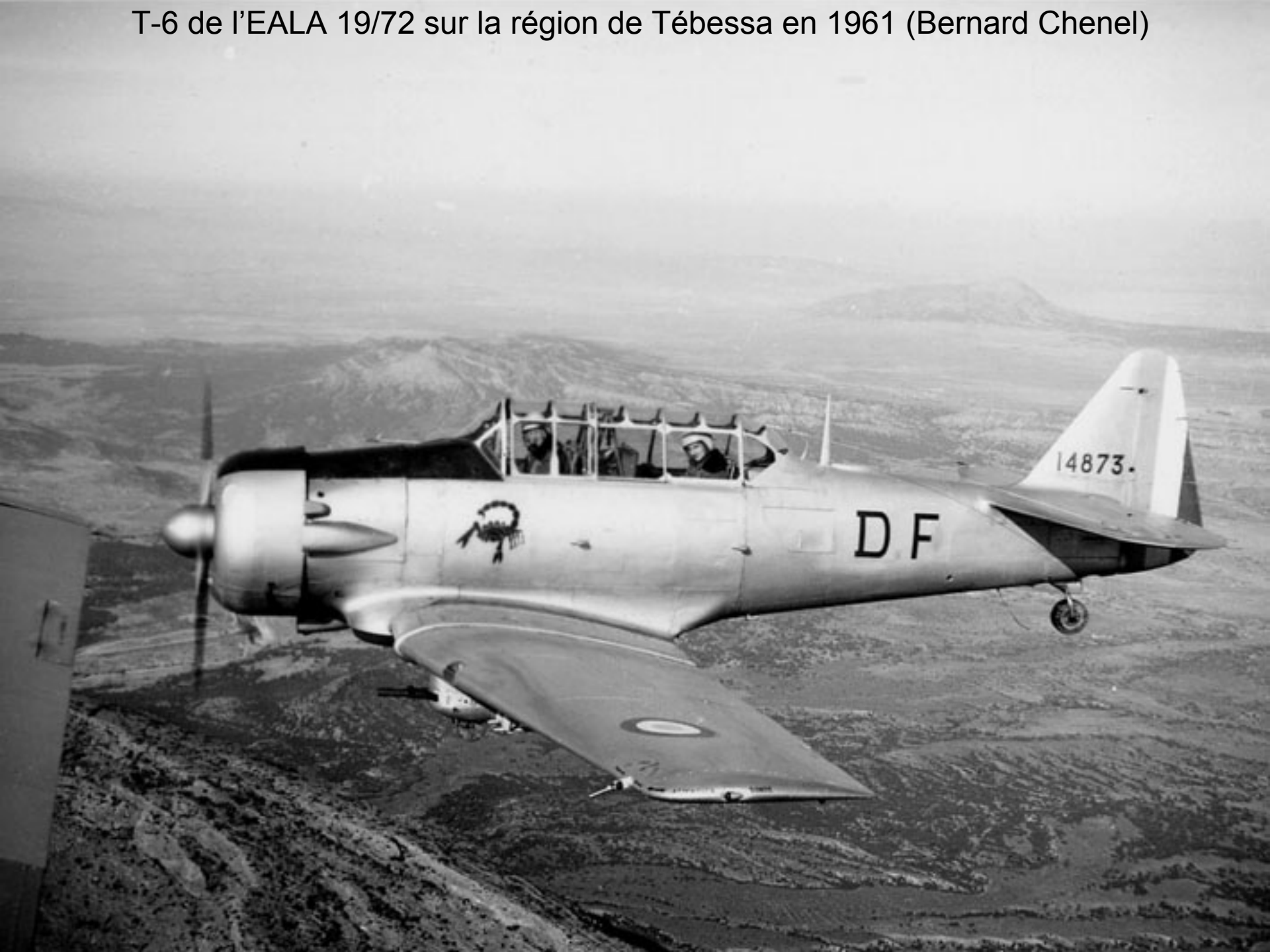
T-6 de l'EALA 19/72 sur la région de Tébessa en 1961 (Bernard Chenel)