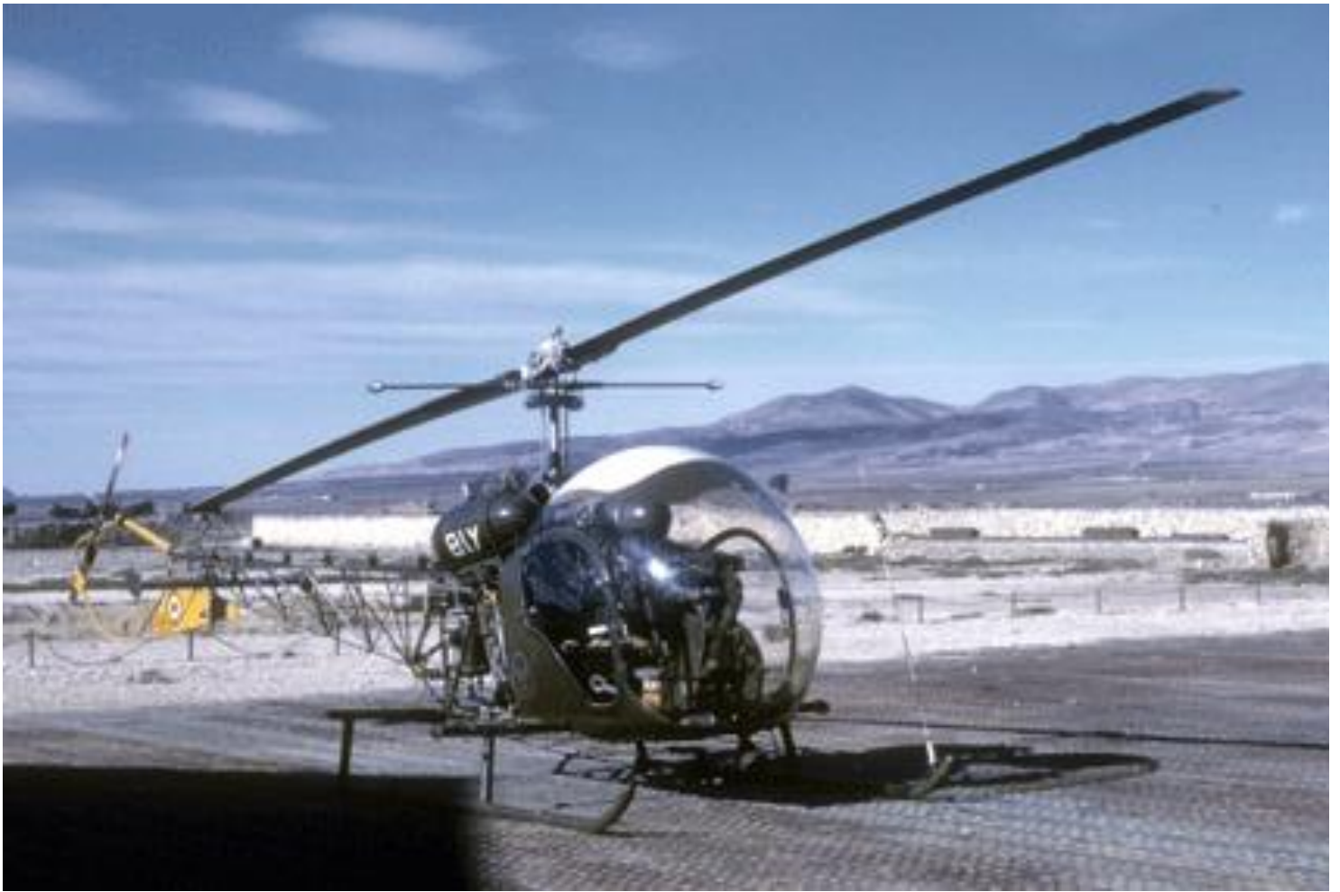
Tébessa 1959, Agusta-Bell 47G-2 n°139/BIY du 1 er PMAH de la 2 e DIM