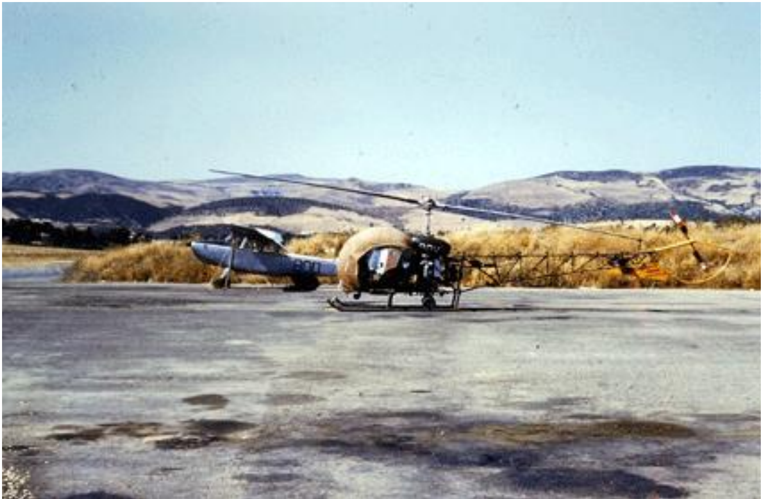
1er PMAH de la 20e DI, à Berrouaghia, en 1962, Bell 47G-2 n°1638/BOW.