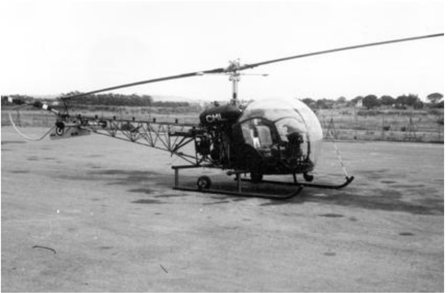
Chéragas 1961, Agusta-Bell n° 159/CML du GALAT N° 3.