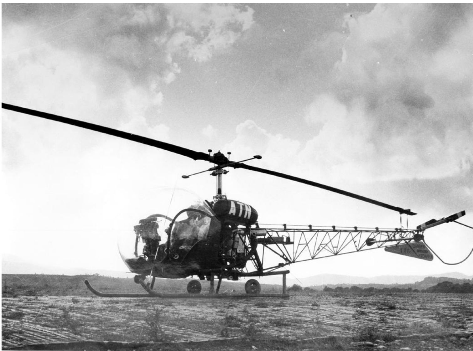
Agusta-Bell 47G-2 n° 118/ATN du 9° GALAT (photo X, via Alain Crosnier).