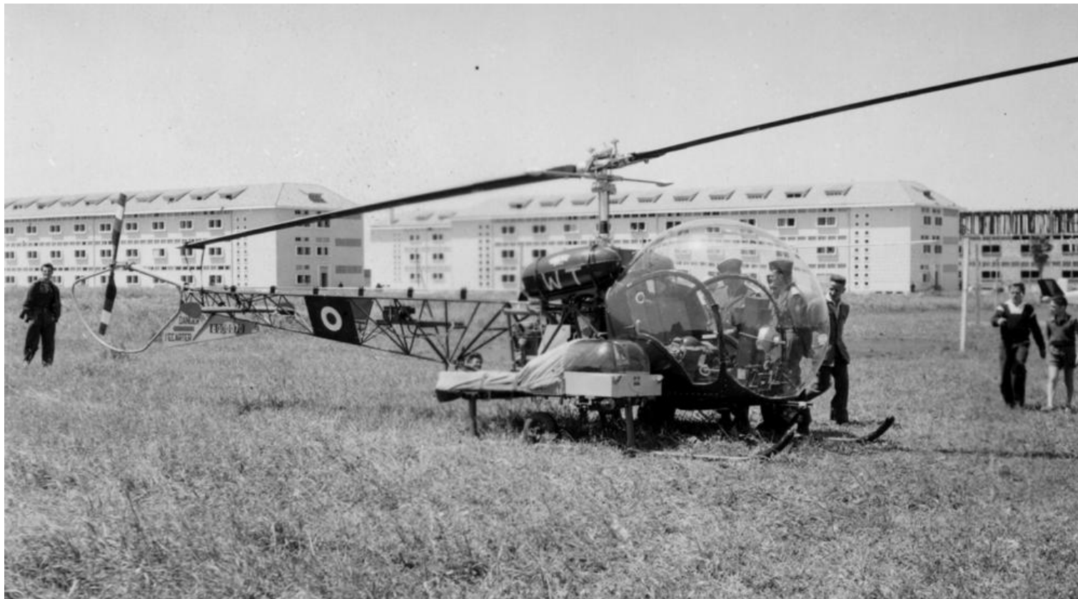
Agusta-Bell 47G-2 n°117/WT du GAOA N°4 à Meknès (photo G. Poiron via G. Collaveri).