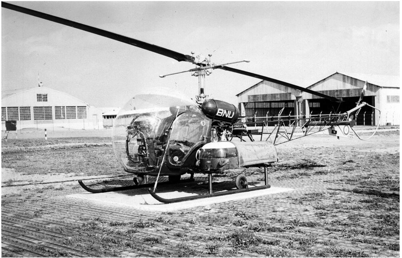
Sétif 1960, Agusta-Bell 47G-2 n° 114/BNU, du PMAH de la 19 e DI.