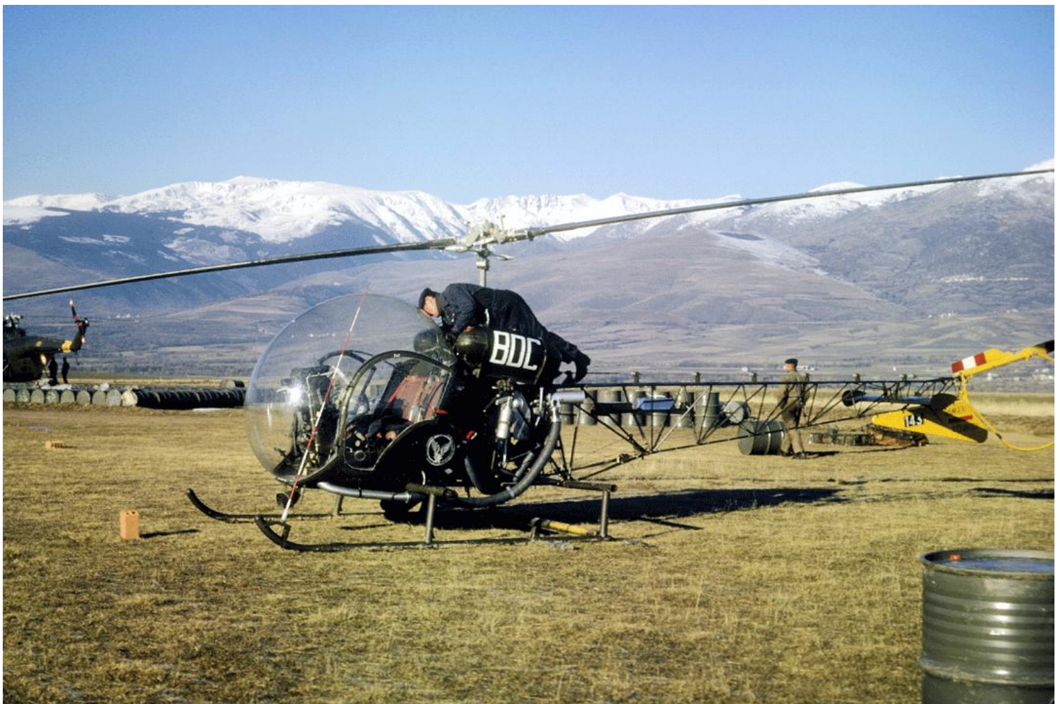
Agusta-Bell 47G-2 n°143/BDC de l'ES.ALAT à Saillagousse en 1963.