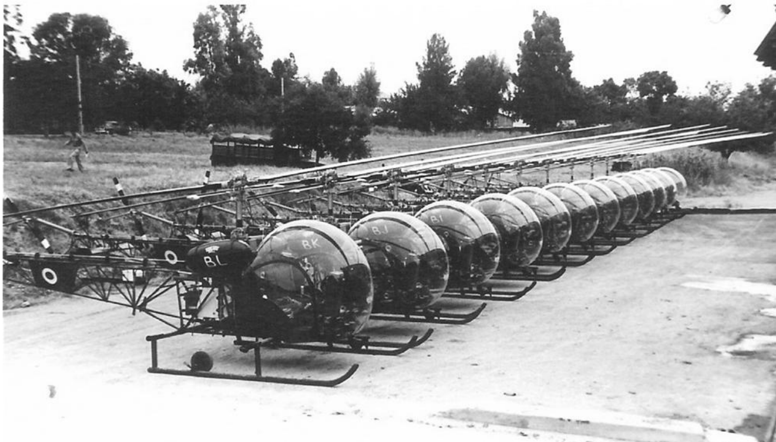
Alignement des 12 Agusta-Bell 47G-2 du GH N°3. Au premier plan, le n° 127/BL.

Au total, l'ALAT a reçu 70 Bell et Agusta-Bell G-2 (59 Agusta-Bell G-2 (dont 49 livrés directement à l'ALAT, 7 cédés par l'armée de l'Air et 3 provenant de la Gendarmerie, auxquels s'ajoutent 11 Bell G-2 cédés par l'armée de l'Air).