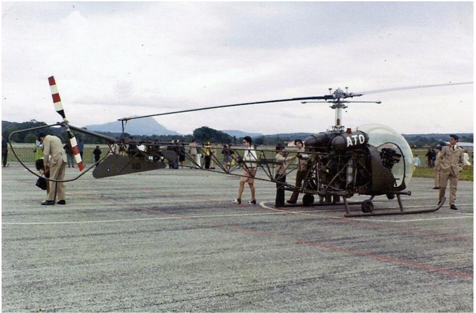
7 e GALAT, BA 114, Aix-les-Milles, le 20 mai 1973. Bell 47G-2 n° 1629/ATO.