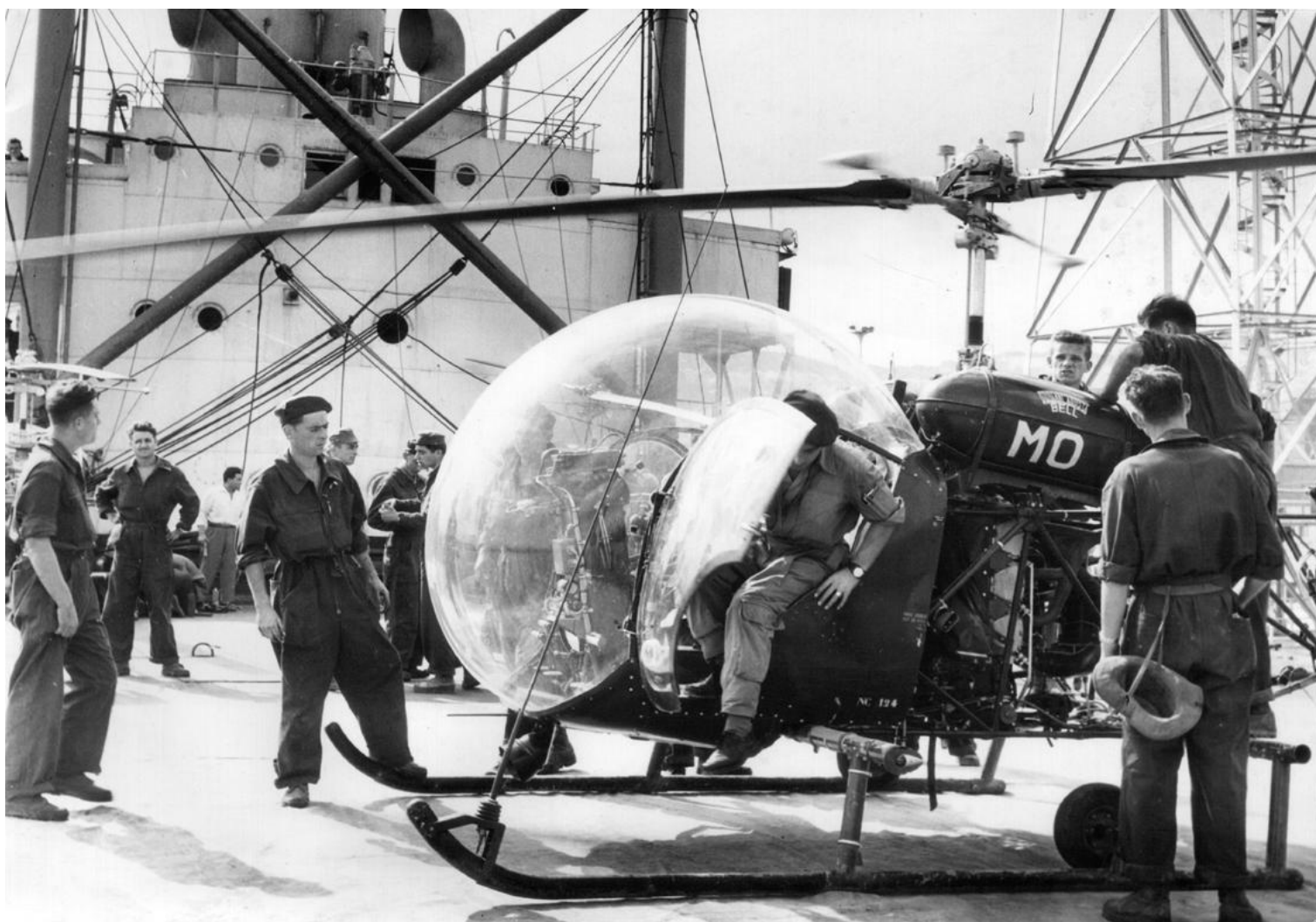
Agusta-Bell 47G-2 n°124/MO à bord du Léon-Mazella en 1956.