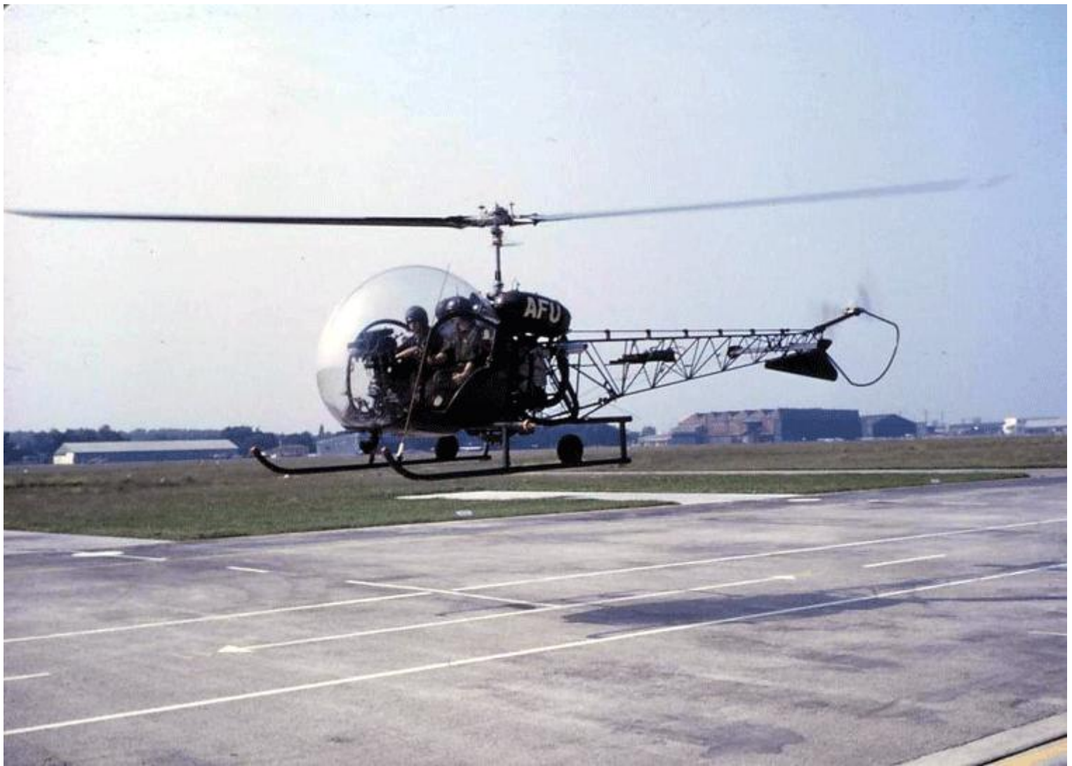
Agusta-Bell 47G-2 n° 179/AFU du 1 er GALAT.