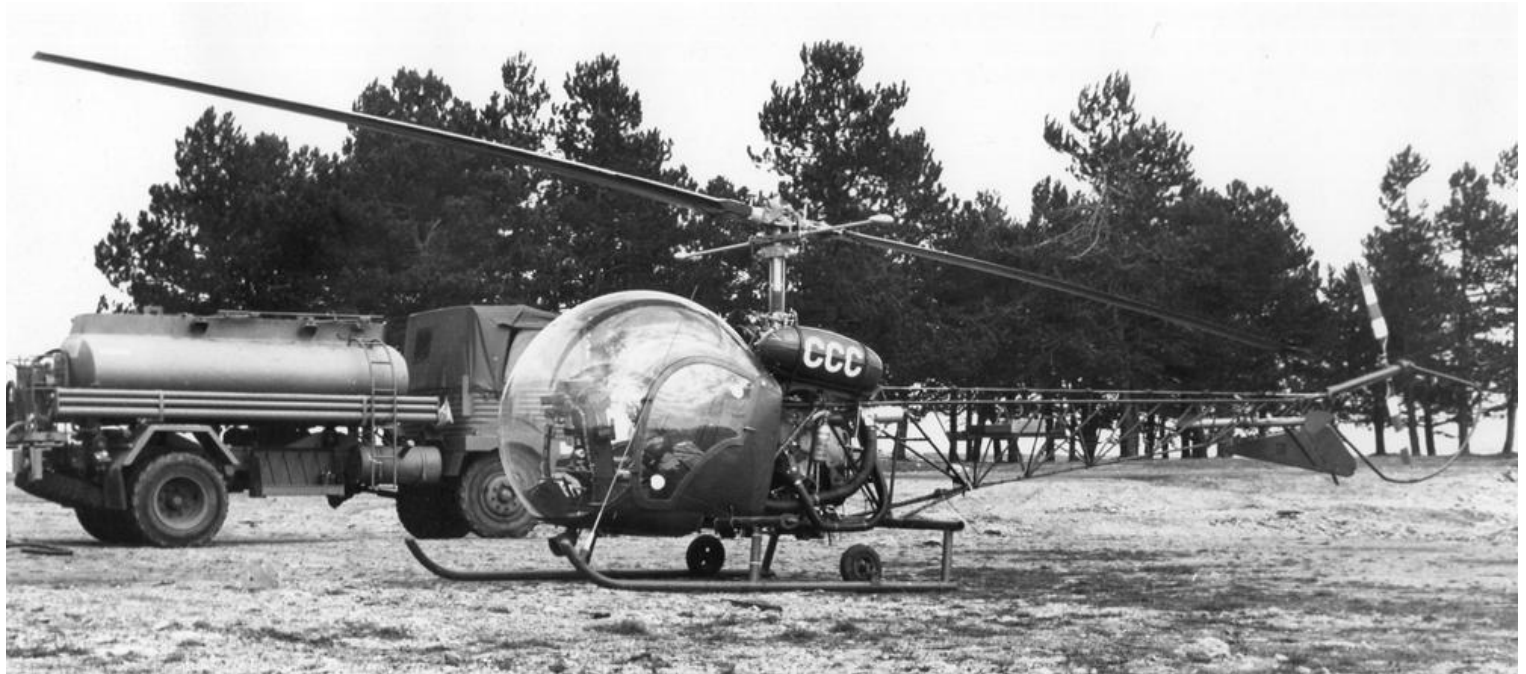
Agusta-Bell 47G-2, codé CCC, de l'EALAT-EAI au camp du Larzac en mars 1975.