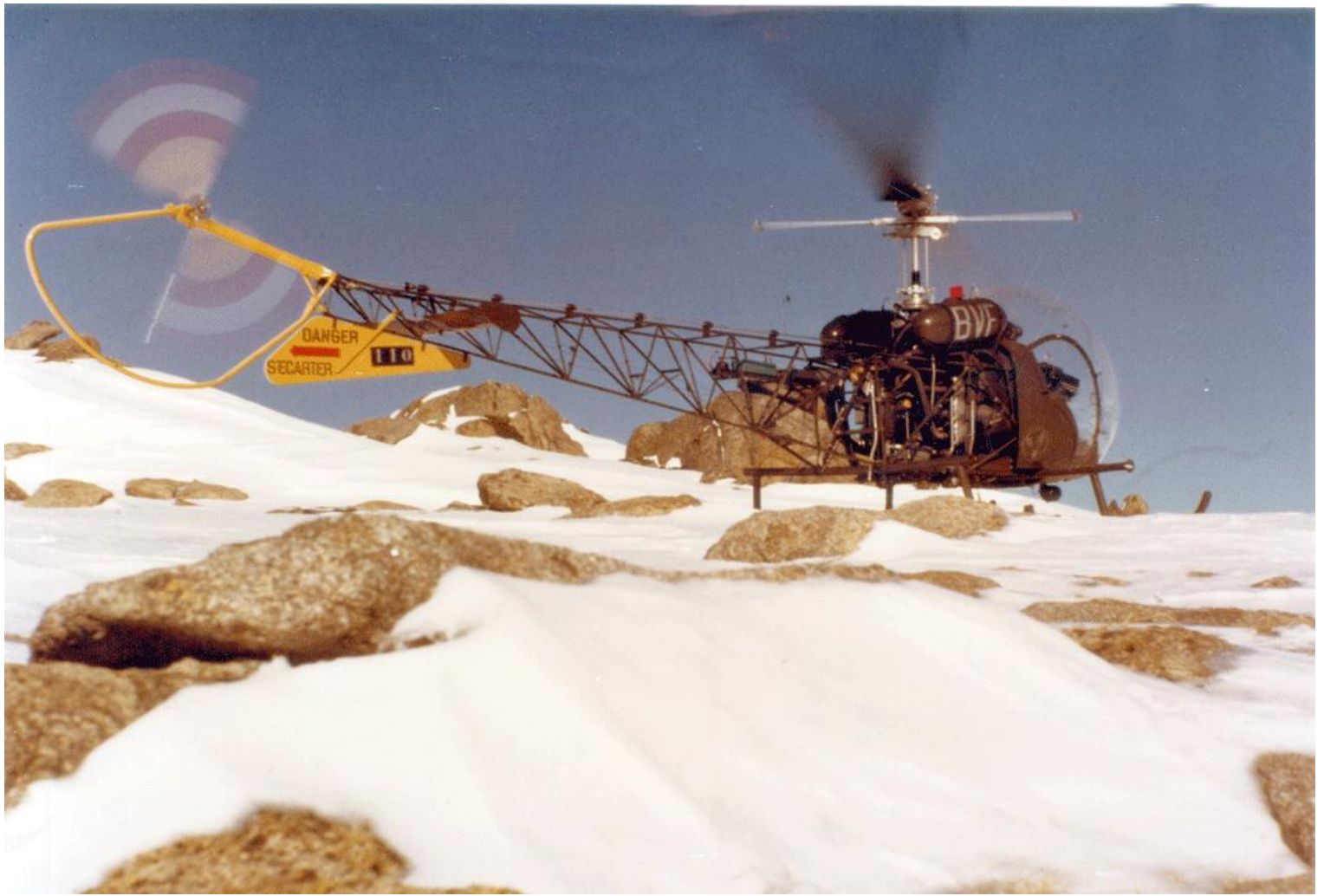
Agusta-Bell 47G-2 n° 110/BVF de l'ES.ALAT.