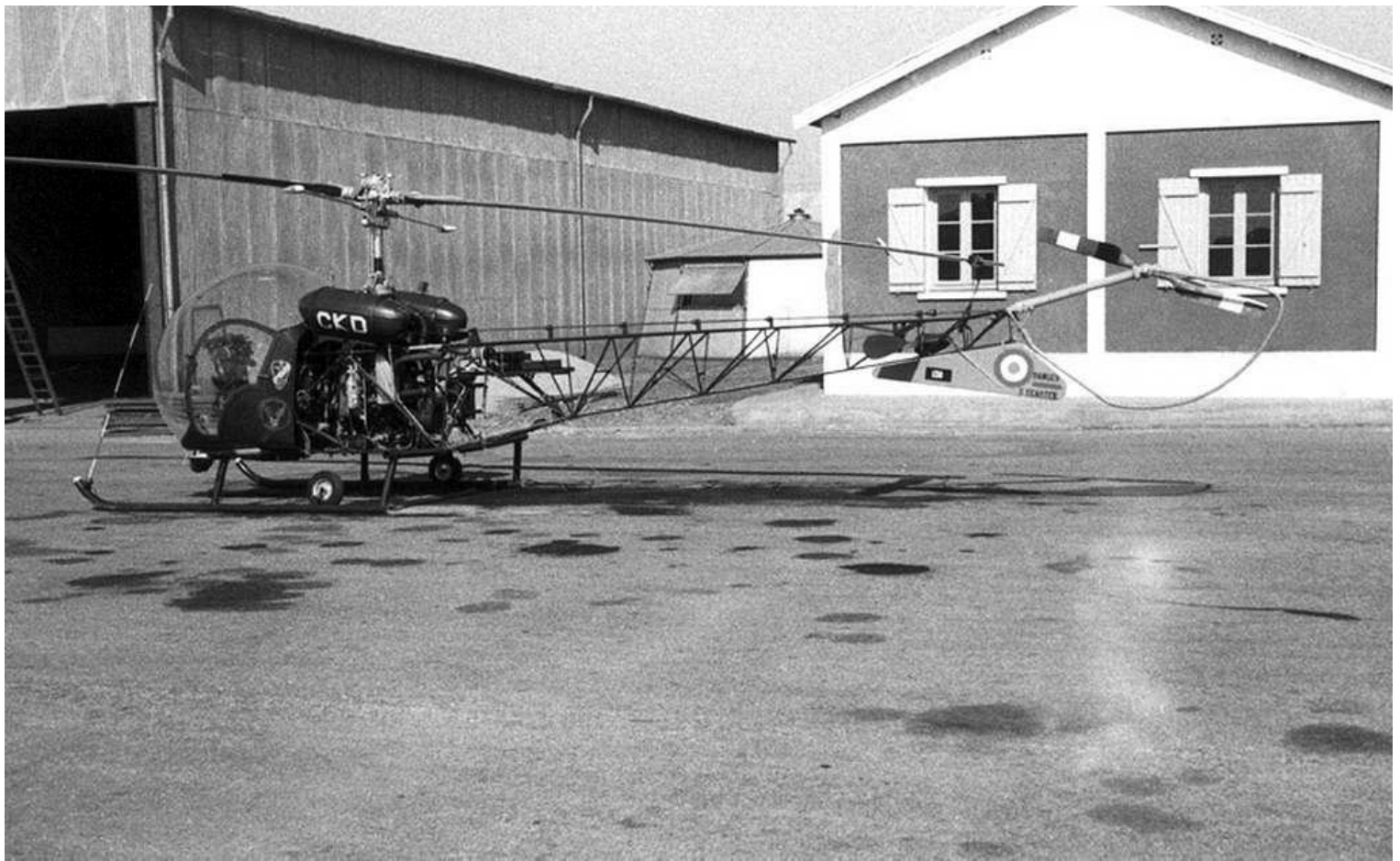
Agusta-Bell 47G-2 n°130/CKD du GALAT 105.