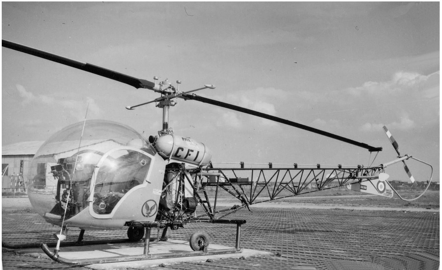
Bell 47G-2 n° 1632/CFI, du GALAT 101, le 7 mai 1960 à Sétif.