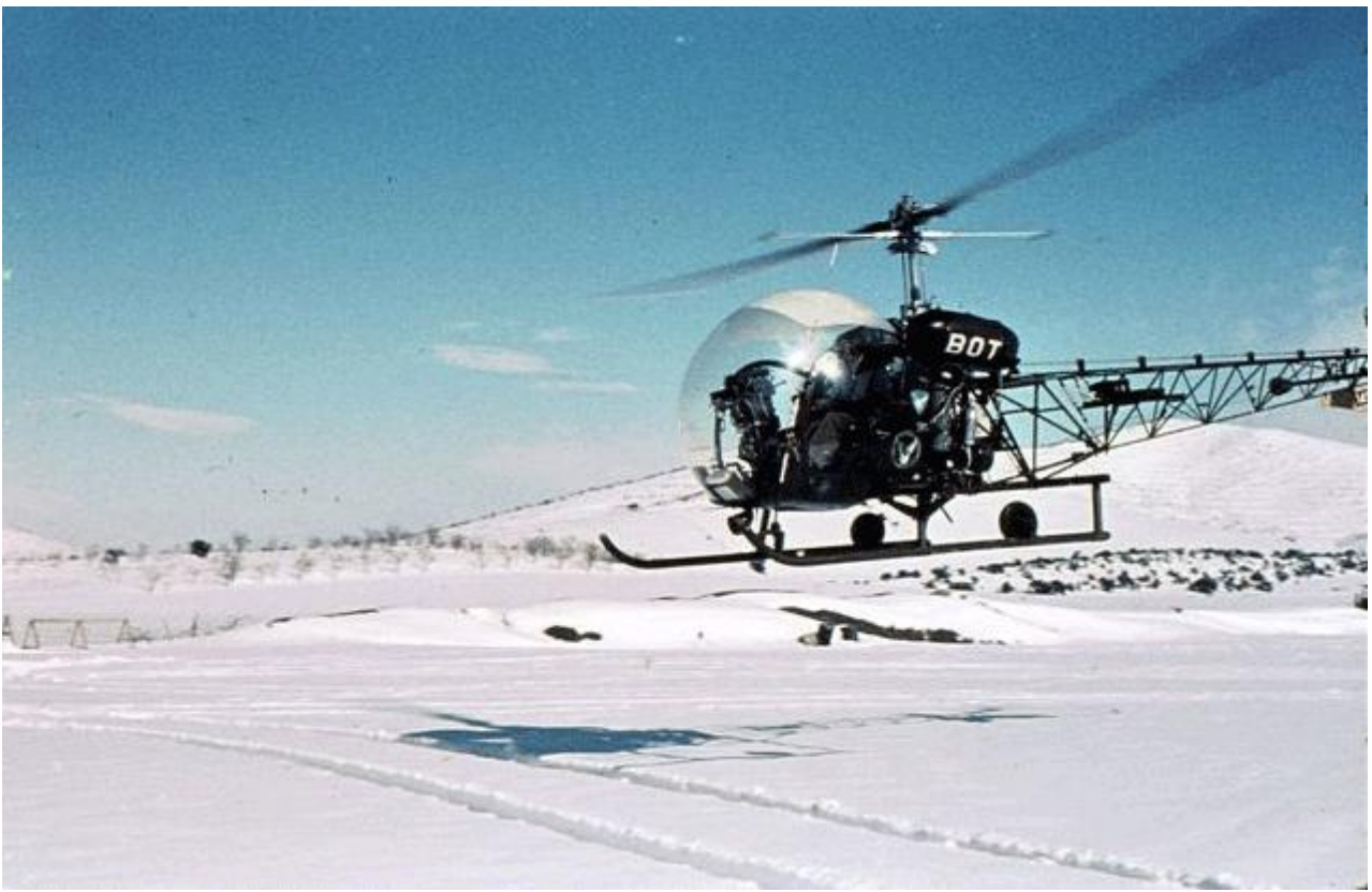
Agusta-Bell 47G-2, n° 149/BOT du 1 er PMAH de la 20 e DI, dans la région de Berrouaghia, en 1961.