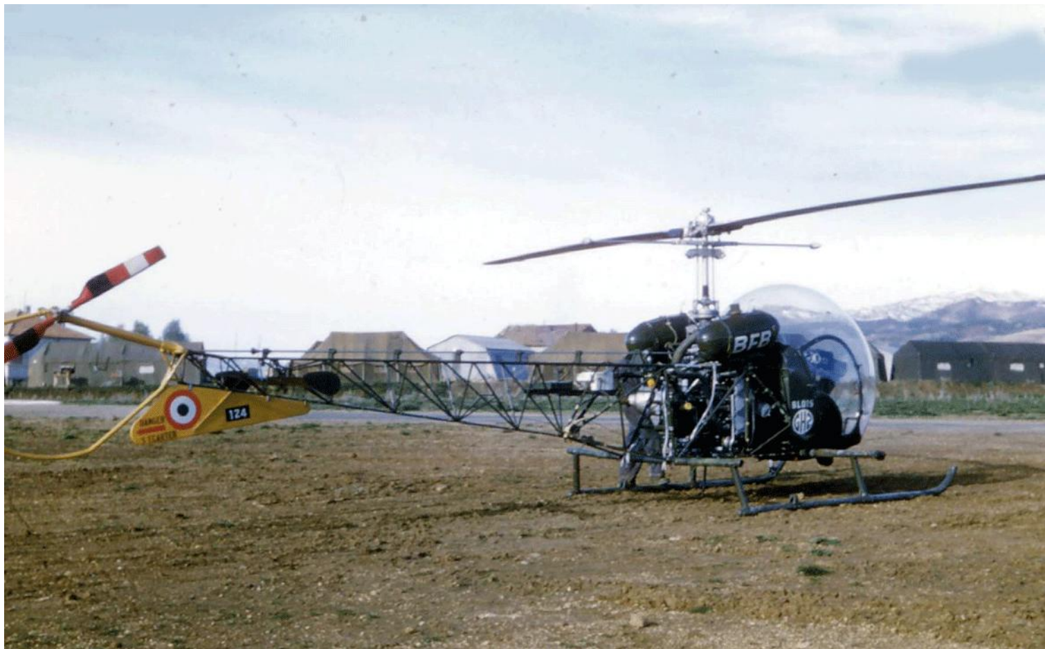
Souk-Ahras en 1959, Agusta-Bell 47G-2 n°124/BFB "Blois" du GH N°2.