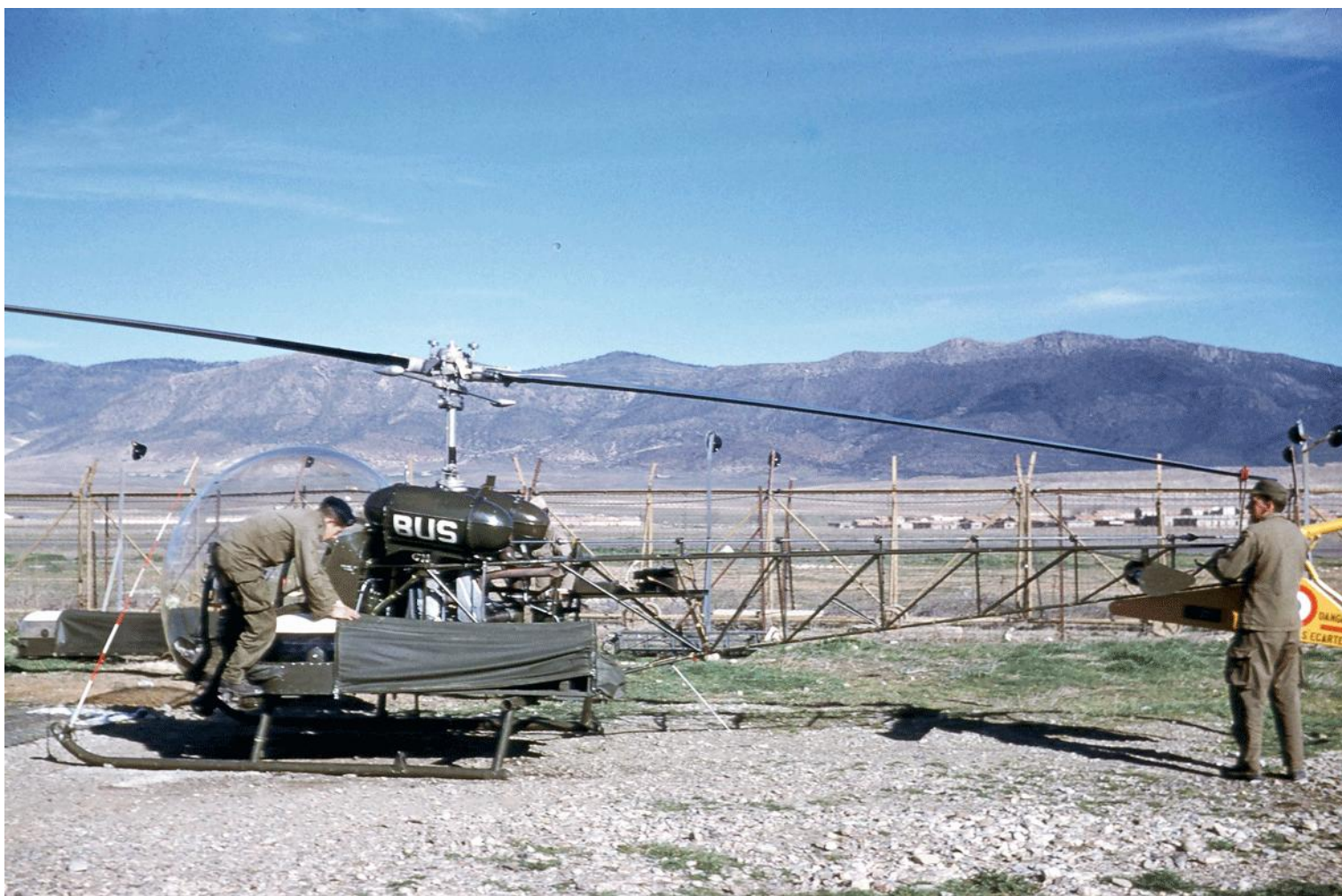
Batna, le 20 février 1960, Agusta-Bell 47G-2 n° 127/BUS, du 1 er PMAH de la 21 e DI.