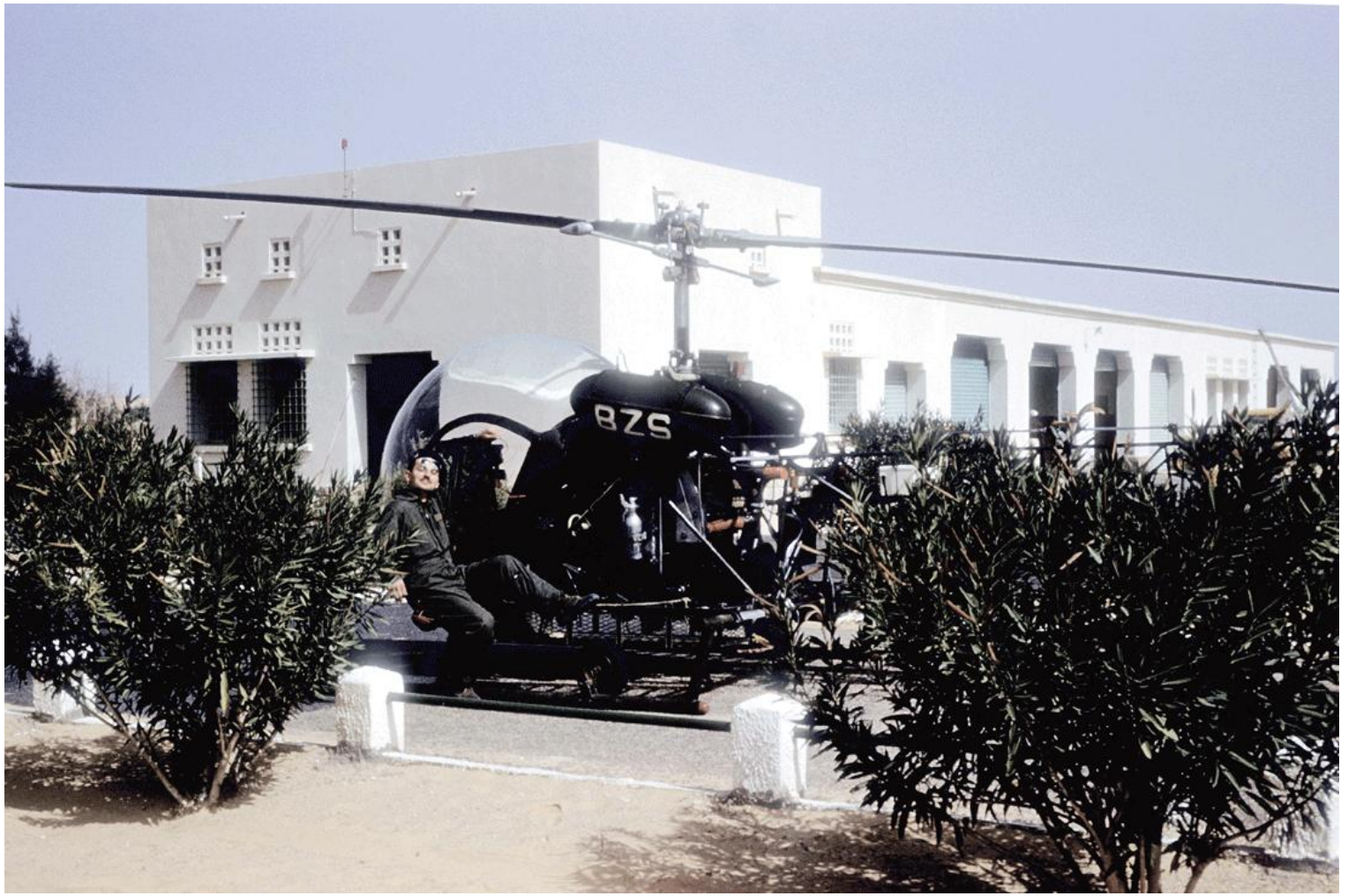
1 er PA ZES, El-Golea, en février 1962, l'Agusta-Bell n° 105/BZS.