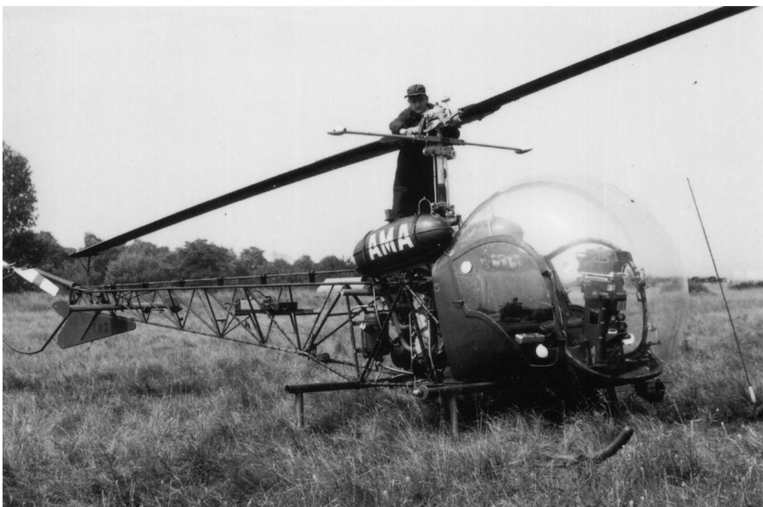
Agusta-Bell 47G-2 n° 103/AMA, du 2e GALREG.