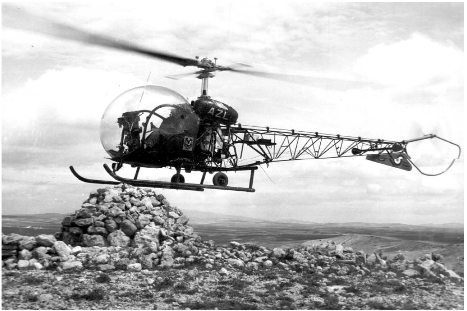
Bell 47G-2 n° 1638/AZL du GH N° 2.