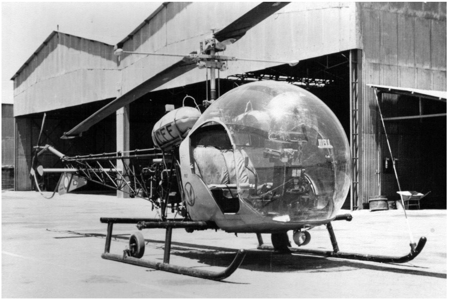
Bell 47G-2, codé CFF, du GALAT 101, à Chéragas, en 1960.