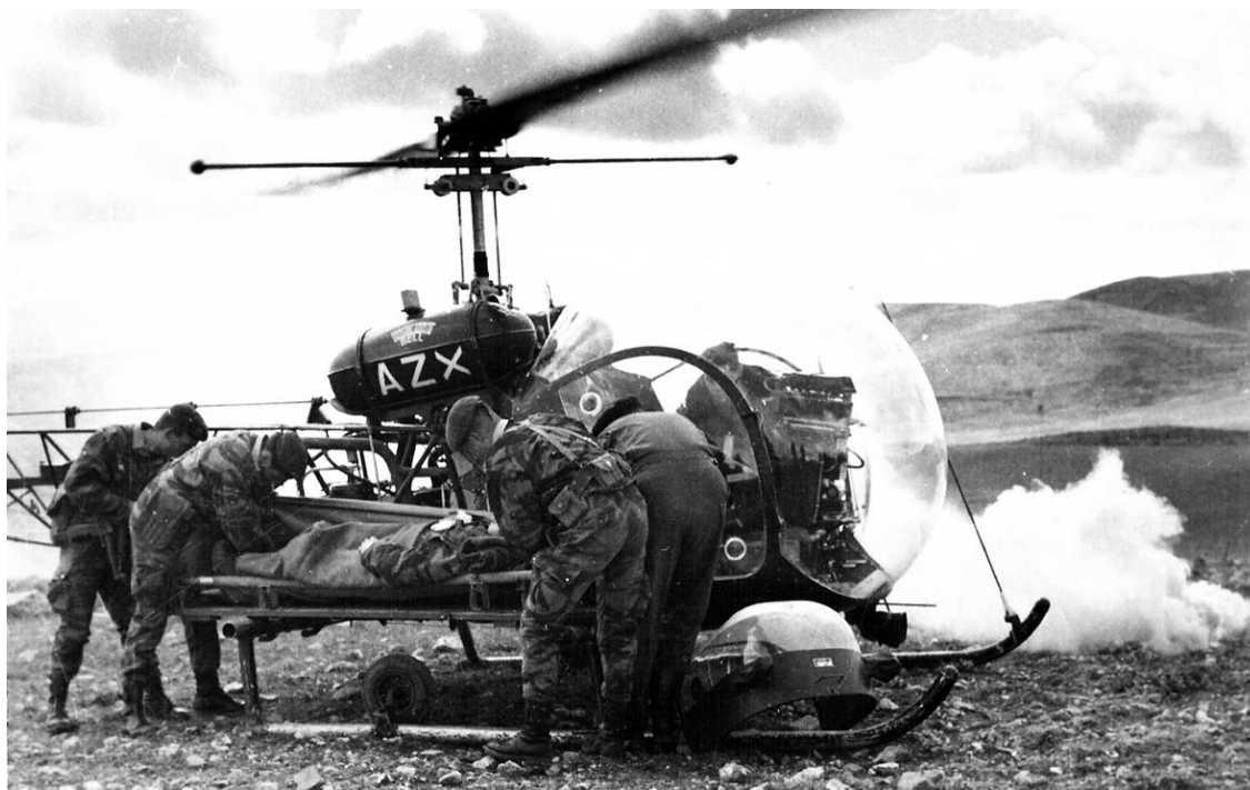
Evasan dans le Constantinois, en 1958, par un Agusta-Bell 47G-2 du GH N°2 (photo Maurice-Jacques Pigelet).

(source : Manuel d'utilisation des hélicoptères Bell G1 et G2, ESAM, août 1961)