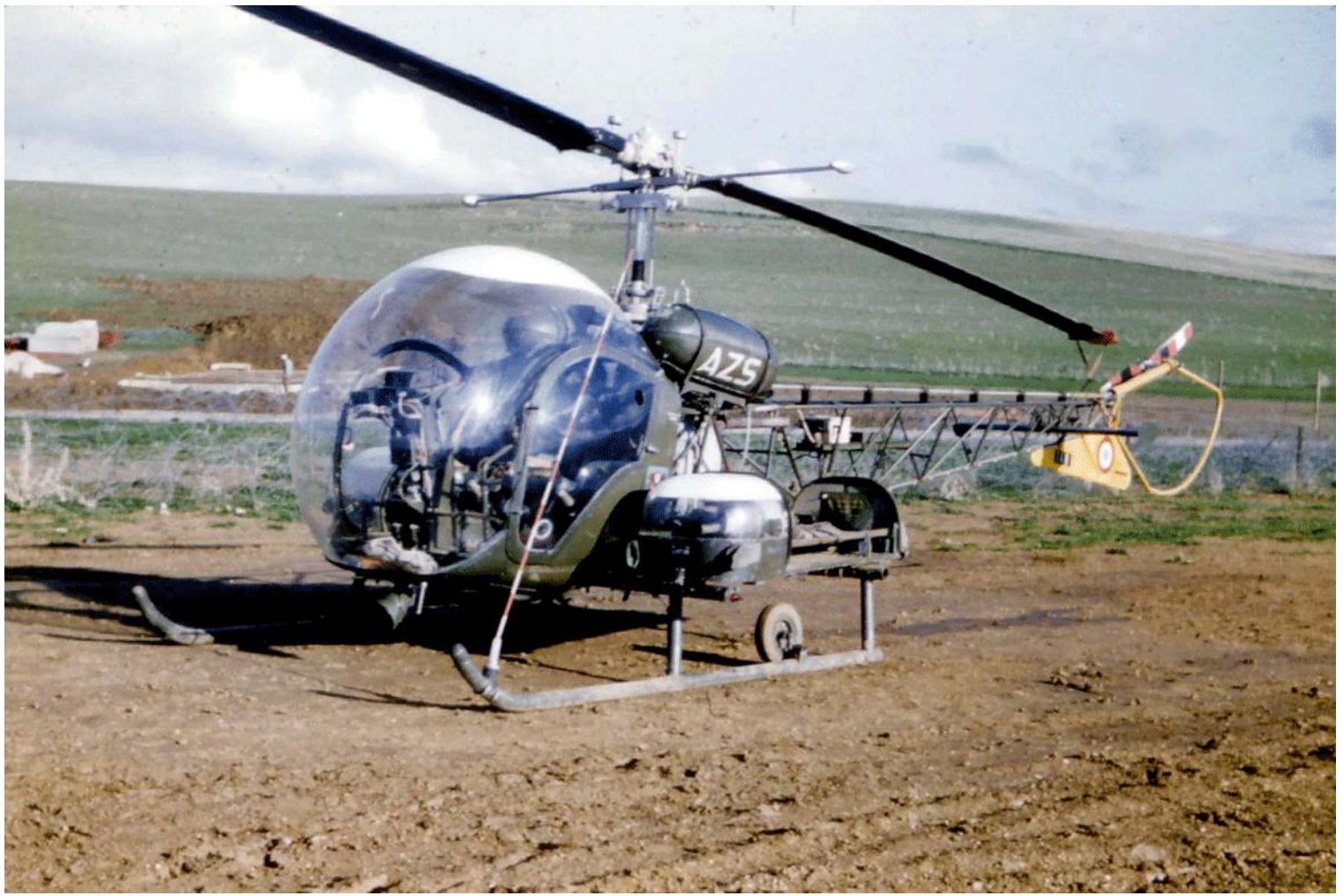
Détachement Bell du GH N°2 au 2° PA de la 2° DIM, l'Agusta-Bell n° 107/AZS, à Souk-Ahras, en 1959