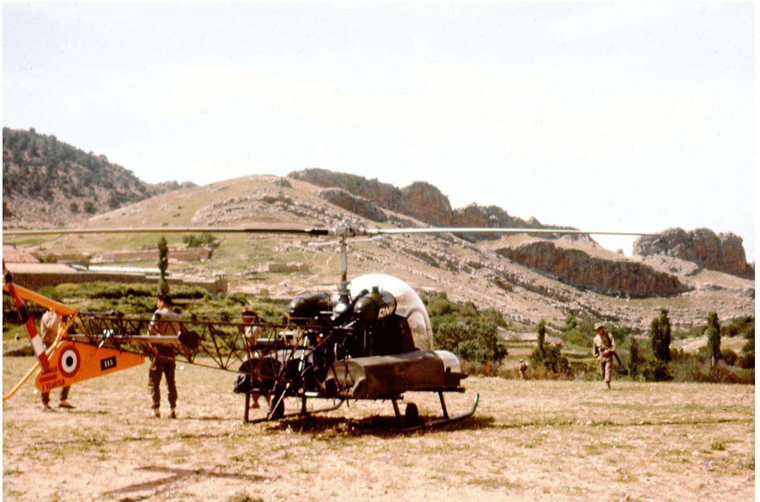
1960, poste du Hamma (sud du Hodna près de Colbert), l'Agusta-Bell 47G-2 n° 115/BNV du PMAH de la 19 e DI.