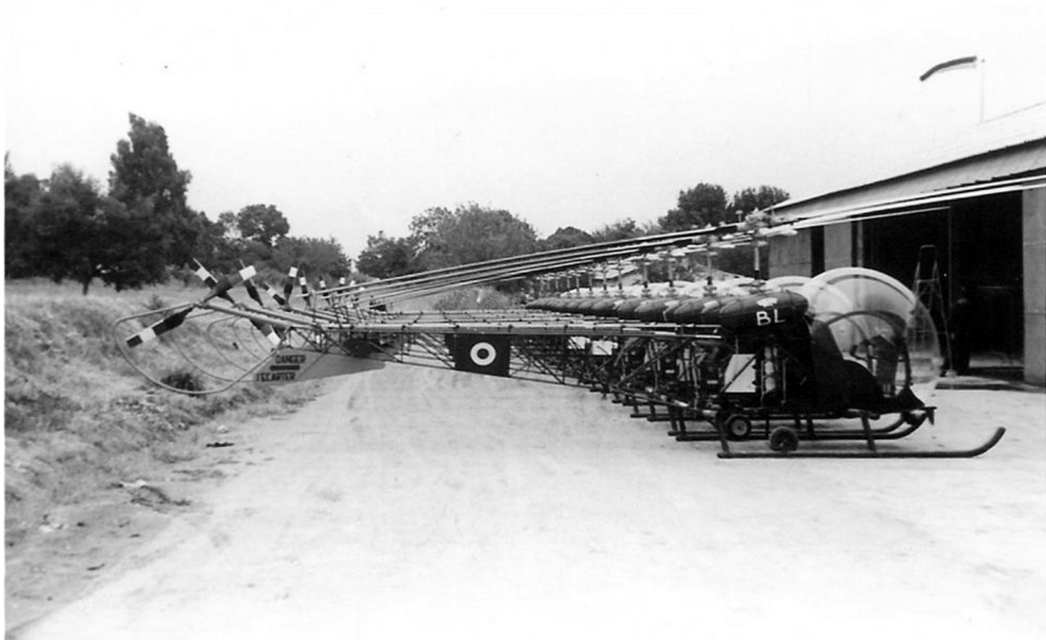
Alignement des 12 Agusta-Bell 47G-2 du GH N°3. Au premier plan, le n° 127/BL.