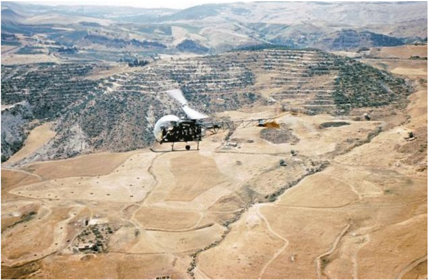
Agusta-Bell 47G-2, n° 127/BOX du 1 er PMAH de la 20 e DI, en vol dans la région de Berrouaghia, en 1961.