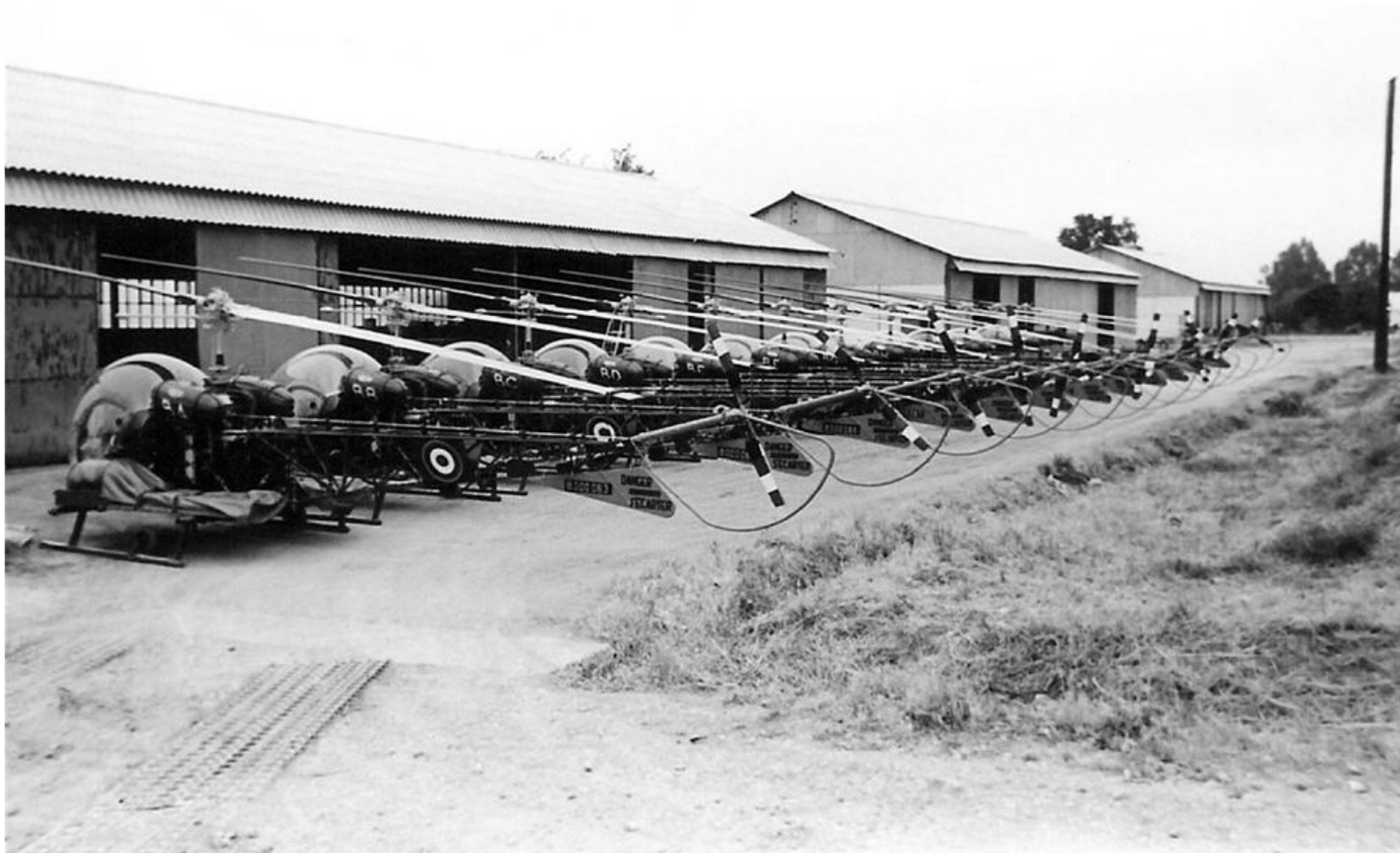
Alignement des 12 Agusta-Bell 47G-2 du GH N°3, devant la hangar où ils sont logés, dans l'enceinte du 64 e RA. A droite, l'atelier.. Au premier plan, l'appareil n° 103/BA.