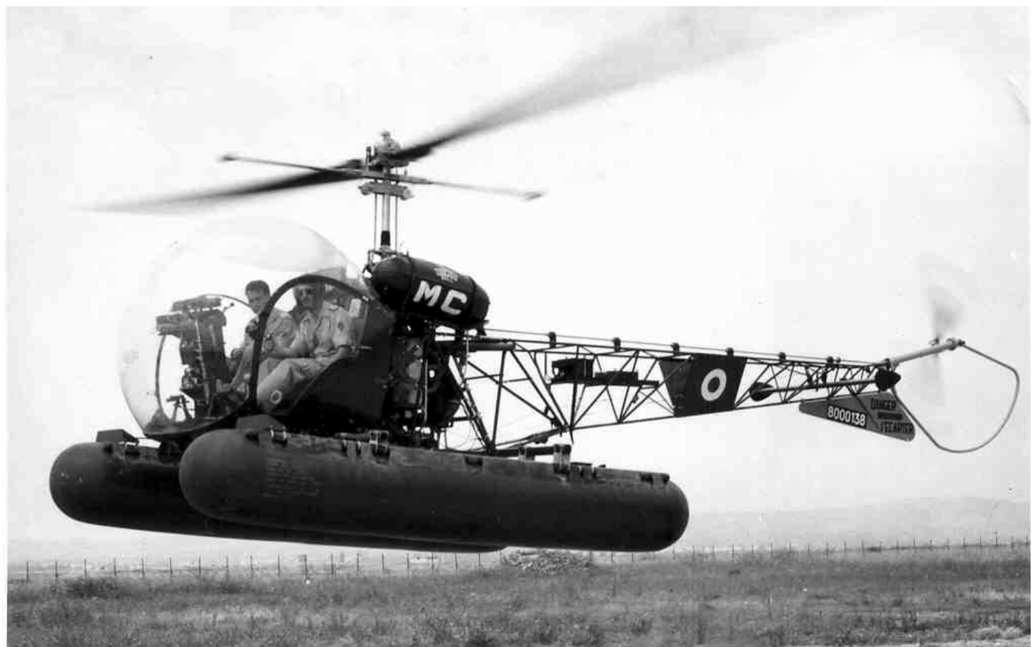
Agusta-Bell 47G-2 n° 151/MC, équipés de flotteurs, au GAOA N° 5, en 1956 à El Aouina, Tunisie