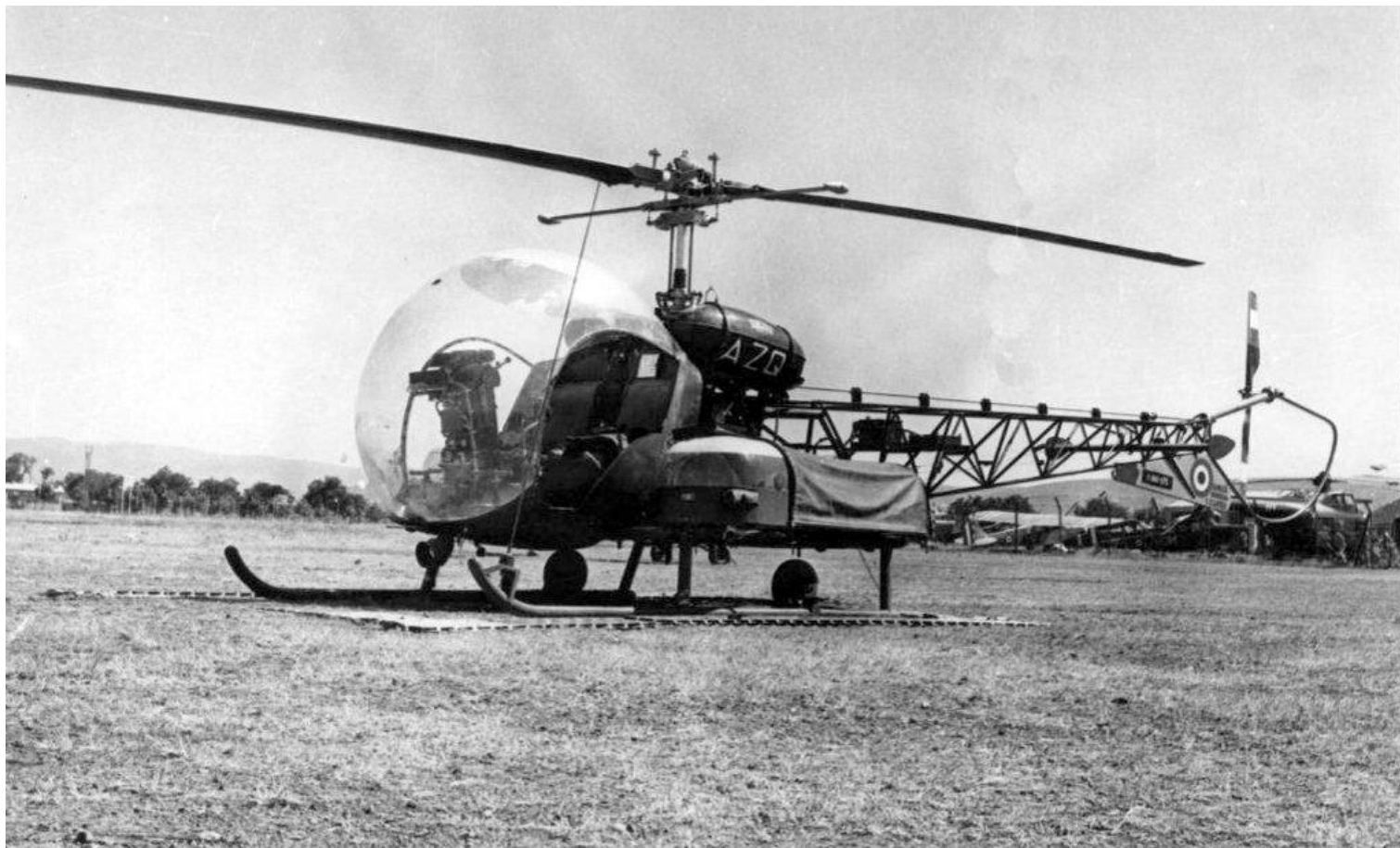
Agusta-Bell 47G-2 n°123/AZQ du GH N°2.