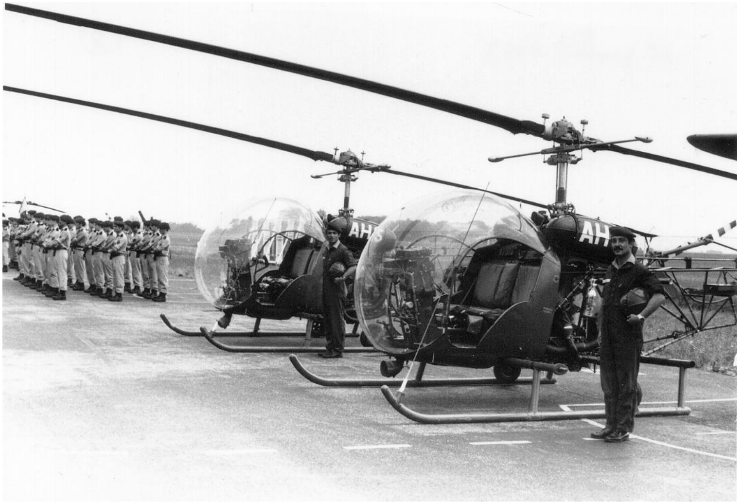
12 juillet 1973, à Lyon Corbas, les Agusta-Bell n° 167/AHS et AHT du 5° GALREG.