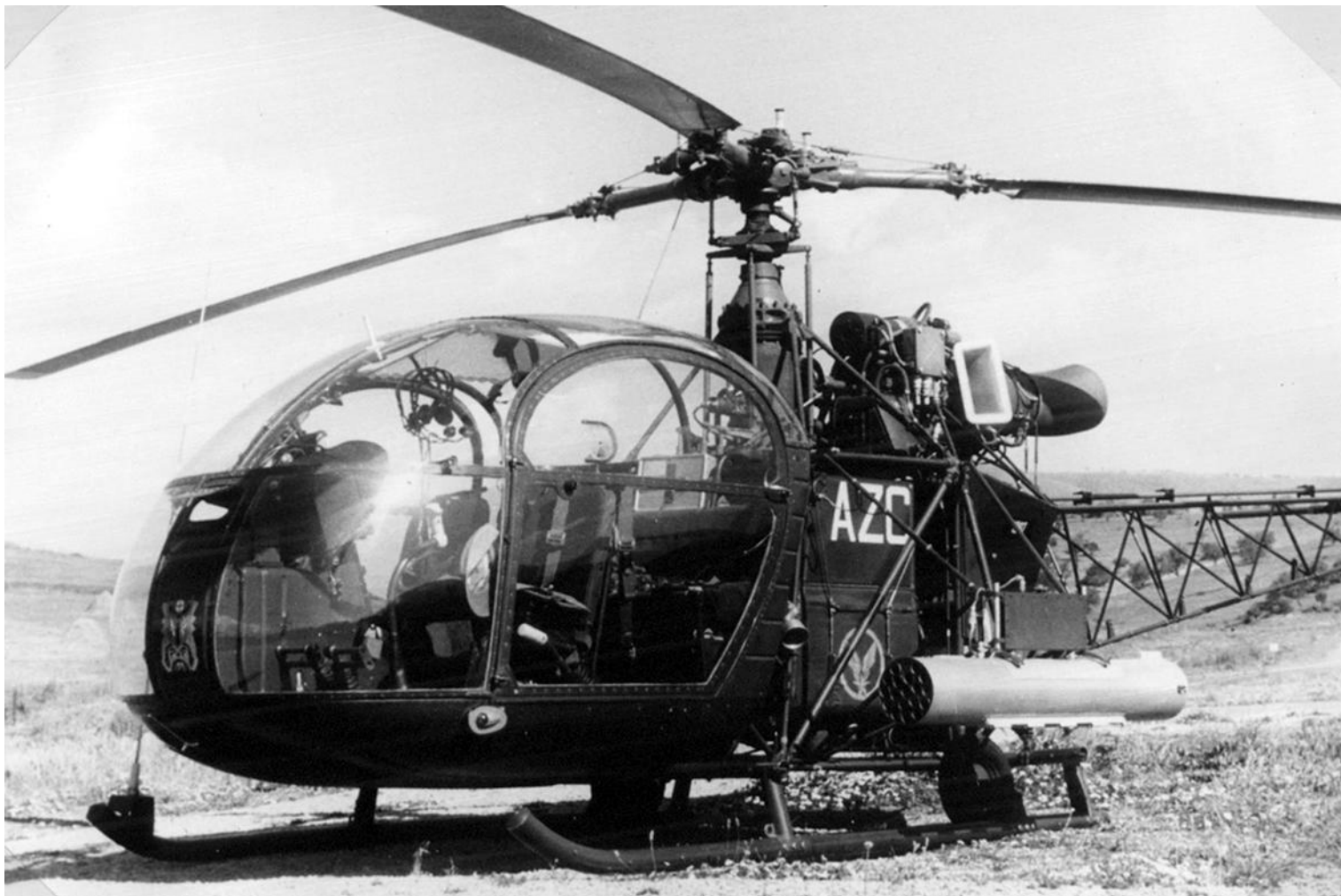
Souk-Ahras en 1959, Alouette du GH N°2 (n°1297/AZC) armée de roquettes SNEB.