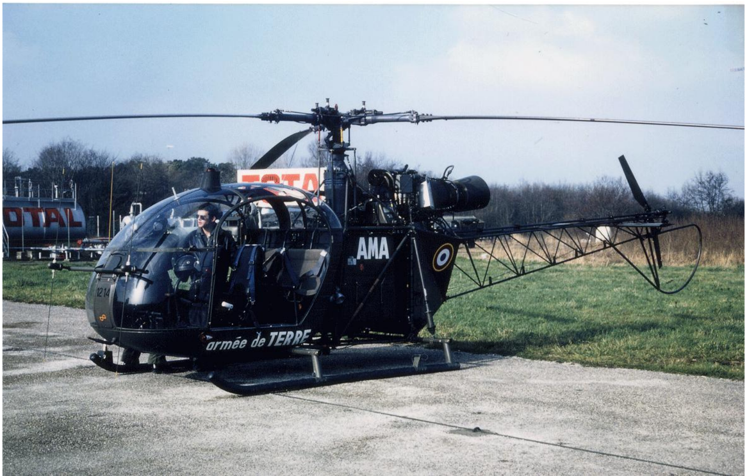
Alouette II n°1214/AMA, du 2 e GH, le 12 février 1984 au Touquet.