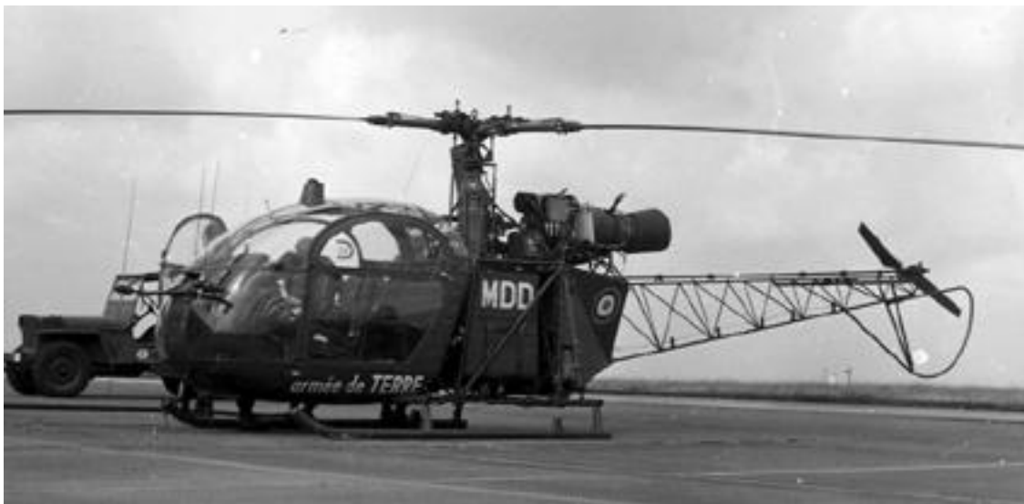
Alouette II n°1046/MDD, de l'ESAM, le 30 mars 1984.