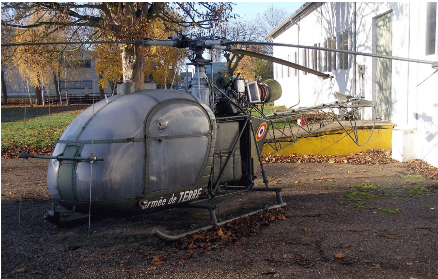
ESAM, Bourges, novembre 2009. Alouette II n°1228 en statique.