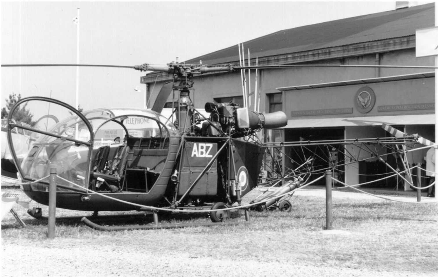
Alouette II, n°1013/12M/ABZ, du GALAT N°7, en expo, en 1959 à Nancy-Essey..