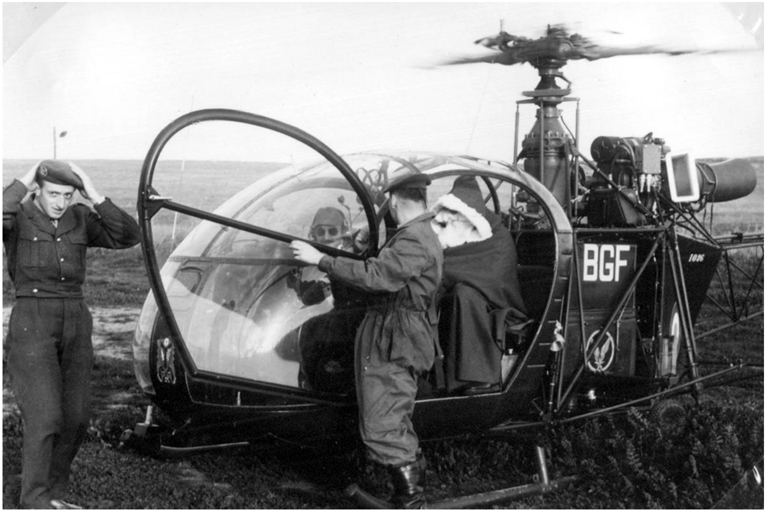
Souk-Ahras, décembre 1959, arrivée du Père Noël au 1 er PMAH de la 2 e DIM, à bord d'une Alouette détachée du GH N° 2 n°1036/BGF (photo Jean-Marie Meunier).