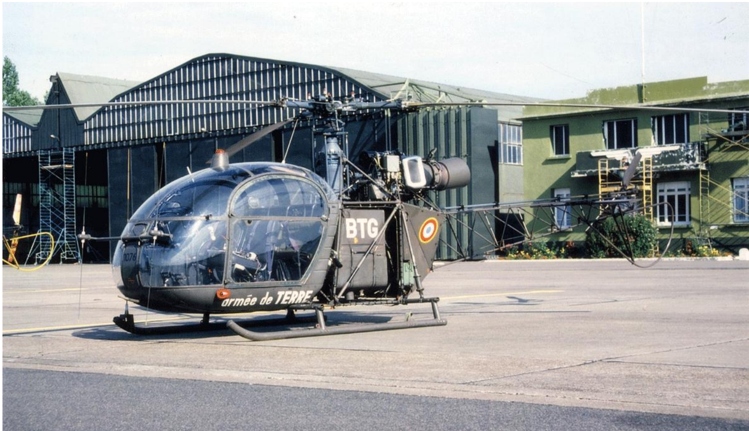
Alouette II n°1076/BTG en août 1986. au 1 er GHL.