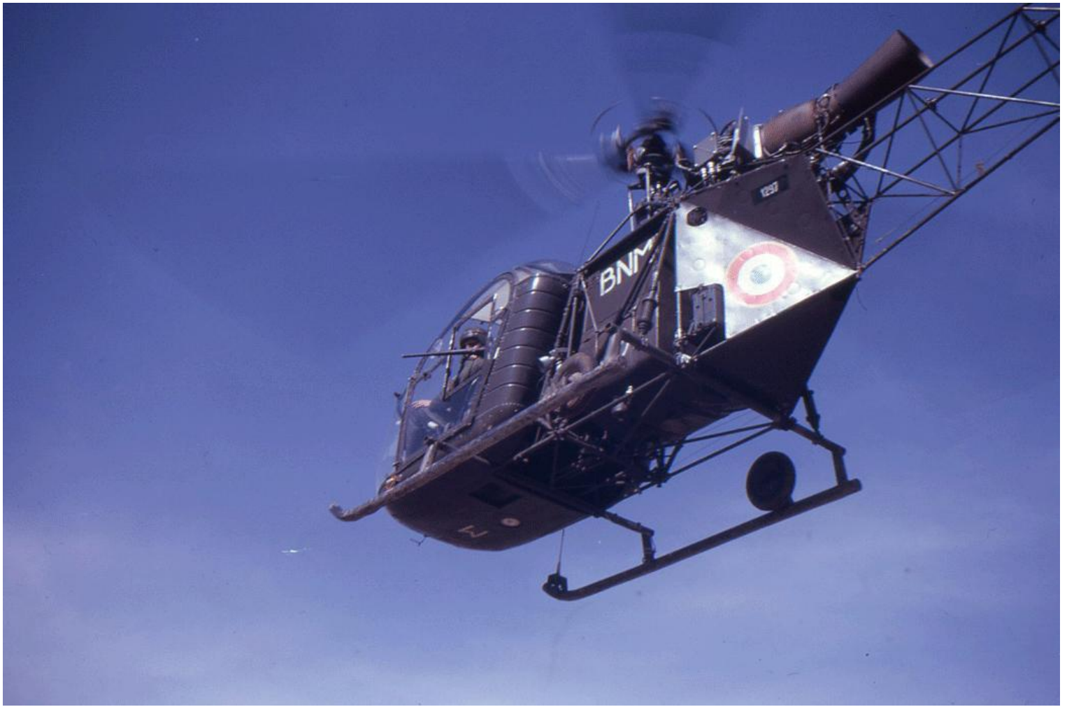
Alouette II n° 1297/BNM, du PMAH de la 19 e DI, armée, cette fois, avec une mitrailleuse AA52.