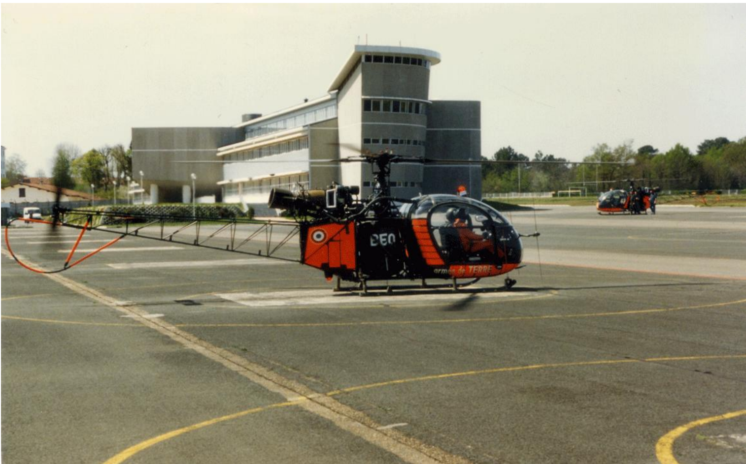
Alouette II n°1013/BEO, de l'ES.ALAT, au décollage, le 17 avril 1998 à Dax.