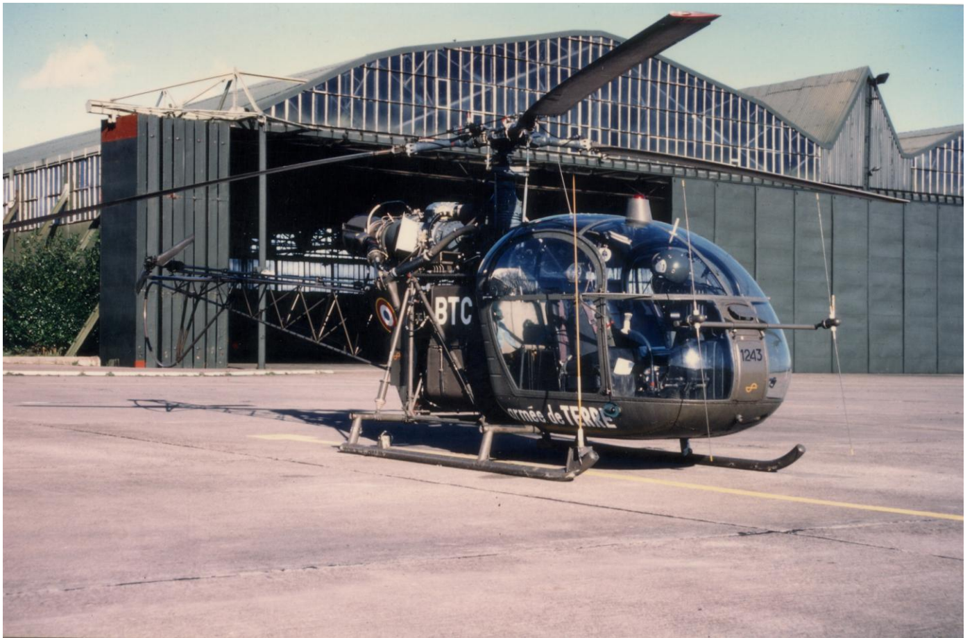
Alouette II n°1243/144M, codée BTC, du 1 er GHL, vue le 22 novembre 1986.