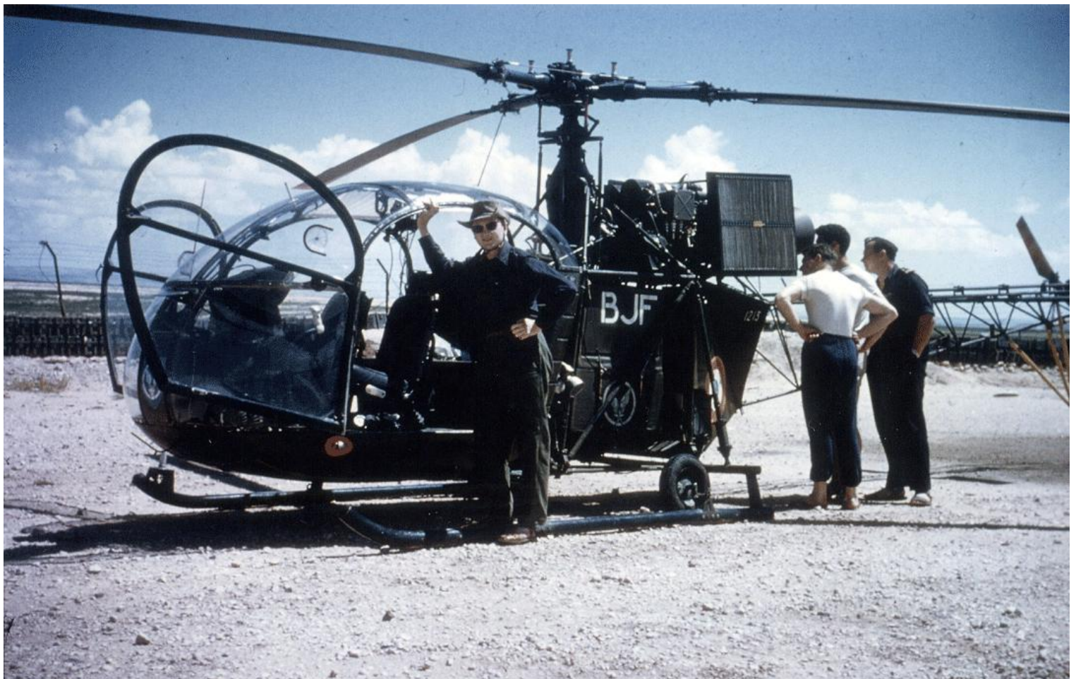
Alouette II n°1213/BJF du PMAH de la 7 e DLB.