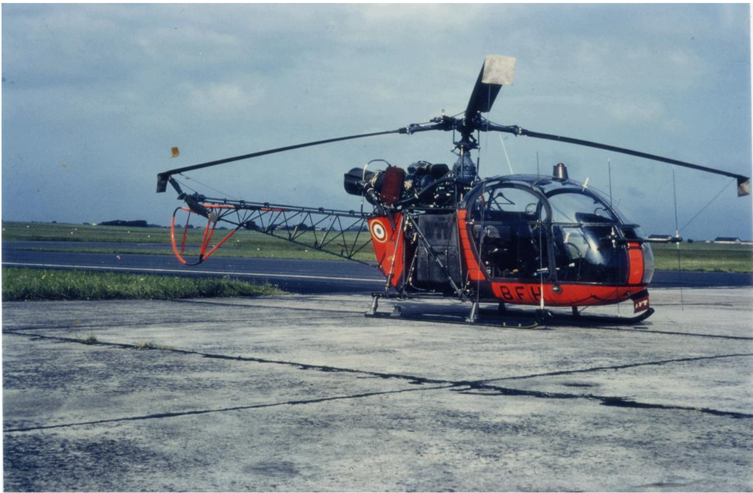
Alouette II n°1207/BFH de l'ES.ALAT, à Poitiers le 8 juin 1978.