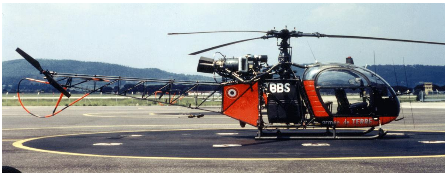
Alouette II n°1050/BBS, de l'EA.ALAT, le 26 mai 1987 au Luc.