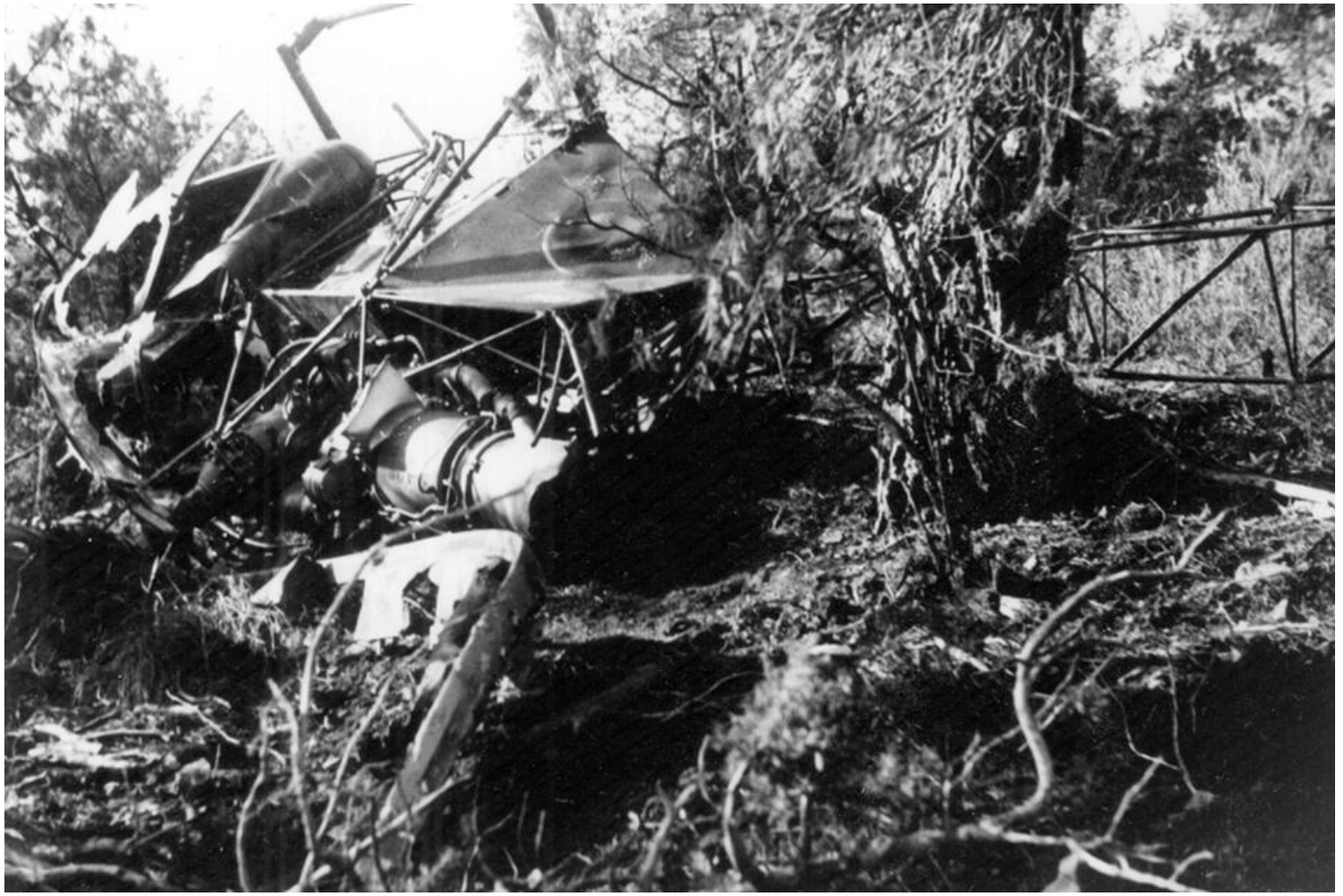
Alouette II n°1081/BNK du PMAH de la 19 e DI, détruite le 26 février 1962 à Medjane, équipage Prouteau, Moriot et Magne.