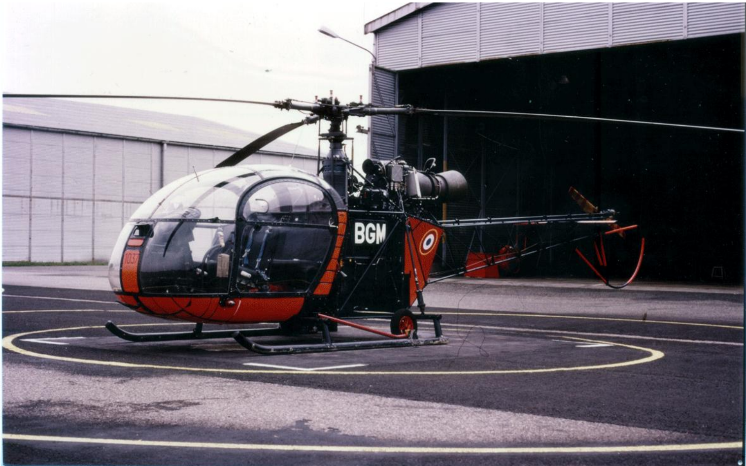
Alouette II n°1037/BGM, de l'ES.ALAT, à Dax.