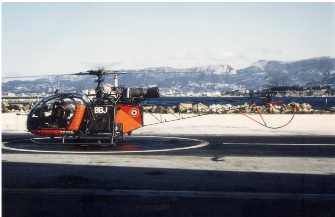
Alouette II n°1225/BBJ, de l'EA.ALAT, en avril 1992, à Saint-Mandrier.

31/12/58 sortie usine 05/01/59 EAA 601 Armée de l'Air (71) 13/04/64 ERM Versailles cession ALAT 11/05/64 EA .ALAT 12/04/65 ERGM ALAT Montauban 13/04/65 AIA Clermont-Ferrand IRAN 28/07/65 ERGM ALAT Montauban 27/10/65 GALDIV 3 02/05/66 EA .ALAT 20/11/67 9° GALAT 18/09/69 MAM Valence 02/10/69 ERGM ALAT Montauban 02/10/69 AIA Clermont-Ferrand IRAN 27/01/70 ERGM ALAT Montauban 12/03/70 SRALAT 508 23/03/70 GALDIV 8 ACO (20/04/71) 10/06/74 SRALAT 672/8 10/06/74 ERGM ALAT Montauban 11/06/74 AIA Clermont-Ferrand IRAN 01/08/74 ERGM ALAT Montauban 17/09/74 ES .ALAT ERGM ALAT Montauban 09/01/80 AIA Clermont-Ferrand IRAN 10/03/80 ERGM ALAT Montauban 22/10/80 ES .ALAT (../04/85) ES .ALAT BHC (../04/86) (../05/87) 01/09/87 ERGM ALAT Montauban 02/09/87 AIA Clermont-Ferrand EMJ 08/12/87 ERGM ALAT Montauban 29/11/88 EA .ALAT 05/12/89 AERM Le Cannet 22/01/90 EA .ALAT 06/07/91 AERM Le Cannet 13/01/92 EA .ALAT BBJ (01/04/92) 10/04/93 AERM Le Cannet 01/06/93 EA .ALAT BBJ (06/04/94) (25/09/94) (04/05/97) 28/04/97 ETAMAT Montauban ../... réformé avec .... heures