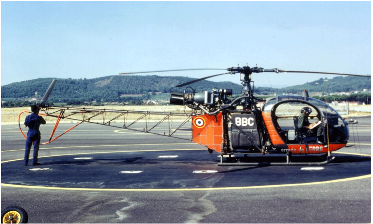
Alouette II n°1332/BBC, de l'EA.ALAT, en septembre 1985 au Luc.