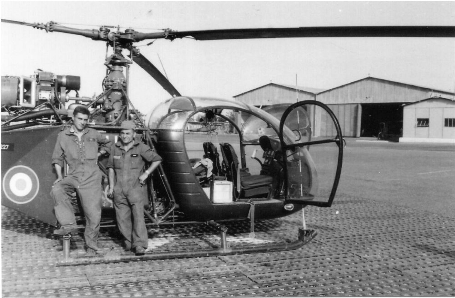
Batna, 1960, PMAH de la 21 e DI. Les mécaniciens hélicos devant l'Alouette II n°1227/BUY.