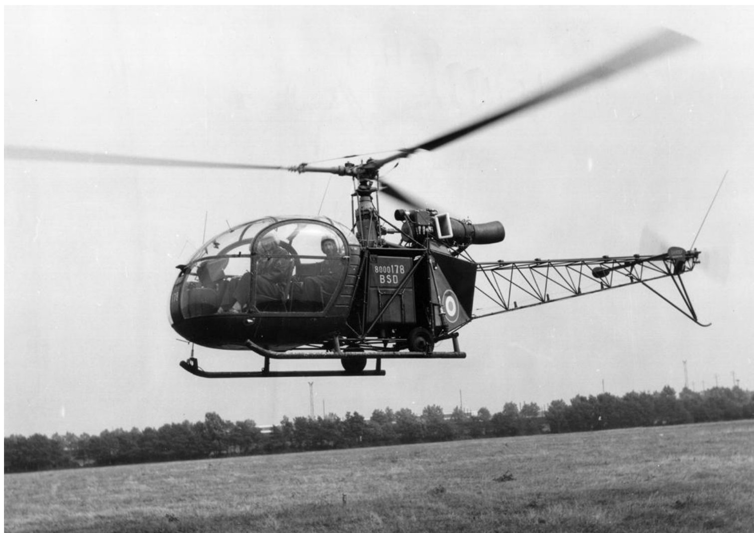
GH N°1, Alouette II n°1013/BSO (8 000 178).