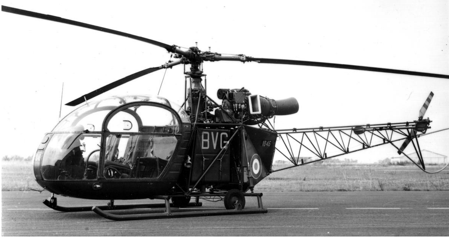
Alouette II n°1046/BVG, de l'ES.ALAT, à Dax (photo Jacques Buffet).