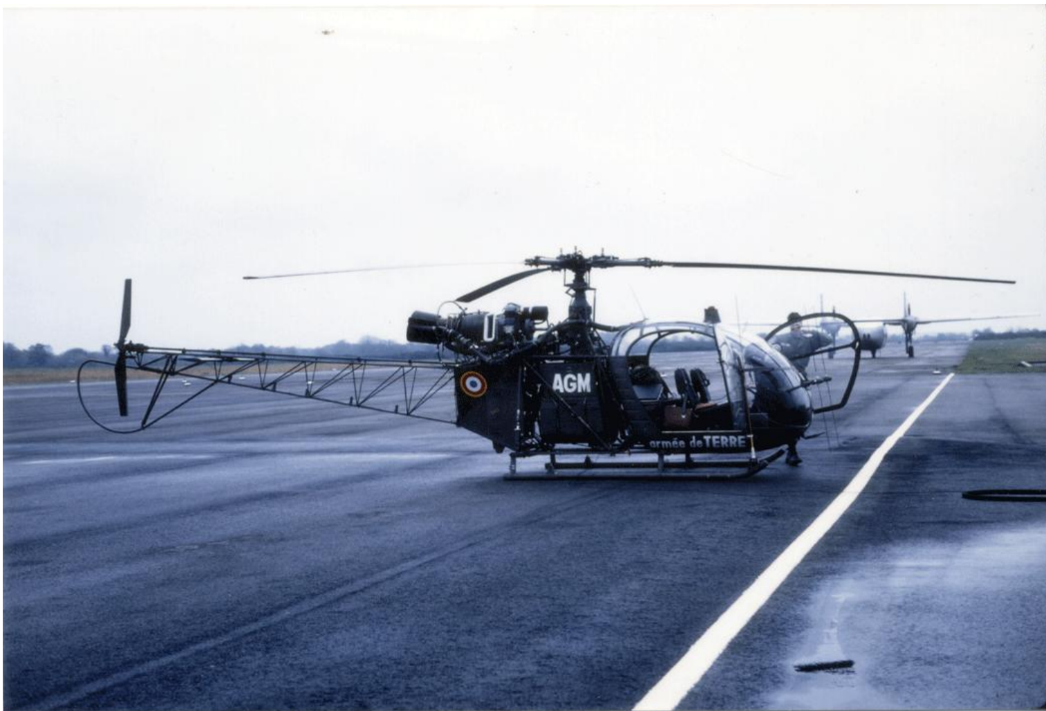
Alouette II n°1038/AGM, du 3 e GH, de passage à Vannes, le 18/ novembre 1981.

25/05/62 ERGM ALAT Montauban 09/07/62 ES. ALAT (../11/62) BVN 29/06/64 ERM Versailles 29/06/64 AIA Clermont IRAN 03/12/64 ERGM ALAT Montauban 04/05/65 E-EAABC 05/08/68 GALDIV 7 27/08/69 ERGM ALAT Montauban 27/08/69 AIA Clermont IRAN 08/01/70 ERGM ALAT Montauban 05/02/70 ES. ALAT 18/10/73 ERGM ALAT Montauban 19/10/73 AIA Clermont EMJ 19/12/73 ERGM ALAT Montauban 26/02/74 GALDIV 4 CXC (26/05/74) (21/11/74) (22/11/74) 15/01/76 ES. ALAT 09/01/80 AIA Clermont EMJ 01/04/80 ERGM ALAT Montauban 27/08/80 11° GH 22/11/85 ERGM ALAT Montauban 07/01/87 ERM Le Luc 18/05/87 EA. ALAT BBS (26/05/87) (../02/88) 27/04/88 AERM Le Cannet 06/07/88 EA. ALAT 16/01/89 ERGM ALAT Montauban ../... réformé avec .... heures 1058 54M SE3130 15/04/57 ALAT (16) ?? ACS ES. ALAT (../10/58) (../12/58) ES. ALAT 19/04/60 BVI détruit le 19/04/60 au sud-est du pic de la Torra d'Err. ES. ALAT (../12/59) 11/03/61 réformé avec .... heures