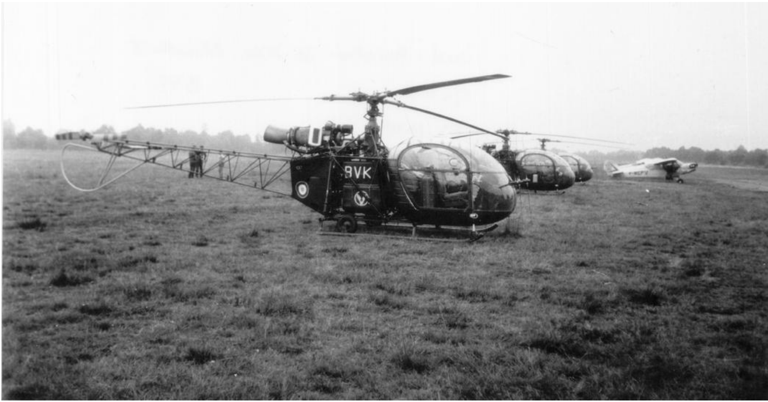
Alouette II n°1017/BVK, de l'ES.ALAT, de passage en septembre 1963 à Pau-Idron.