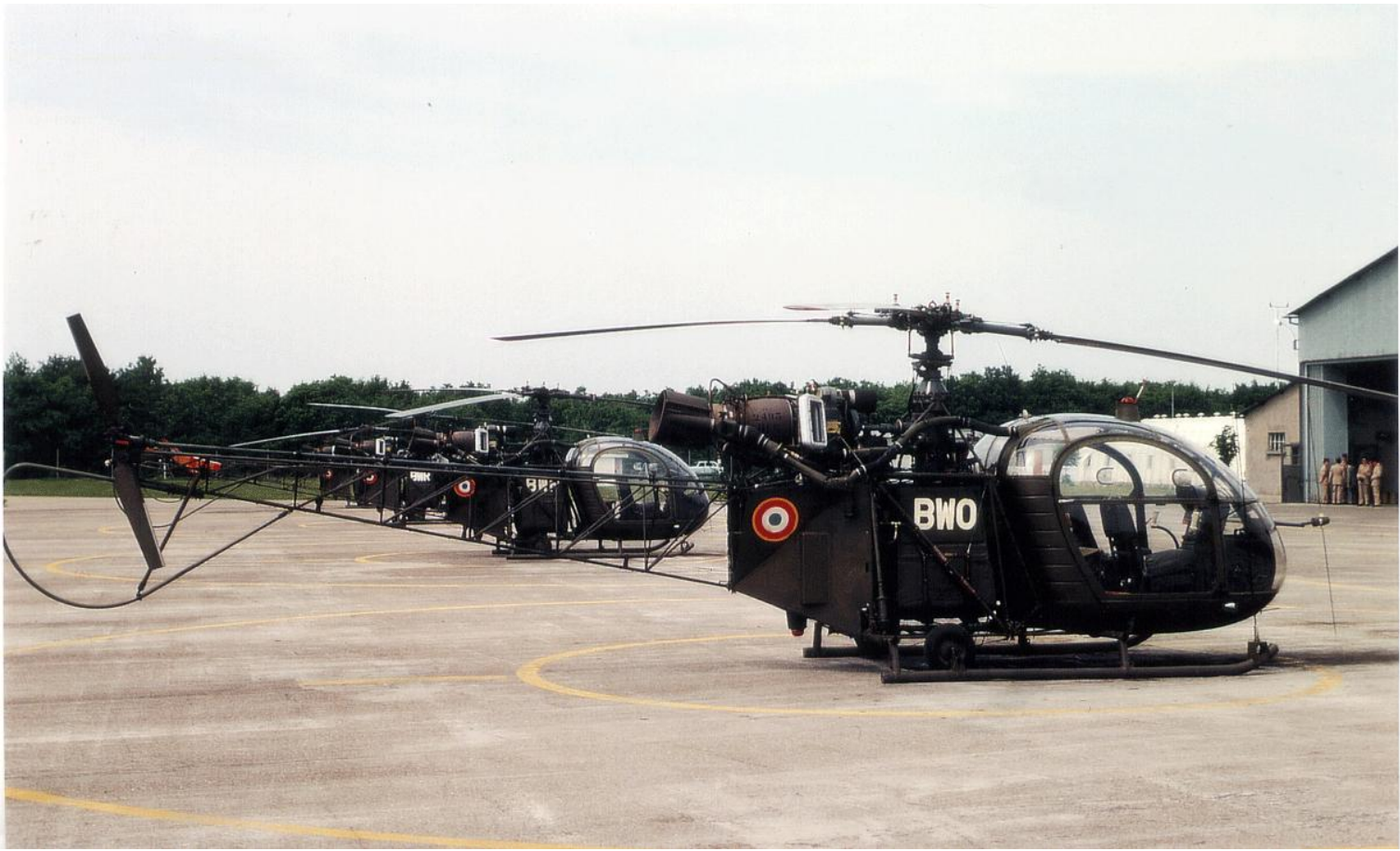
Alouette II n°1060/BWO. du Galdiv 7, sur le parking d'Habsheim en 1971.