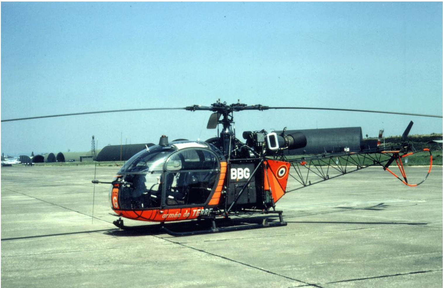
Alouette II n° 1172/BBG, de l'EA.ALAT en 1986.