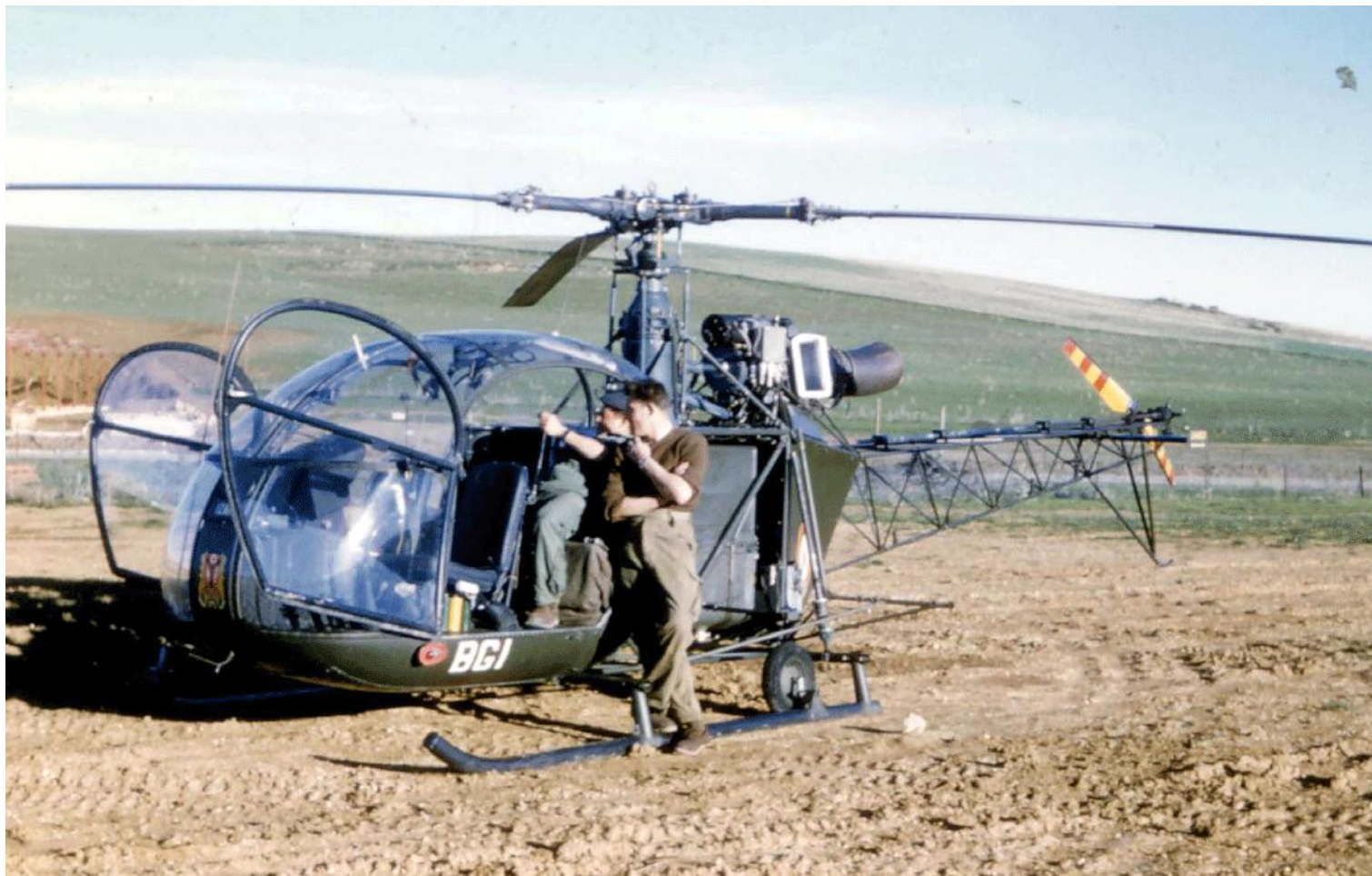
Souk-Ahras 1959, Alouette II n°1073/BGI du GH N°2.