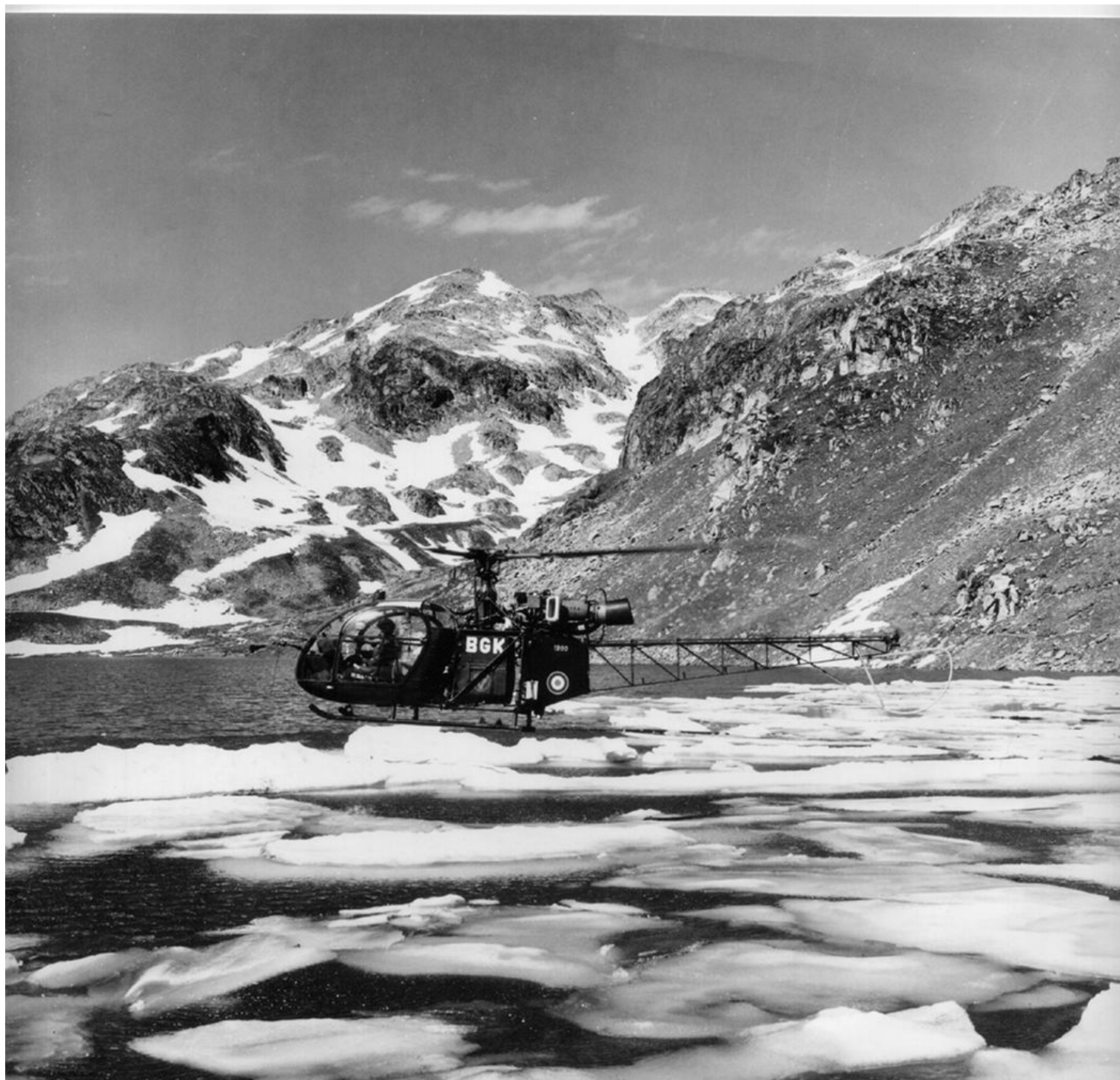
Alouette II n°1200/BGK du PMAH de la 27 e DA, au col des Sept Laux, dans le massif de Belledonne.

29/05/72 GALDIV 4 (20/05/73) GALDIV 4 CXD 07/06/77 ERGM ALAT Montauban 08/06/77 AERM Bruz 12/07/77 3° GALREG 01/08/78 3° GHJ AGG (../08/78) 26/12/78 DSALAT Bruz 27/12/78 ERGM ALAT Montauban 02/01/79 AIA Clermont-Ferrand IRAN 02/04/79 ERGM ALAT Montauban 14/09/79 ES .ALAT BFG (05/05/84) ES .ALAT 22/01/86 ERGM ALAT Montauban 23/01/86 AIA Clermont-Ferrand EMJ 30/04/86 ERGM ALAT Montauban 25/11/87 1 er GHJ 29/08/88 AERM Les Mureaux 26/09/88 1 er GHJ 18/12/89 ERGM ALAT Montauban 22/09/92 AERM Dax 09/12/92 ES .ALAT 17/06/93 ERGM ALAT Montauban ../.../.. réformé avec .... heures