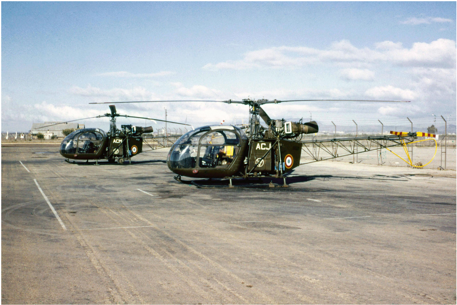
Alouette II n° ?/ACJ et n° 1172/ACM du 1 er PMAH RG à Sidi-bel-Abbès, en 1962.