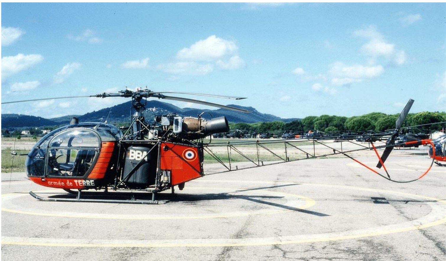
Alouette II n°1123/BBA, de l'EA.ALAT, le 25 septembre 1994, au Luc.