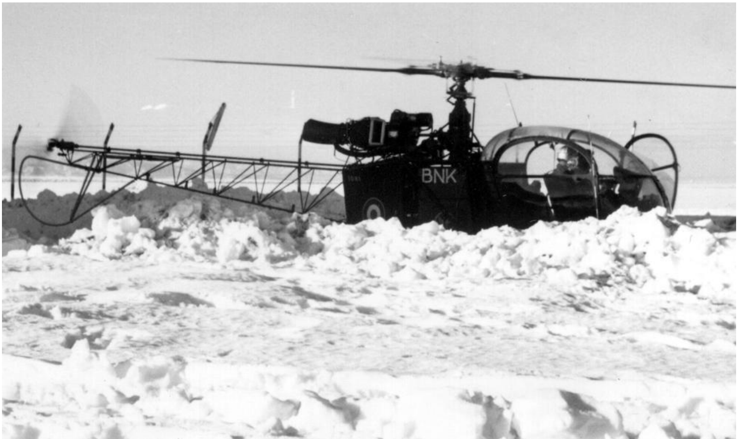
PMAH de la 19 e DI, Sétif durant l'hiver 1961/62, l'Alouette II n°1081/BNK sous la neige (photo Jean-Pierr Meyer).