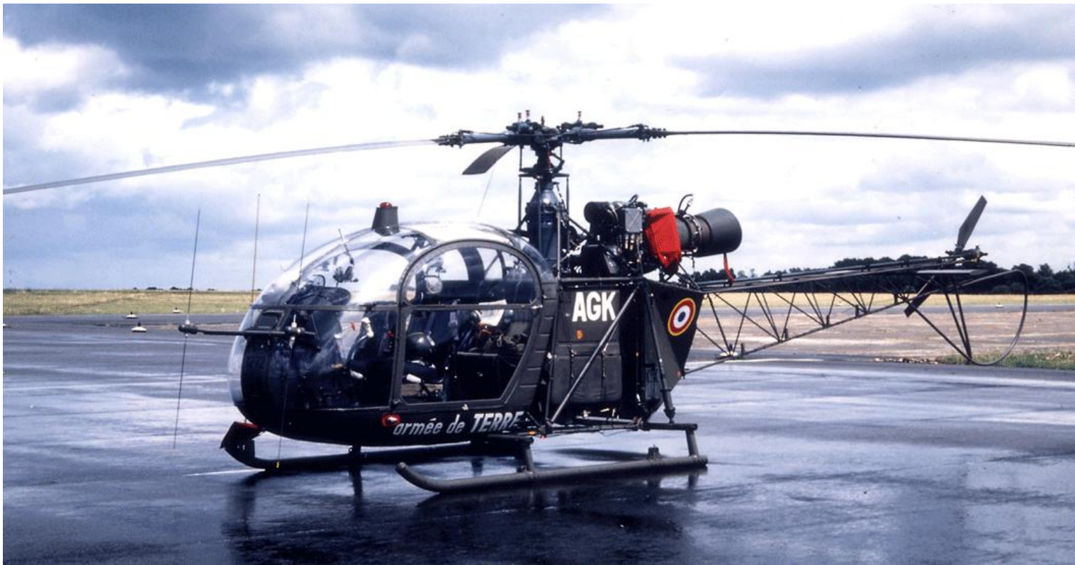
Alouette II n°1272/AGK du 3 e GHL le 3 août 1984 à Vannes (photo Alain Gosset).