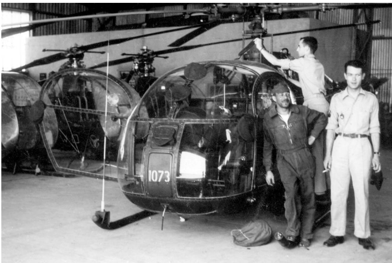
1 er PMAH de la 13 e DI à Méchéria en 1961. L'Alouette II n°1073, perçue le 9 juin 1961, avec le mécanicien Jolibois.