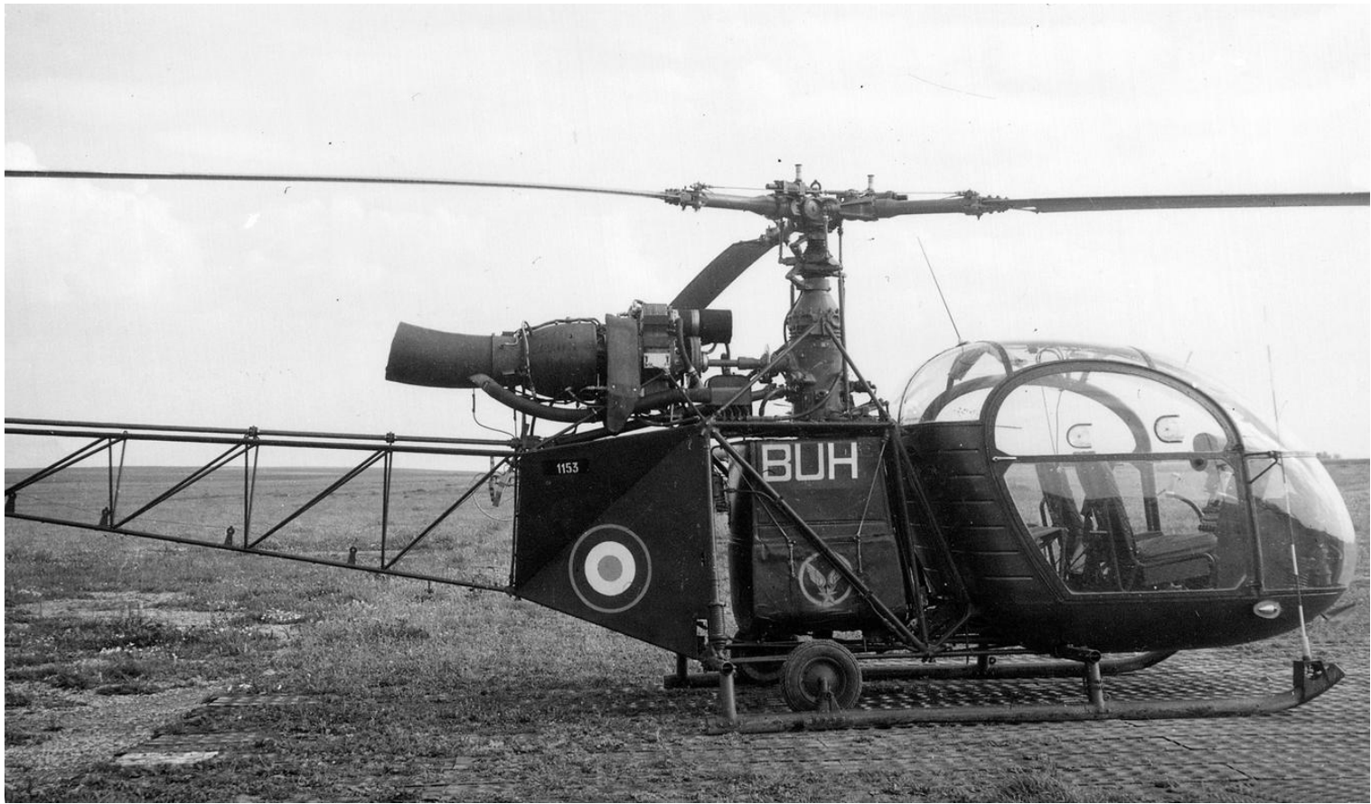
Alouette II n°1153/BUH, du PMAH de la 21 e DI, le 7 mai 1960, à Sétif. (photo Bernard Chenel).