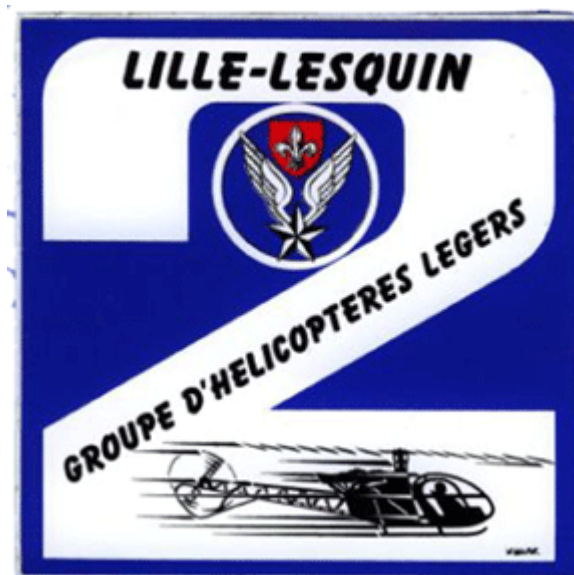
2 e GHIL