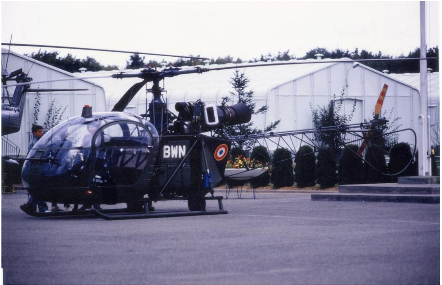
Alouette II n°1132/BWN du Galdiv 7, à Habsheim en septembre 1972.