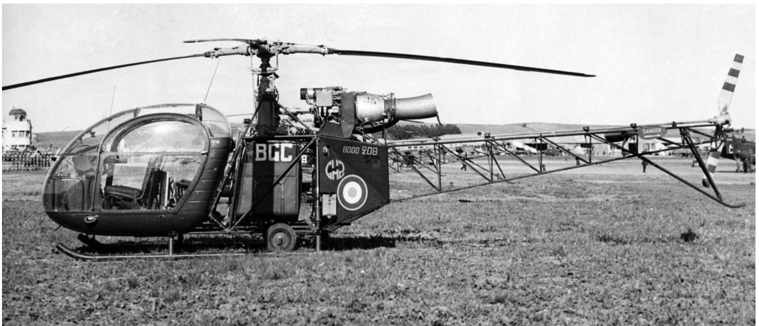
Alouette II n° 1019/BGC du GH N°2.