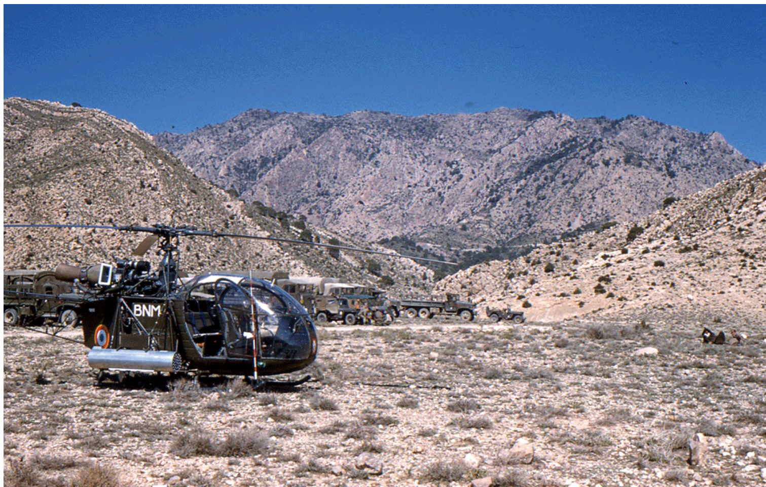
La même Alouette II n° 1297/BNM, du PMAH de la 19 e DI, armée avec un panier lance-roquettes Matra LR 361 avec 36 roquettes de 37 mm. (photo François de Pitray).