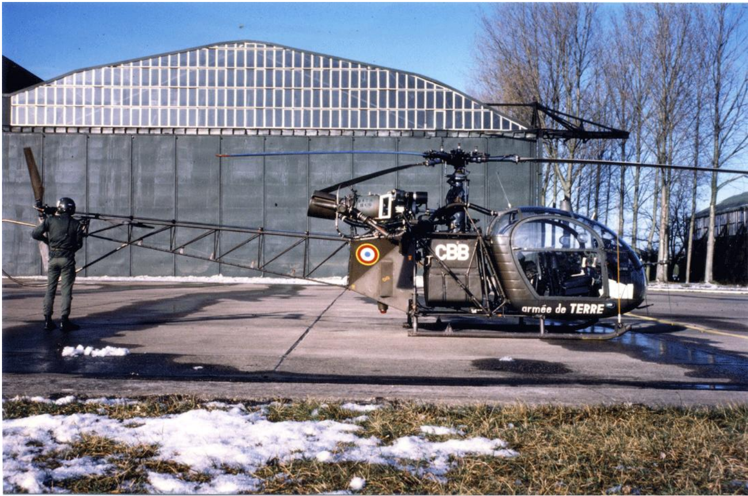
Alouette II n° 1240/CBB, de l'EALAT.EAABC, le 29 janvier 1987.