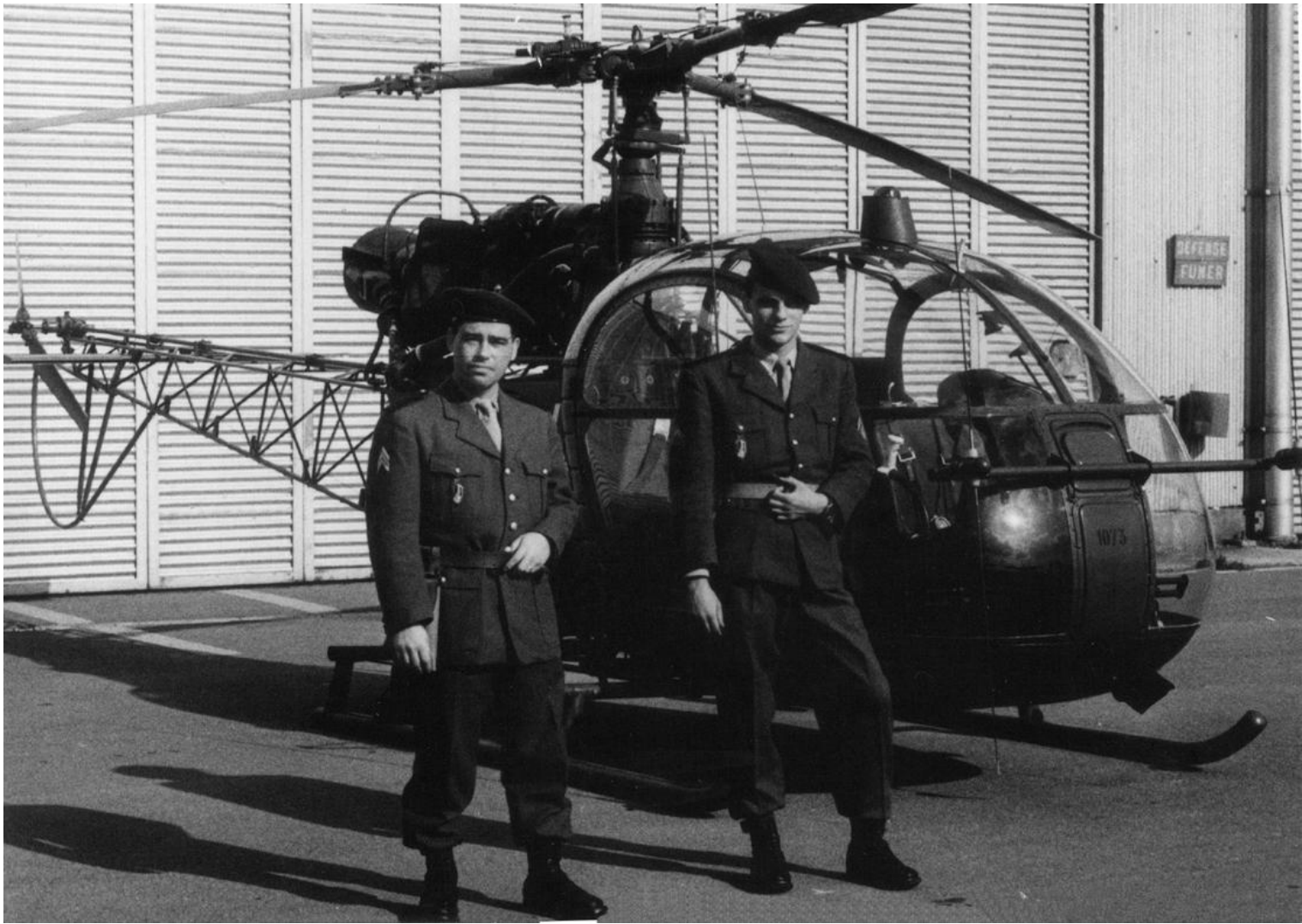
Lille-Lesquin, 11 octobre 1966. Alouette II n°1073 du 2 e GALAT.