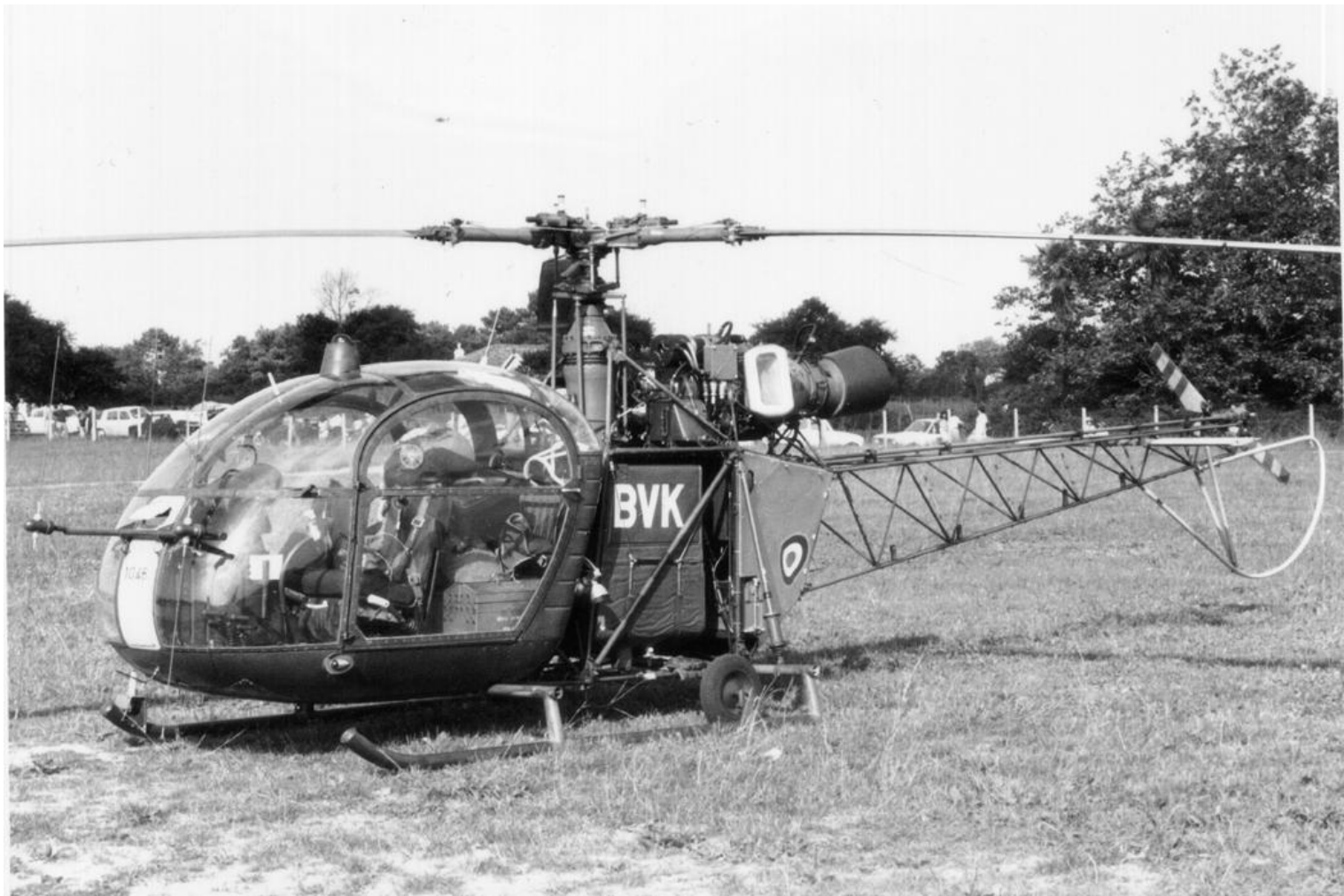
Alouette II n°1046/BVK, de l'ES.ALAT.