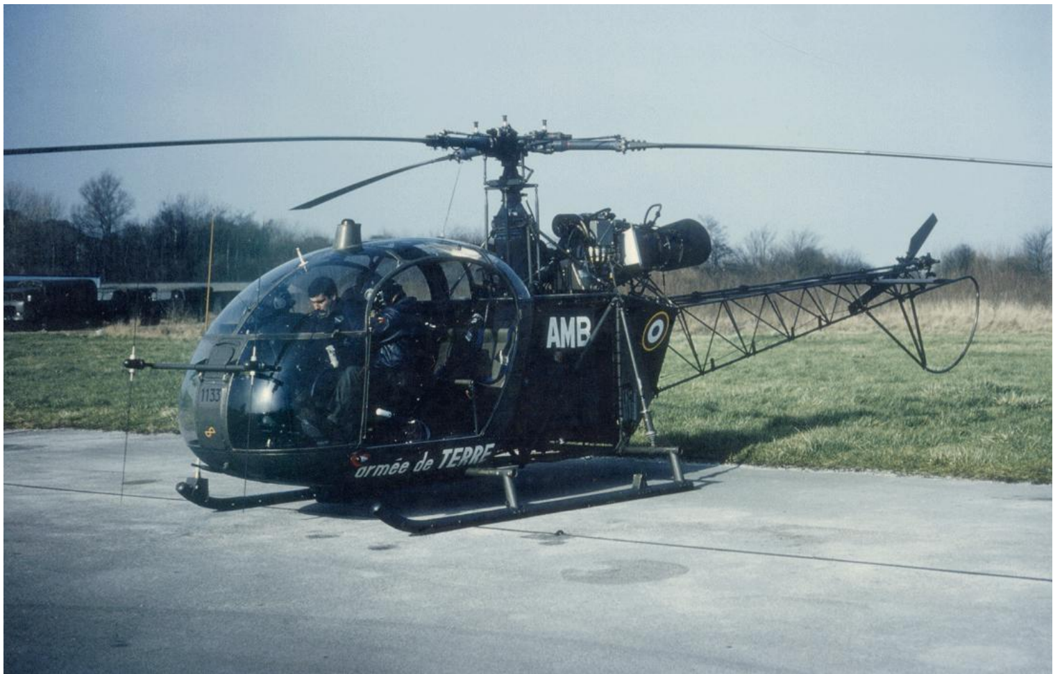
Alouette II n°1133/AMB, du 2 e GHIL, de passage au Touquet, le 12 février 1984.