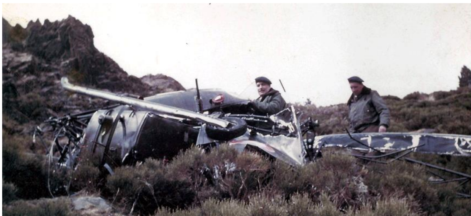
Alouette II n°1058/BVI, de l'ES.ALAT, accidentée le 19 avril 1960, au sud-est du pic de la Torra d'Err.