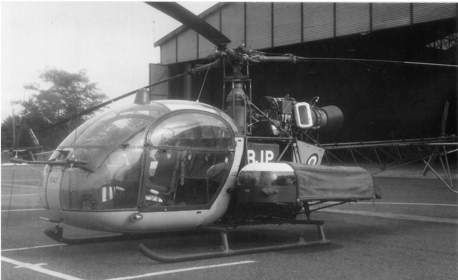
Alouette II n°1142/BJP, de l'ES.ALAT, équipée avec un plateau "Siren".