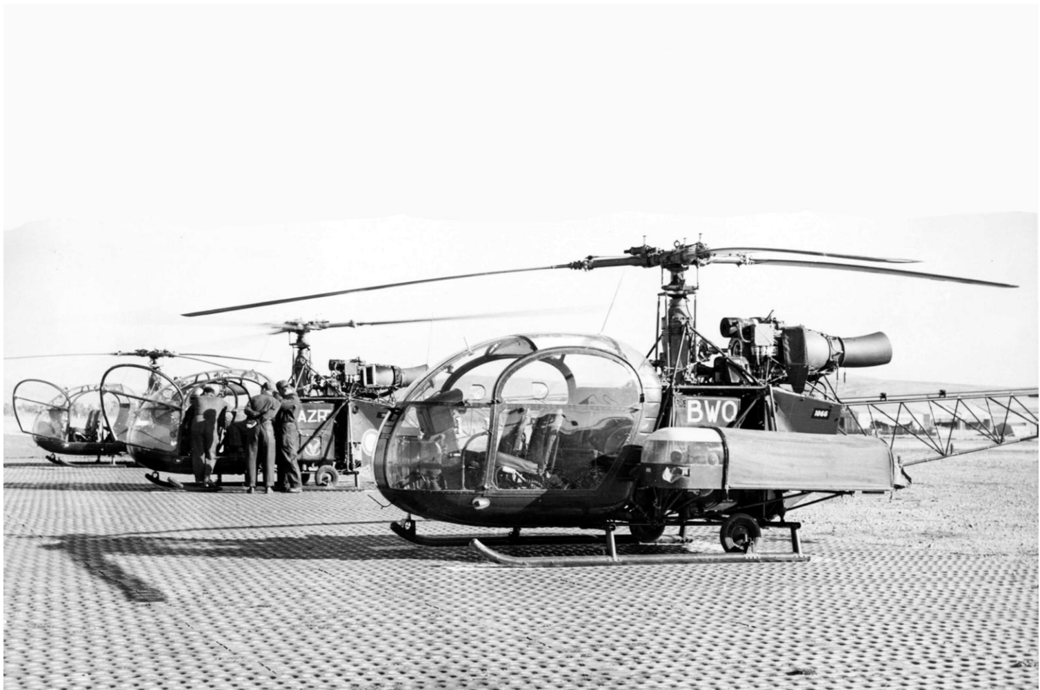
Alouette II n° 1066/BWO du PMAH de la 11 e DI, à Sétif en 1961 (photo Jacques Barraquier).