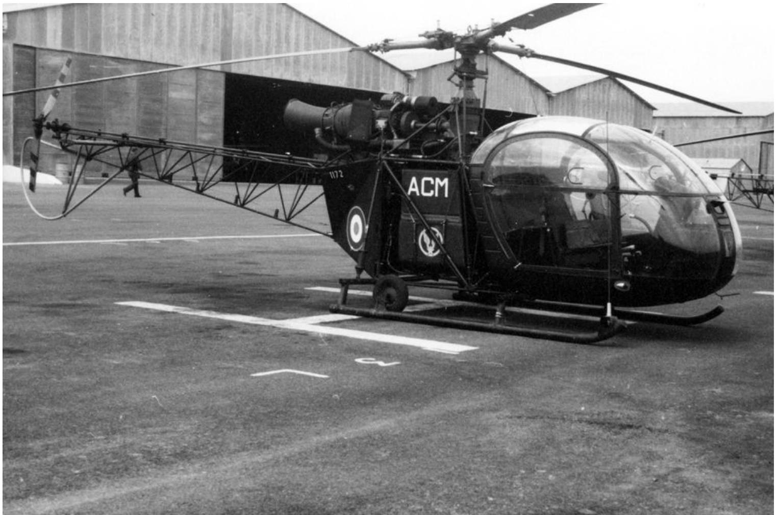
Chérégas, en 1961, Alouette II n°1172/ACM du 1 er PMAH RG.