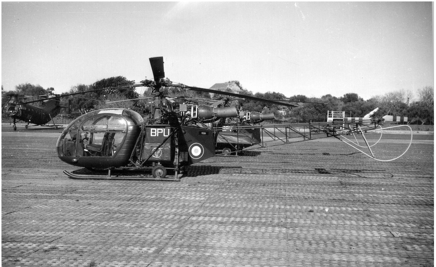
Alouette II n° 1320/BPU, du PMAH de la 25 e DP, le 4 mars 1960 à Djidjelli.

accidenté le 06/02/70. Lors d'une séance d'entraînement, l'appareil percute le sol à Connectancourt (60) et est endommagé au 4 e échelon. 25/02/70 508 SRALAT 06/03/70 AIA Clermont-Ferrand IRAN 07/07/70 ERGM ALAT Montauban 26/08/70 ERM Toul 10/09/70 GALDIV 8 03/07/72 508 SRALAT convoyage voie routière 20/07/72 AIA Clermont-Ferrand IRAN 27/10/72 ERGM ALAT Montauban 16/01/73 672/7 SRALAT 23/01/73 GALDIV 7 BWK 09/06/75 ERGM ALAT Montauban 09/09/75 ESAM M?? (../10/75) (../03/77) 24/03/77 AERM 28/04/77 E-EAT CDN 30/07/77 E-EAABC 24/04/79 ERGM ALAT Montauban 09/07/79 ES .ALAT 12/05/80 ERGM ALAT Montauban 12/05/80 AIA Clermont-Ferrand IRAN 10/07/80 ERGM ALAT Montauban 27/01/81 EA .ALAT 24/05/82 AERM Le Luc 16/09/82 EA .ALAT 23/09/83 AERM Le Luc 03/11/83 EA .ALAT 24/11/84 AERM Le Luc 11/02/85 EA .ALAT 01/03/85 AERM Le Cannet 18/03/85 EA .ALAT BBC (../09/85) 10/06/86 AERM Le Cannet 29/05/87 EA .ALAT BBC (../10/87) 25/03/88 AERM Le Cannet 16/05/88 EA .ALAT 04/01/89 ERGM ALAT Montauban ../.../.. réformé avec .... heures