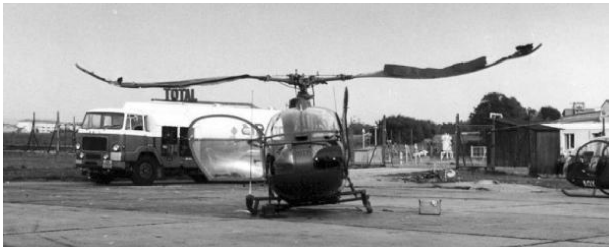
Alouette n°1017/AQx, du 4 e GALREG, accidentée en 1978.