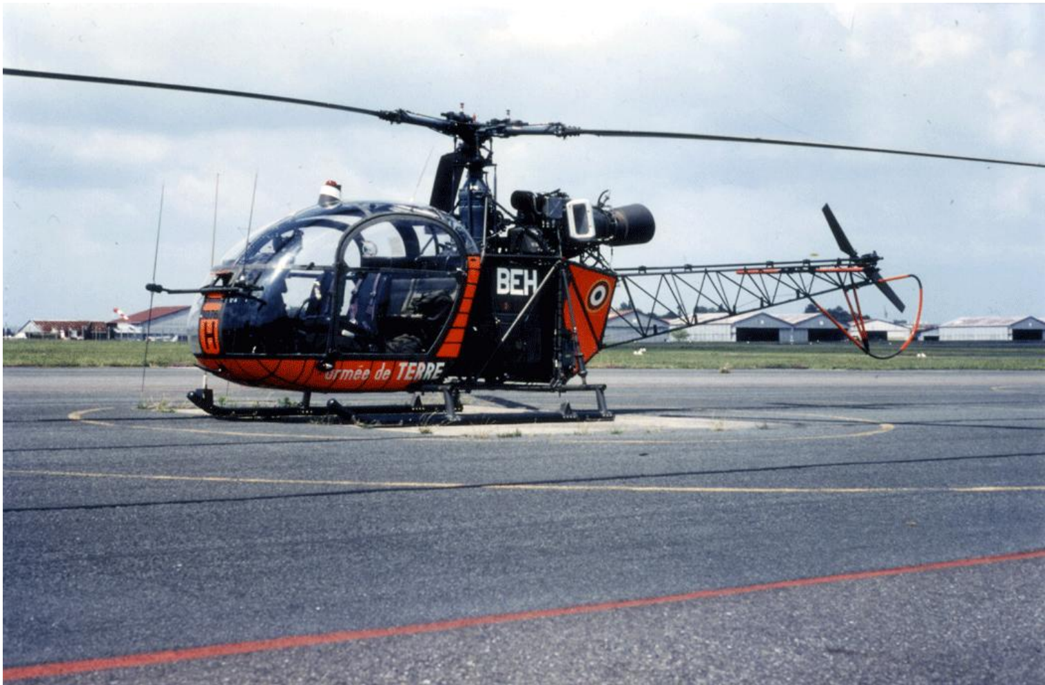
Alouette II n°1076/BEH, de l'ES.ALAT, en juin 1995.