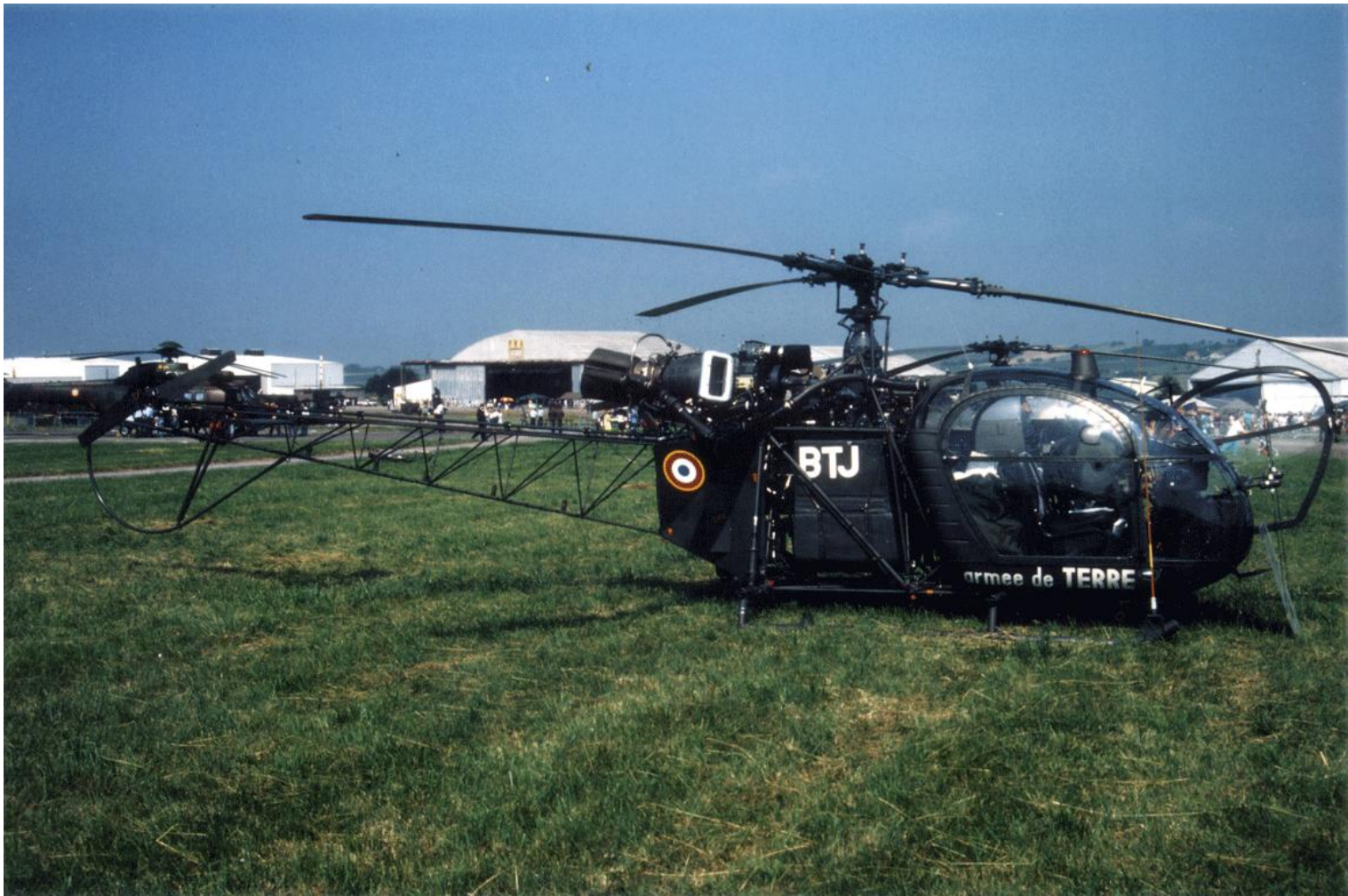
Alouette II n°1270/BTJ, du 1 er GHL, le 17 juin 1987 aux Mureaux.