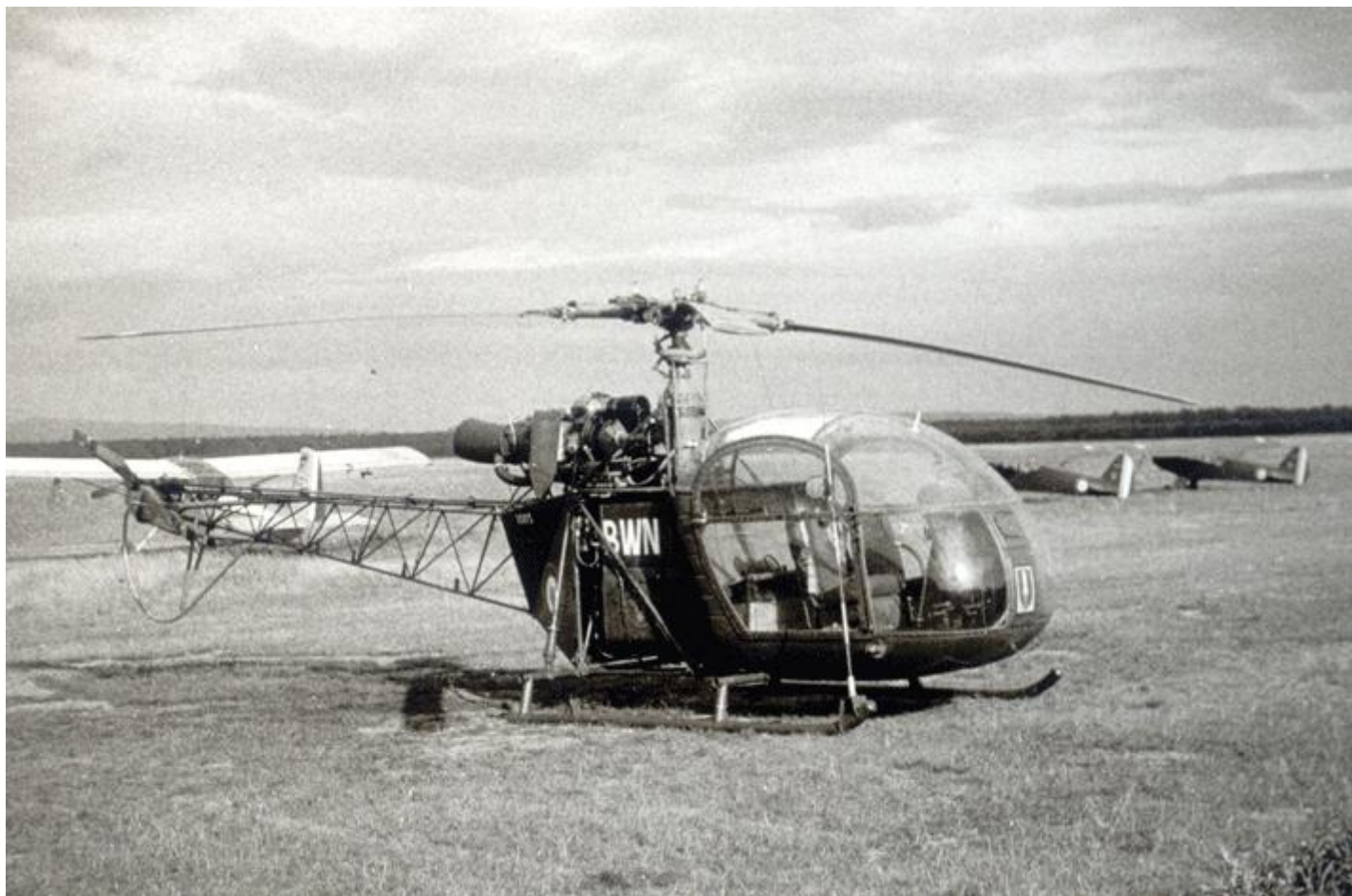
Alouette II n°1003/BWN du Galdiv 7, vue à Habsheim en 1963.