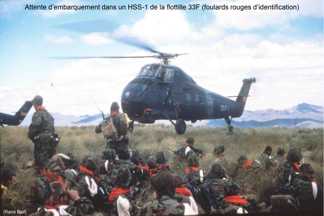
Attente d'embarquement dans un HSS-1 de la flottille 33F (foulards rouges d'identification)