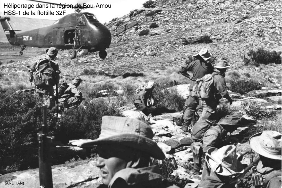
Hélicoptère dans la région de Bou-Amou HSS-1 de la flottille 32F