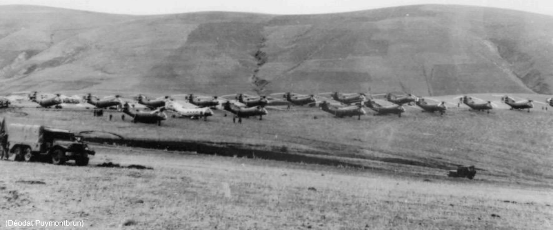
Trois DIH de H-21 du GH 2 réunies sur l'aire d'embarquement