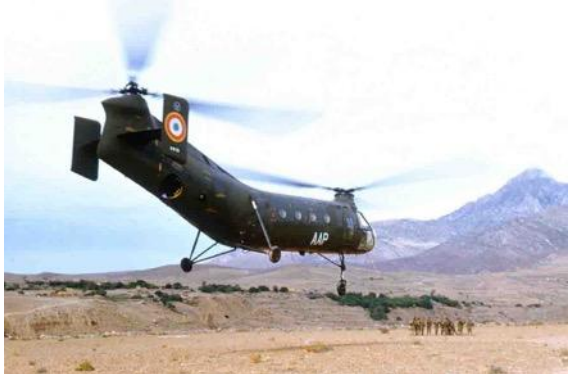
Embarquement en UIH de H-21 du GH 2