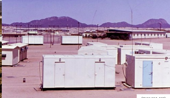
In-Amguel – Logements des civils à Oasis 2