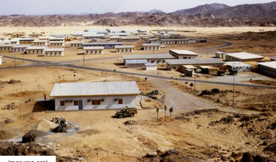
In-Amguel – Base des civils à Oasis 2