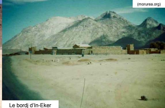
Le bordj d'In-Eker