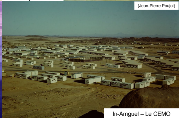
In-Amguel – Le CEMO