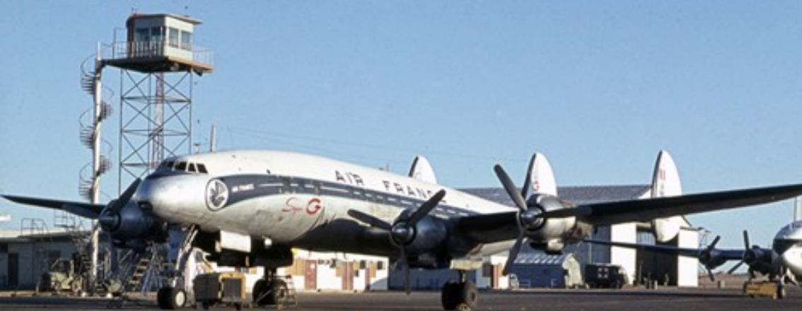
Constellation à In-Amguel en 1963, devant un Breguet Deux-Ponts