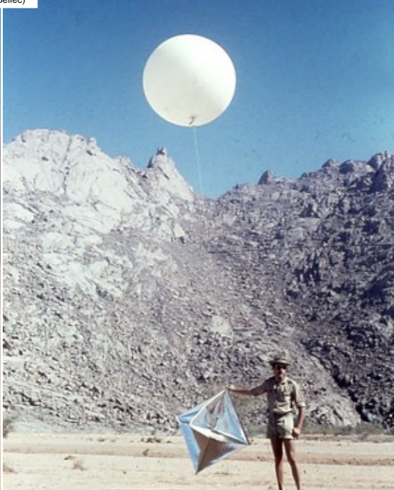
In-Eker – Préparation du lancement d'un ballon-sonde