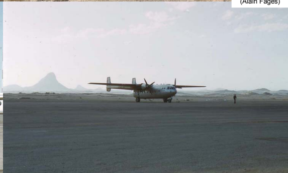
Noratlas et C-47 sur l'aérodrome d'In-Anguel en 1962