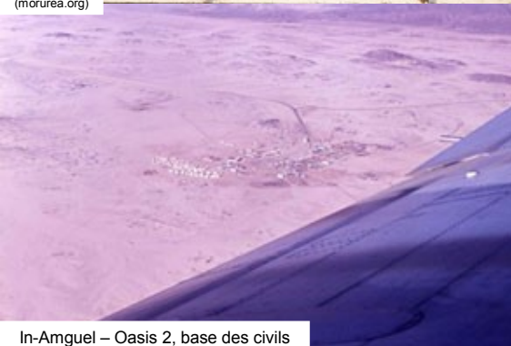
In-Amguel – Oasis 2, base des civils