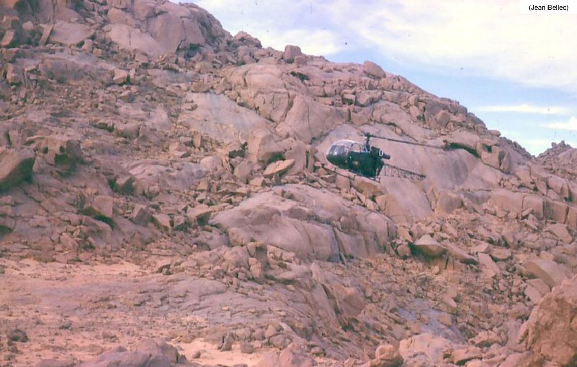
Alouette de l'armée de l'Air en mission topographique dans le djebel Teferkit en 1961