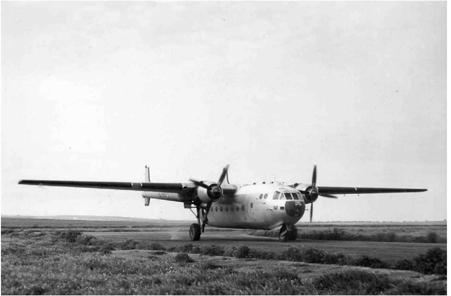
▲ ▼ Le Noratlas à La Sénia, avant le saut à Mostaganem-Khalifa le 28 avril 1960, et l'embarquement