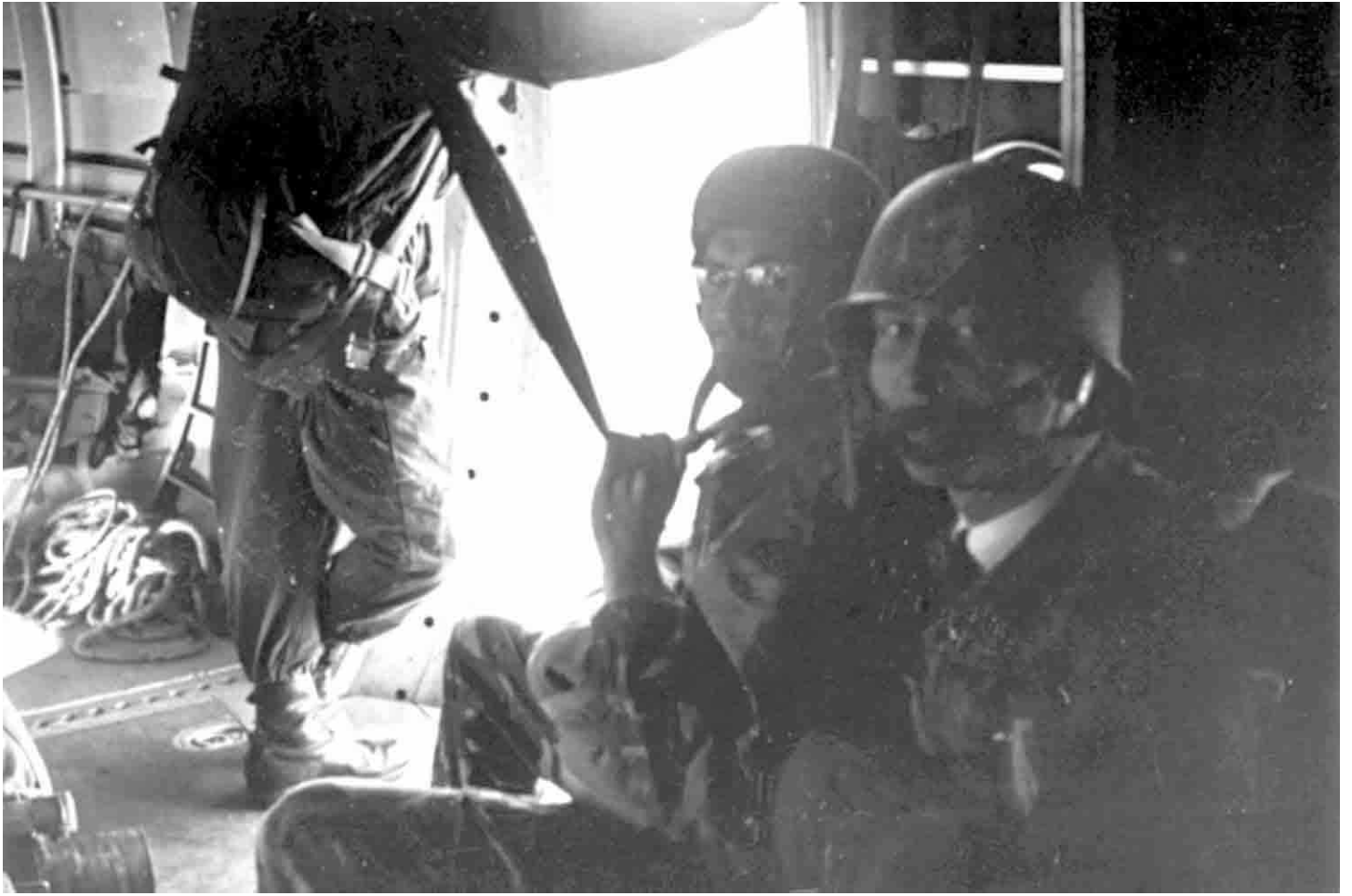
▲ ▼ Dans le Noratlas