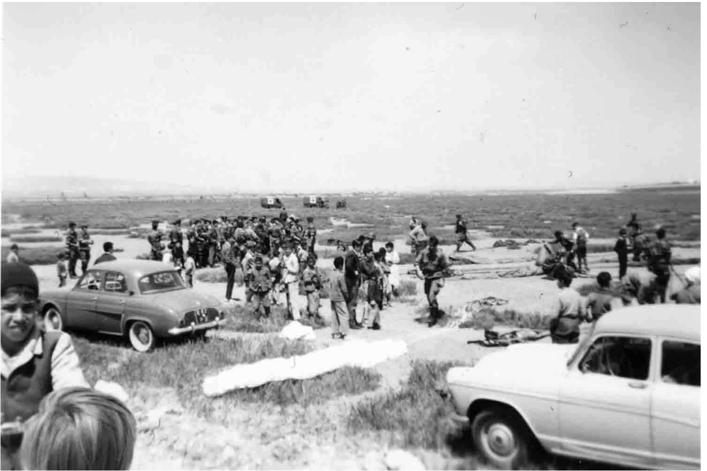
▲ Noisy-les-Bains le 5 mai 1960