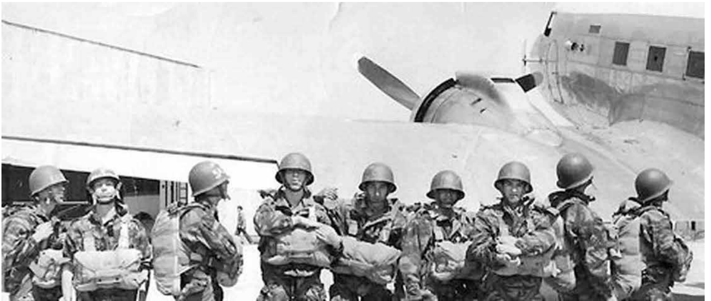
▲ ▼ L'arrivée à Khalifa du C-47 d'Aérotec affrété par l'armée et l'installation dans l'avion le 5 mai 1960