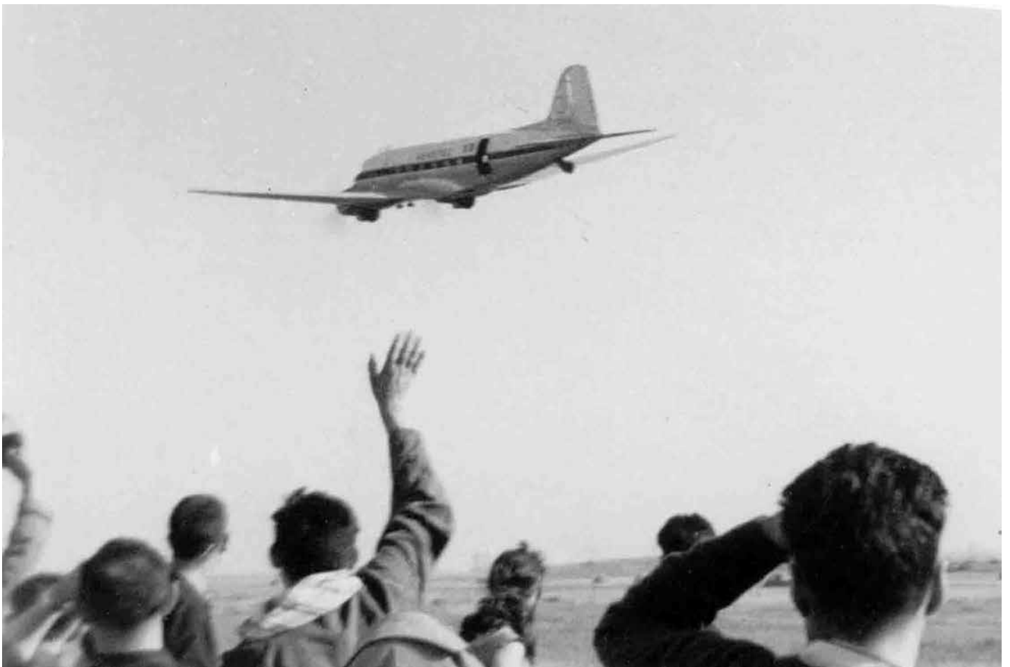
▼ Le C-47 d'Aérotec passe sur la DZ de Noisy-les-Bains en guise d'adieu