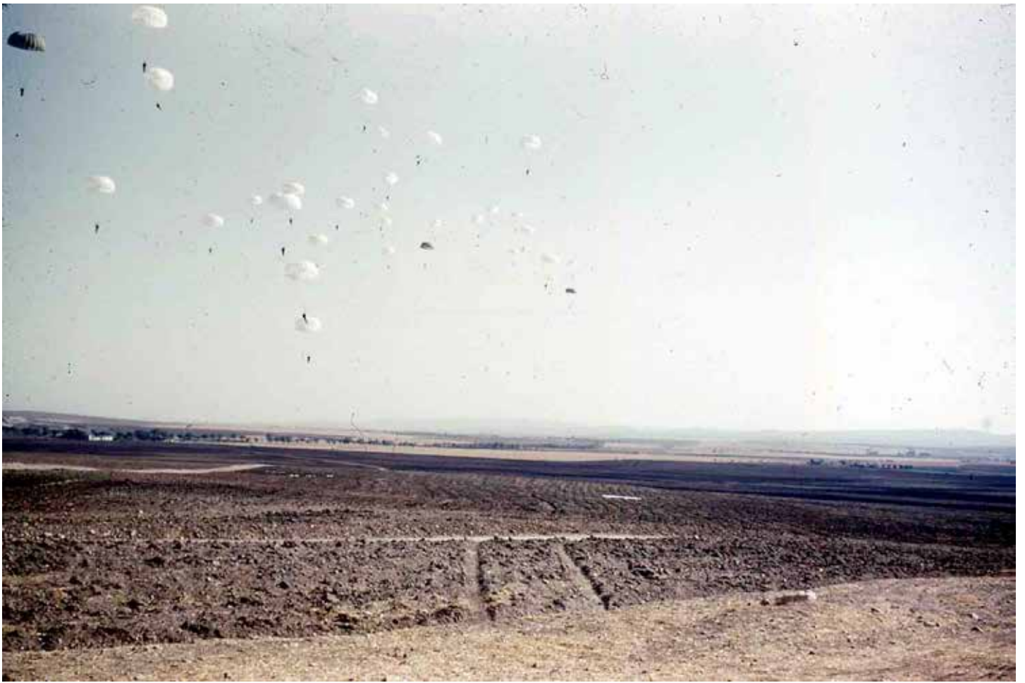
▲▼ Sauts pré-militaires à Sidi-Bel-Abbès et à Valmy