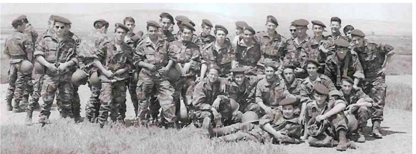
▼ Remise des brevets à Noisy-les-Bains le 5 mai 1960