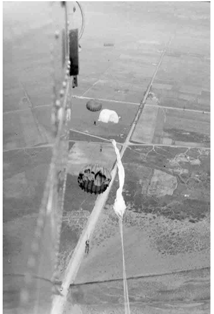
▲▼ Le saut à Noisy-les-Bains le 5 mai 1960 et la réception au sol