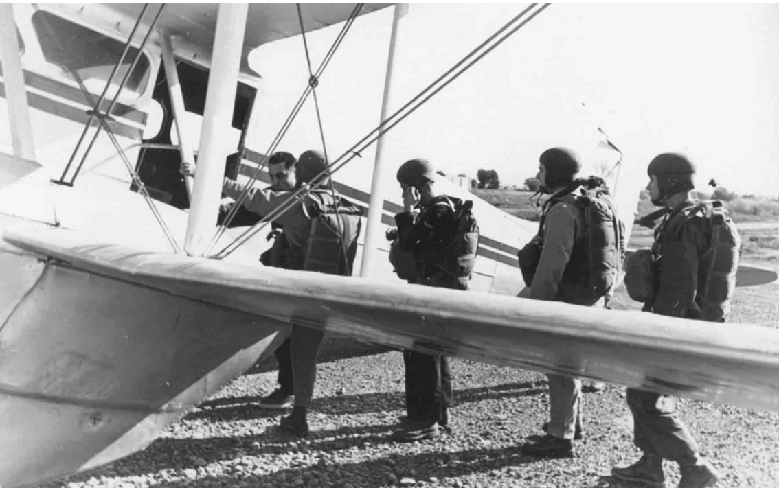
Embarquement d'un stick dans un Dragon Rapide du SALS à Maison-Blanche en 1957