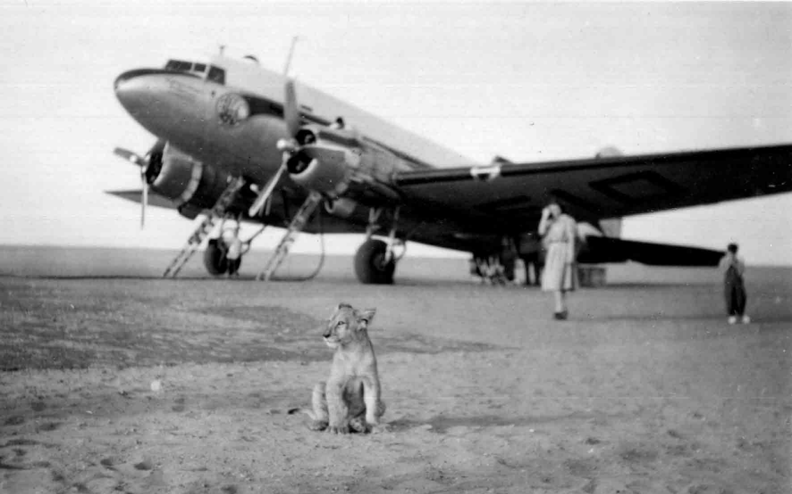
Un lionceau accueille le DC-3 du SGACC à Aoulef en 1953 (Jean Delacroix)