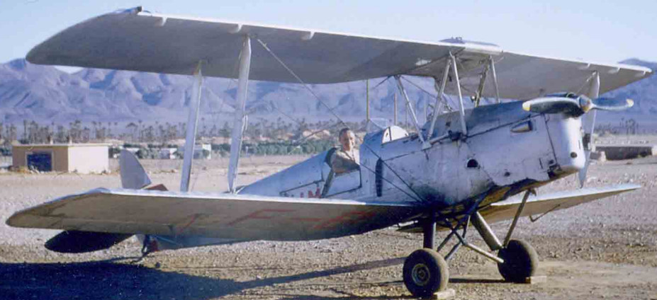
Un des seize De Havilland DH-82 Tiger Moth , anciens de la RAF, prêtés par le SALS-A aux aéro-clubs. Le F-BFHM à l'Aéro-club de Colomb-Béchar en 1957