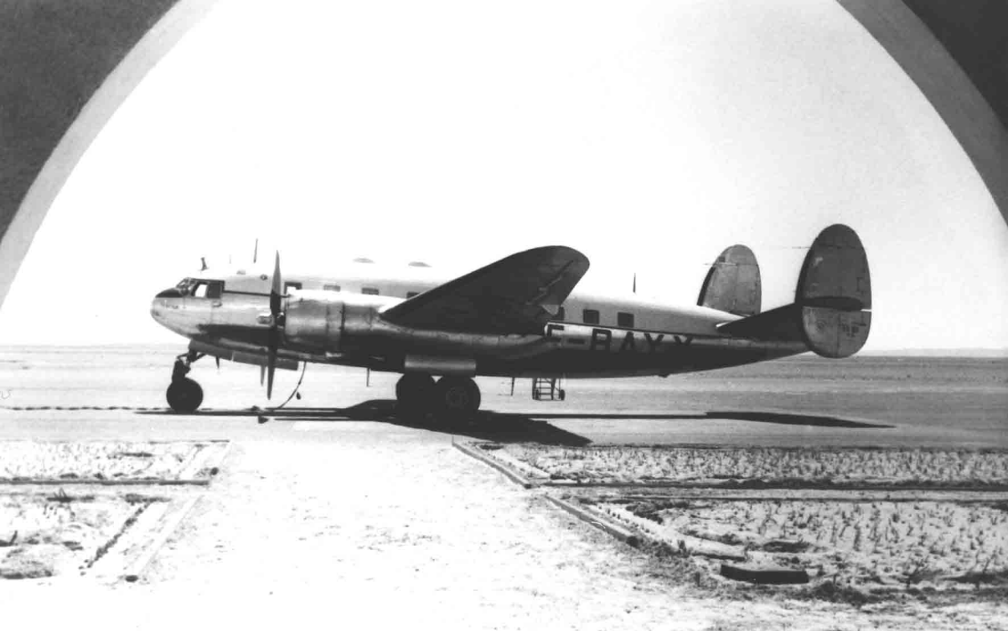
Le SO 30P Bretagne F-BAYX du SGACC (métropole) à El-Goléa en 1956