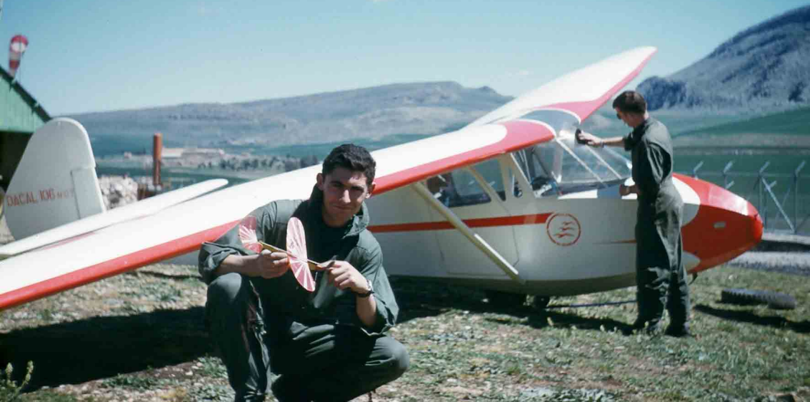
En 1961, un DACAL 106 (évolution du DACAL 105) au Djebel-Oum-Settas lors d'un des derniers stages militaires. Le Centre fermera ses portes en septembre 1961 (François Boutet)