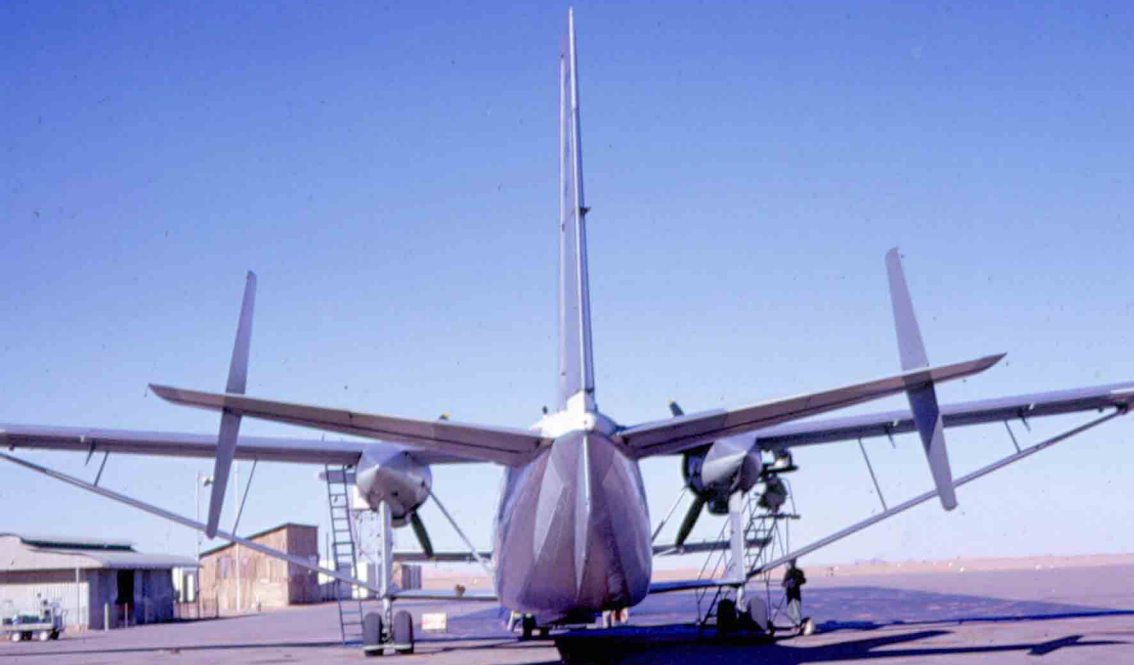
Hurel-Dubois HD-34 de l'IGN à In-Amenas en 1962 (Jean-Yves Grillon)