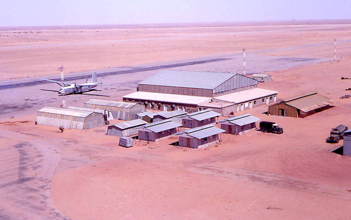
Hurel-Dubois HD-34 de l'IGN sur le parking de Reggane (Christian Vroland)