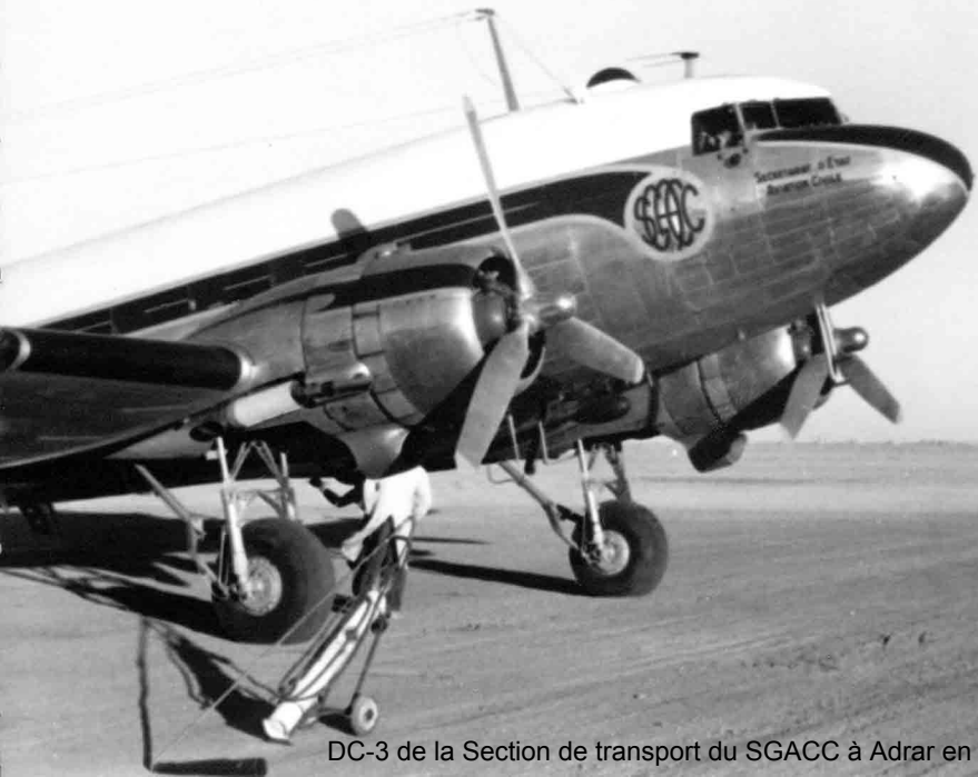
DC-3 de la Section de transport du SGACC à Adrar en 1953 (Jean Delacroix)