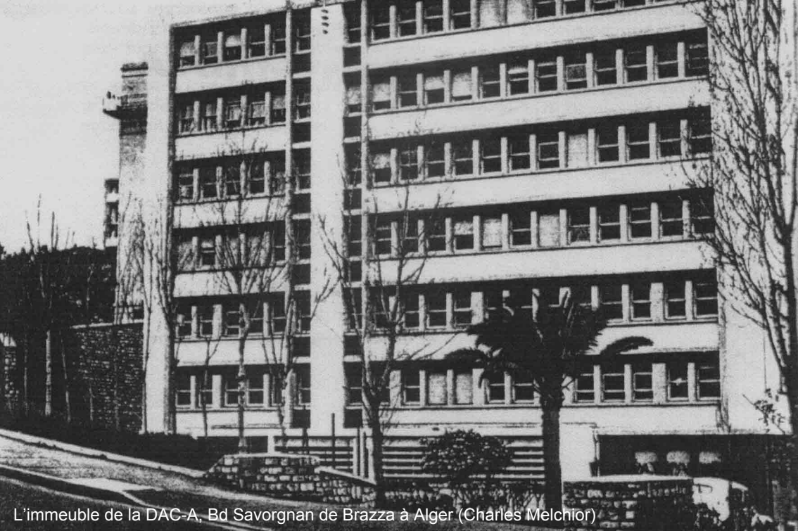
L'immeuble de la DAC-A, Bd Savorgnan de Brazza à Alger (Charles Melchior)