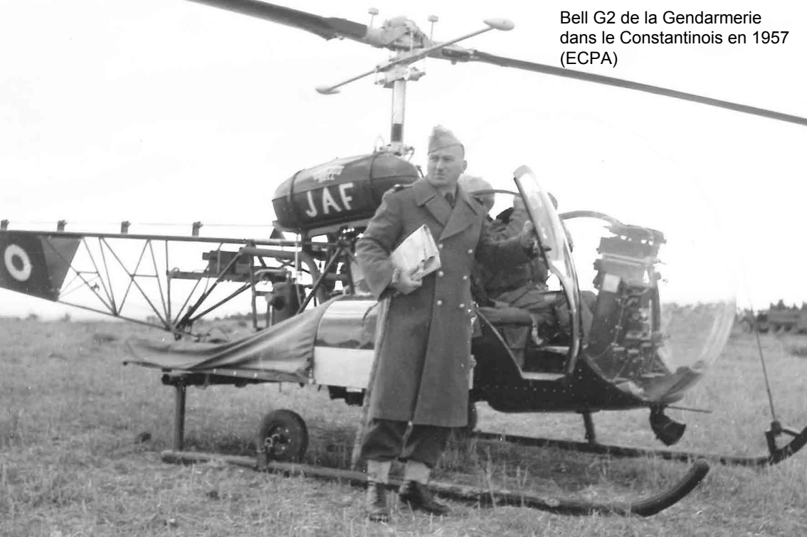
Bell G2 de la Gendarmerie dans le Constantinois en 1957