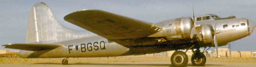
Boeing B-17 Forteresse Volante de l'IGN à Ouargla en 1962 (Jean-Yves Grillon)