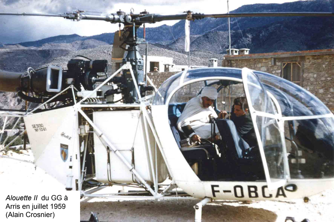
Alouette II du GG à Arris en juillet 1959 (Alain Crosnier)