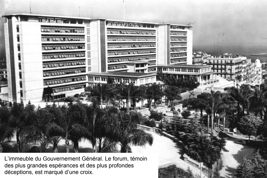
L'immeuble du Gouvernement Général. Le forum, témoin des plus grandes espérances et des plus profondes déceptions, est marqué d'une croix.