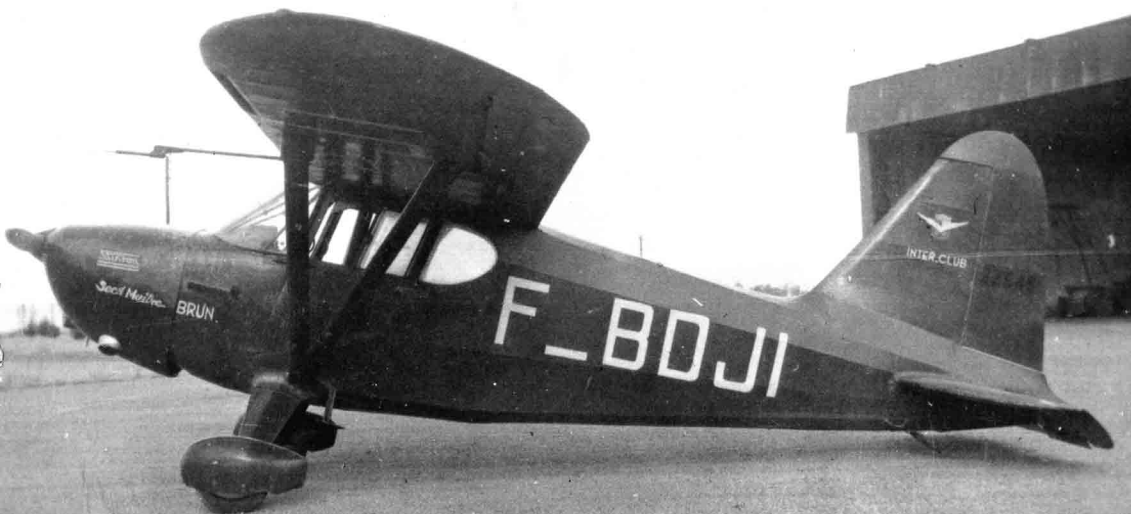
Un de quatre Stinson HW-75 Reliant , anciens de la Marine, prêtés par le SALS-A aux aéro-clubs