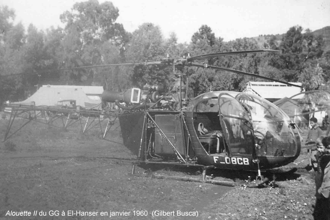
Alouette II du GG à El-Hanser en janvier 1960 (Gilbert Busca)