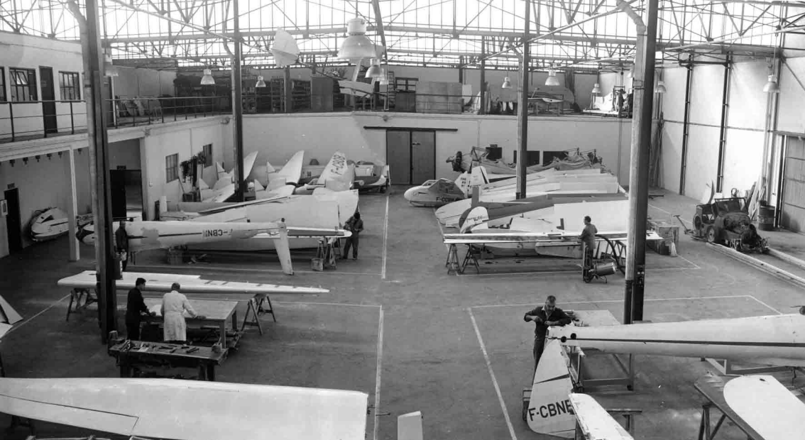
L'atelier du SALS-A 103, rue Sadi-Carnot à Alger, dirigé par Antoine Lasserre. Il assure l'entretien des planeurs, des remorqueurs et des treuils. Un planeur genre Chanute est visible au plafond, ainsi que des cellules de Morane-Saulnier 315 et un treuil. L'atelier a construit une série de DACAL 105 et 106, un Minicab, des Fauvel AV-36 Aile Volante et des Wassmer WA-21 Javelot (Lucien Saucède)