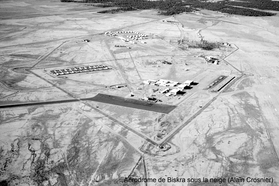
Aérodrome de Biskra sous la neige (Alain Crosnier)