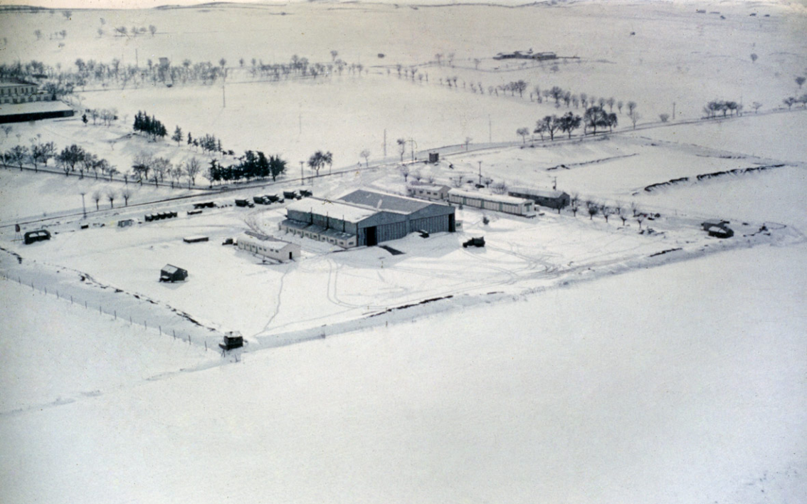
Aérodrome de Berrouaghia sous la neige, hiver 61/62 - 1er PMAH 20ème DI (Yves Breteau)