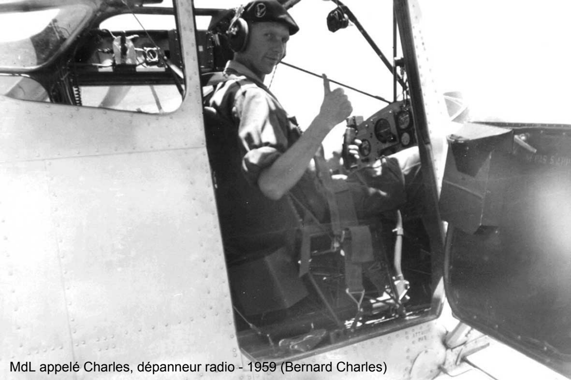
MdL appelé Charles, dépanneur radio - 1959 (Bernard Charles)