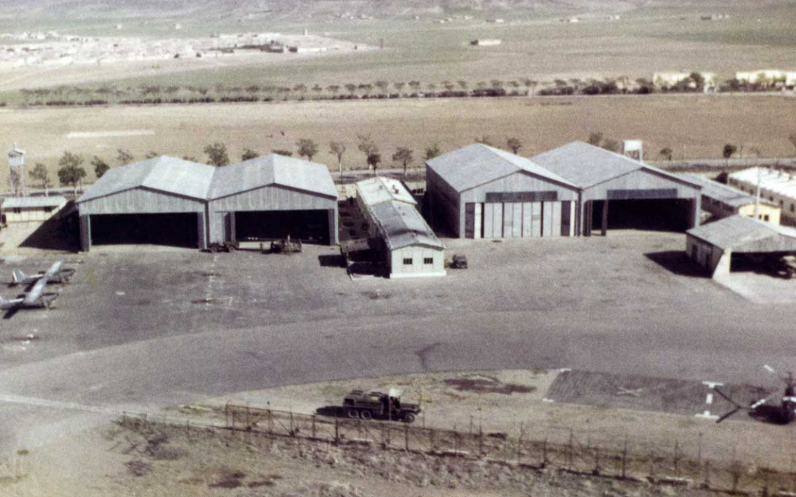
Les installations du PMAH 21ème DI à Batna en 1960