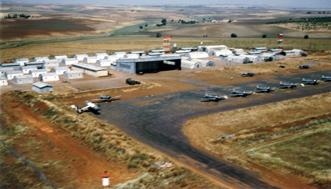
Aérodrome de Bir-Rabalou en 1960 (Marcel Vervoort)