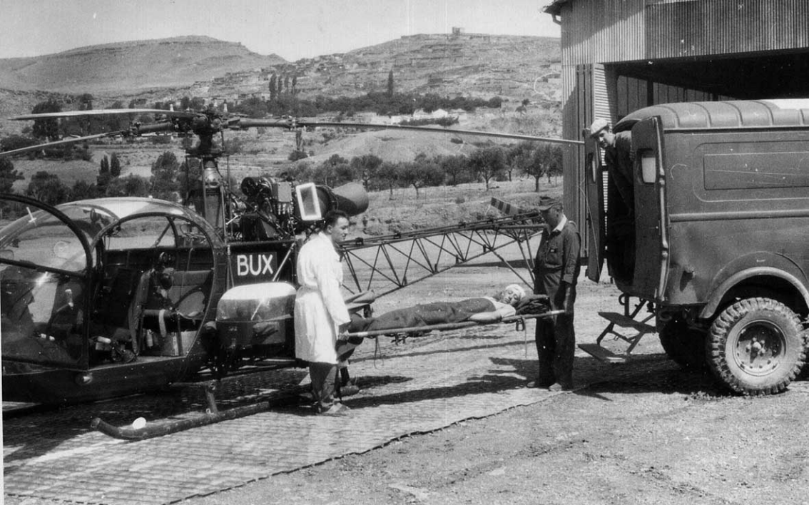
PA 21ème DI - 1960 - Evacuation sanitaire au détachement d'Arris (Louis Chupin)