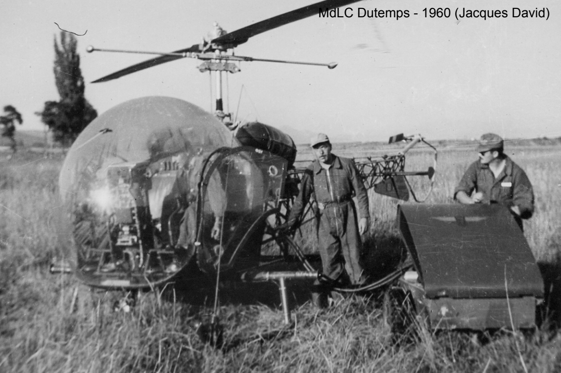
MdLC Dutemps - 1960 (Jacques David)