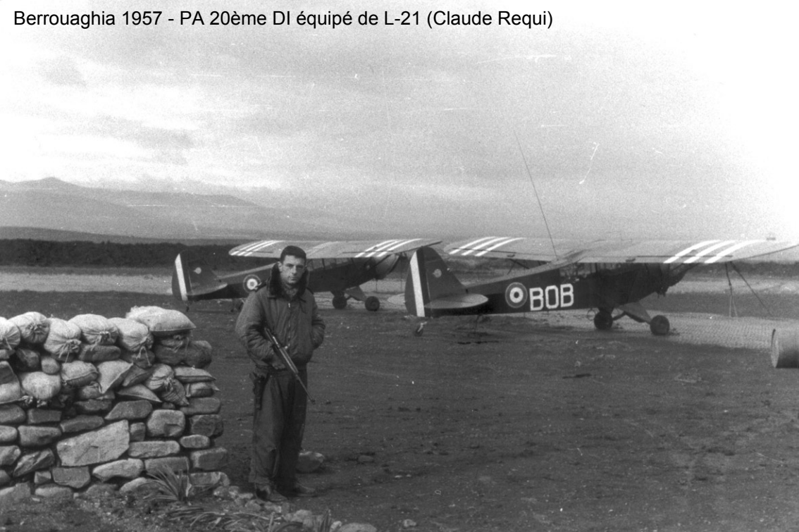
Berrouaghia 1957 - PA 20ème DI équipé de L-21 (Claude Requi)