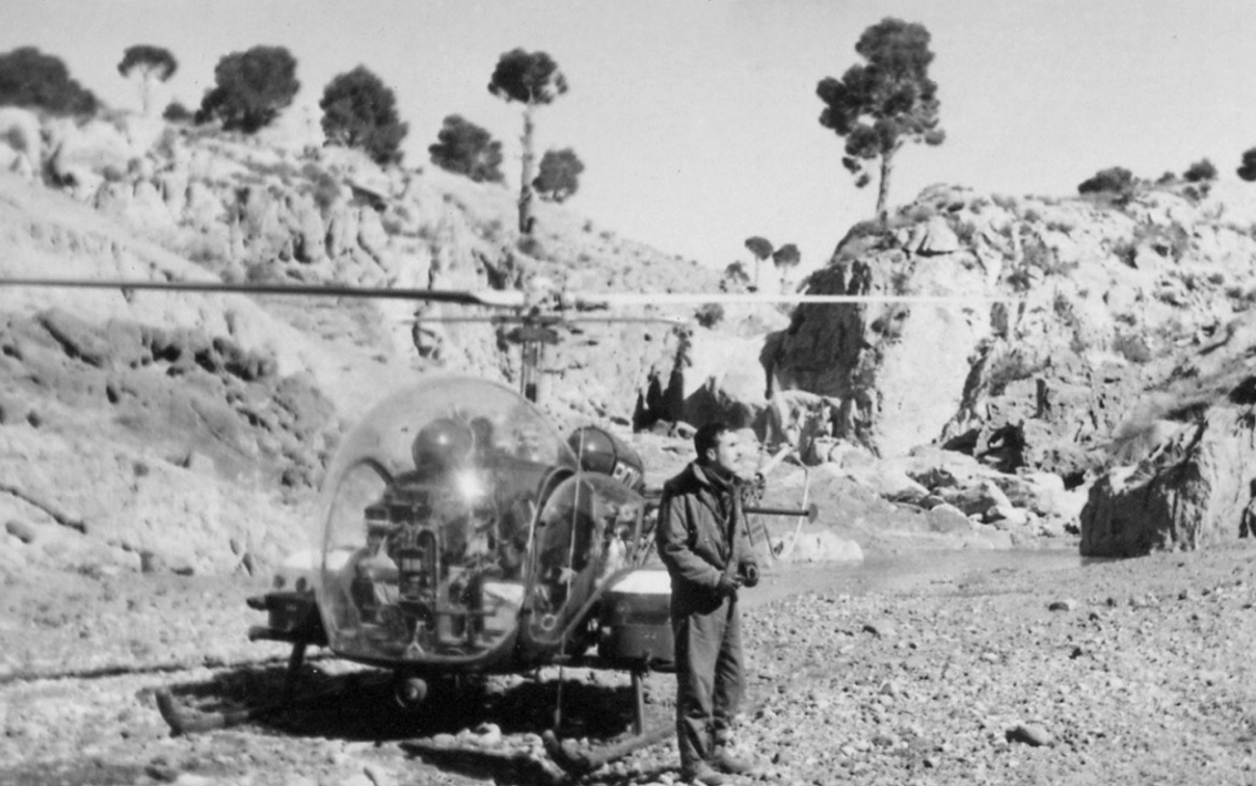
MdLC Blanche - Djelfa 1961 (Jean-Pierre Blanche)