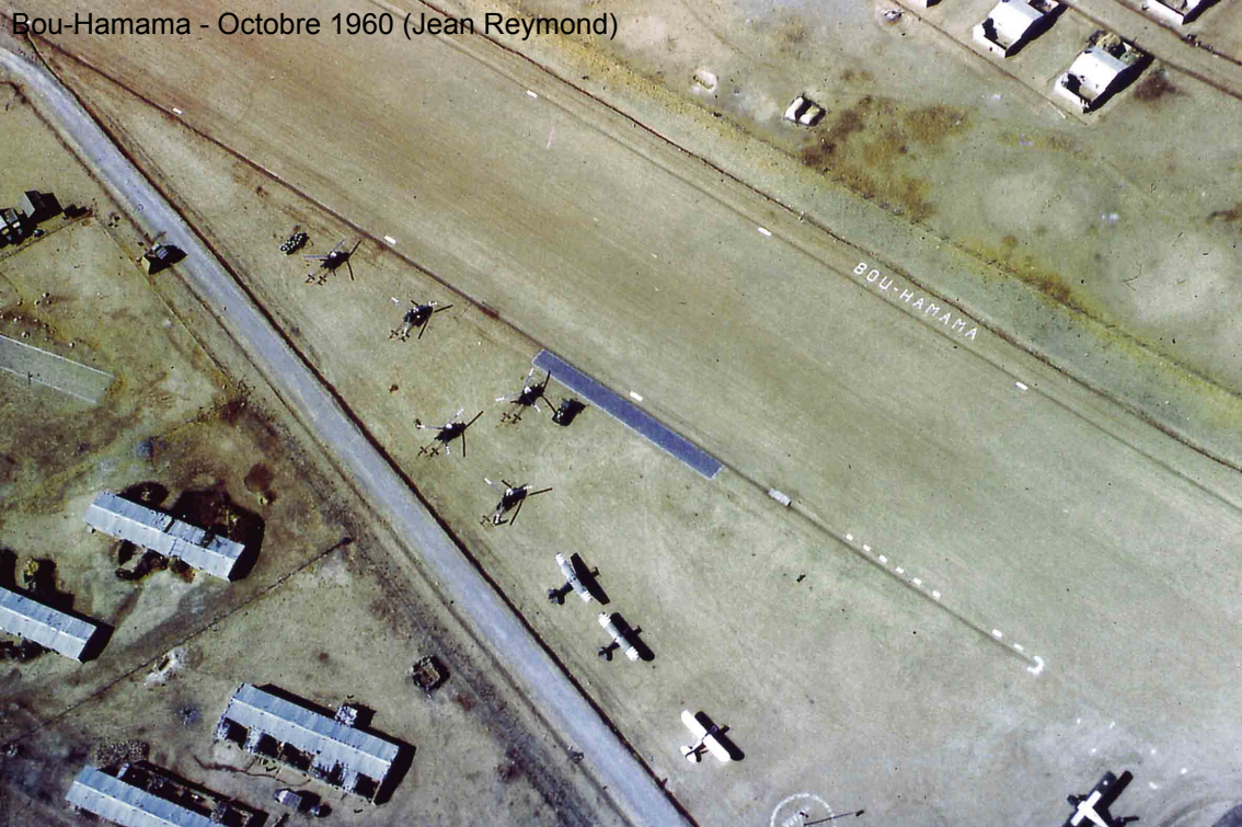
Bou-Hamama - Octobre 1960 (Jean Reymond)