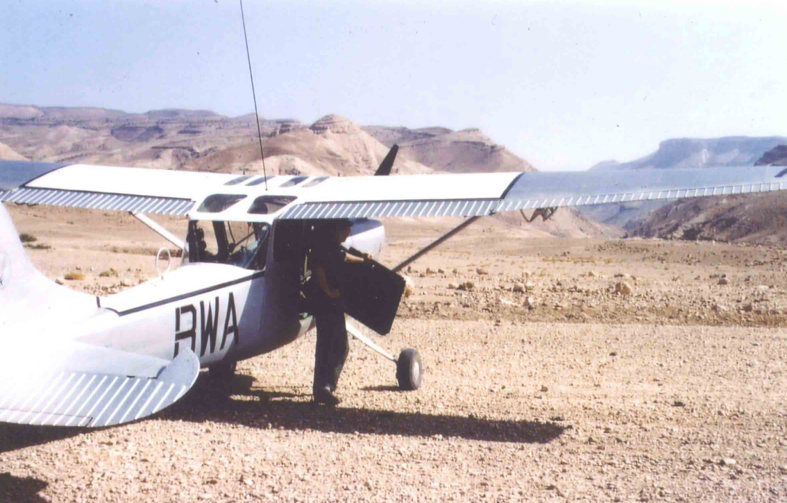
L-19 du PMAH 11ème DI à Seiar (Aurès) en 1961 (Jean Reymond)