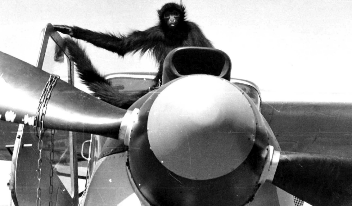
La Vieille , mascotte du 1er PMAH 12ème DI sur le capot d'un N 3400 (Emile Reich)