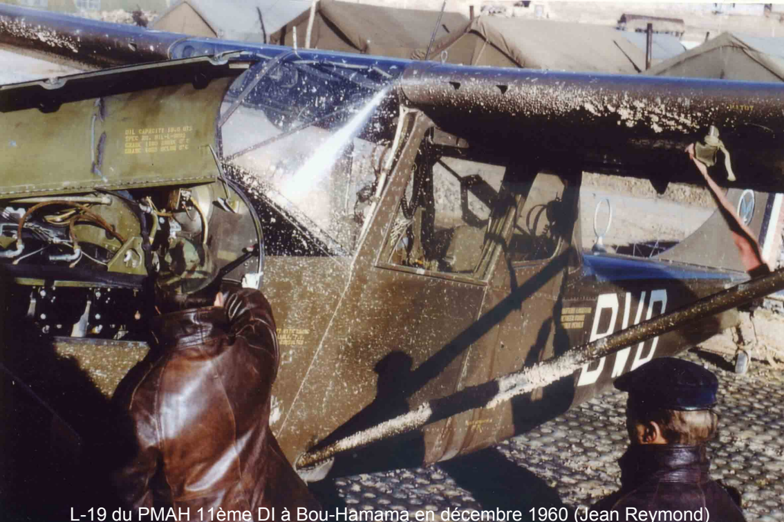
L-19 du PMAH 11ème DI à Bou-Hamama en décembre 1960 (Jean Reymond)