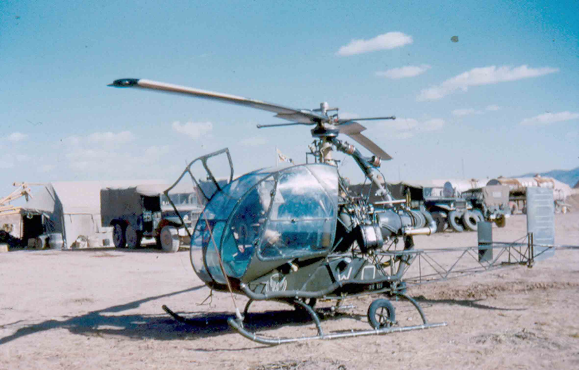
2ème PMAH 12ème DI - Méchéria 1960 - Djinn (Armand Farrugia)