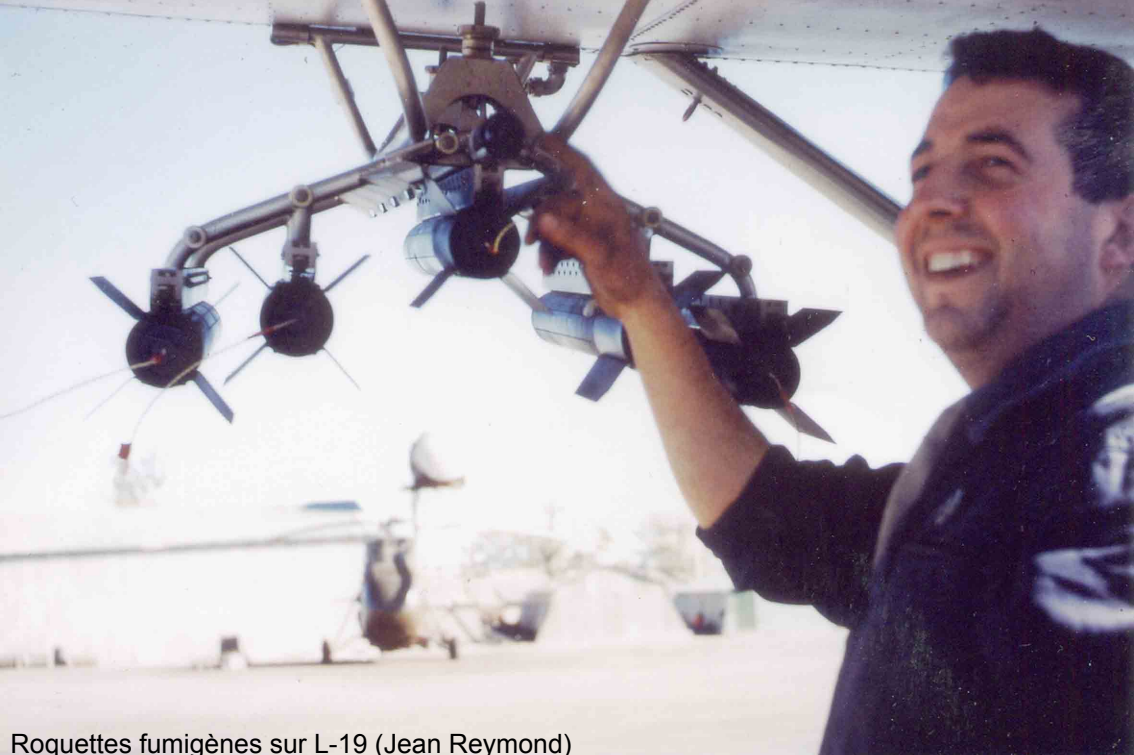
Roquettes fumigènes sur L-19 (Jean Reymond)