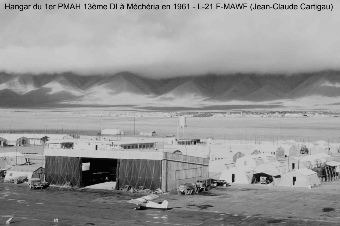
Hangar du 1er PMAH 13ème DI à Méchéria en 1961 - L-21 F-MAWF (Jean-Claude Cartigau)