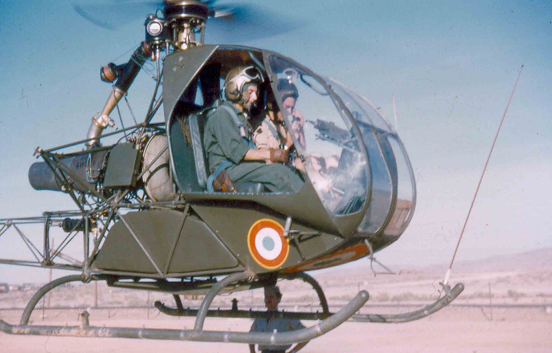
2ème PMAH 12ème DI - Méchéria 1960 - MdL Farrugia en Djinn (Armand Farrugia)