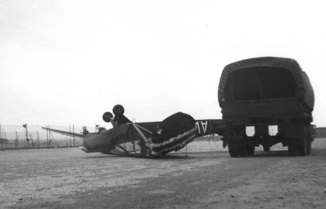
2ème PMAH 12ème DI Méchéria 1960 - L-18 victime d'une tempête de sable (Claude Requi)