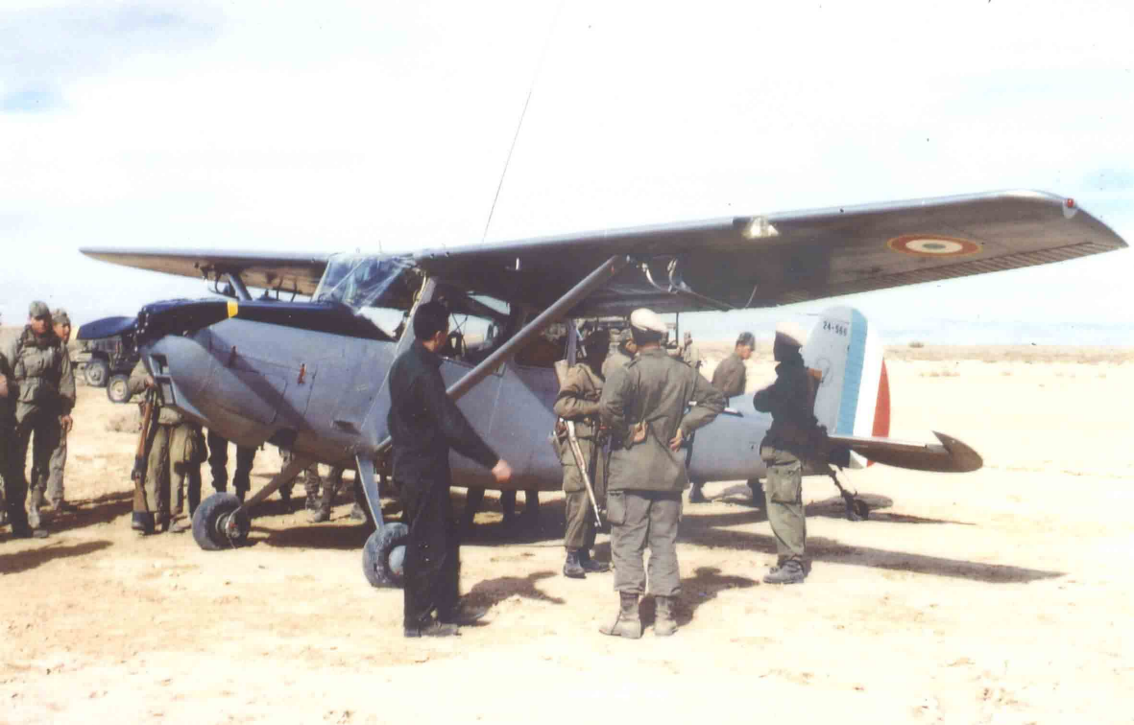
L-19 du PMAH 11ème DI au chott Melhrir (-24 m) en décembre 1961 (Jean Reymond)