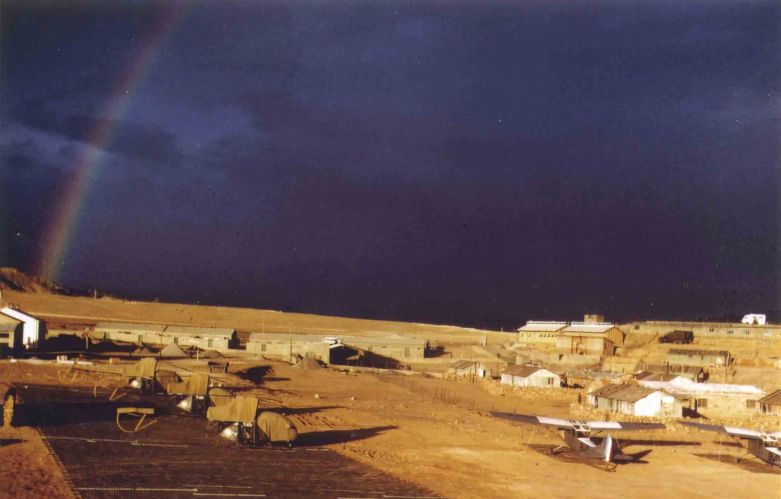
Ciel d'orage à Bou-Hamama en décembre 1961 (Jean Reymond)