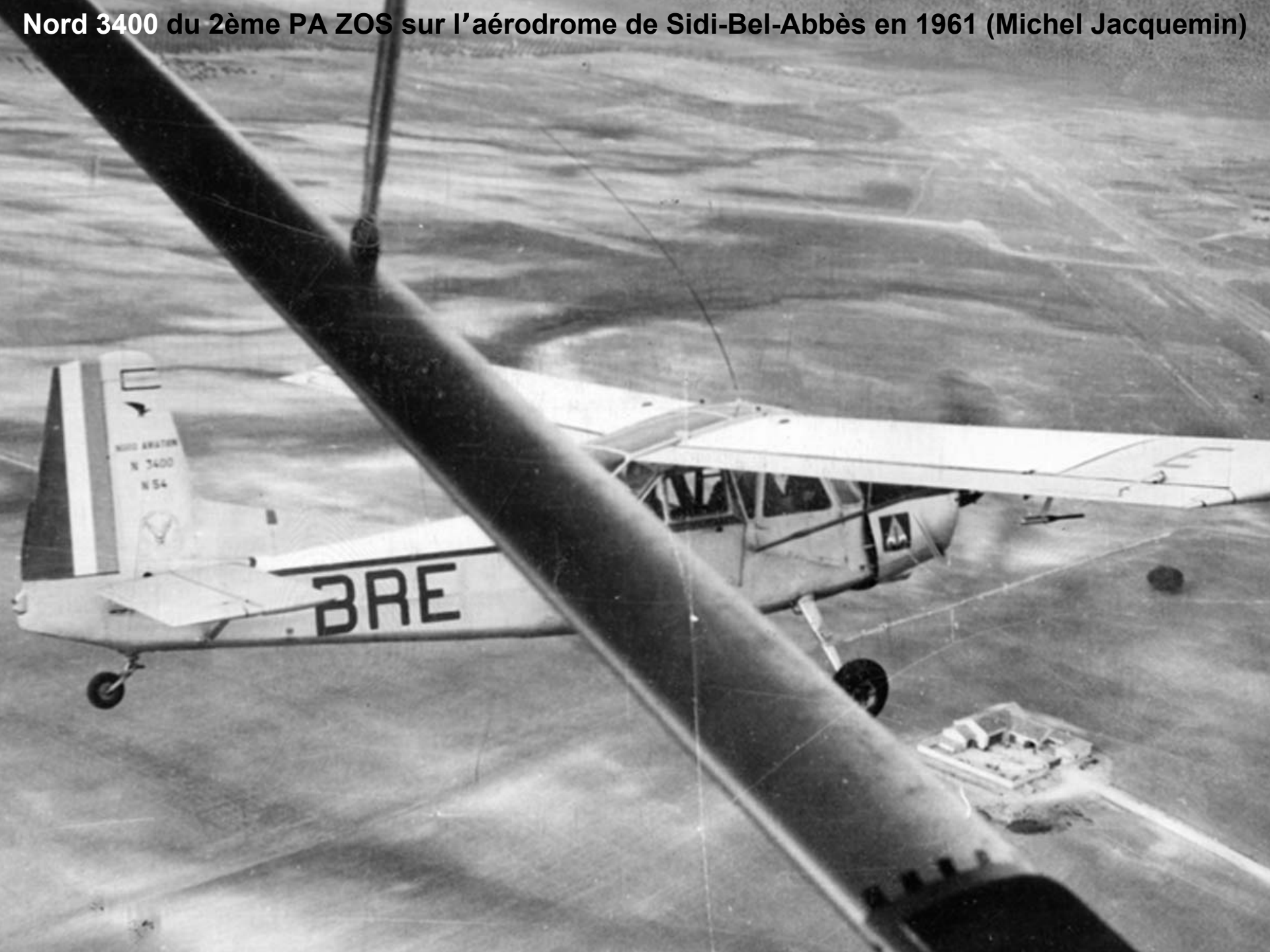
Nord 3400 du 2ème PA ZOS sur l'aérodrome de Sidi-Bel-Abbès en 1961 (Michel Jacquemin)