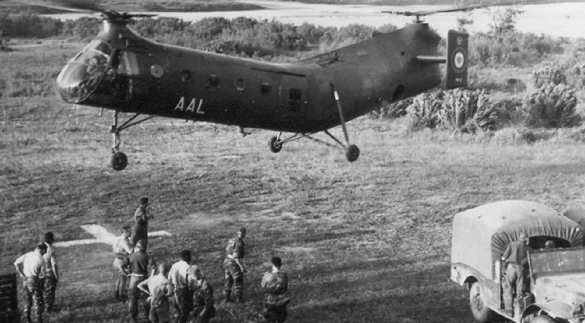
H-21 du GH2 sur le Constantinois en 1958 (Gilbert Buscat)