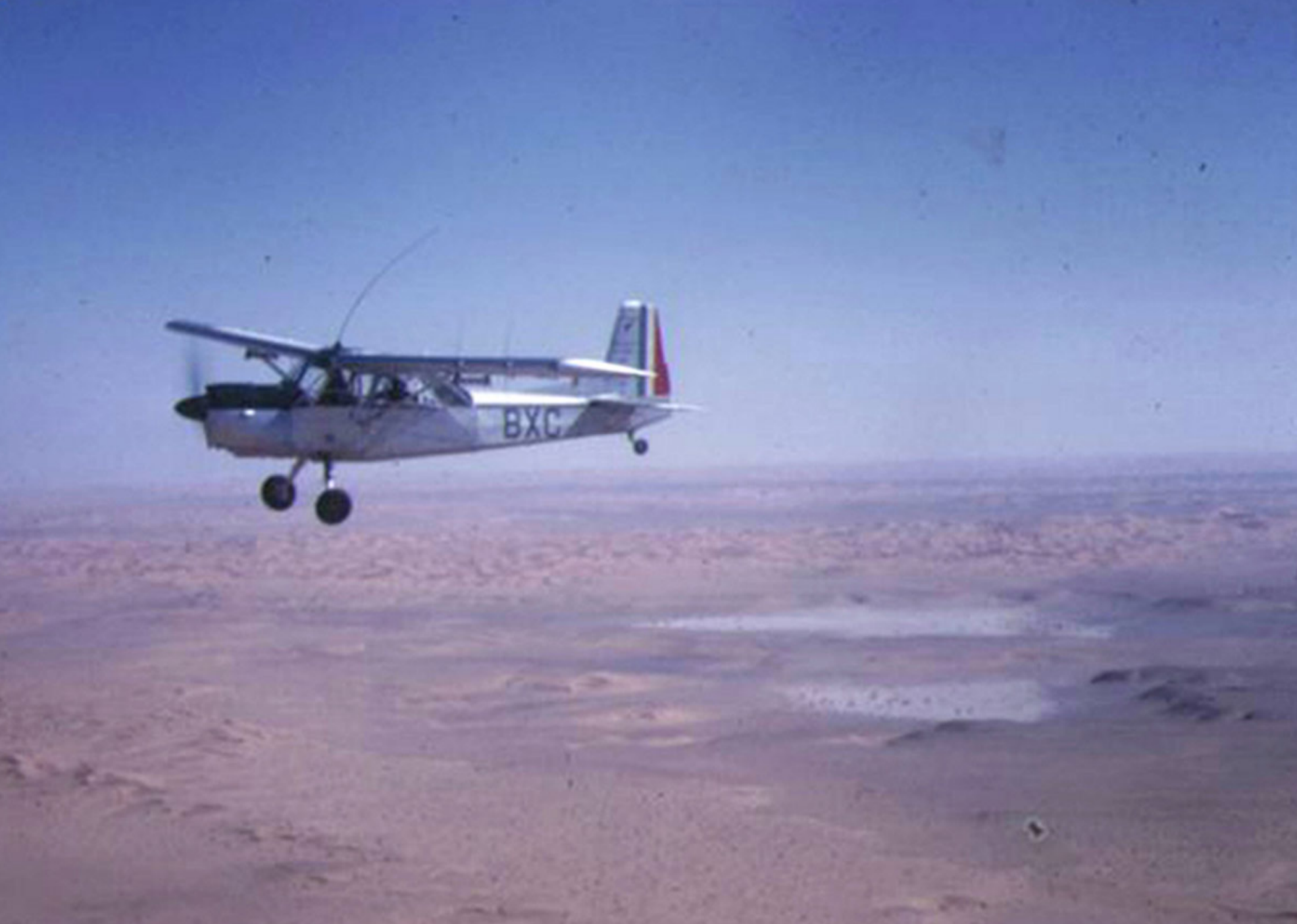
Nord 3400 du 1er PA ZOS sur la région d'Aïn-Séfra en 1960 (Philippe Desqueroux)