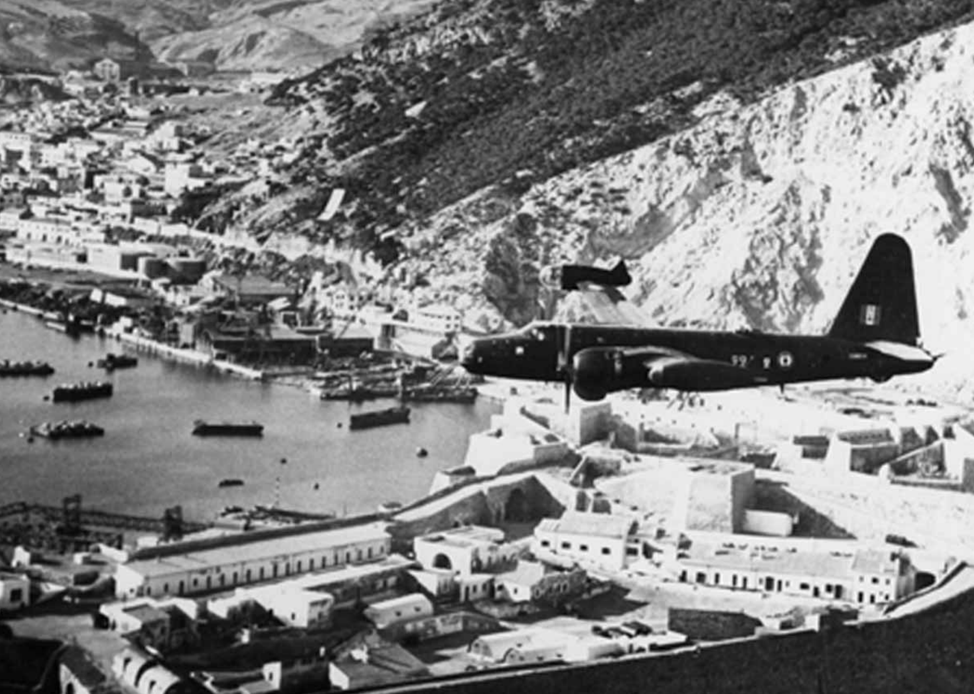
Neptune de la flottille 22F sur Mers-el-Kebir en 1959