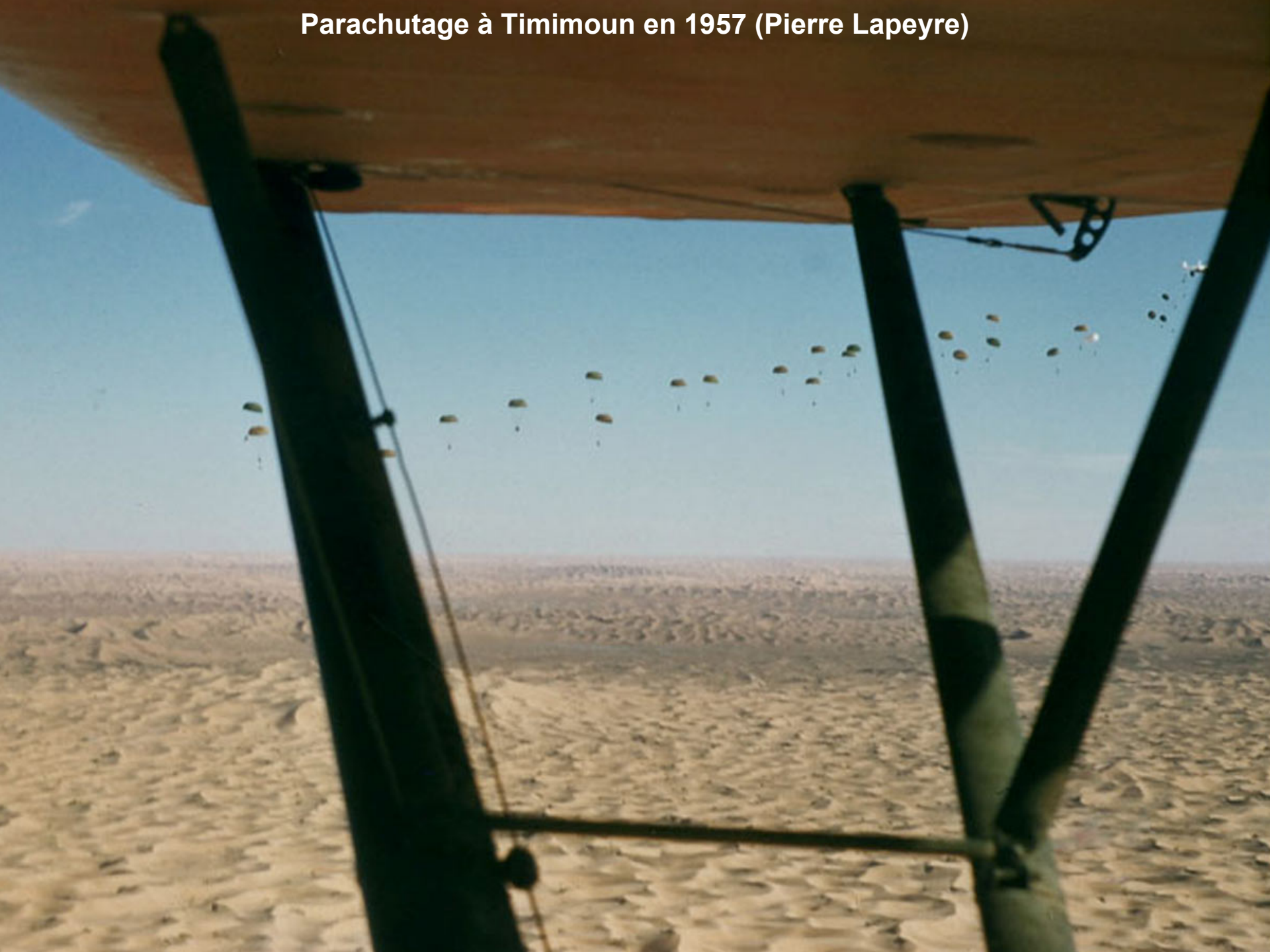
Parachutage à Timimoun en 1957 (Pierre Lapeyre)