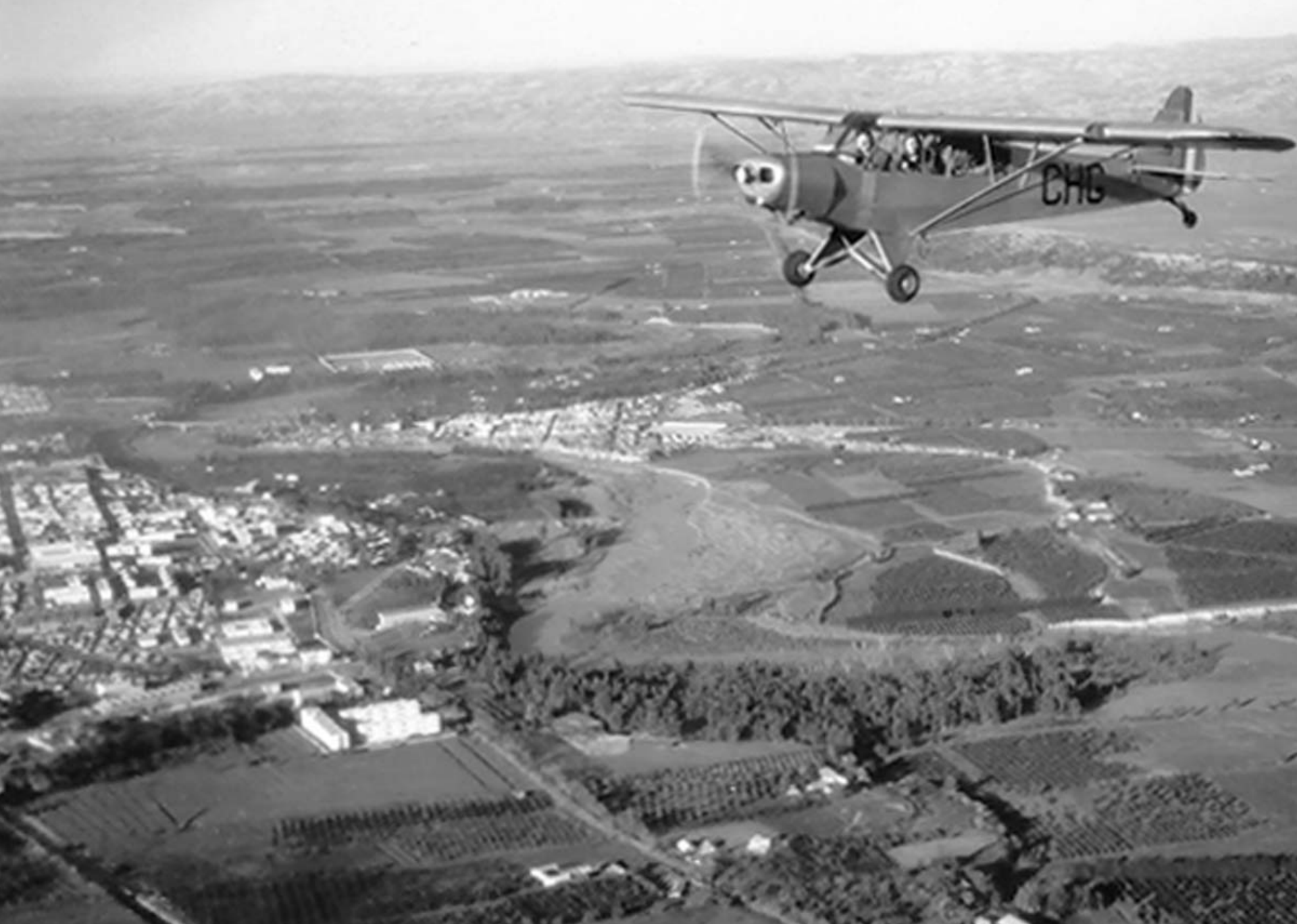
Piper L-18 sur la région d'Orléansville en 1959 (Bernard Gaudelas)