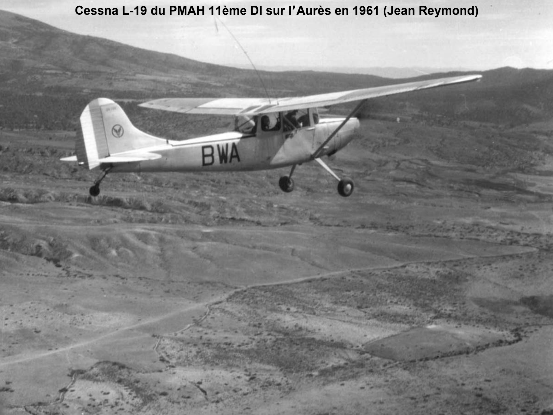
Cessna L-19 du PMAH 11ème DI sur l'Aurès en 1961 (Jean Reymond)