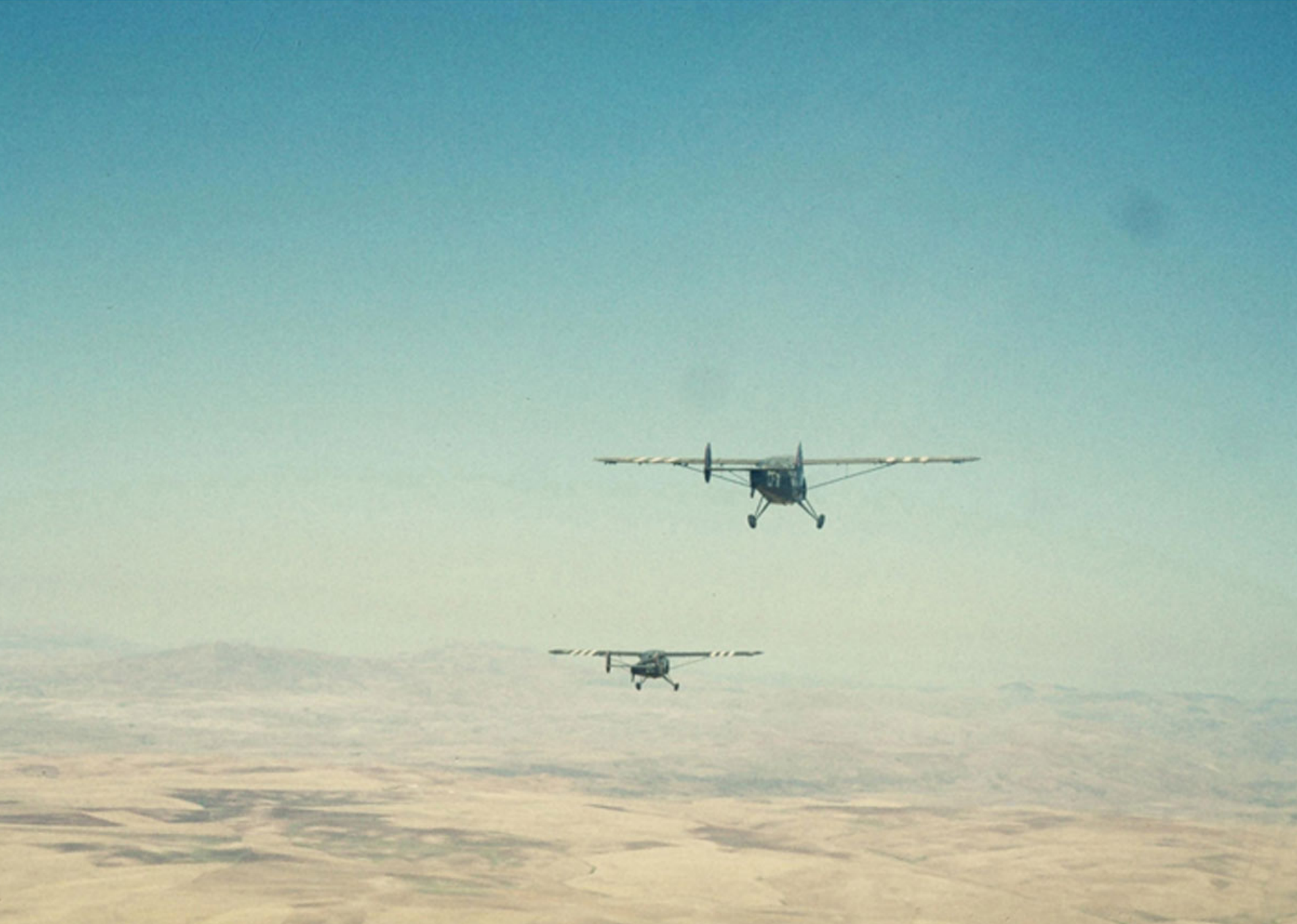
NC 856 du GALAT 3 sur les Hauts-Plateaux en 1958 (francis Fontaine)