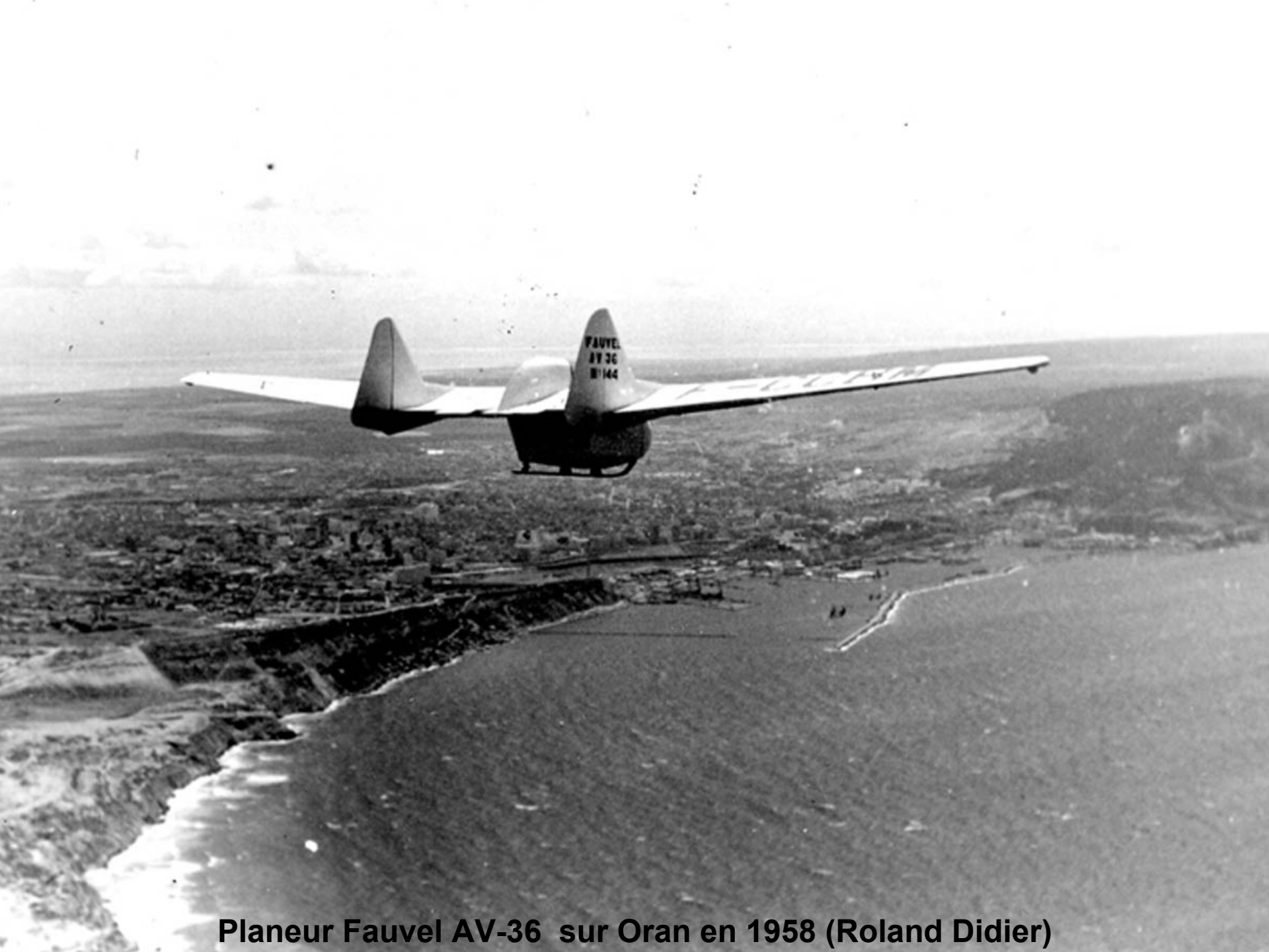
Planeur Fauvel AV-36 sur Oran en 1958 (Roland Didier)