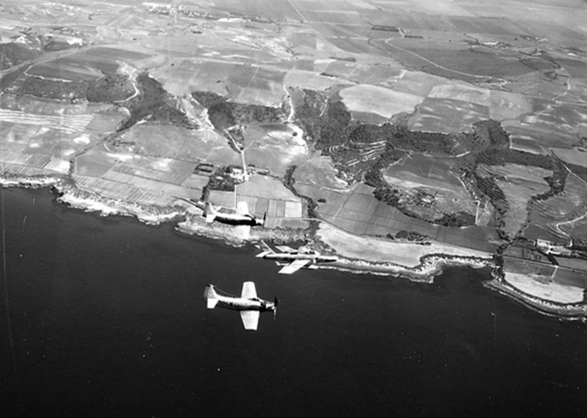
Skyraider de l'EC 1/20 et RF-84F de l'ER 3/33 sur la côte bônoise en 1960 (Christian Bernateau)