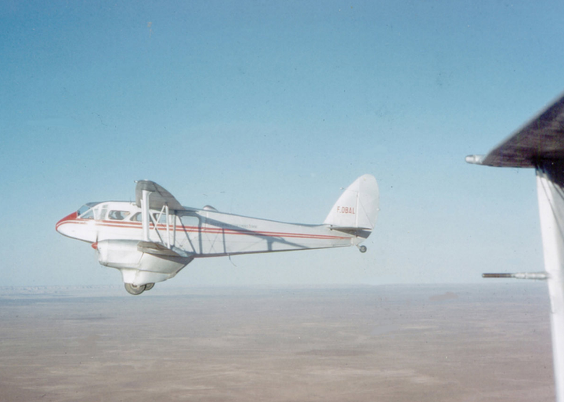
Dragon Rapide de la SGAA sur le Sahara en 1957 (Roland Richer de Forges)