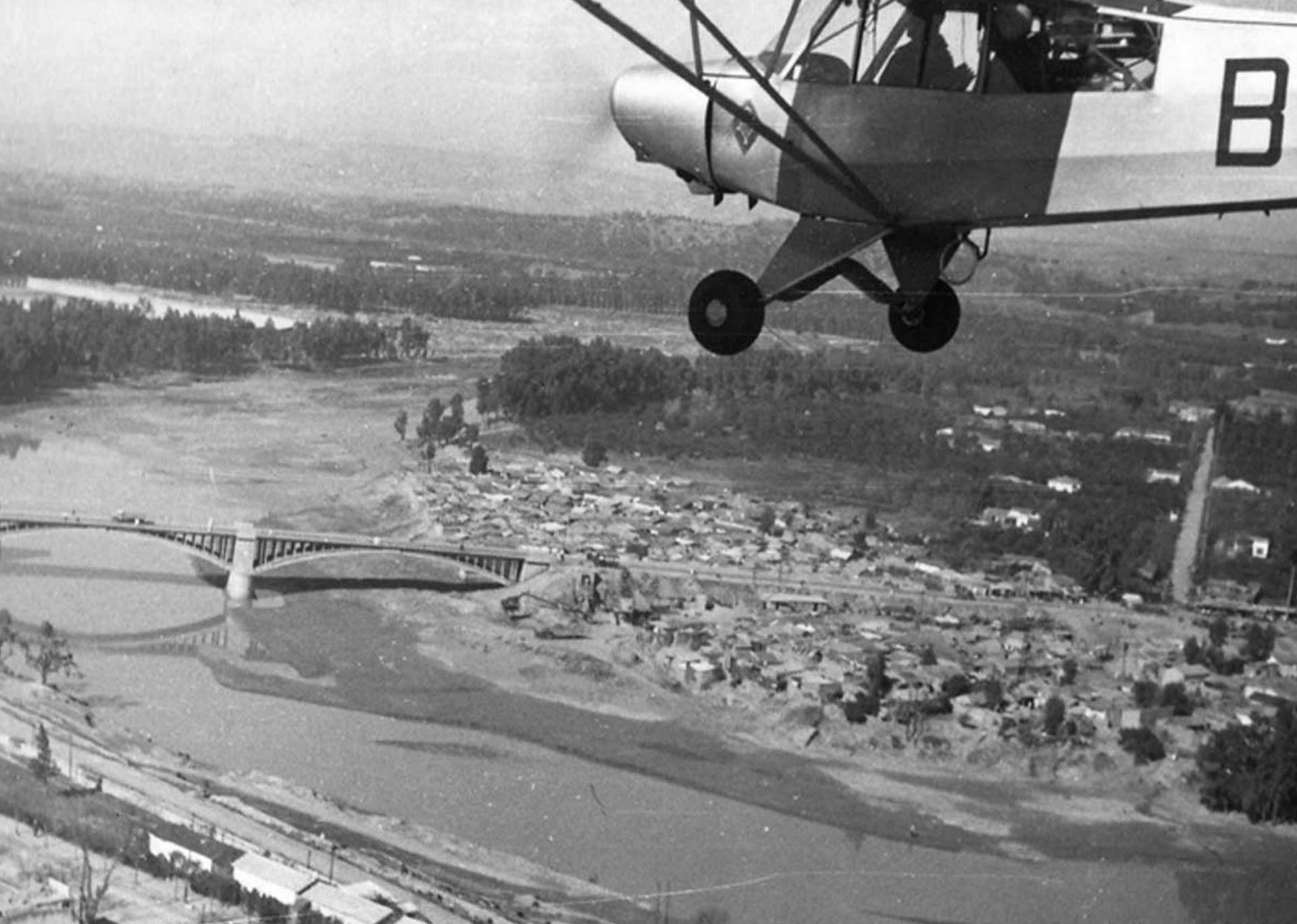
Piper L-21 du PA 9ème DI sur le Chélif en 1959 (François d'Arnaudy)