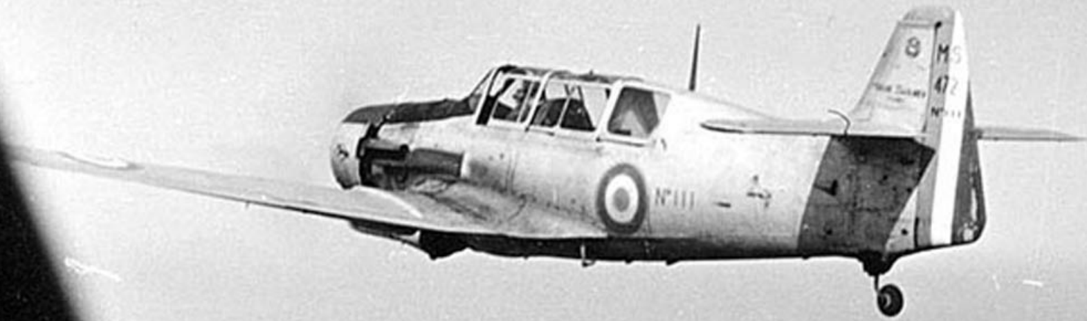
MS-472 Vanneau du CER 305 sur la Mitidja en 1953 (Yves Donius)