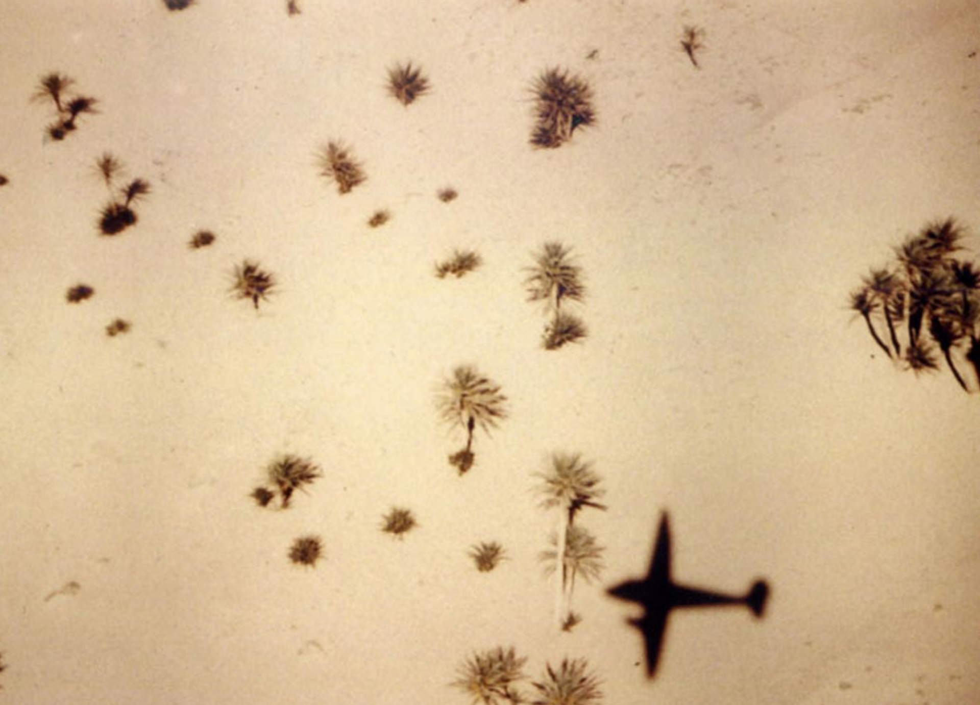
Ombre d'un Dragon Rapide de la SGAA sur une oasis (Roland Richer de Forges)