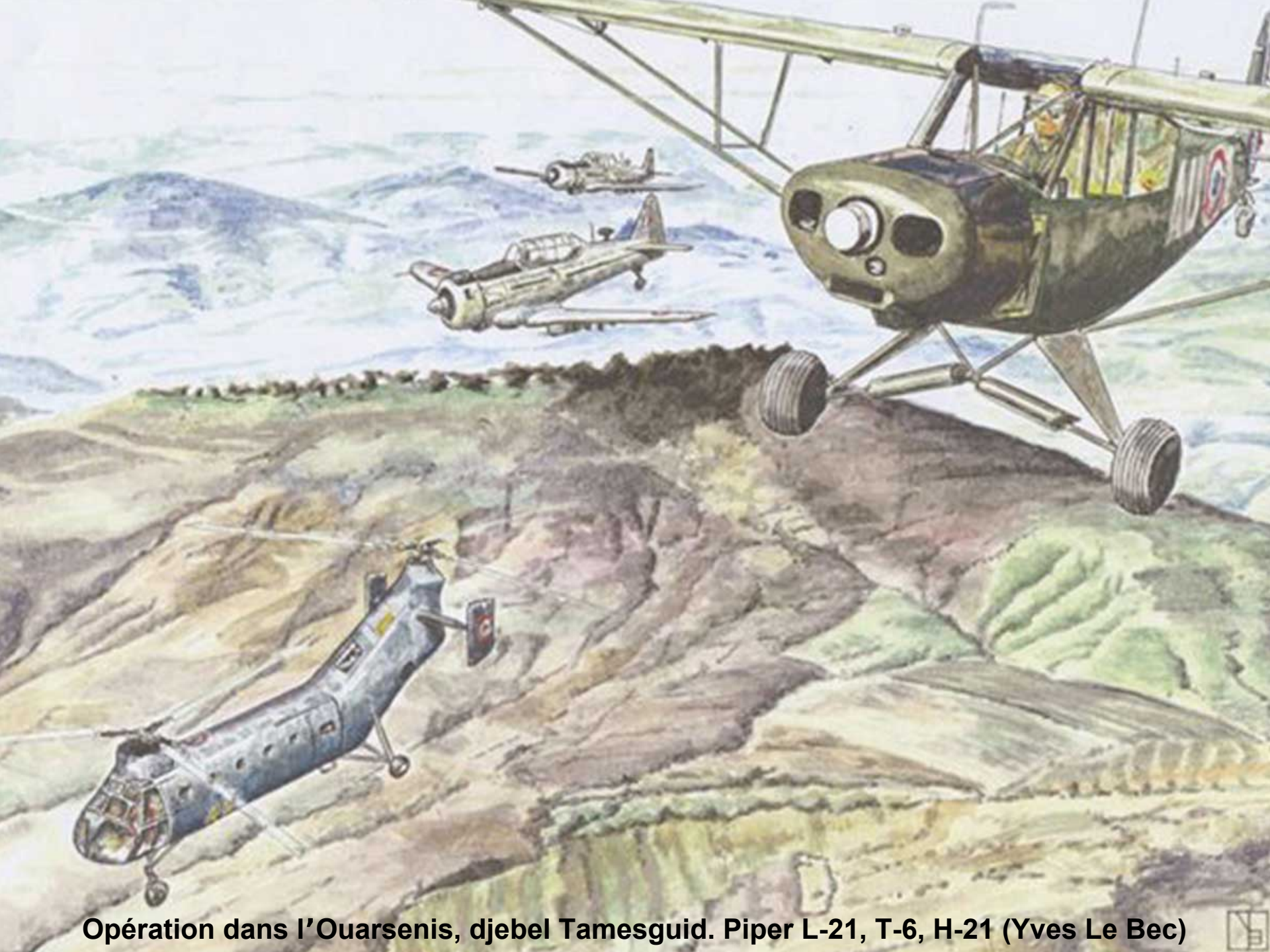
Opération dans l'Ouarsenis, djebel Tamesguid. Piper L-21, T-6, H-21 (Yves Le Bec)