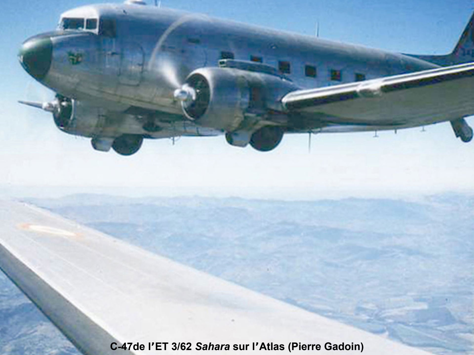
C-47 de l'ET 3/62 Sahara sur l'Atlas (Pierre Gadoin)