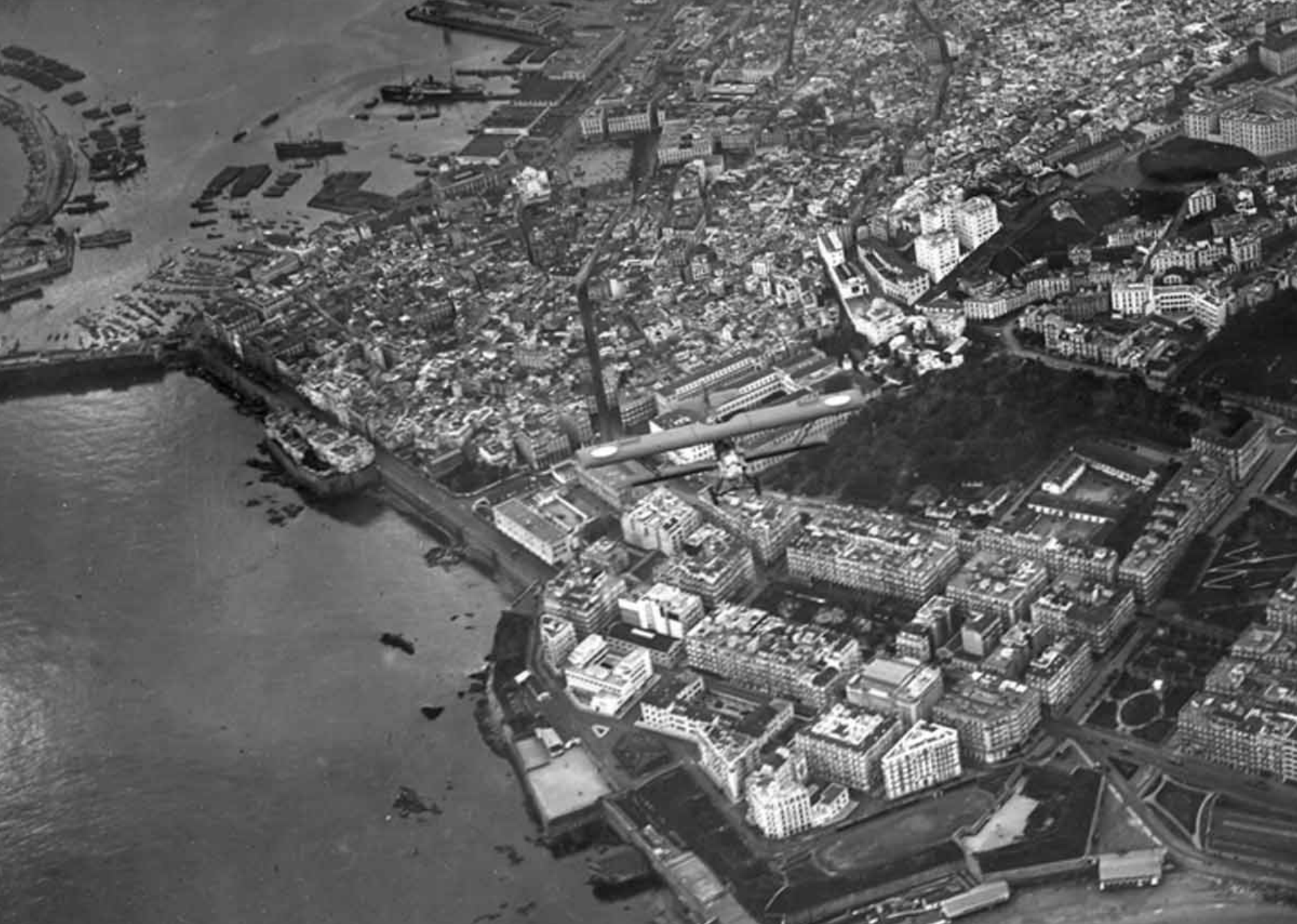
Potez 25 du 1er GAA sur Alger en 1932 (Jean Salvano)