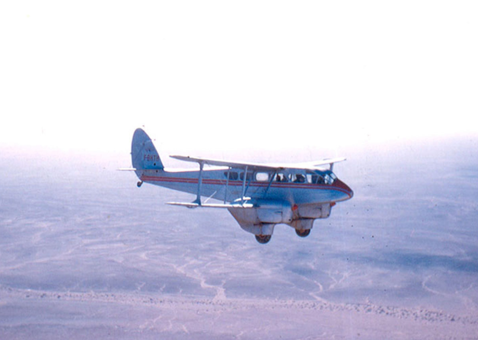
DH 89 Dragon Rapide de la SGAA sur la région de Fort-Flatters en 1958 (Claude Loustau)