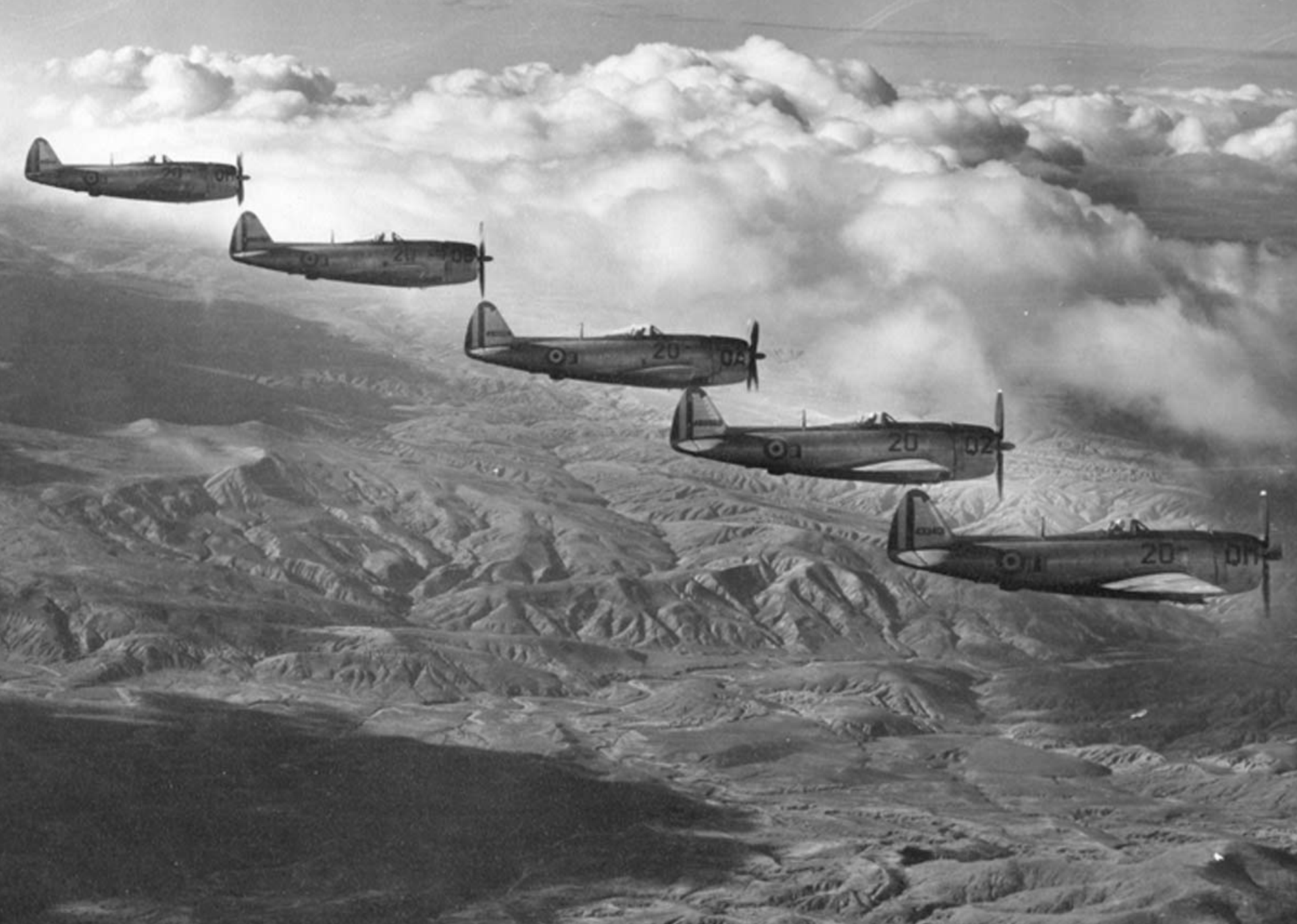
P-47 Thunderbolt de l'EC 2/20 sur l'Oranie en 1958 (Roland Didier)