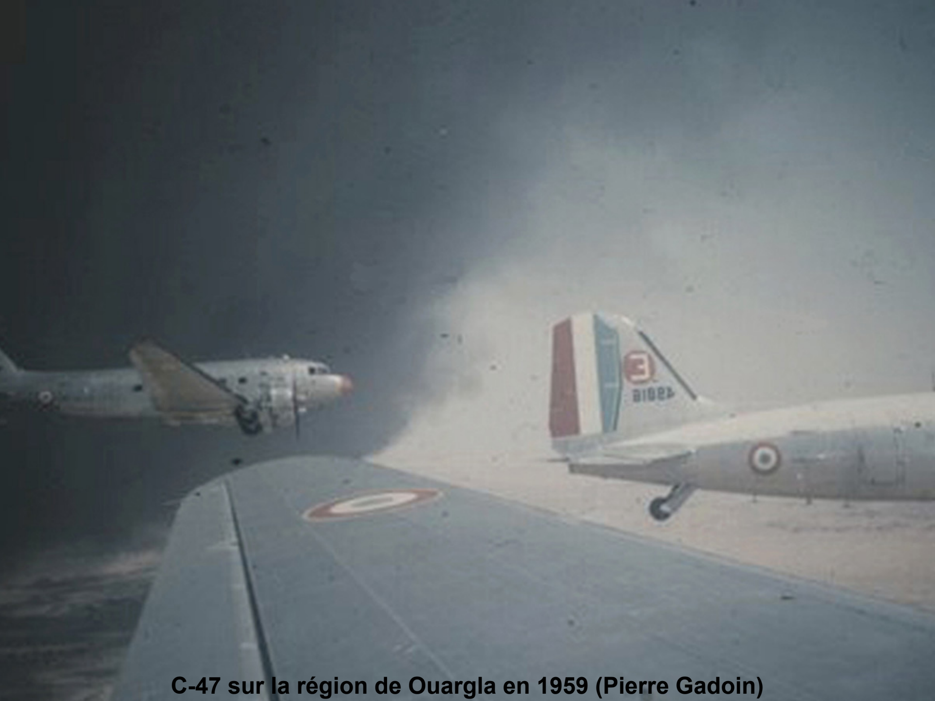
C-47 sur la région de Ouargla en 1959 (Pierre Gadoin)