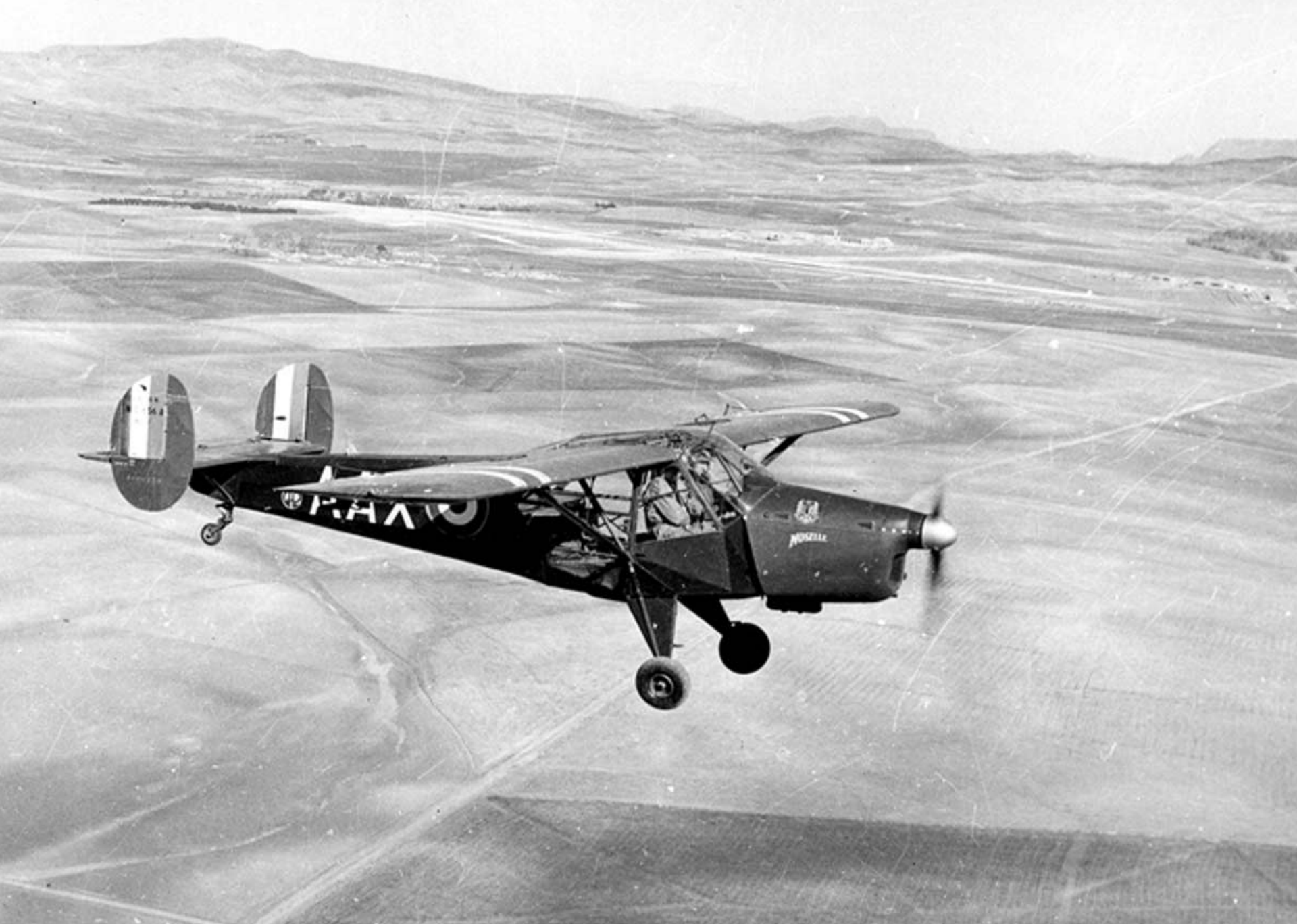
NC 856 du GH 2 sur la région de Sétif en 1957 (Pierre Tabart)