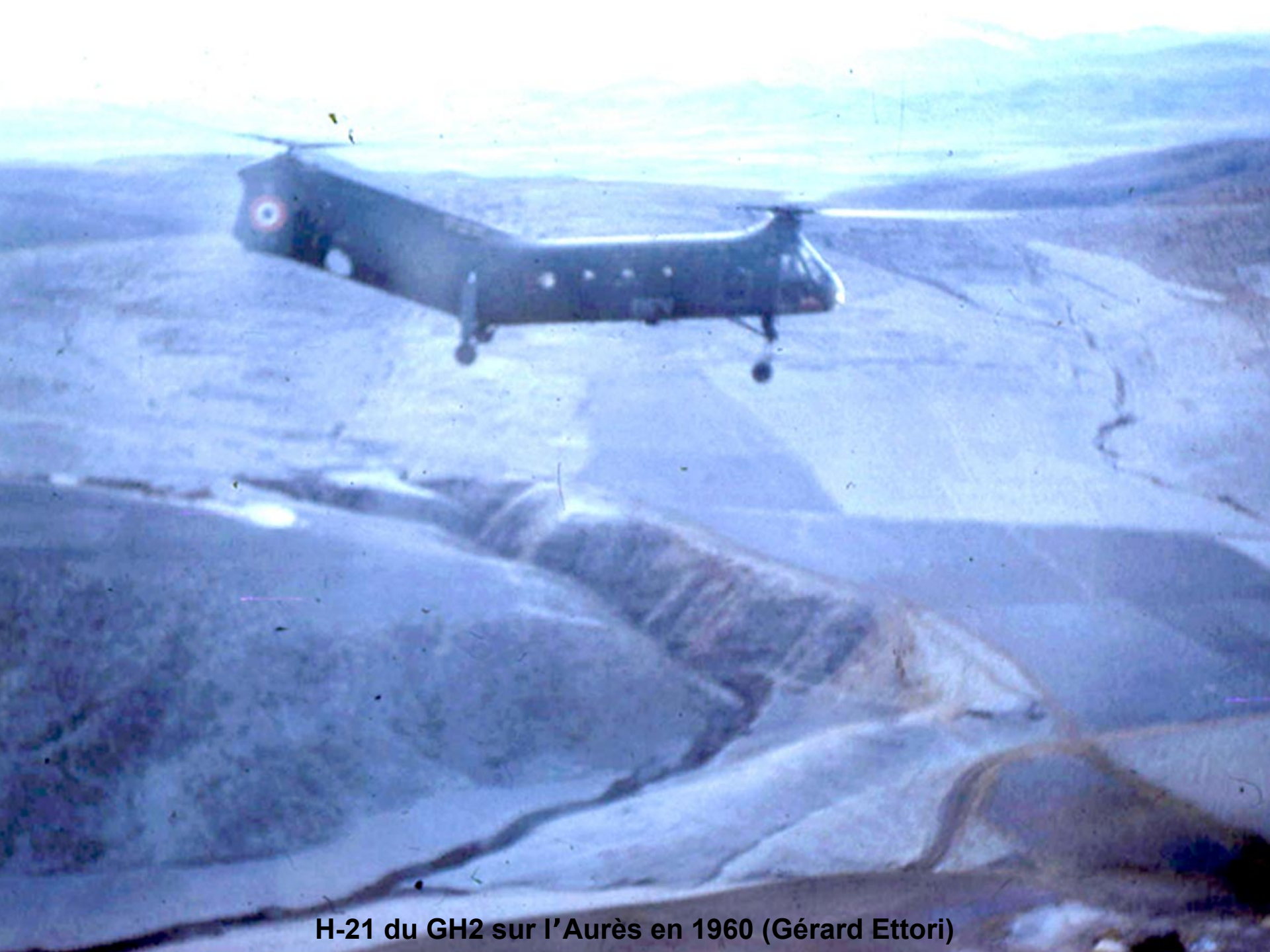
H-21 du GH2 sur l'Aurès en 1960 (Gérard Ettori)