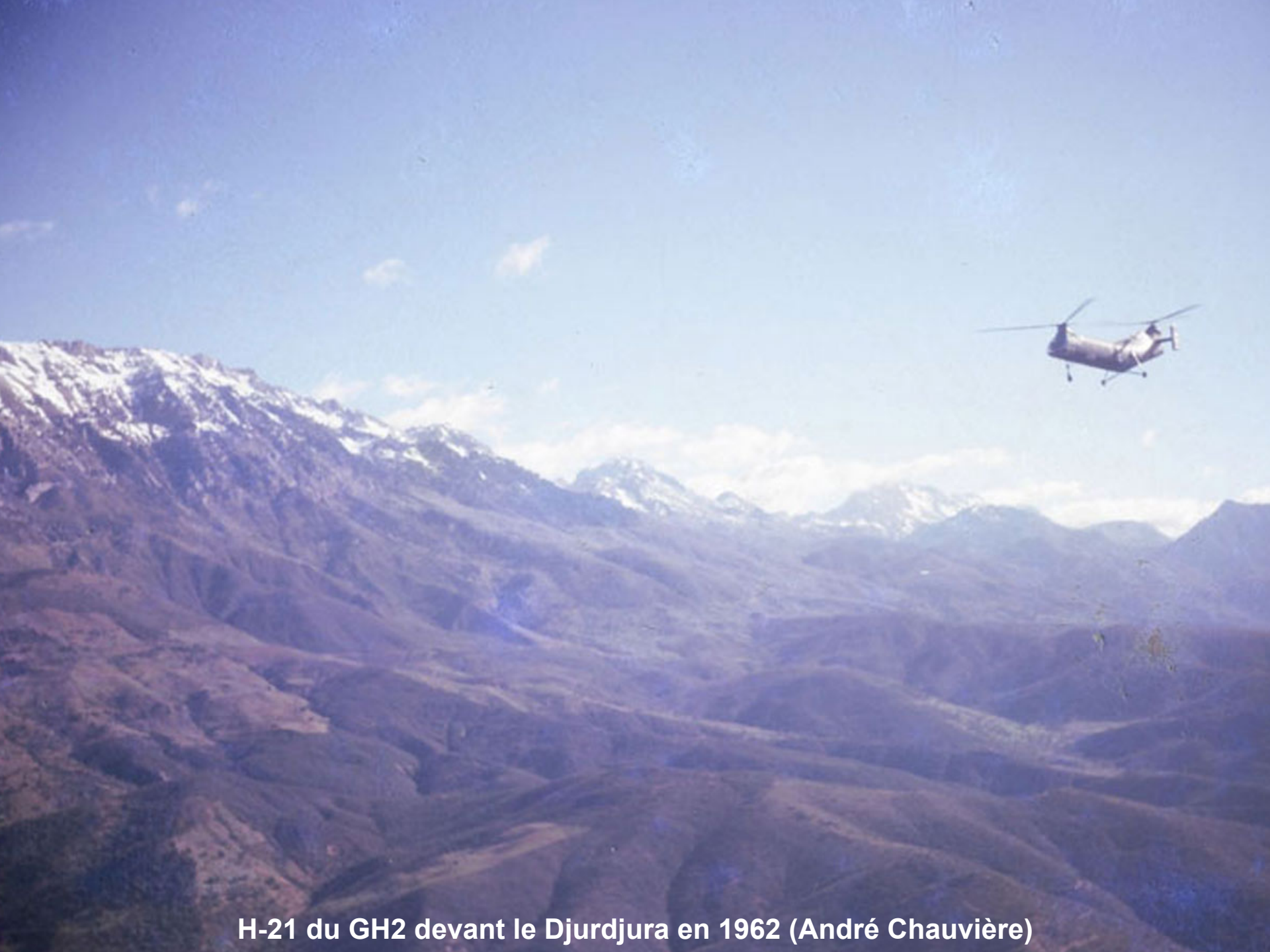
H-21 du GH2 devant le Djurdjura en 1962 (André Chauvière)