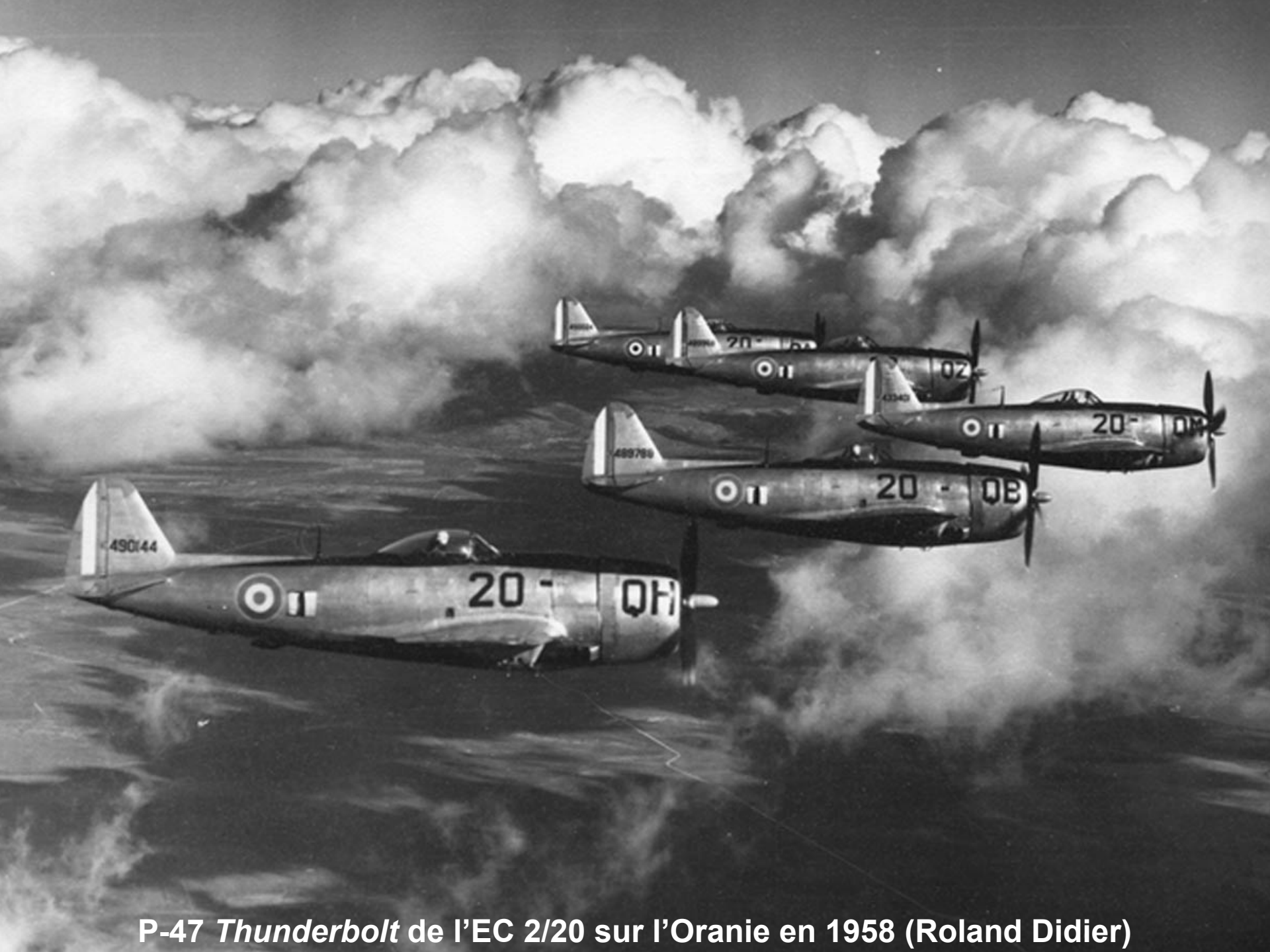
P-47 Thunderbolt de l'EC 2/20 sur l'Oranie en 1958 (Roland Didier)