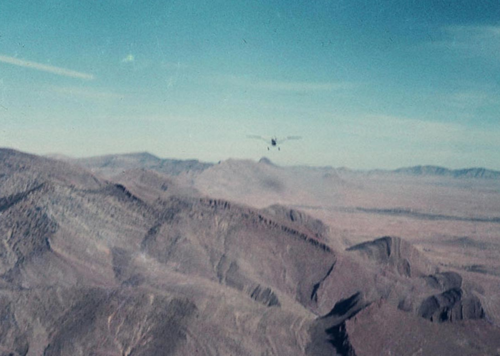
Cessna L-19 du 1er PMAH 21ème DI sur l'Aurès en 1960 (André Chauvière)