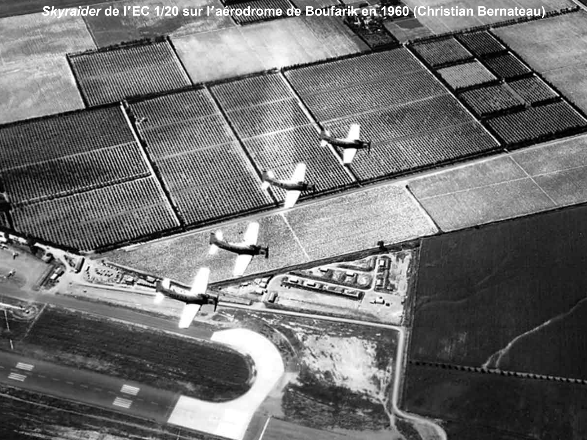
Skyraider de l'EC 1/20 sur l'aérodrome de Boufarik en 1960 (Christian Bernateau)