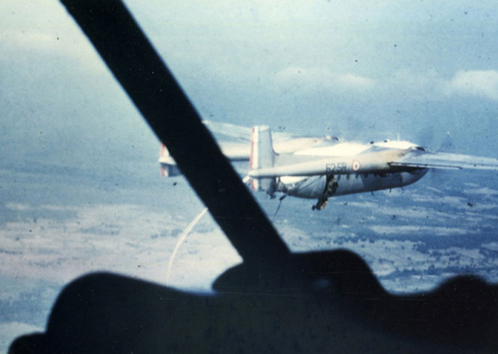
Noratlas de l'ET 62 en largage de parachutistes à Philippeville (Robert Nauze)