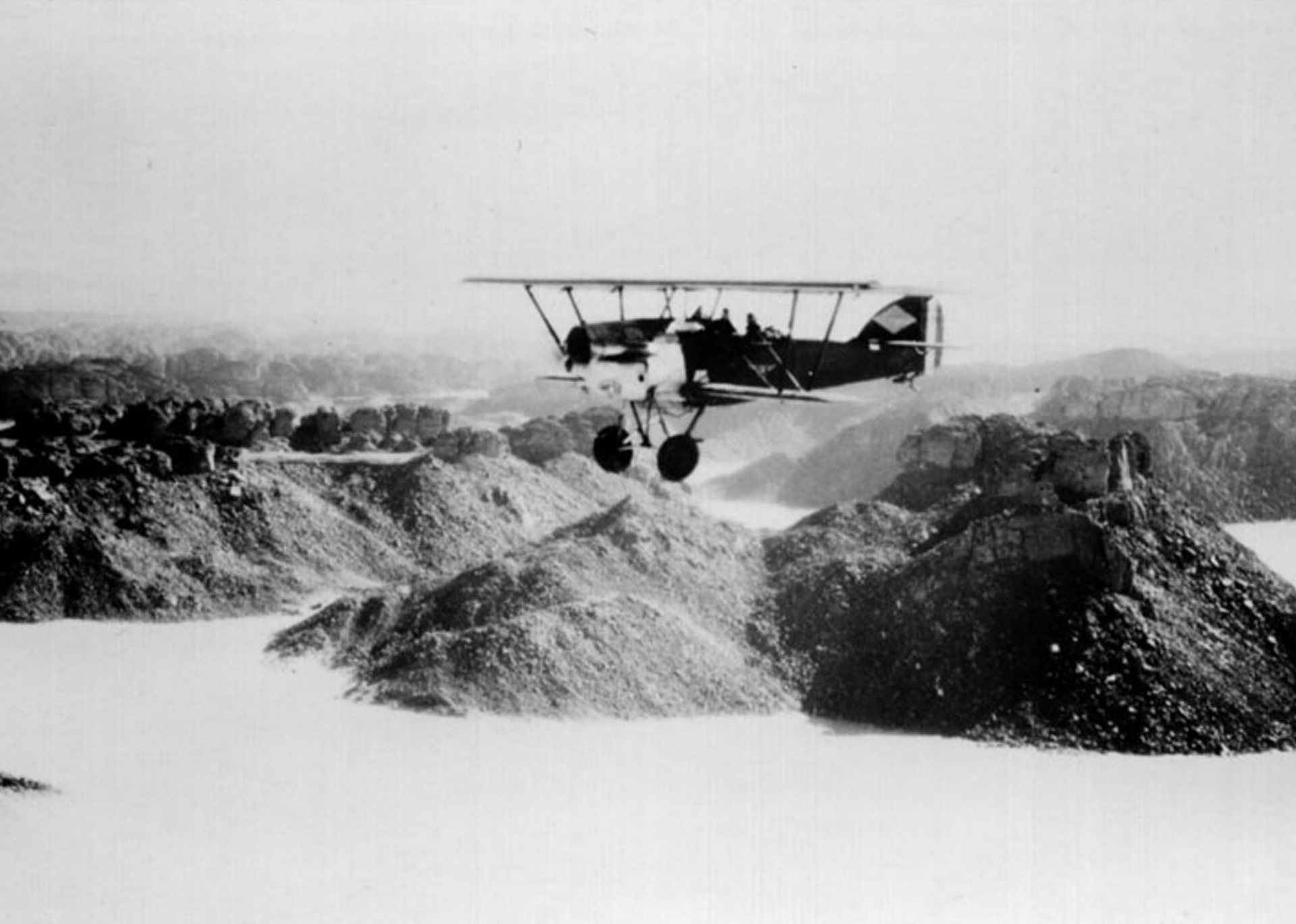
Potez 25 du 3ème GAA sur Djanet en 1935 (Paul Poinsot)