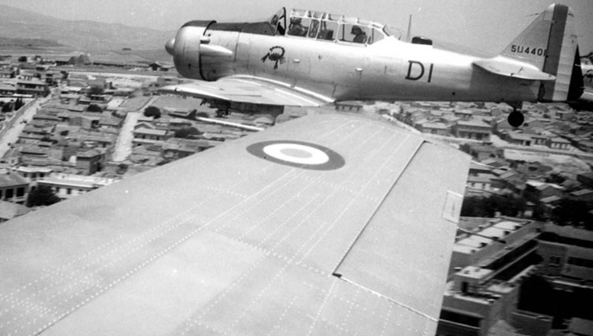
T-6 de l'EALA 19/72 sur Sétif le 14 juillet 1960 (Bernard Chenel)