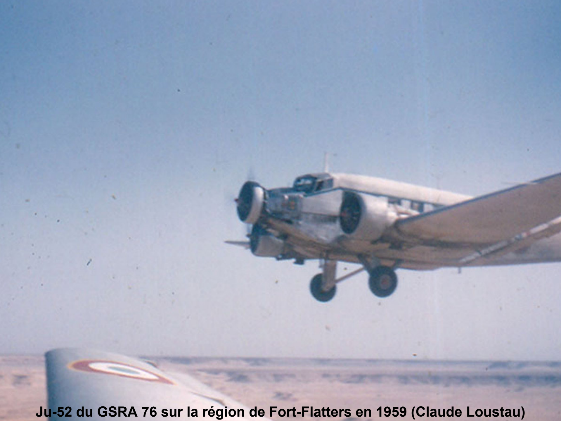
Ju-52 du GSRA 76 sur la région de Fort-Flatters en 1959 (Claude Loustau)