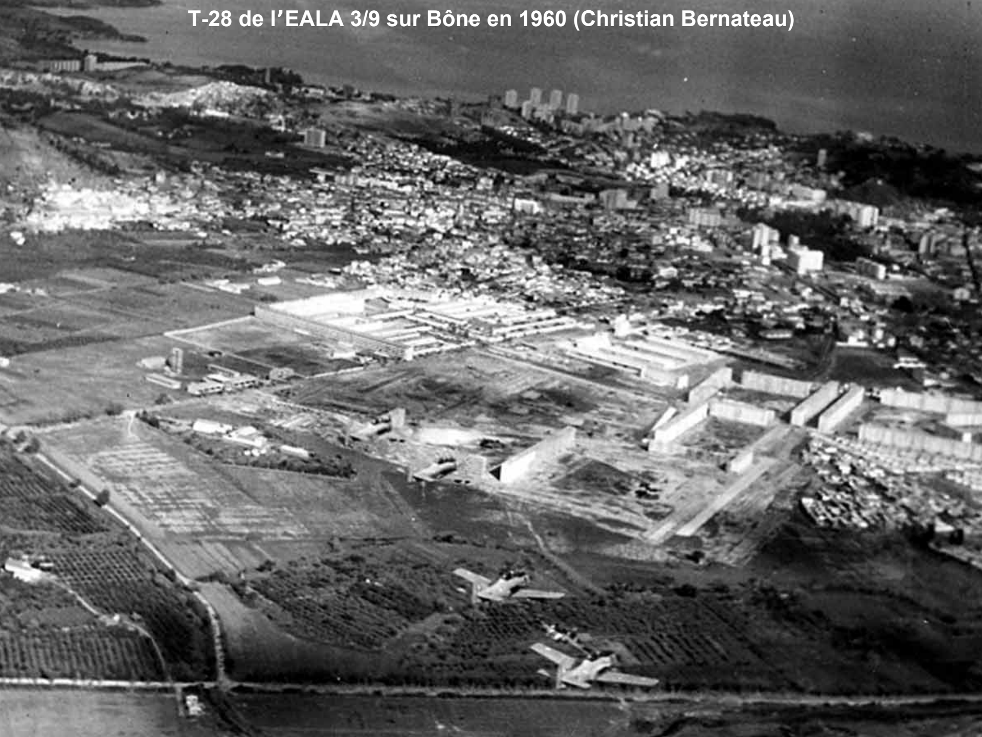
T-28 de l'EALA 3/9 sur Bône en 1960 (Christian Bernateau)