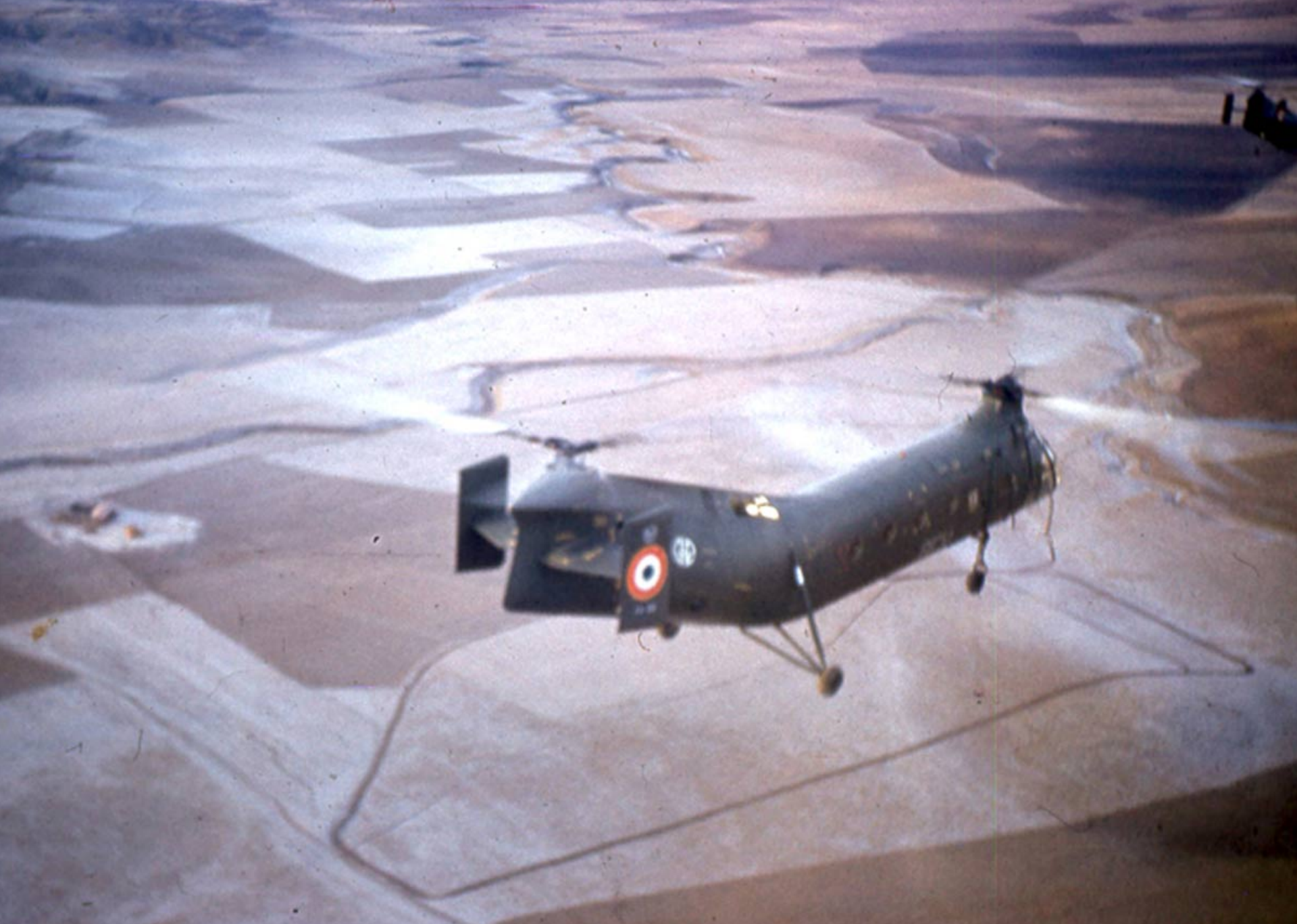
H-21 du GH2 sur l'Aurès en 1960 (Gérard Etori)