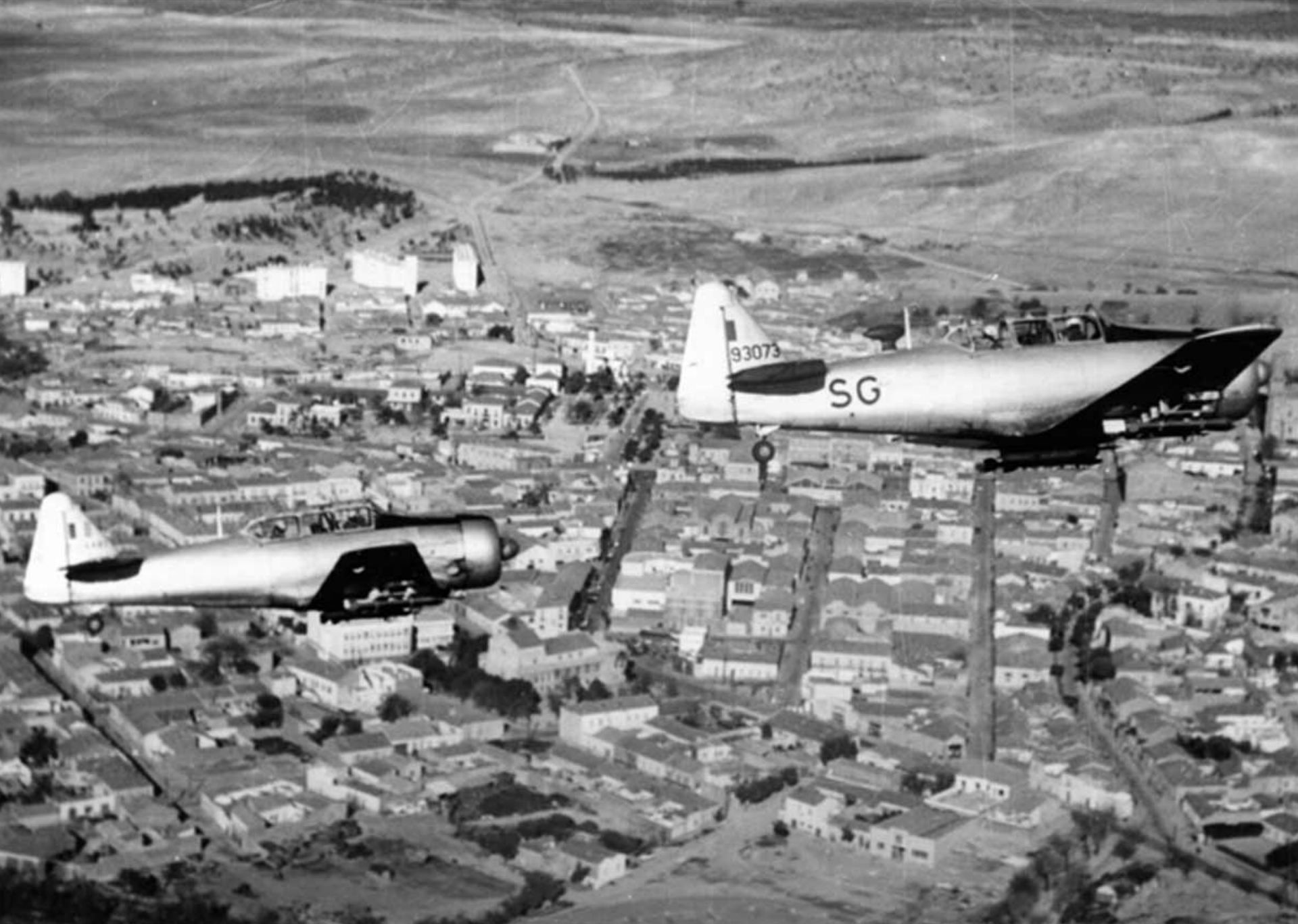
T-6 de l'EALA 20/72 sur Saïda en 1959 (Arthur Smet)