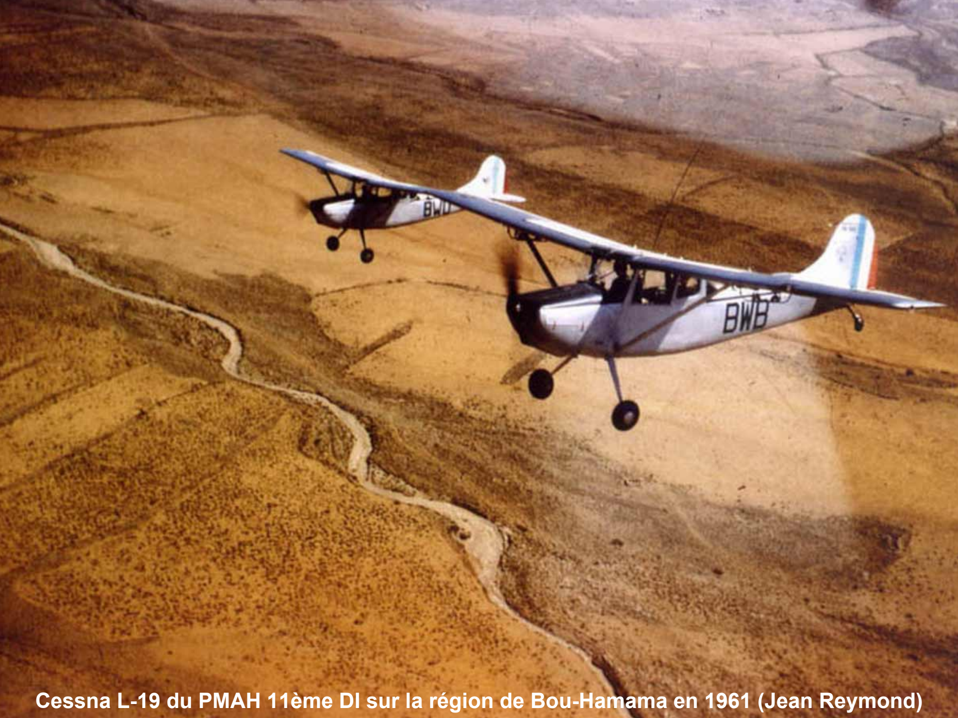
Cessna L-19 du PMAH 11ème DI sur la région de Bou-Hamama en 1961