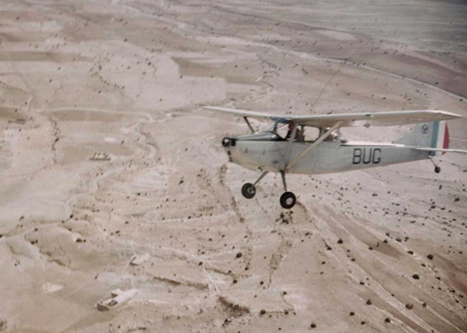
Cessna L-19 du 1er PMAH 21ème DI sur la région de l'oued Bou-Rich en 1960 (André Chauvière)