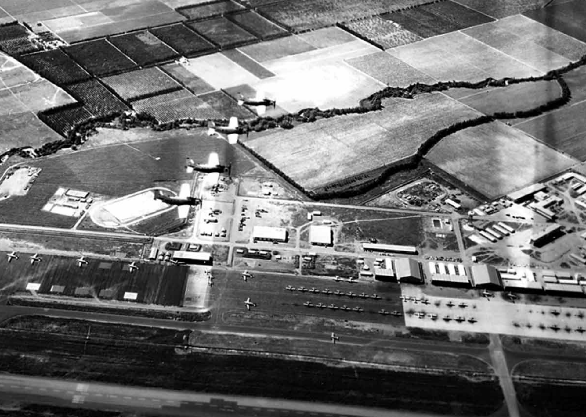
Skyraider de l'EC 1/20 sur l'aérodrome de Boufarik en 1960 (Christian Bernateau)