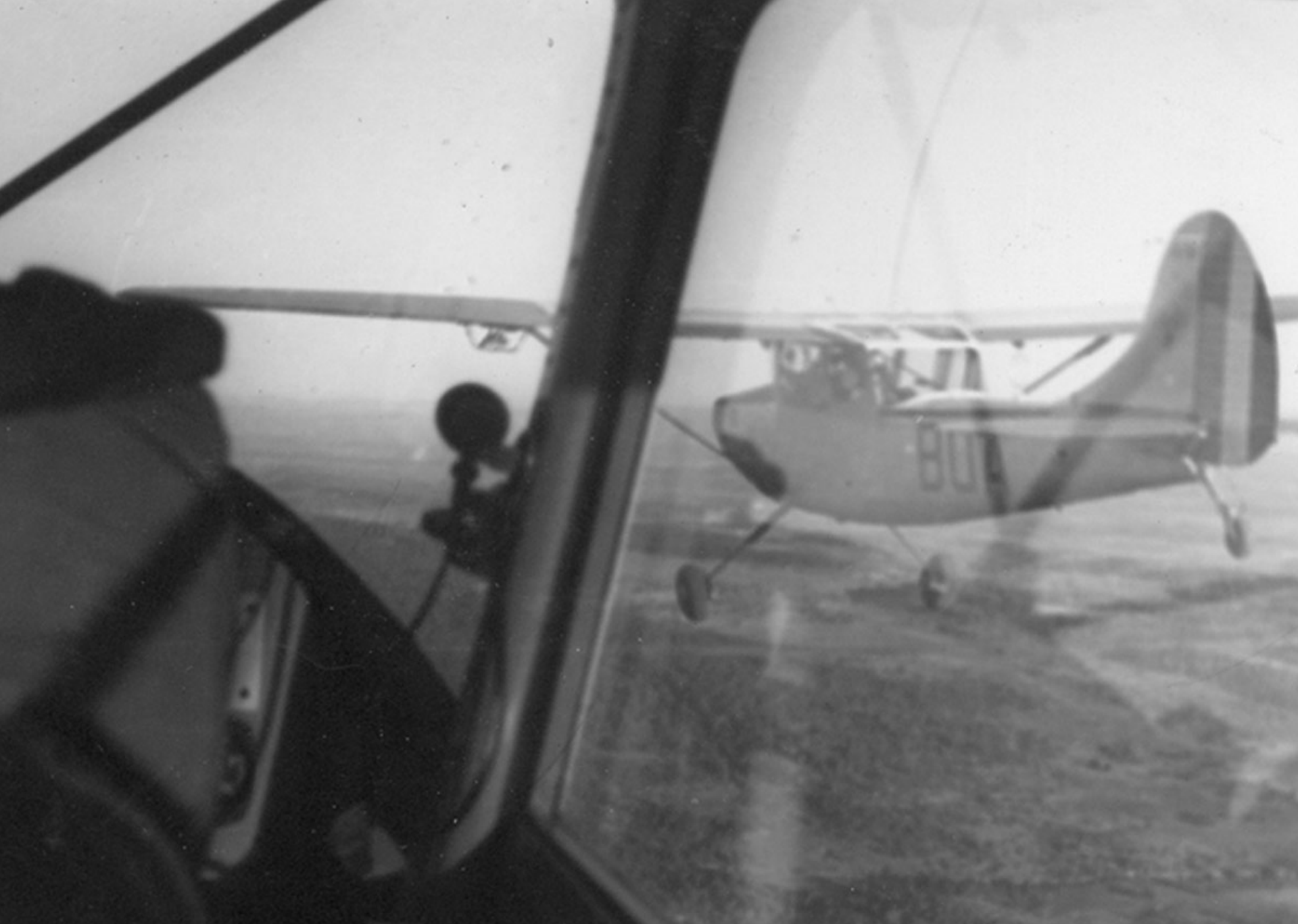
Cessna L-19 sur la région de Djelfa en 1961 (Pierre Jarrige)