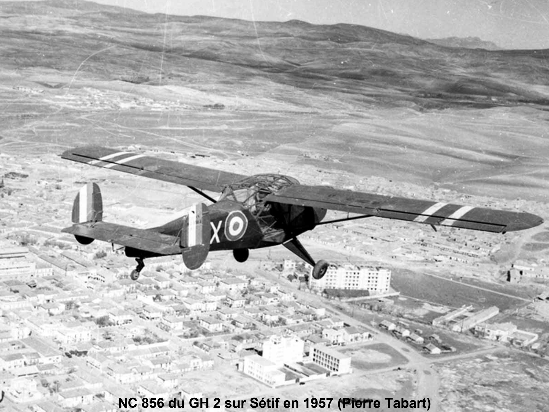
NC 856 du GH 2 sur Sétif en 1957 (Pierre Tabart)