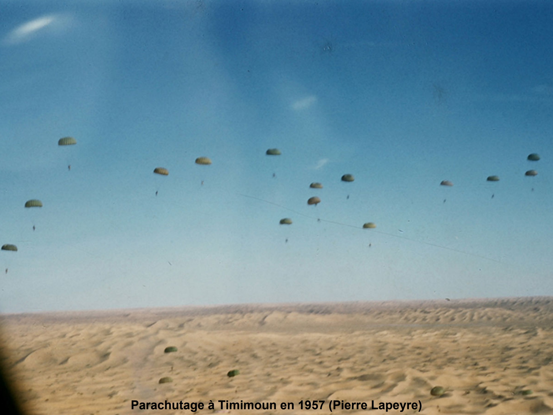
Parachutage à Timimoun en 1957 (Pierre Lapeyre)