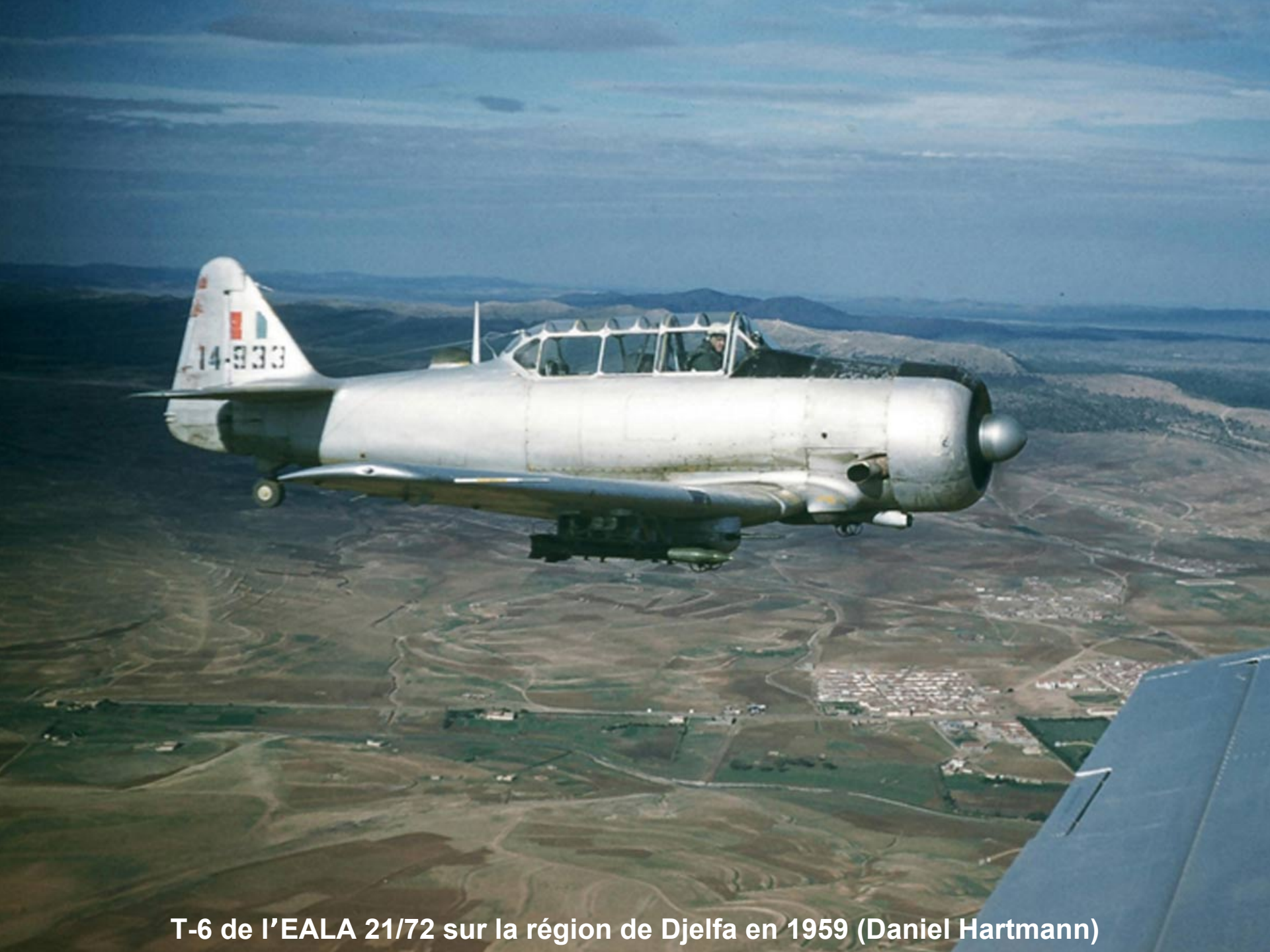
T-6 de l'EALA 21/72 sur la région de Djelfa en 1959