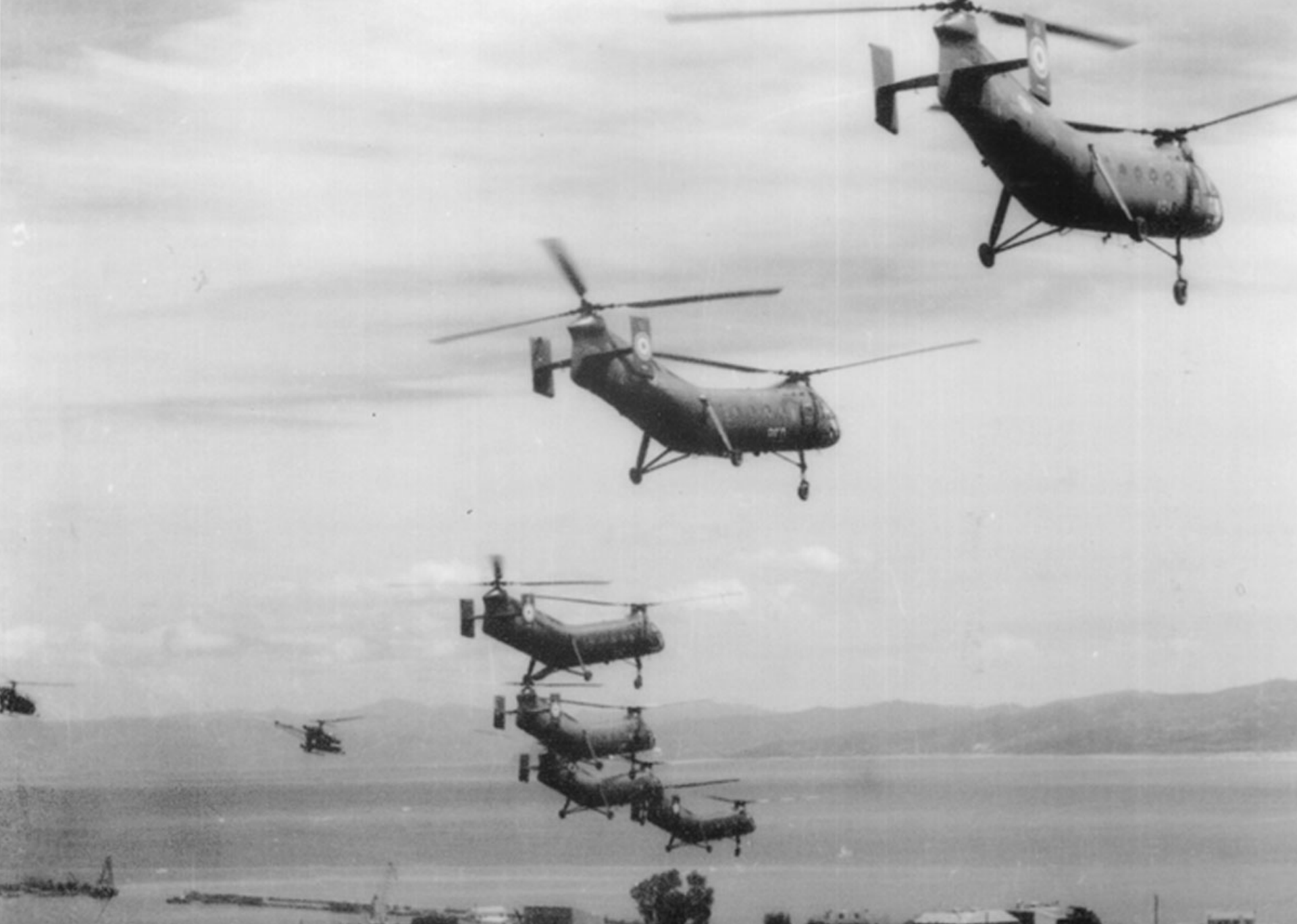
Alouette et H-21 d'un DIH du GH2 sur Djidjelli en 1959 (Déodat Puy-Montbrun)