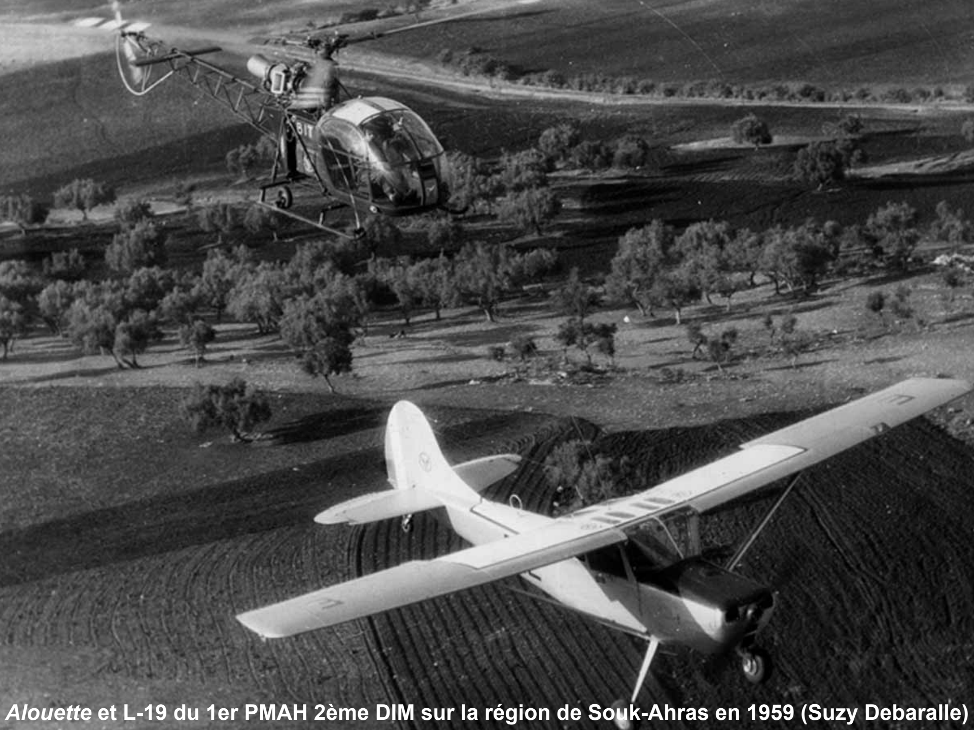
Alouette et L-19 du 1er PMAH 2ème DIM sur la région de Souk-Ahras en 1959 (Suzy Debaralle)