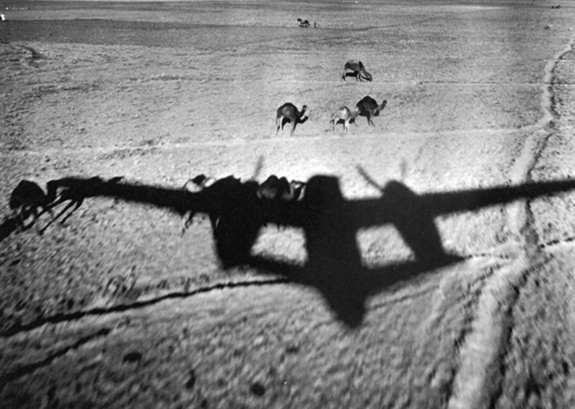
Ombre d'un B-26 Invader du GB 2/91 sur les Hauts-Plateaux en 1960 (Michel Lucq)