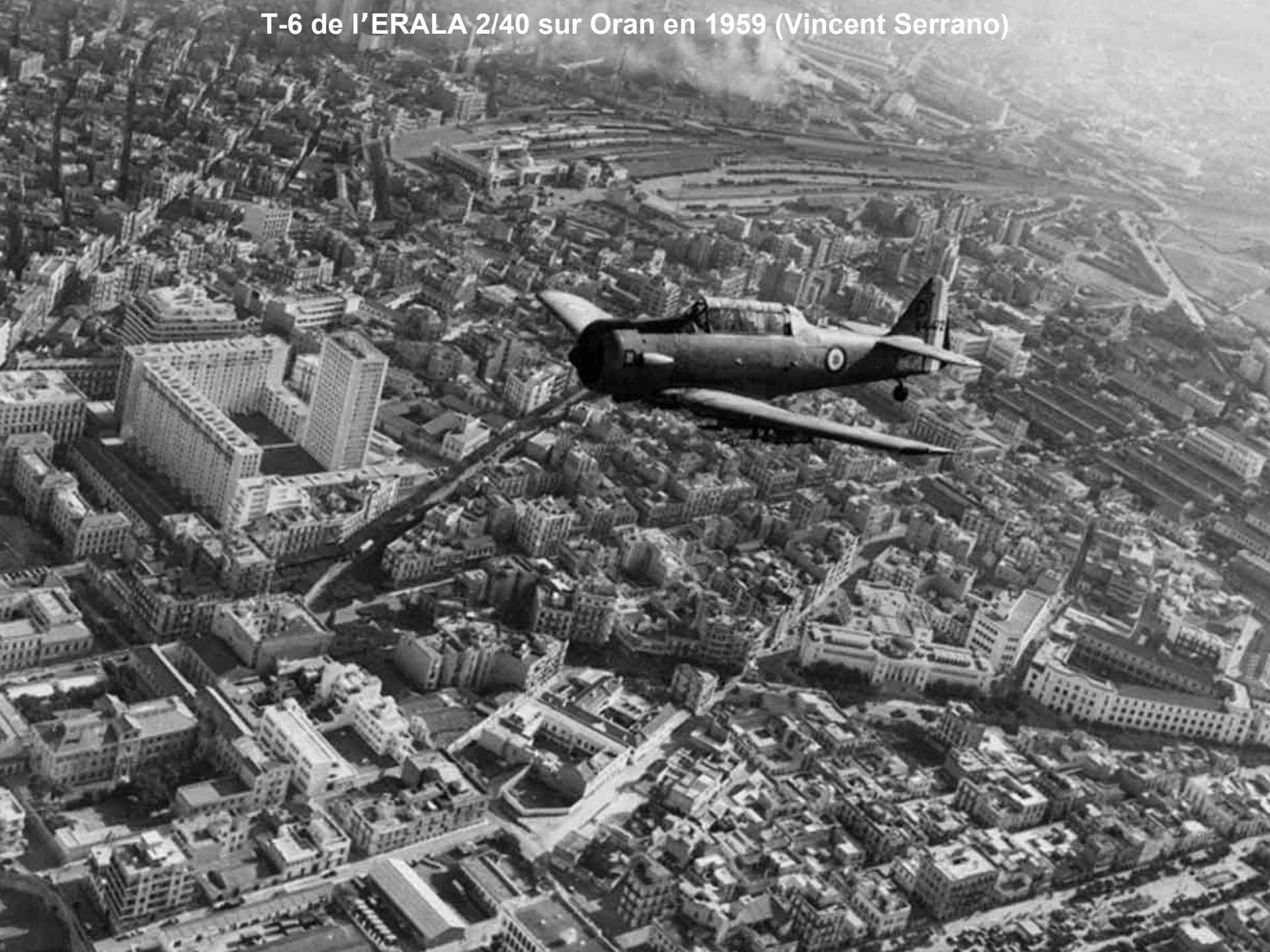
T-6 de l'ERALA 2/40 sur Oran en 1959 (Vincent Serrano)