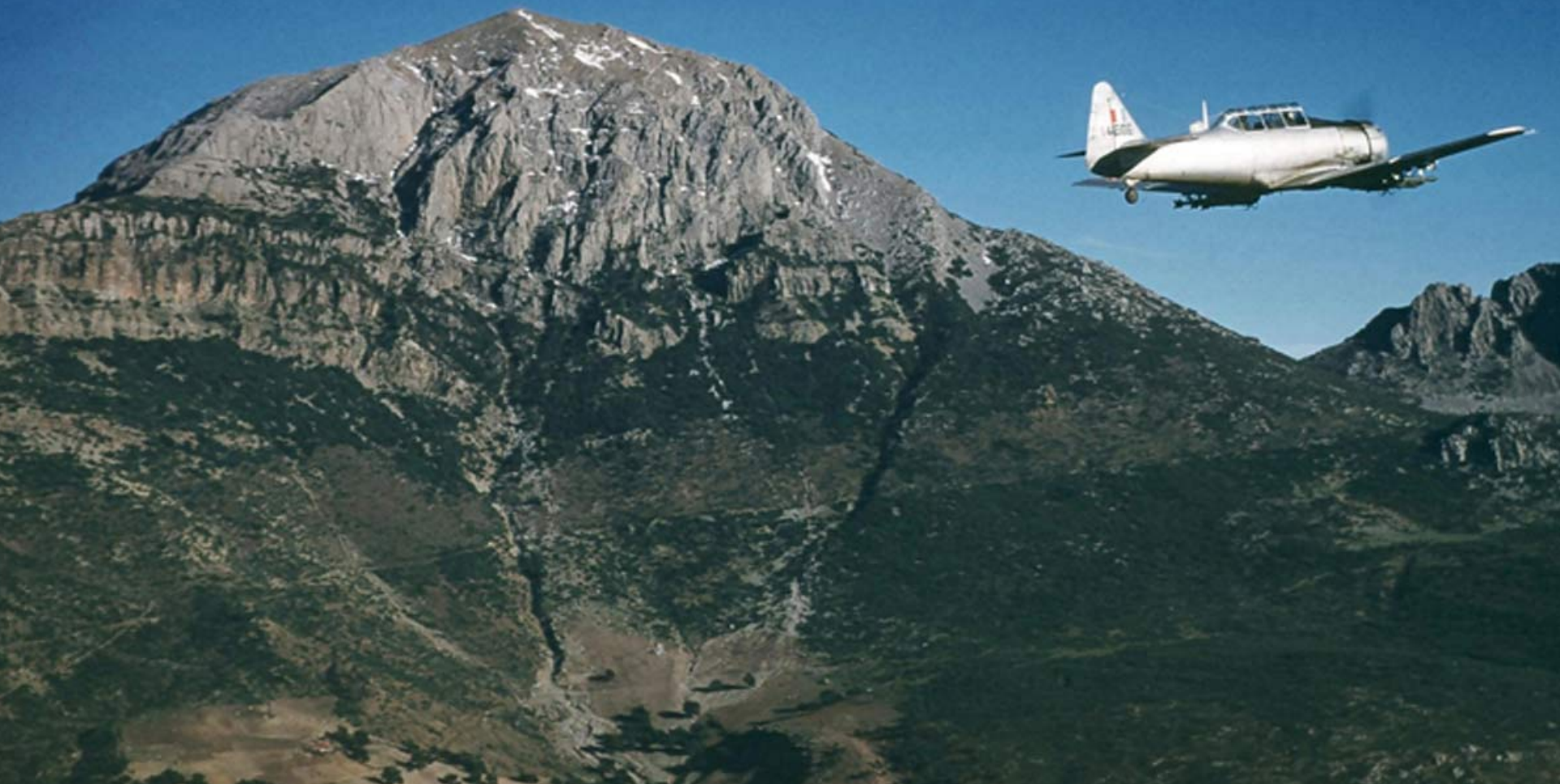
T-6 de l'EALA 21/72 sur l'Ouarsenis en 1960 (Daniel Hartmann)