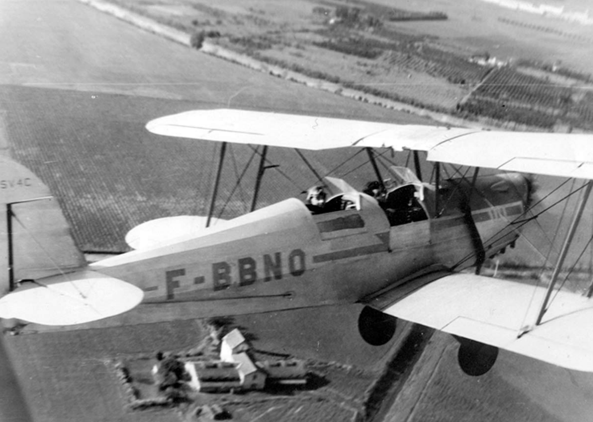
Stampe de l'AC de Bône sur la campagne en 1955 (Jean-Marc Lavie)