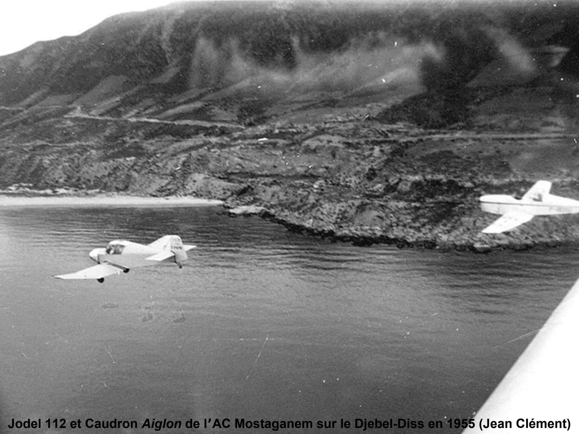
Jodel 112 et Caudron Aiglon de l'AC Mostaganem sur le Djebel-Diss en 1955