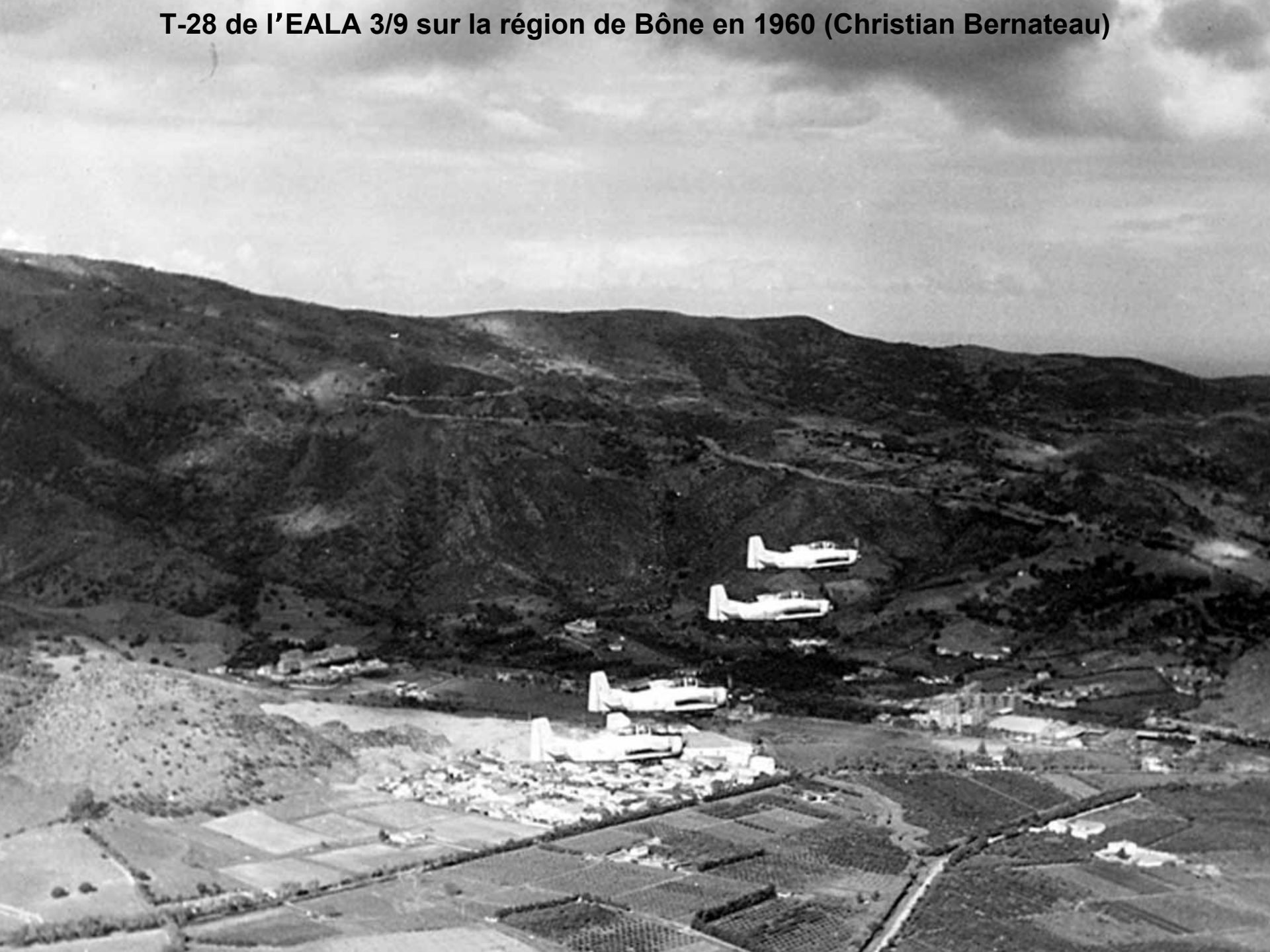
T-28 de l'EALA 3/9 sur la région de Bône en 1960 (Christian Bernateau)