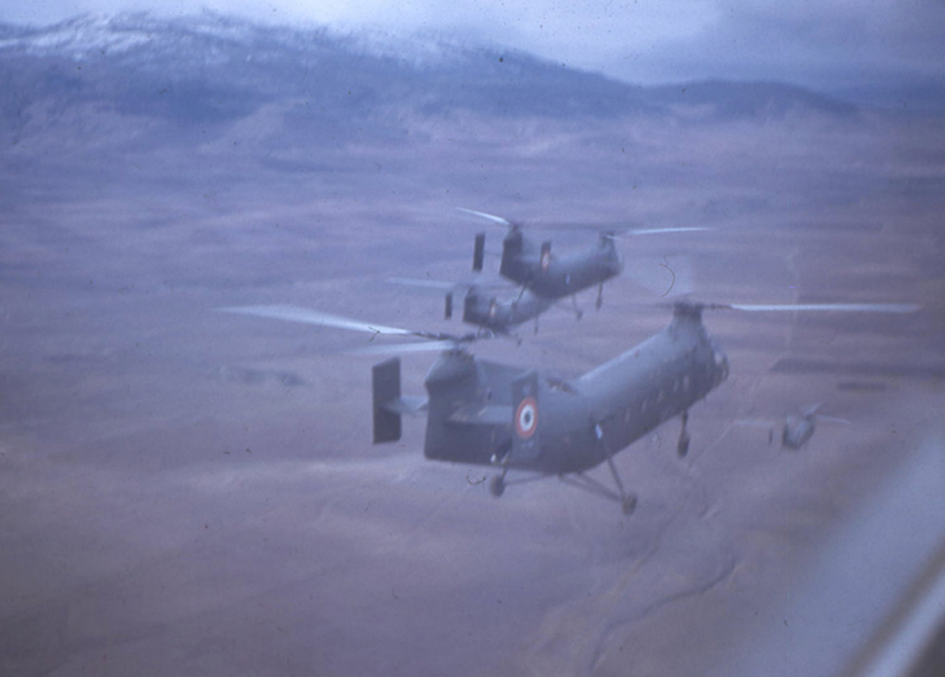
H-21 du GH2 sur l'Aurès en 1960 (Gérard Etori)