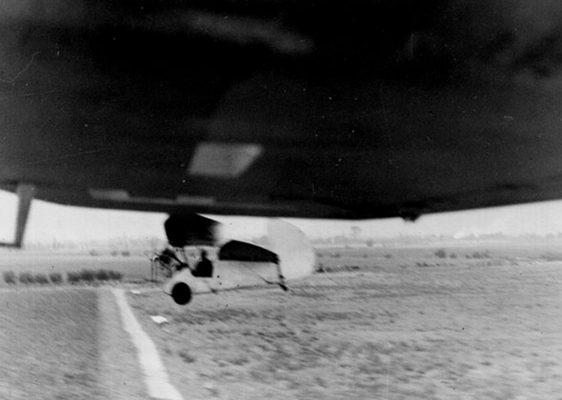
Pou du Ciel d'André Vanoni entre Koléa et Blida en 1935 (Jean Neveux)