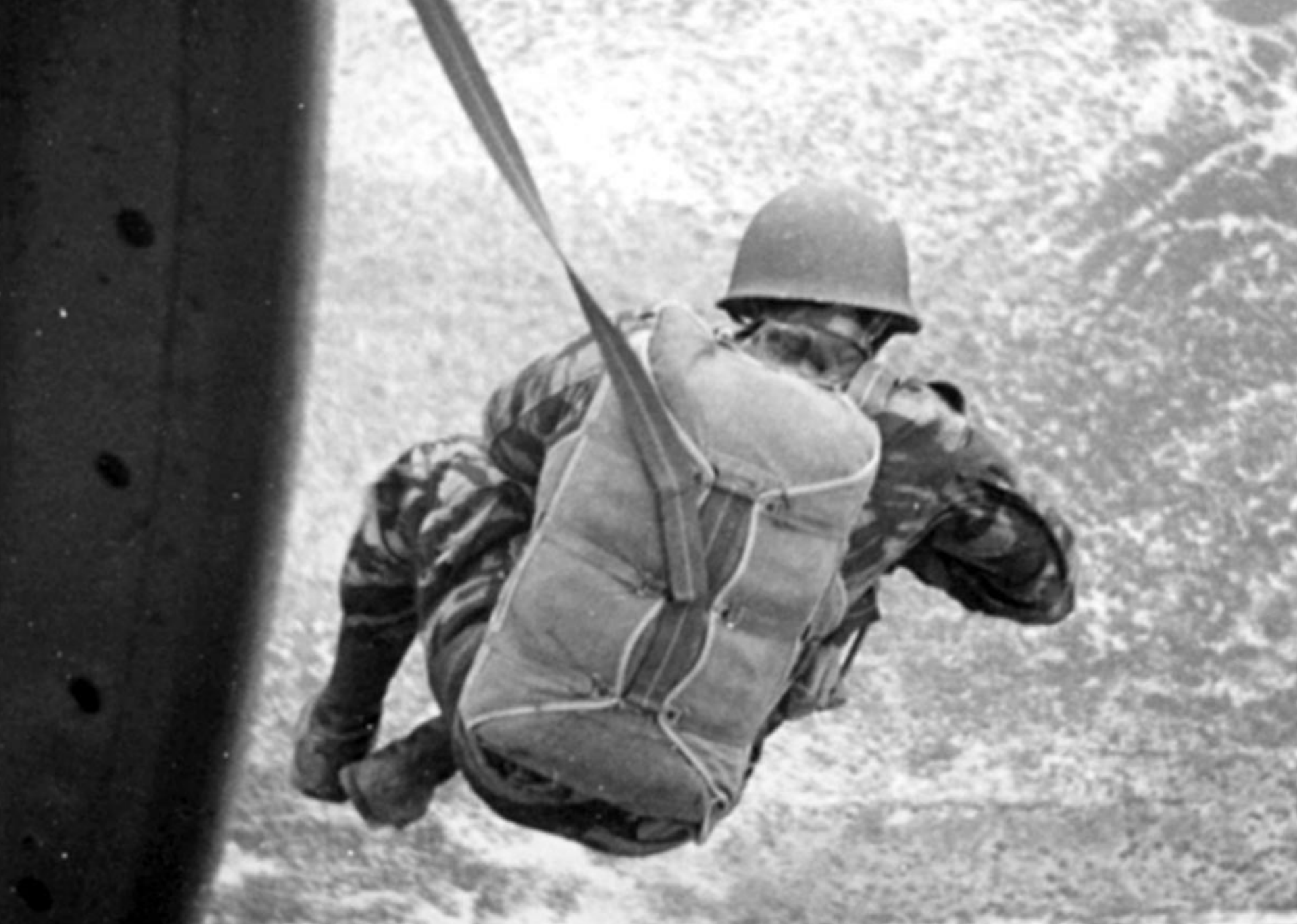
Saut prémilitaire sur la DZ d'Arbal (Oran) en 1960 (Claude Marcellin)