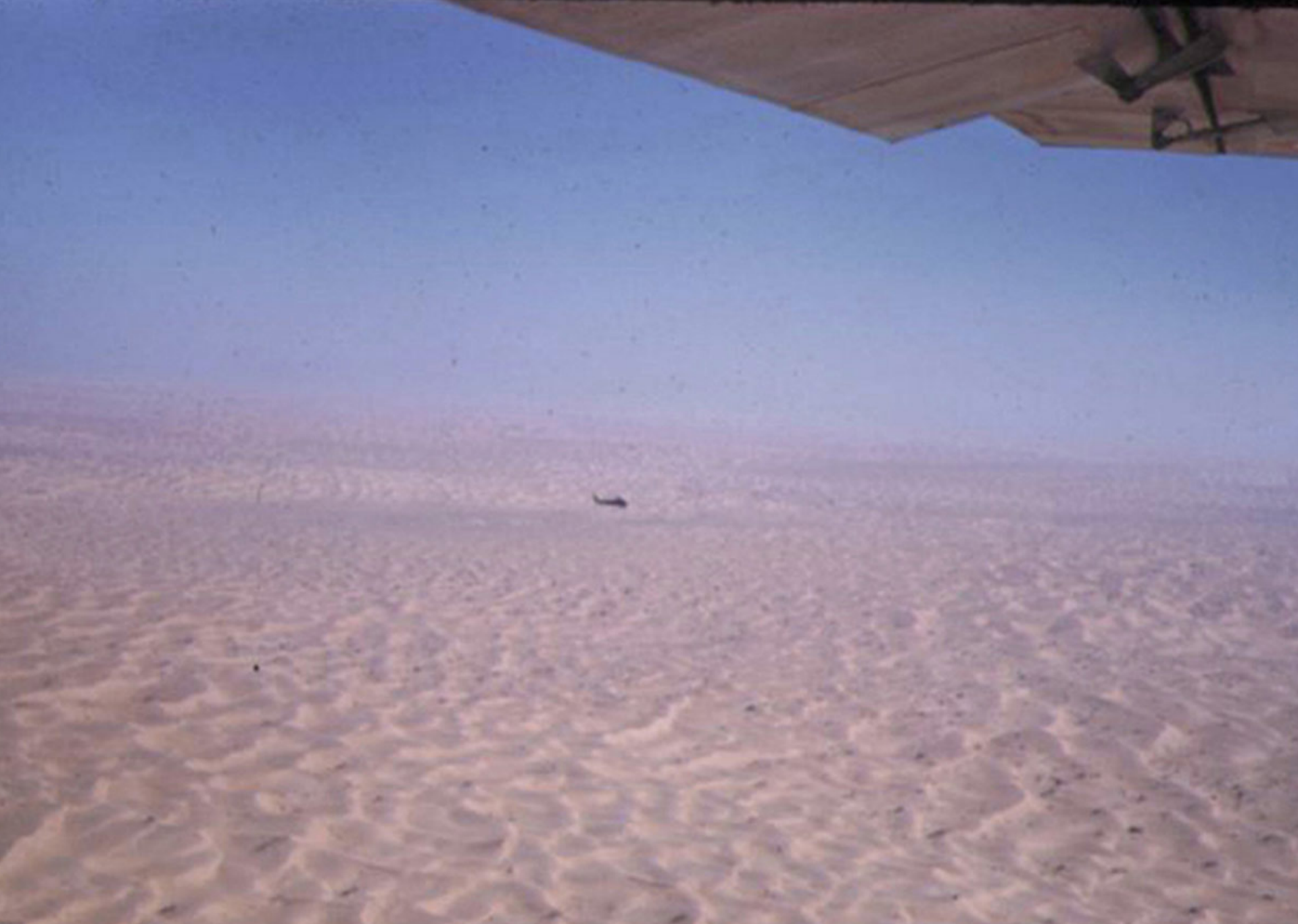
H-34 de l'EH2 sur la région d'El-Abiod en 1957 (Philippe Desqueroux)