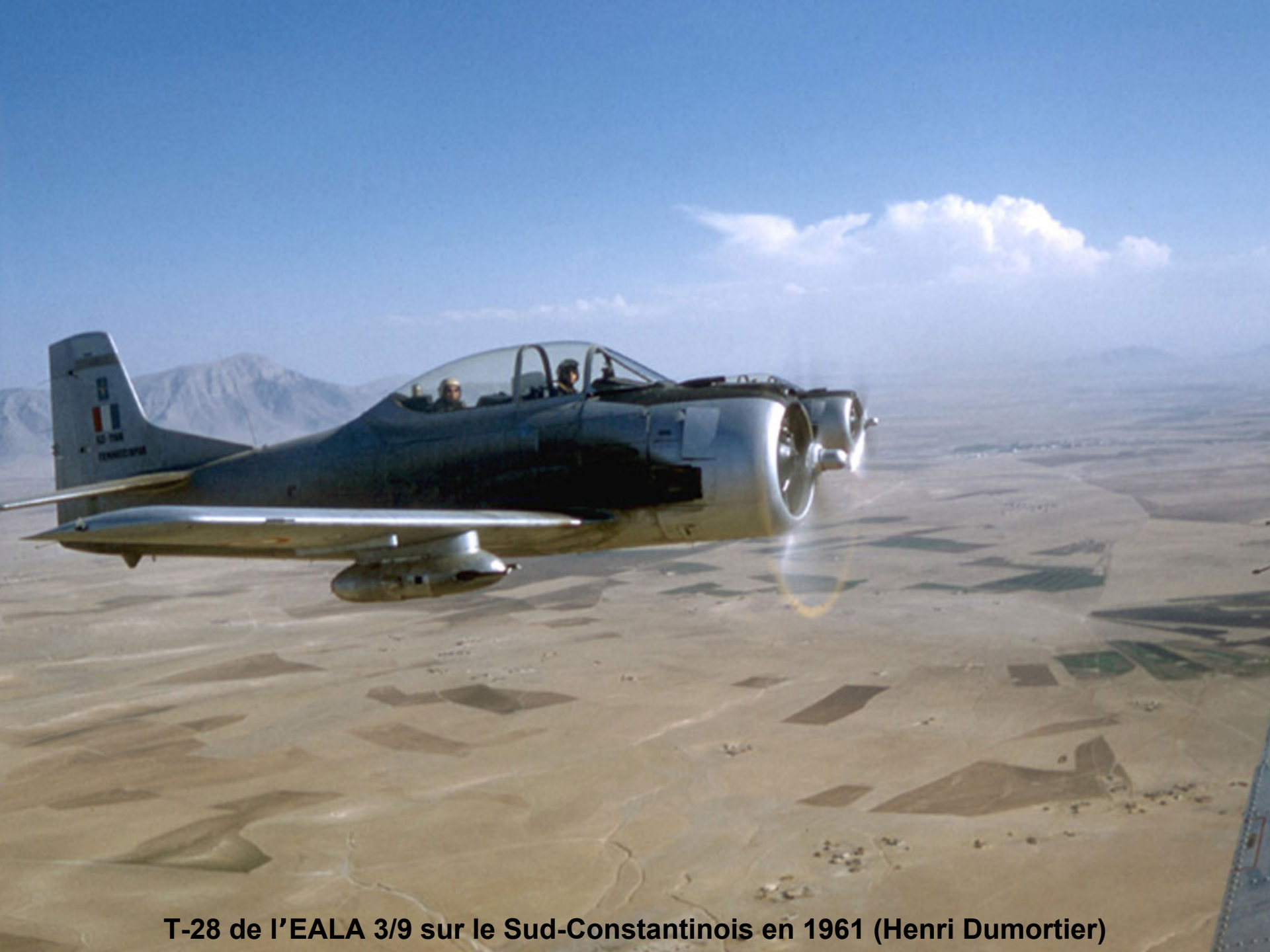
T-28 de l'EALA 3/9 sur le Sud-Constantinois en 1961 (Henri Dumortier)