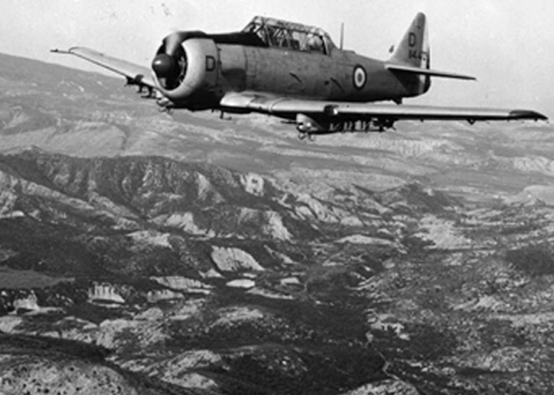
T-6 de l'ERALA 2/40 sur la région d'Oran en 1959 (Vincent Serrano)