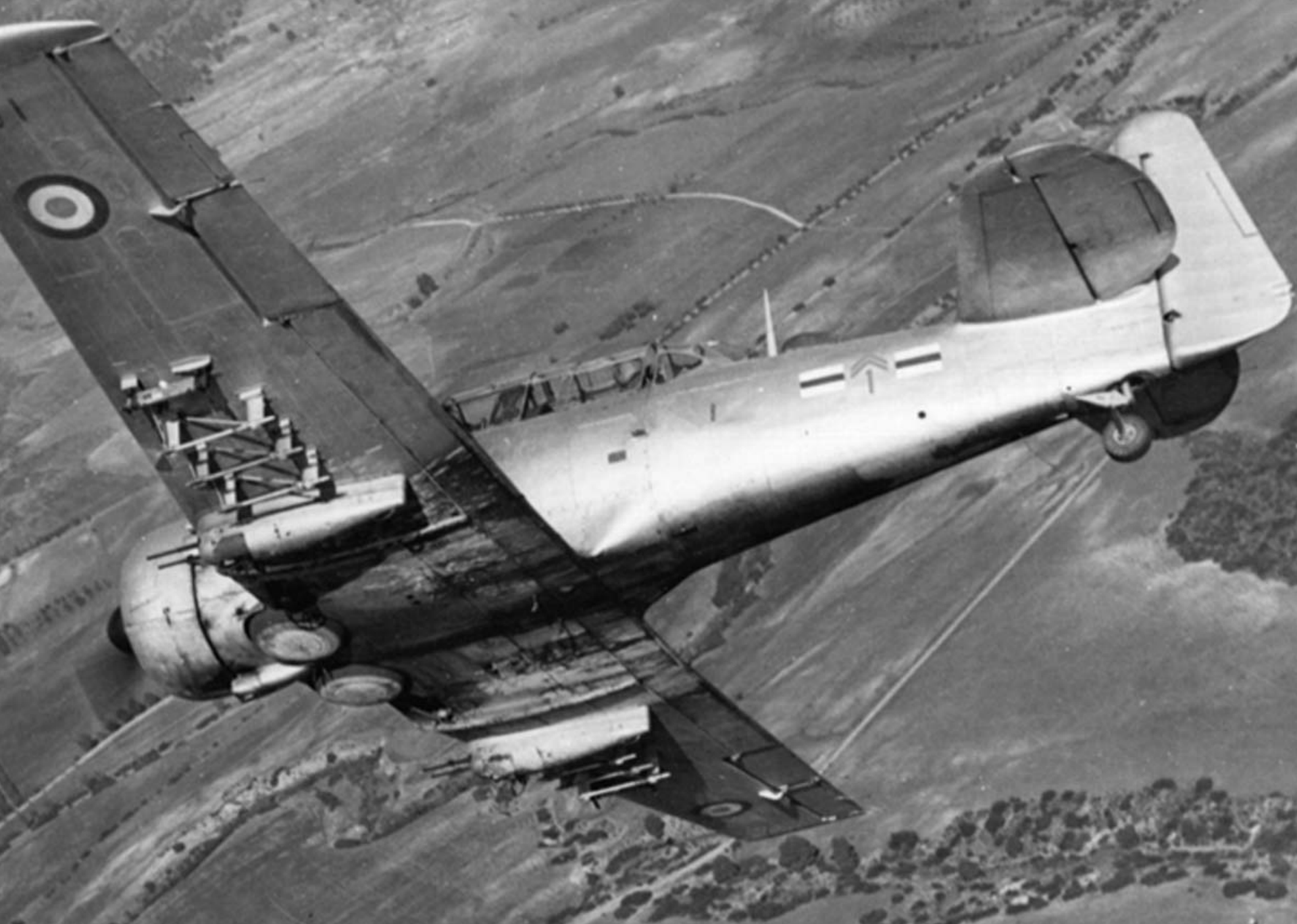
T-6 de l'EALA 20/72 sur la région de Saïda en 1958 (Arthur Smet)