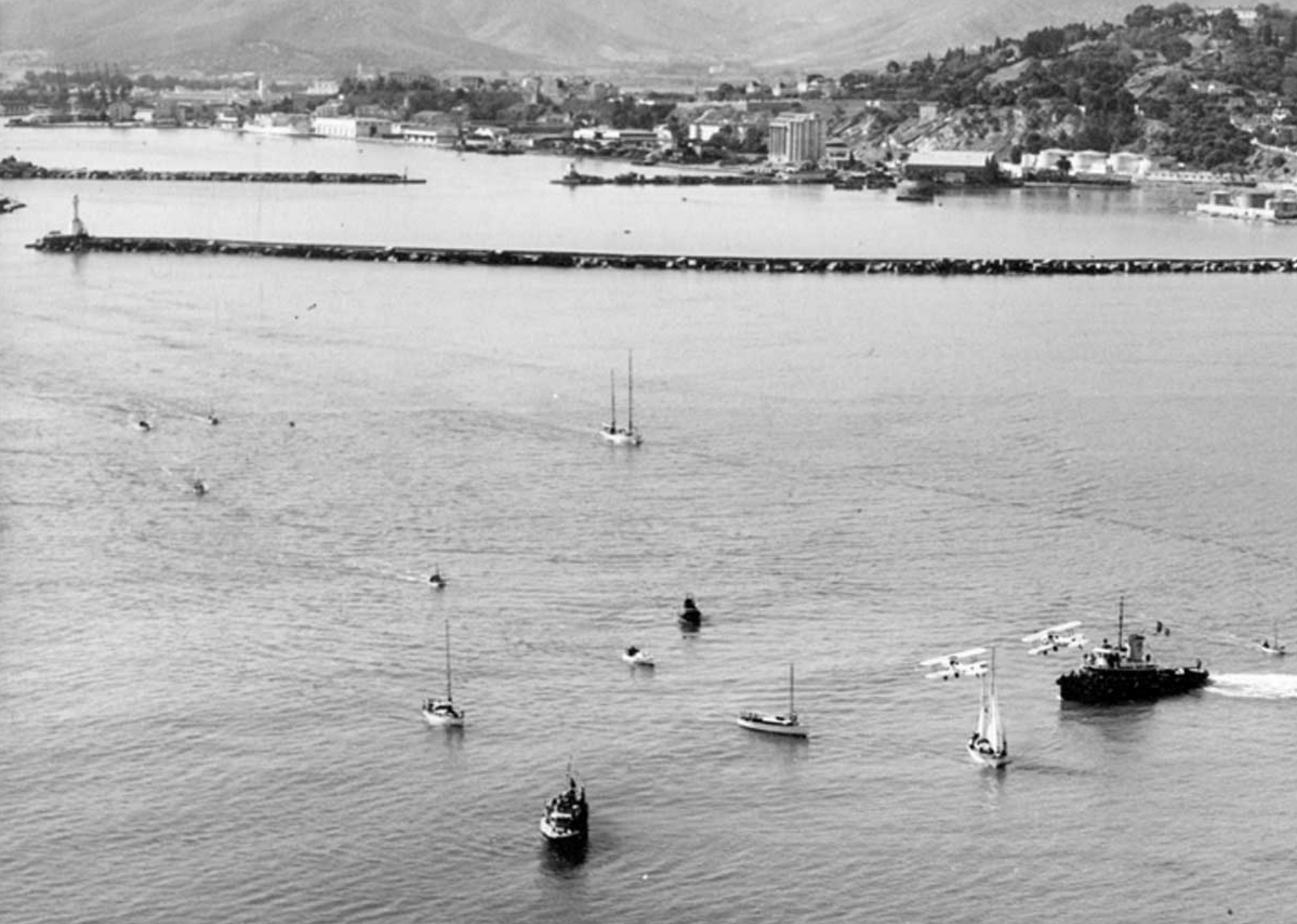
Deux Stampe sur l'entrée du port de Bône en 1953 (Henri Gantès)