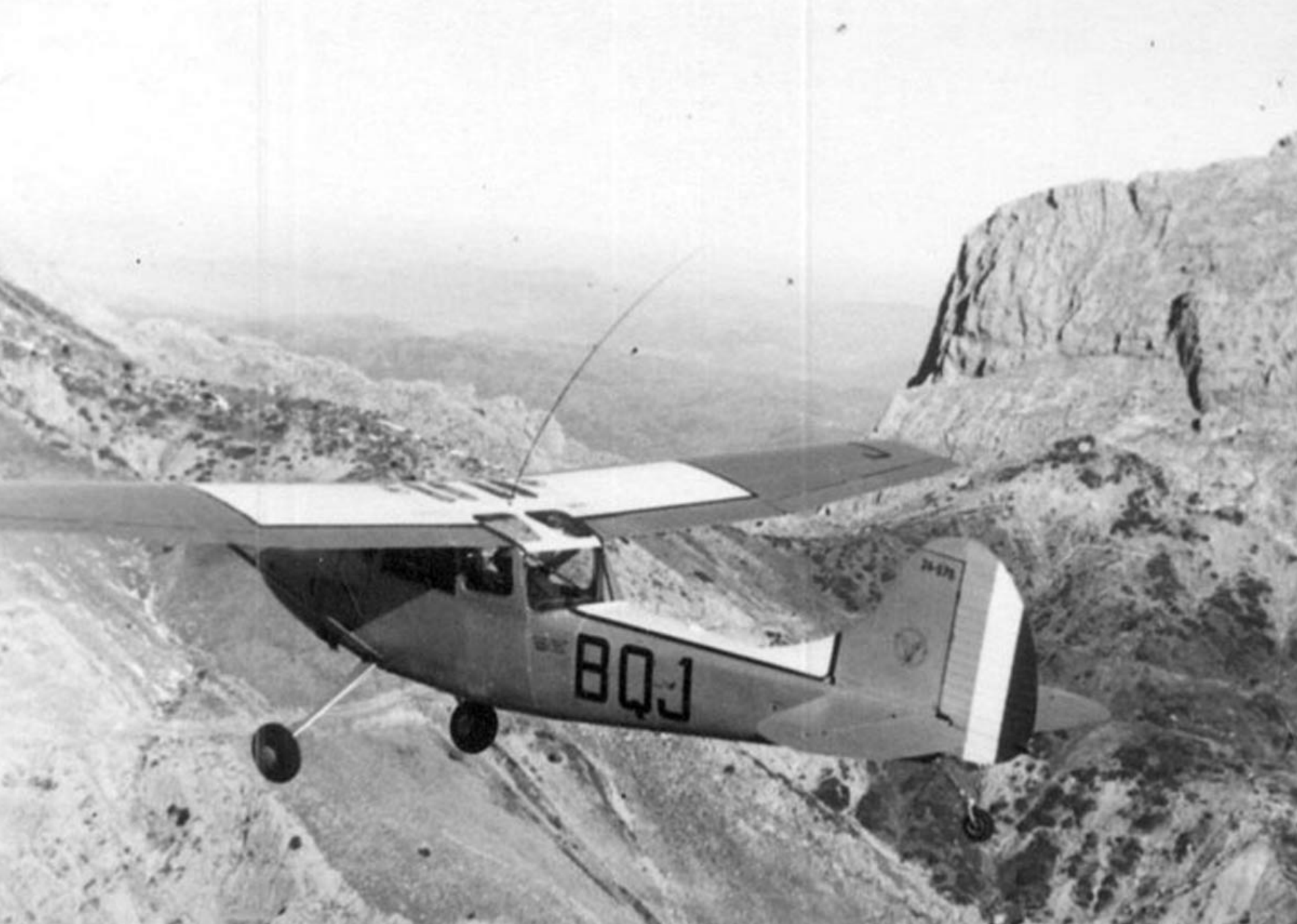
Cessna L-19 du PMAH 27ème DIA aux gorges de Kerrata en 1959 (Claude Requi)