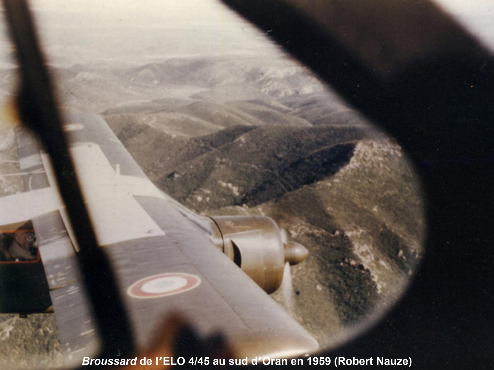
Broussard de l'ELO 4/45 au sud d'Oran en 1959 (Robert Nauze)