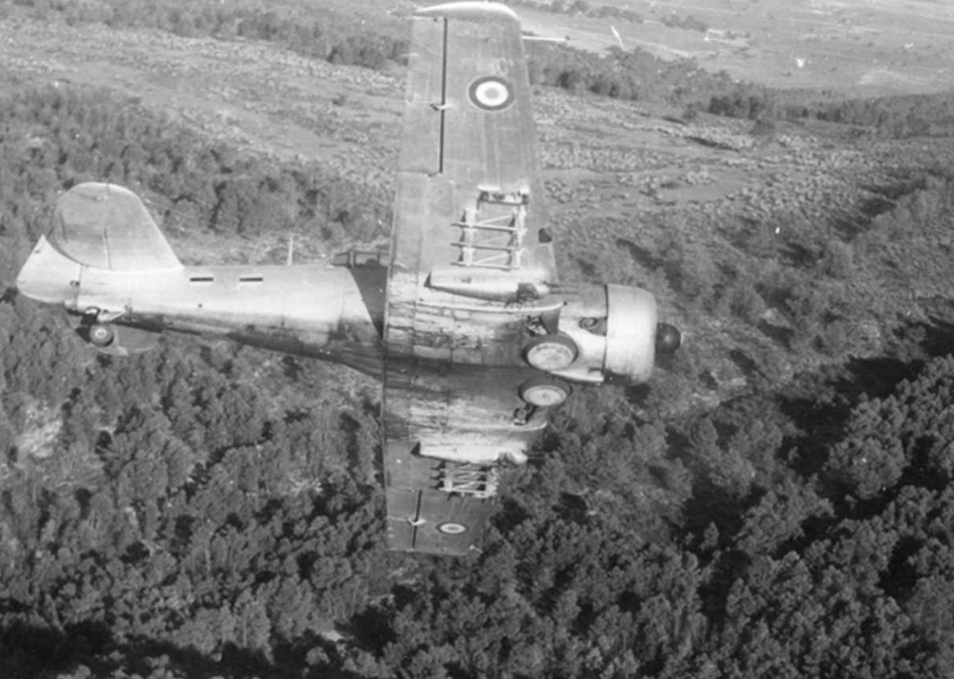
T-6 de l'EALA 20/72 sur la région de Saïda en 1959 (Arthur Smet)