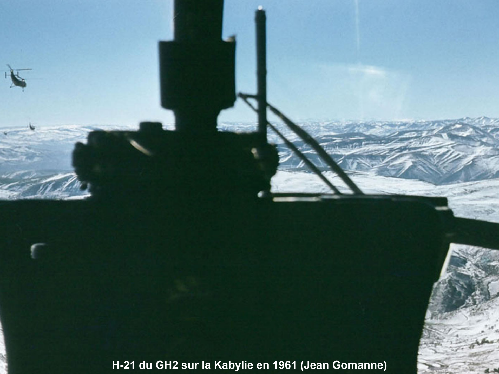
H-21 du GH2 sur la Kabylie en 1961 (Jean Gomanne)