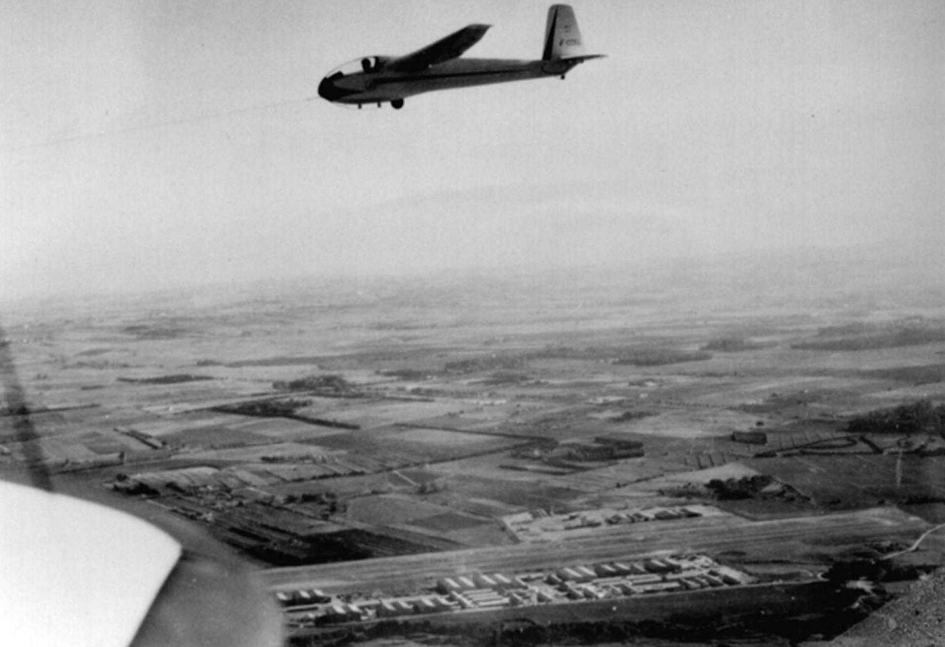
Planeur Javelot sur l'aérodrome de Chéragas en 1960 (Pierre Llopis)