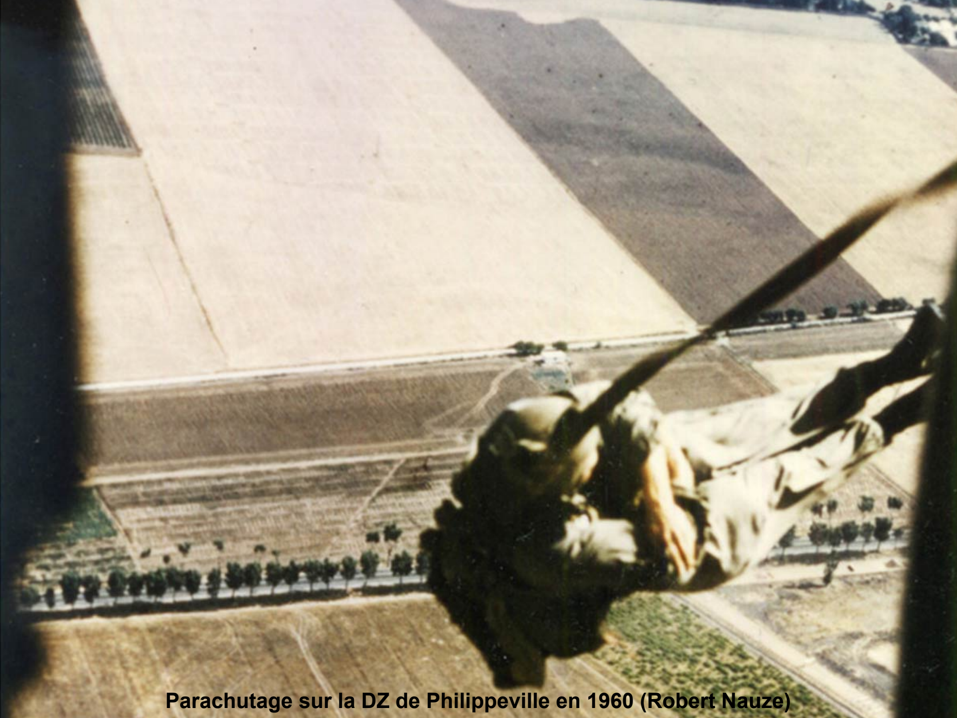
Parachutage sur la DZ de Philippeville en 1960 (Robert Nauze)