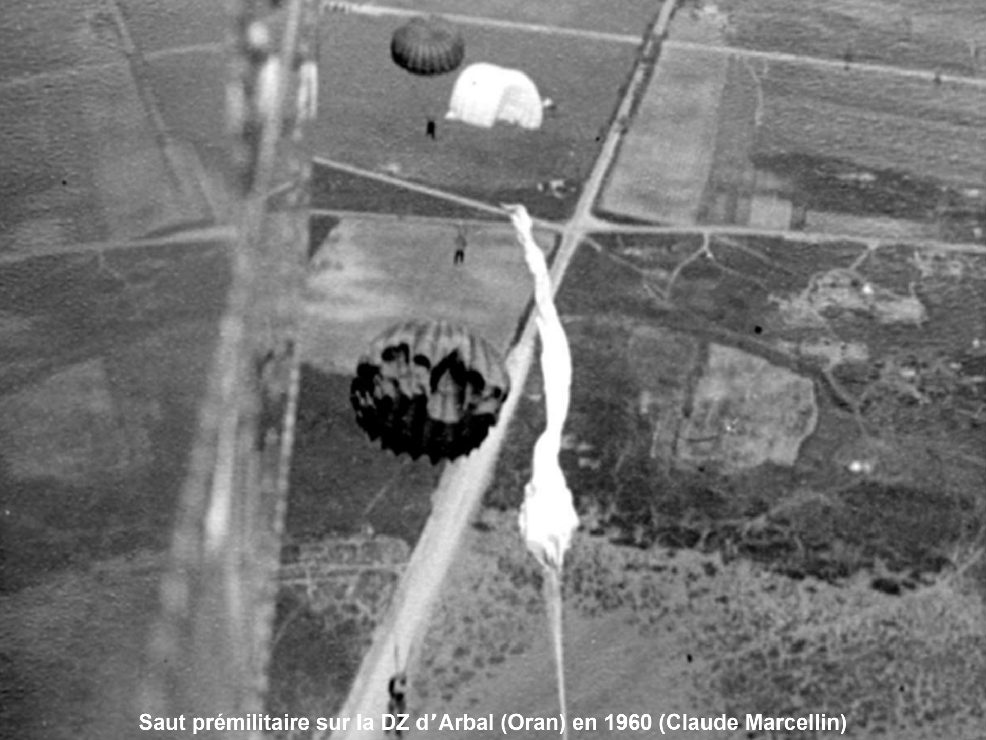
Saut prémilitaire sur la DZ d'Arbal (Oran) en 1960 (Claude Marcellin)