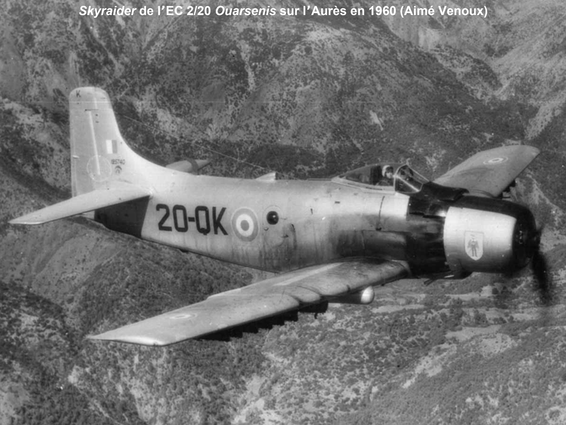
Skyraider de l'EC 2/20 Ouarsenis sur l'Aurès en 1960 (Aimé Venoux)