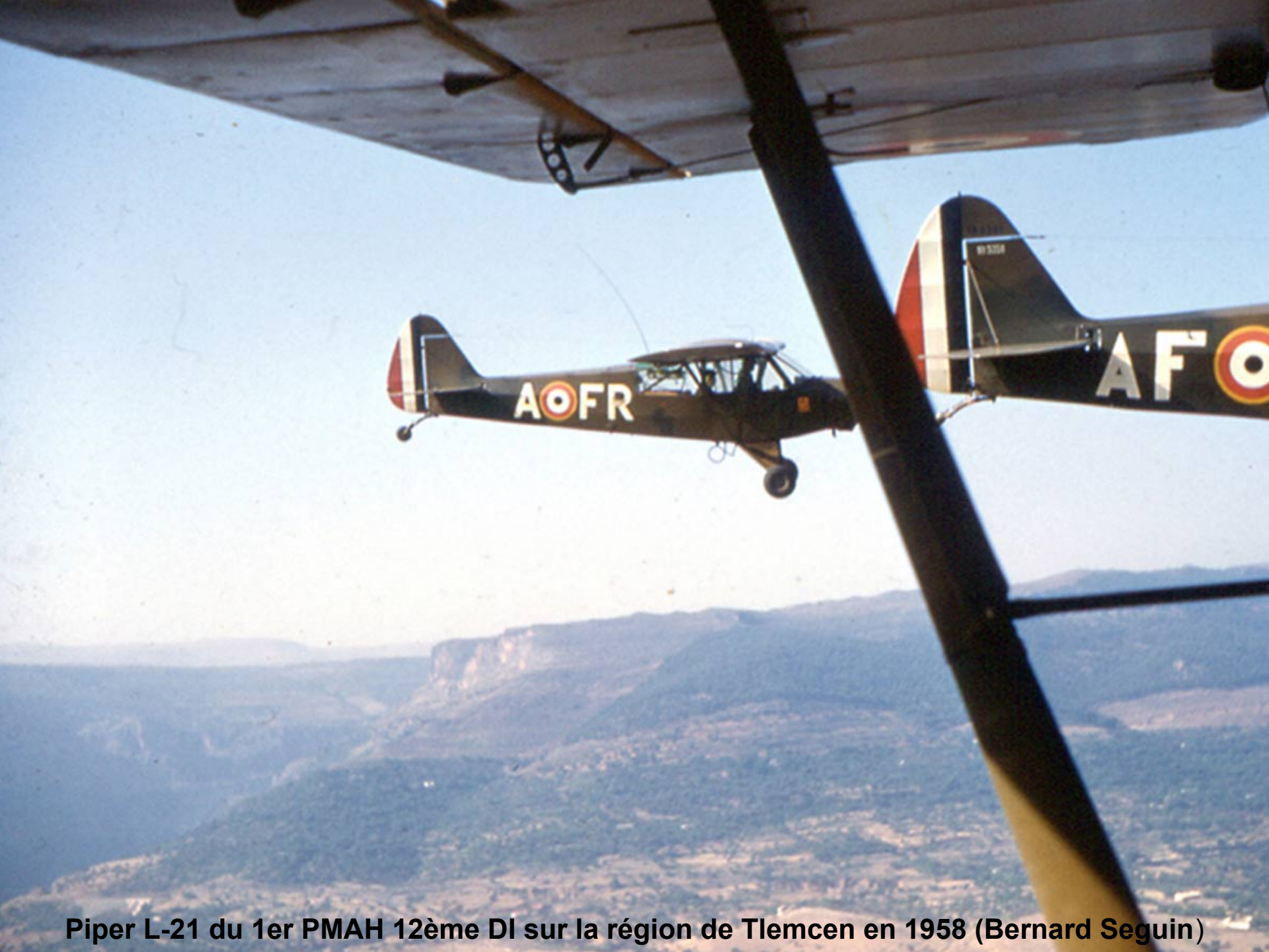
Piper L-21 du 1er PMAH 12ème DI sur la région de Tlemcen en 1958 (Bernard Seguin)