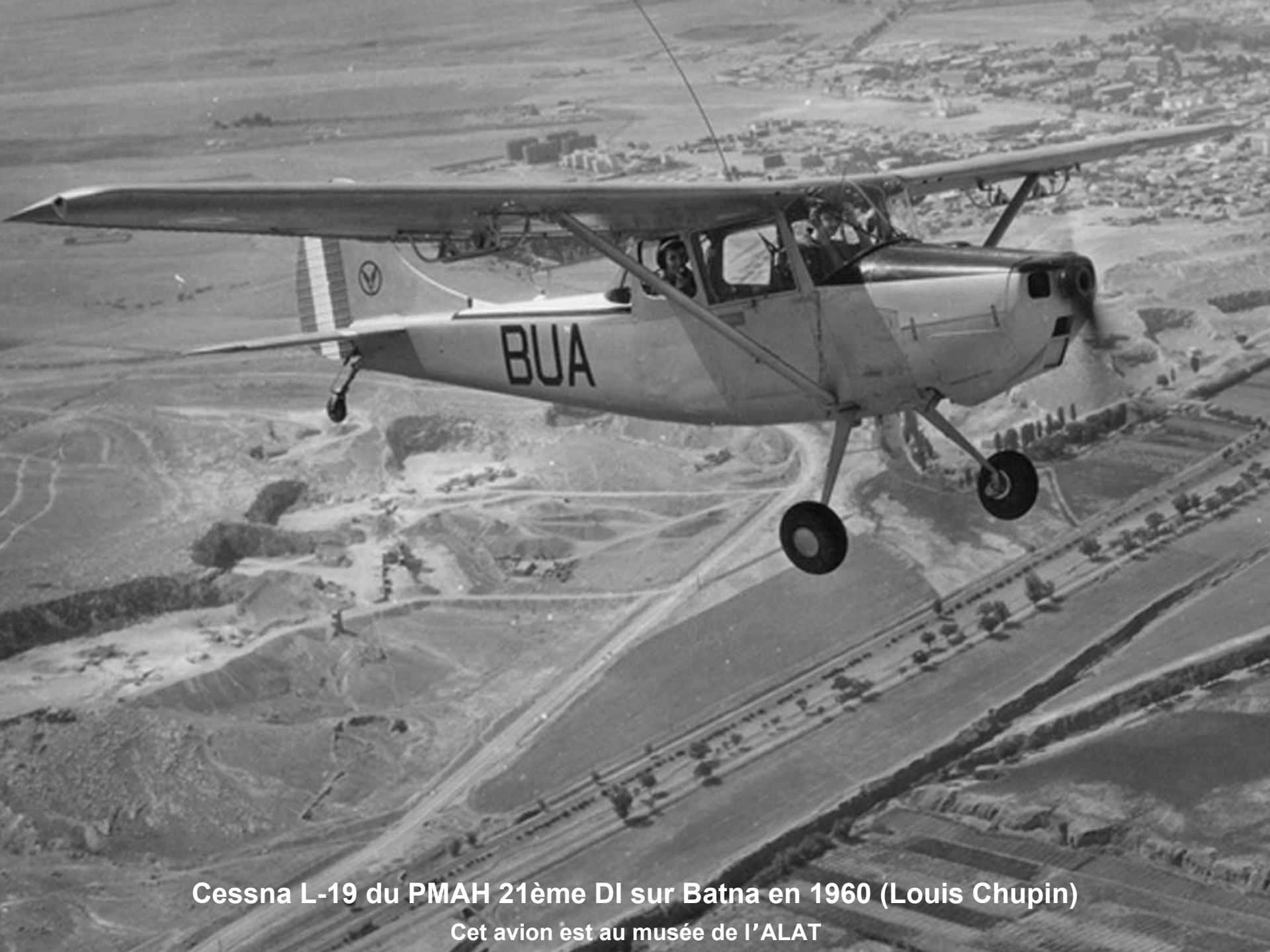
Cessna L-19 du PMAH 21ème DI sur Batna en 1960 (Louis Chupin)