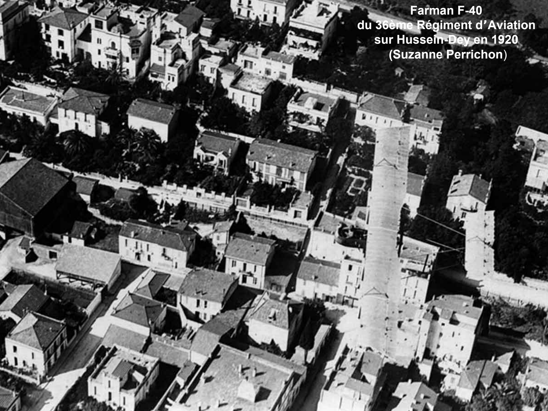
Farman F-40 du 36ème Régiment d'Aviation sur Hussein-Dey en 1920 (Suzanne Perrichon)