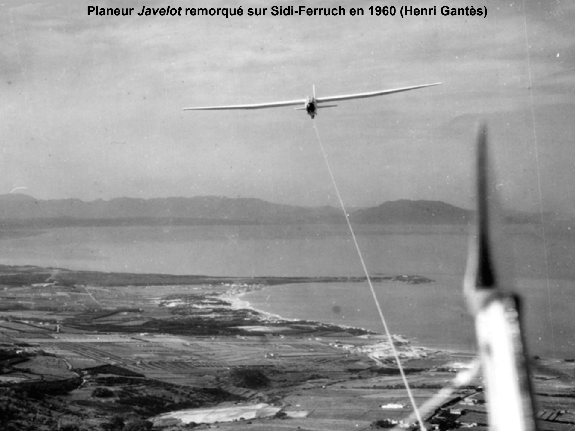
Planeur Javelot remorqué sur Sidi-Ferruch en 1960 (Henri Gantès)