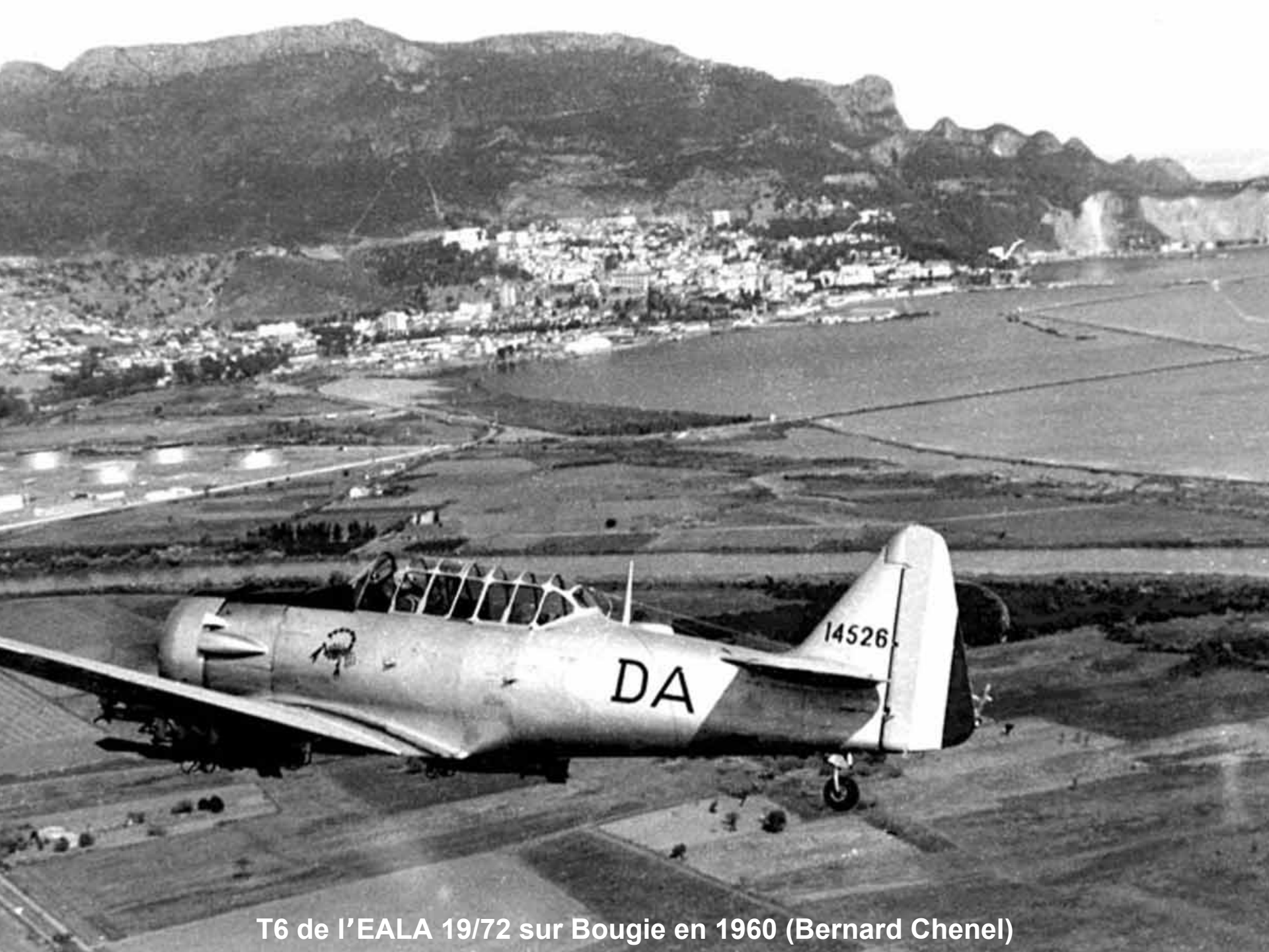
T6 de l'EALA 19/72 sur Bougie en 1960 (Bernard Chenel)