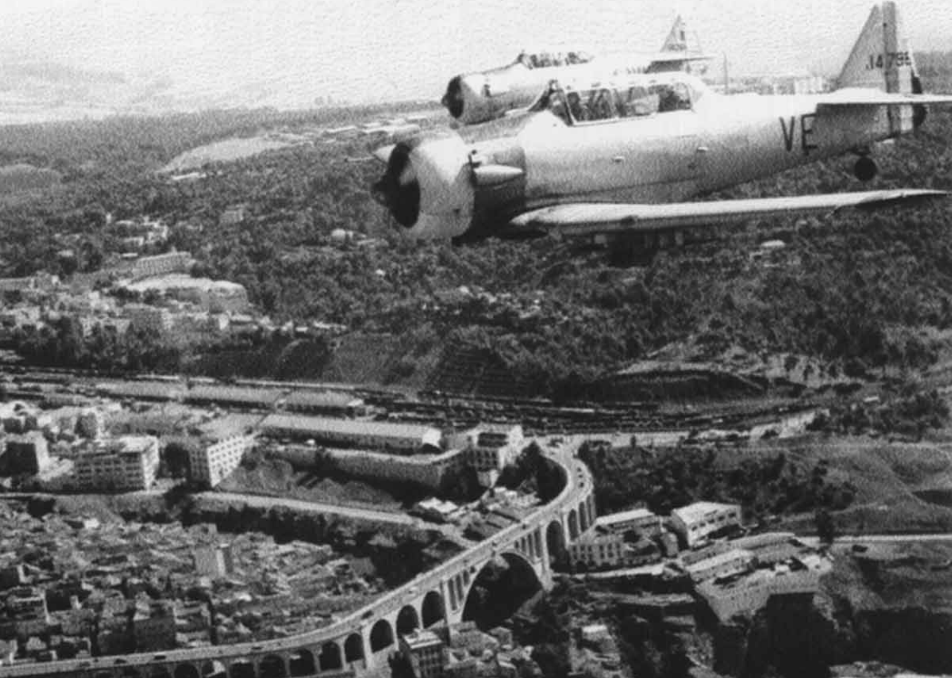
T-6 de l'EALA 18/72 sur Constantine en 1959 (Norbert Thomas)