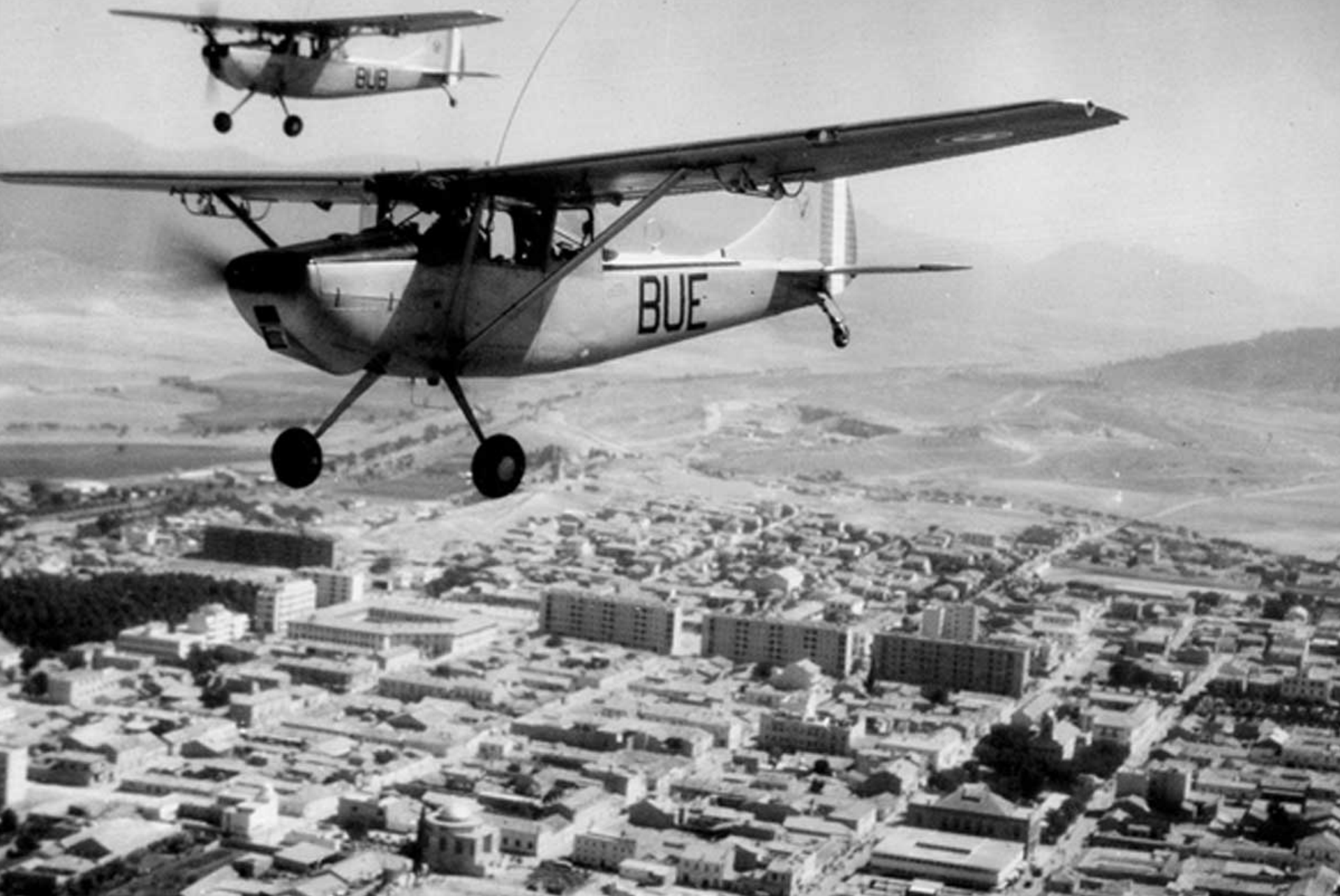
Cessna L-19 du PMAH 21ème DI sur Batna en 1960 (Louis Chupin)