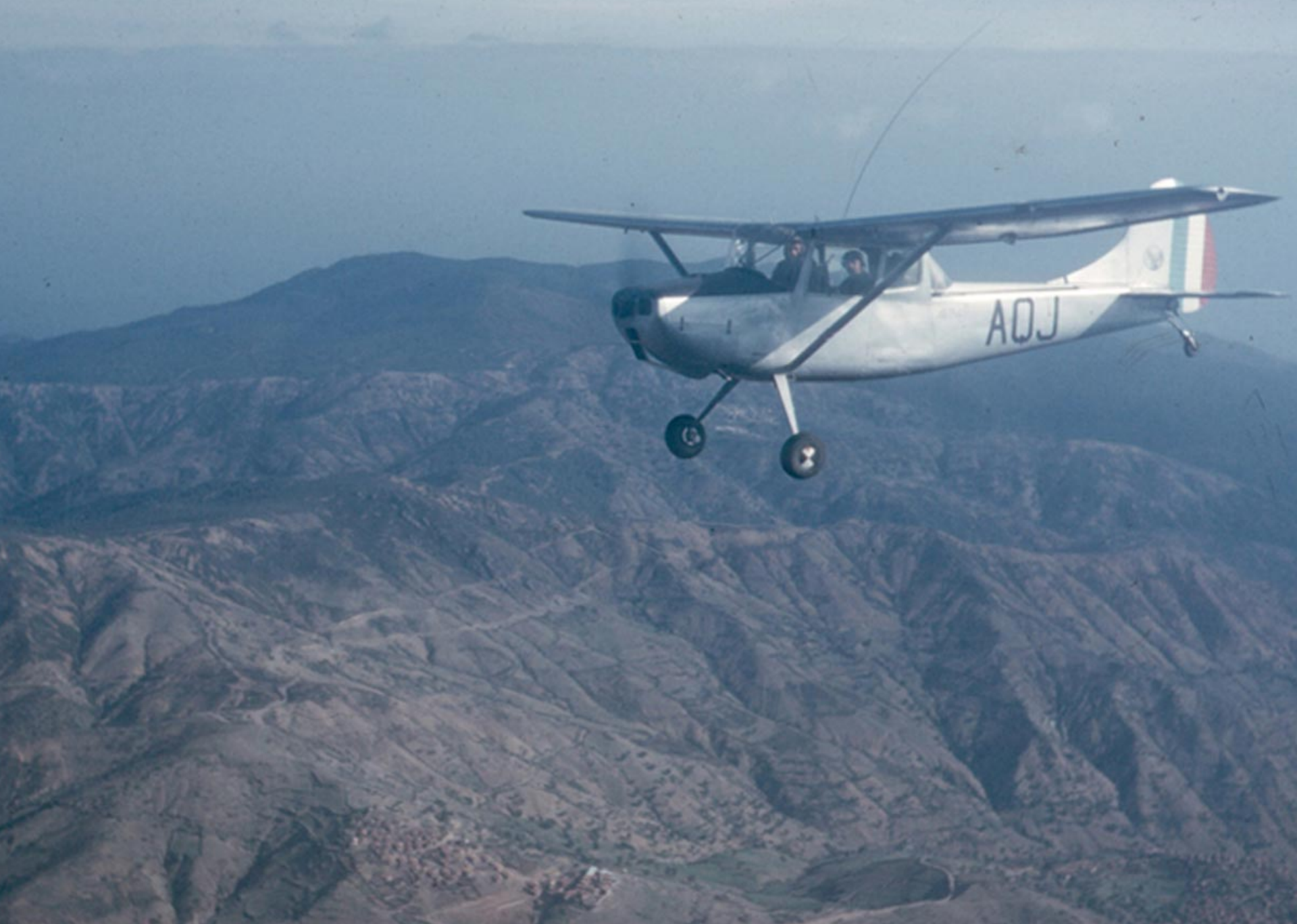
Cessna L-19 du GALAT 3 sur la Kabylie en 1960 (Michel Pignède)