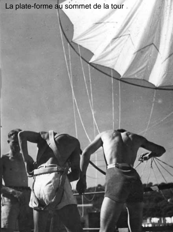
La plate-forme au sommet de la tour