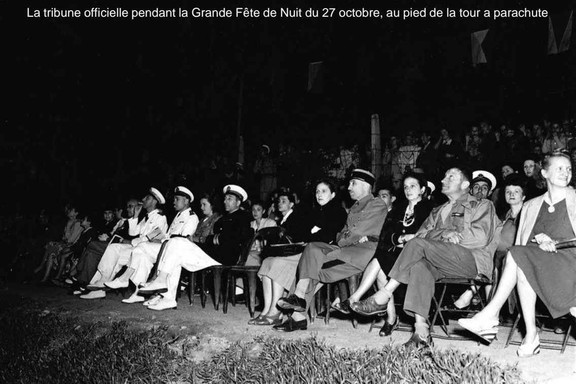
La tribune officielle pendant la Grande Fête de Nuit du 27 octobre, au pied de la tour a parachute