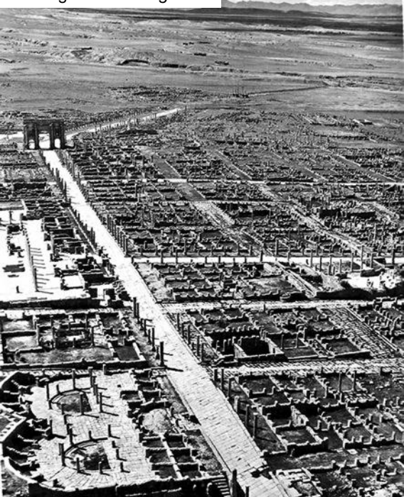
Timgad – Thamugadi