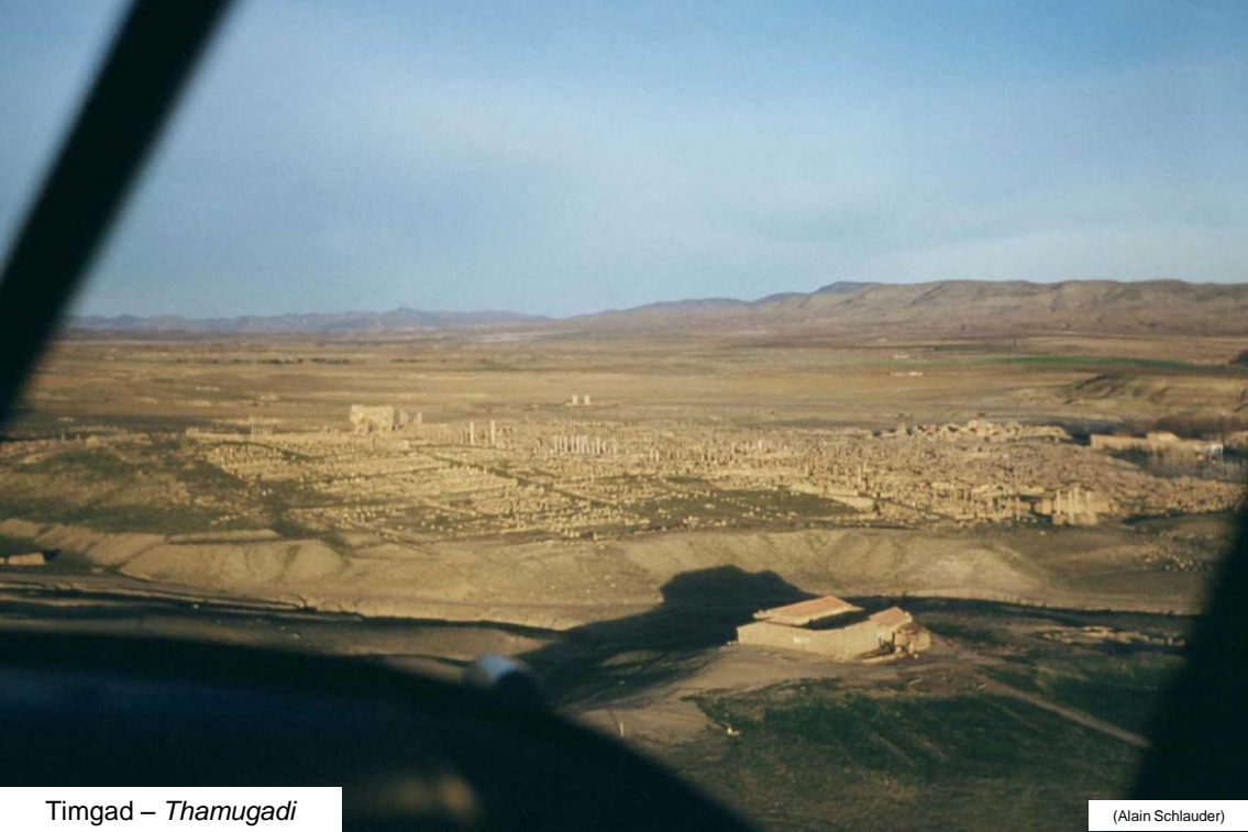
Timgad – Thamugadi