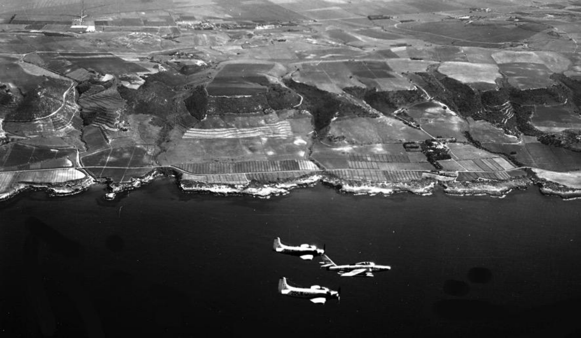
1961 – Bône – Republic RF-84F Thunderflash de l'Escadron de reconnaissance 3/33 Moselle , encadré par des Skyraider de l'Escadron de chasse 1/20 Aurès-Némeutcha