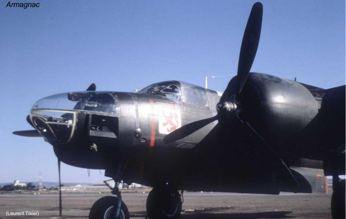
1961 – T elergma – Douglas RB-26 – Escadron de reconnaissance photographique ERP 1/32 Armagnac