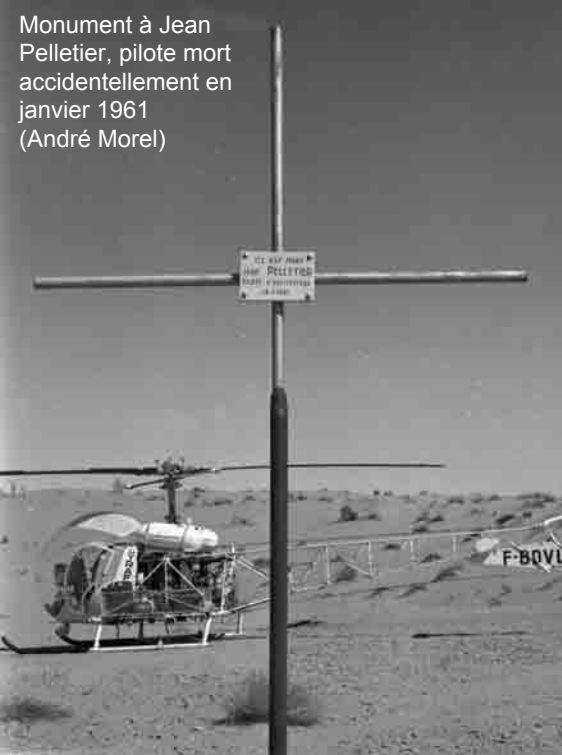
Monument à Jean Pelletier, pilote mort accidentellement en janvier 1961 (André Morel)