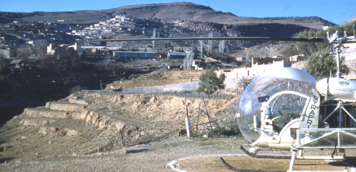
En 1959, Bell 47 G2 à Michelet (André Morel)