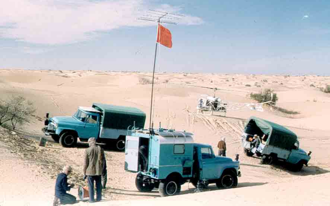
Bell 47 G2 à côté d'un laboratoire itinérant d'enregistrement de tirs sismiques (André Morel)