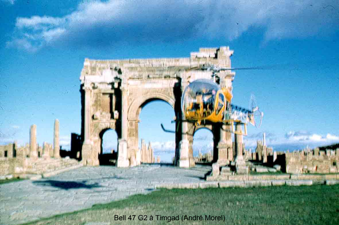
Bell 47 G2 à Timgad (André Morel)