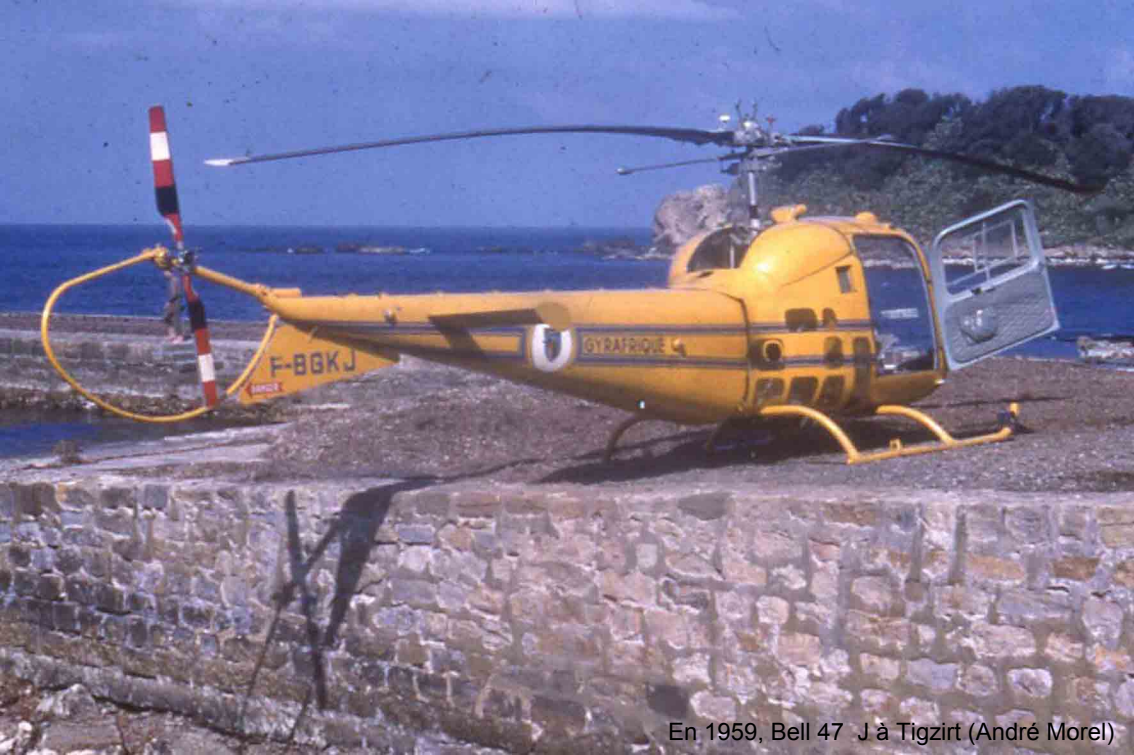
En 1959, Bell 47 J à Tizirt (André Morel)