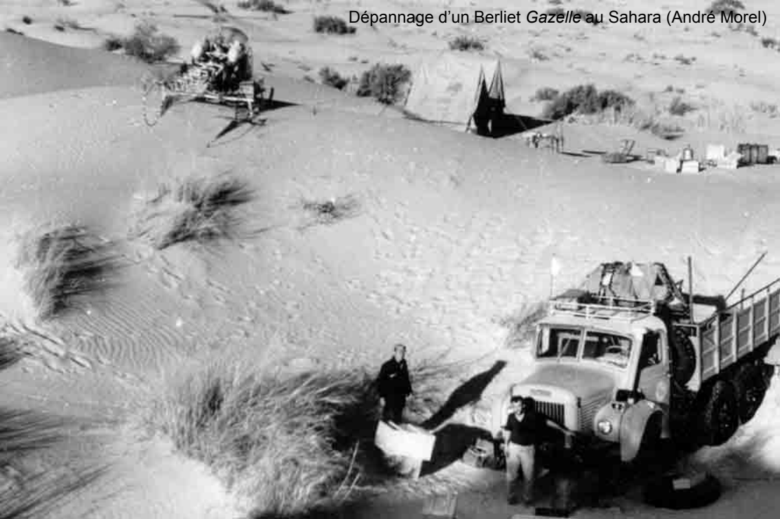
Dépannage d'un Berliet Gazelle au Sahara (André Morel)