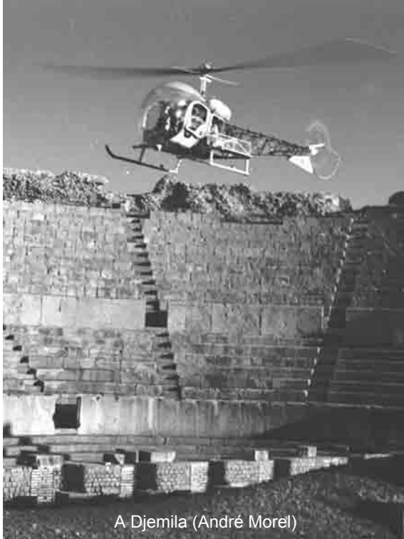
A Djemila (André Morel)