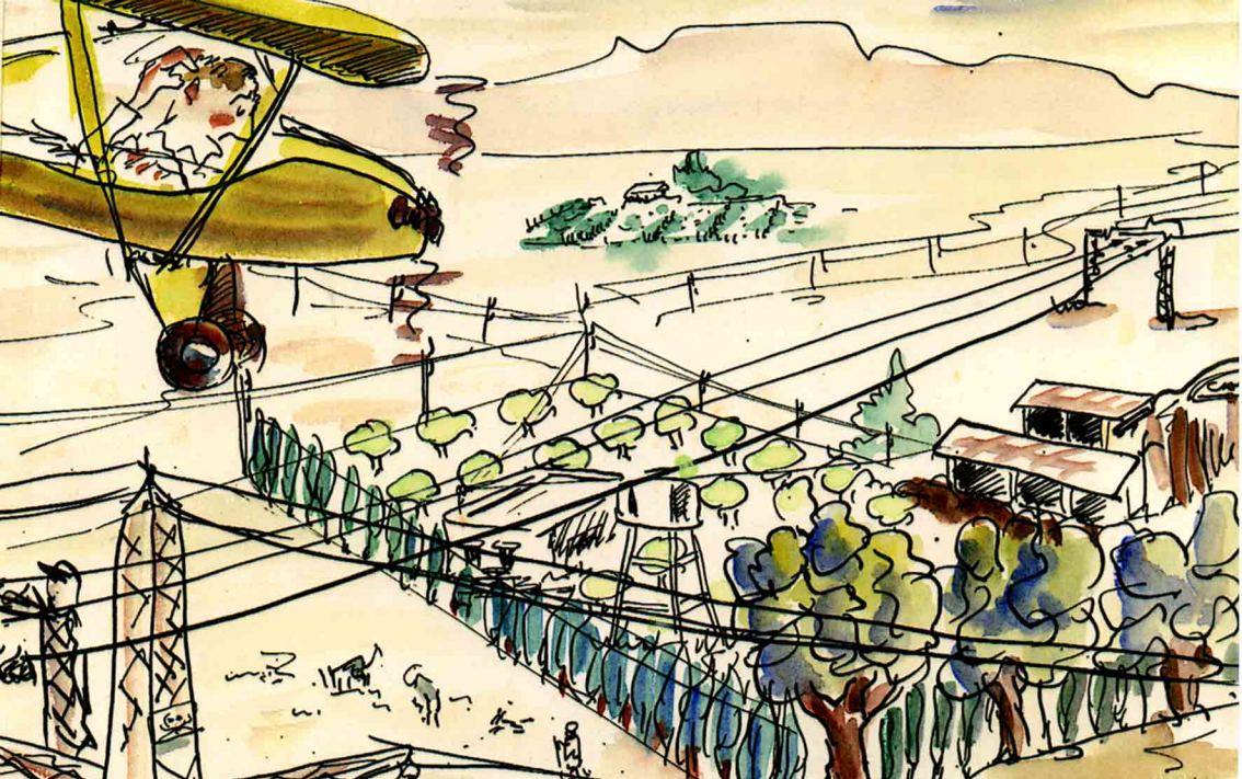
Le travail aérien agricole vu par Henri Gantès, pilote de la TAM