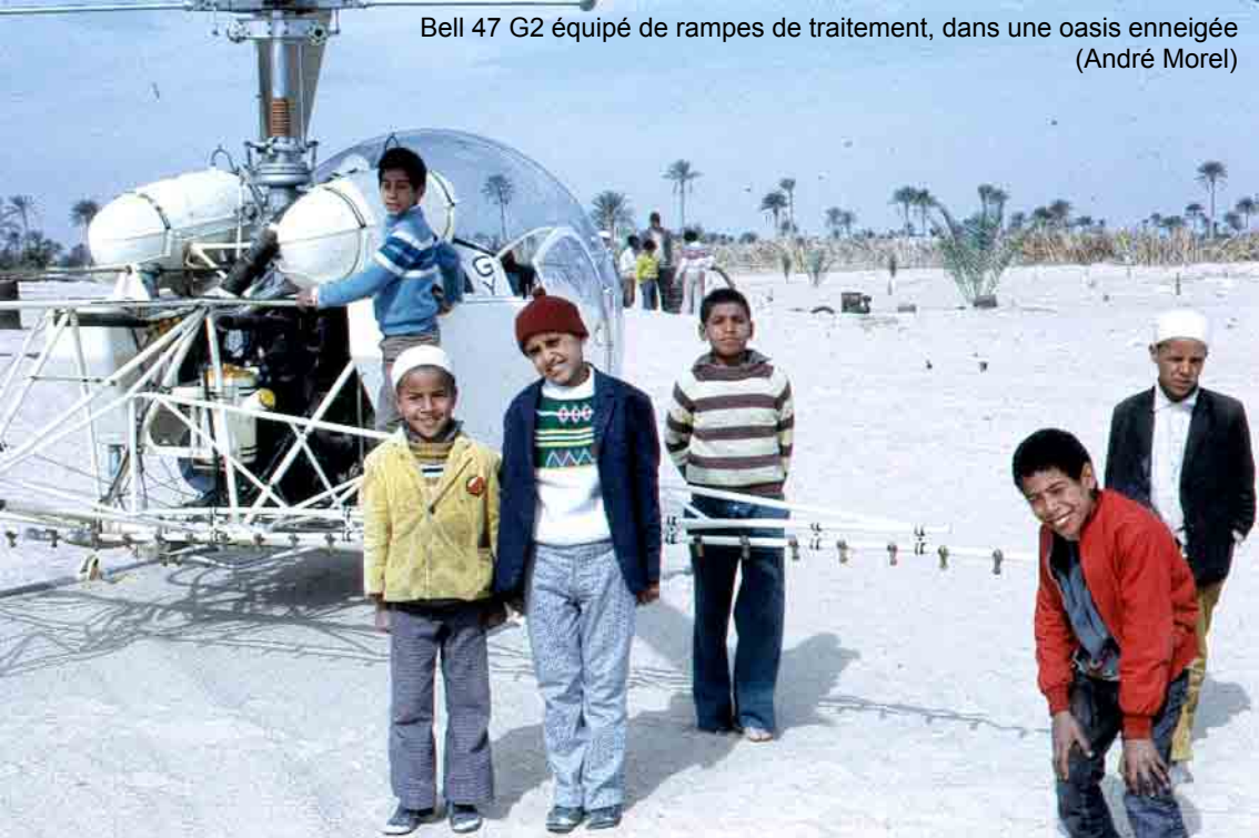
Bell 47 G2 équipé de rampes de traitement, dans une oasis enneigée (André Morel)