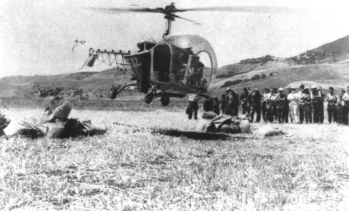
En 1949, démonstration à L'Arba par un Bell 47 D de Montpellier Méditerranée, sous l'égide de la SALTA