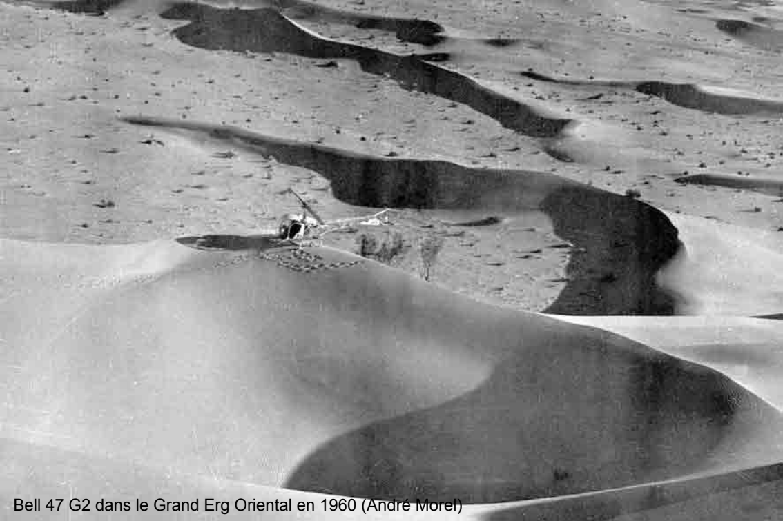
Bell 47 G2 dans le Grand Erg Oriental en 1960 (André Morel)