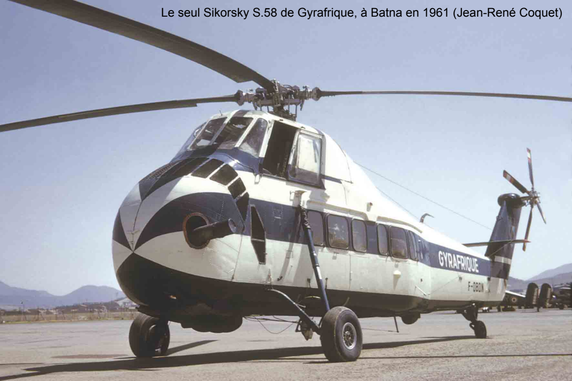
Le seul Sikorsky S.58 de Gyrafrique, à Batna en 1961