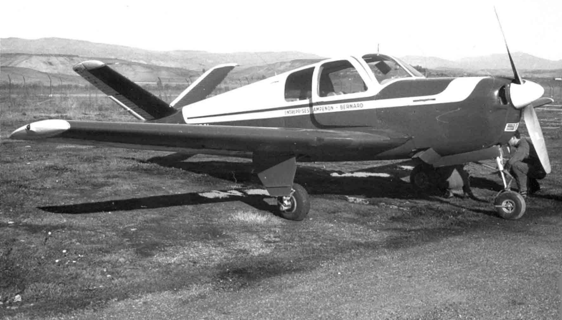
A Tizi-Ouzou en 1961, le Beechcraft Bonanza de la Société Campenon-Bernard (Gérard Wittemer)