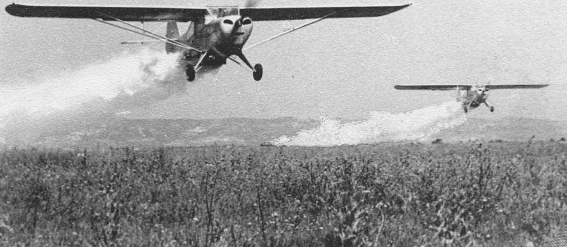
Auster de la SNATA dans la région de Bône, sur du coton (Roland Richer de Forges)