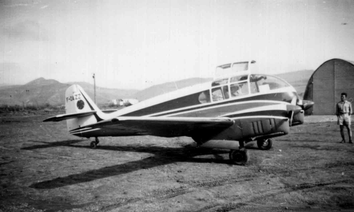
A Souk-Ahras en 1957, le Super Aero 45 de la Compagnie des phosphates du Kouif (André Courant)