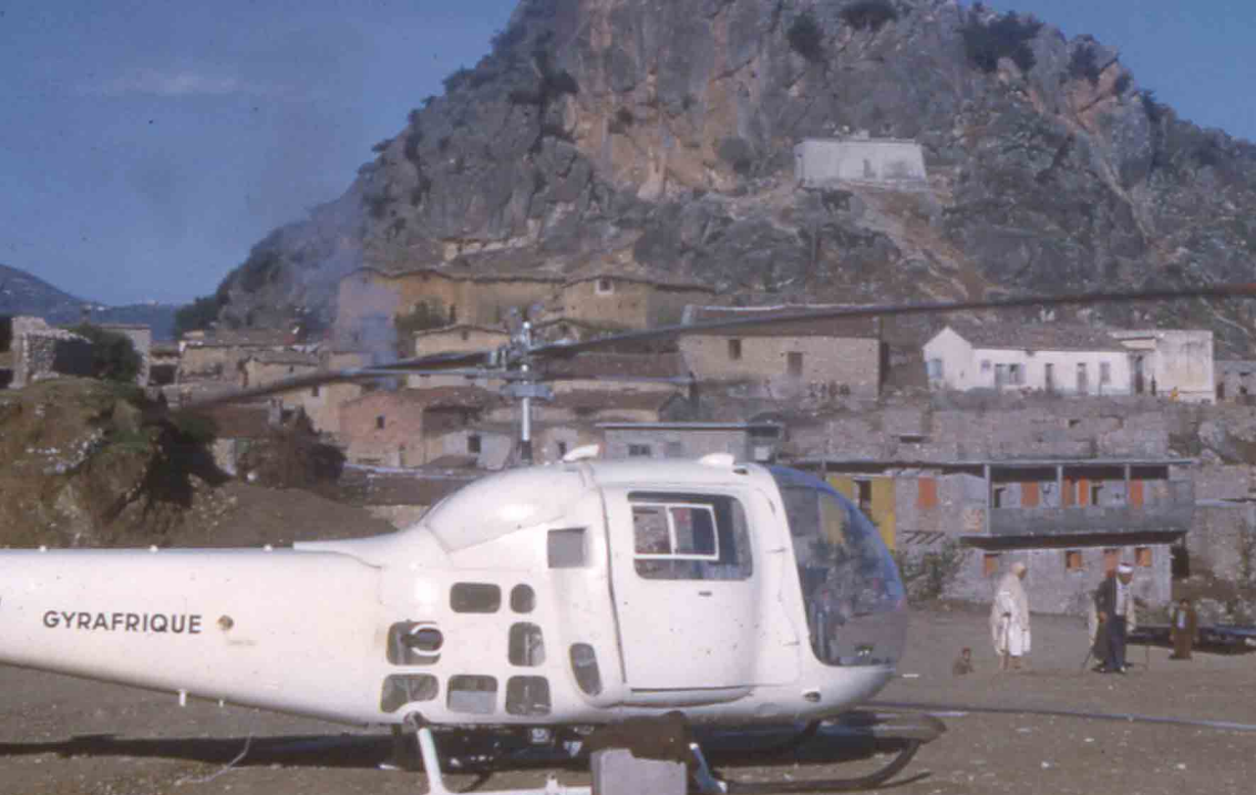
En 1959, Bell 47 J à Aougini-Gegrane, en Kabylie (André Morel)