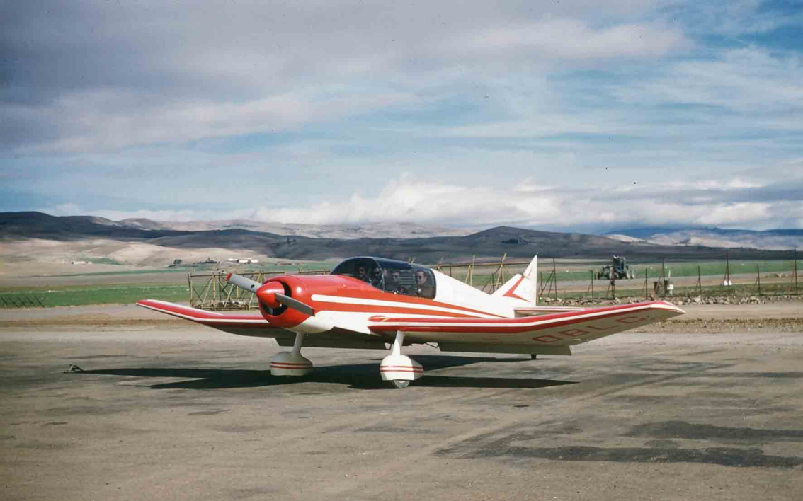
Le Jodel Mousquetaire de la Sté Marchand et Botella à Orléansville en 1959