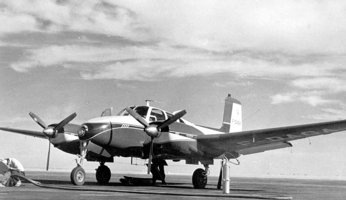
A Adrar en 1961, le Beechcraft Twin-Bonanza de la Société Norafor en route pour Edjelé (Jean Delacroix)