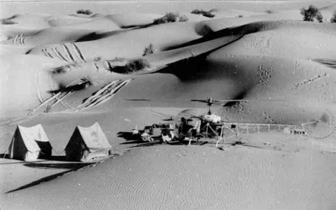
Ravitaillement d'une équipe de pétroliers topographes (André Morel)