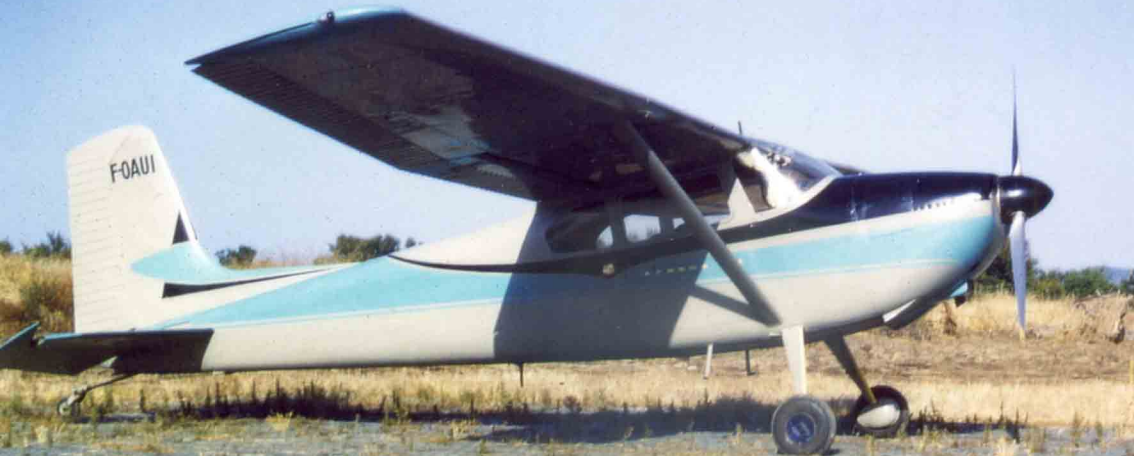
Le Cessna 180 Skywagon de la Société des Lièges des Hamendas à Djidjelli, vu à El-Milia en mai 1960